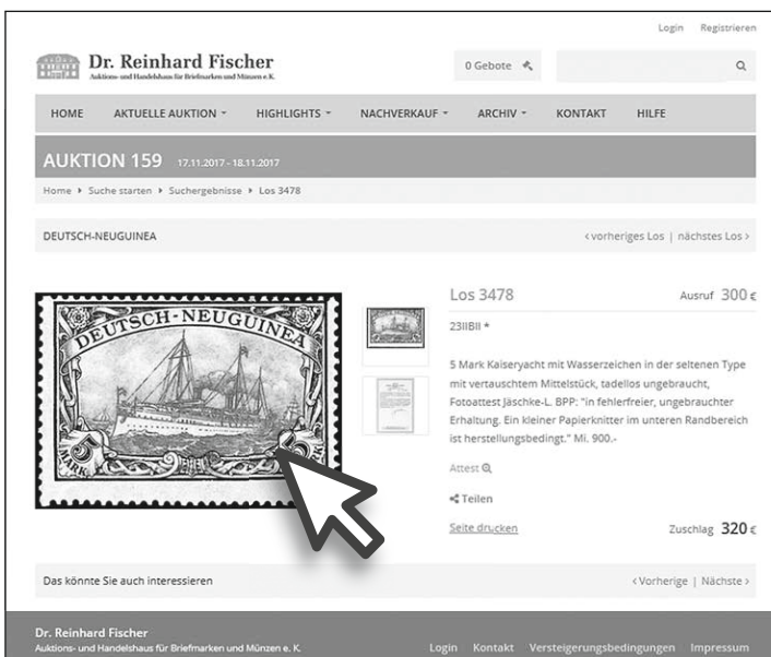
Detailansicht eines Loses