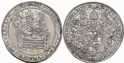
5226 1/2 Taler, 1614, Johann Schweickhardt von Kronberg, auf die Einweihung des Aschaffener Schlosses. Slg. Walther 227, ss-vz. Sehr selten! 3000,—