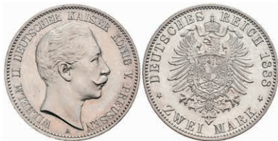
194 2 Mark, 1888, Wilhelm II., wz. Kr., vz-st. J. 100 300,—