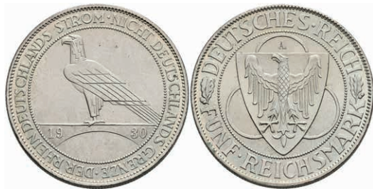
303 5 Reichsmark, 1930, A, Rheinlanddräumung, kl. Rf., vz-st. J. 346 100,—