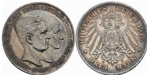
187 3 Mark, 1915, Ernst August, mit Lüneburg, kl. Rf., schöne Patina, vz. J. 57 100,—