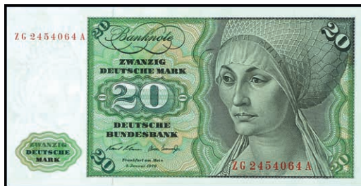
940 20 Deutsche Mark, 2.1.1970, Austauschnote zu Serie ZG/A, Ro. 271c.. Erh. I. (Abbildung auf 50% verkleinert) 300,—