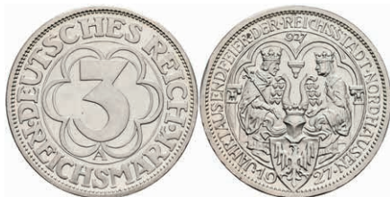
273 3 Reichsmark, 1927, Nordhausen, kl. Kratzer, PP. J. 327 130,—