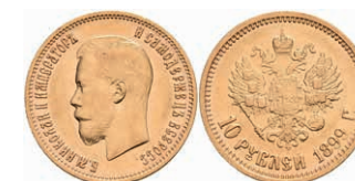
522 10 Rubel, Gold, 1899, Nikolaus II., Fb. 179, kl. Rf., ss. 450,—