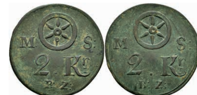
5475 Brückenzollmarke zu 2 Kreuzer, Kupfer, o.J. (18./19. Jh.). Av: Rad zwischen "M - S", darunter 2. Kr. / B.Z.". Rev: Gleich Avers. Slg. Walther 783, ss. 100,—