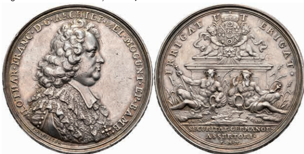
5420 Lothar Franz von Schönborn, Silbermedaille (Dm. ca. 44,70mm, ca. 32,62g), o.J. (1697), von P. H. Müller, auf den Frieden von Ryswick. Av: Brustbild nach rechts, darum Umschrift. Av: Ein von Putti gehaltener Wappenschild auf Podest, darunter die beiden Flussgötter Rhein und Main. Forster 853, Slg. P. A. -, Slg. Walther -, kl. Rf., ss. (Abbildung auf 93% verkleinert) 700,—