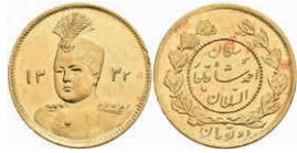
423 Toman, Gold, 1914 (AH 1332), Ahmad, Fb. 84, kl. Kr. und Rf., rote Flecken, vz. 100,—