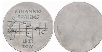
356 5 Mark, 1972, Johannes Brahms, einseitiger Aluminiumabschlag der Vorderseite, st. Auflage nur 300 Stück. J. 1540A. 50,—