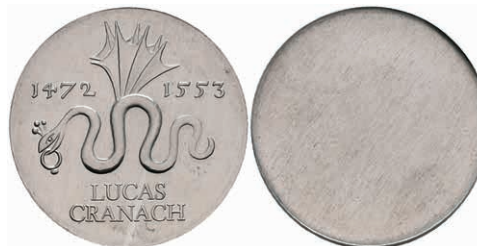
355 20 Mark, 1972, Lucas Cranach, einseitiger Aluminiumabschlag der Vorderseite, wz. Kr., f. st. Auflage nur 300 Stück. J. 1538A. 50,—