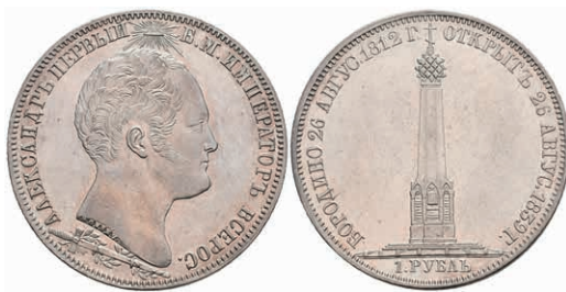
504 Rubel, 1839, Nikolaus I., St. Petersburg, Borodino Denkmal, Bitkin 895 (R), leicht berieben, vz. 800,—