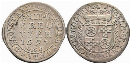
5306 12 Kreuzer, 1693, Anselm Franz von Ingelheim, Slg. Walther 430, ss. 50,—