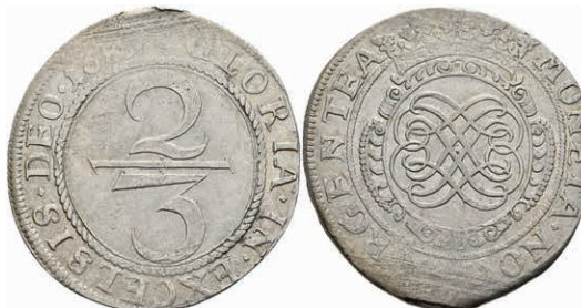
5286 2/3 Taler, 1689, geprägt unter französischer Belagerung, Dav. 659, Slg. Walther 738, Zainende, f. vz. Sehr selten! 800,—