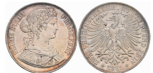
159 Doppeltaler, 1861, AKS 4, J. 43, wz. Rf., kl. Kr., vz. 120,—