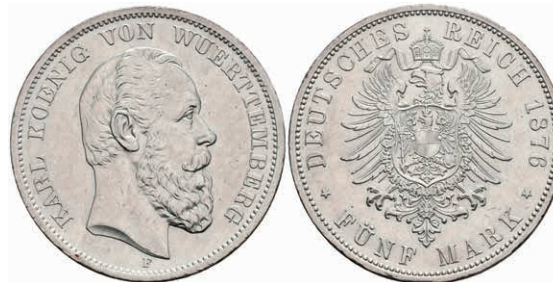
213 5 Mark, 1876, Karl, wz. Rf., vz. J. 173 250,—