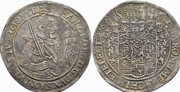
113 Taler, 1623, Johann Georg I., Dav. 7601, Kahnt 156, Schnee 818, kl. Rf., ss. (Abbildung auf 96% verkleinert) 150,—