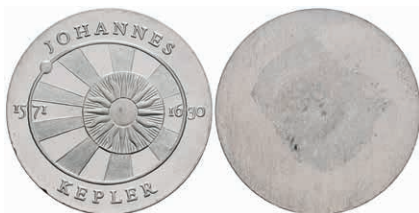
354 5 Mark, 1971, Johannes Kepler, einseitiger Aluminiumabschlag der Vorderseite, kl. Rf., f. st. Auflage nur 450 Stück. J. 1534A. 50,—