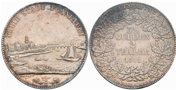
150 Doppeltaler, 1841, AKS 2, J. 23, kl. Kr., Hsp., ss. 100,—