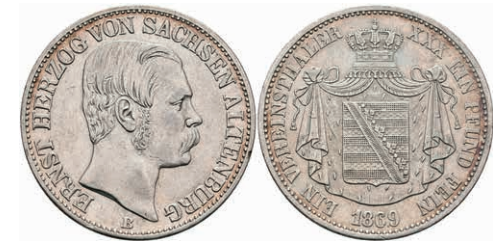
170 Taler, 1864, Ernst I., AKS 61, J. 113, kl. Rf., ss. 50,—