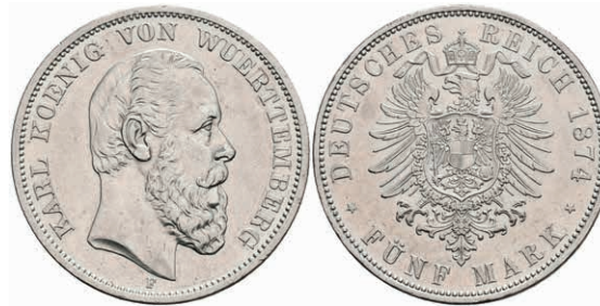
212 5 Mark, 1876, Karl, wz. Rf., vz. J. 173 500,—