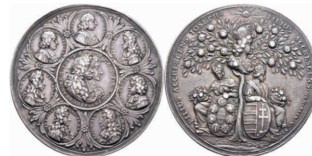
5416 Silbermedaille (Dm. ca. 48,25mm, ca. 34,32g), 1690, von P. H. Müller, auf die Krönung Josephs I. in Augsburg. Av: Büste Josephs und seines Sohnes im Medaillon nach rechts, darum 7 weitere Medaillons mit Büsten. Rev: Thronende Germania und Hungaria unter einem Baum mit Büste Joseph I.. Slg. Mont. 1210, Forster 828, ss. (Abbildung auf 87% verkleinert) 600,—