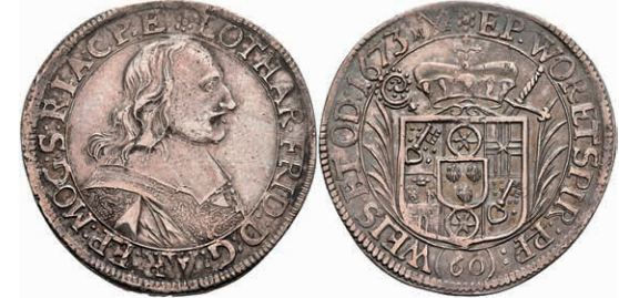
5255 Gulden (60 Kreuzer), 1673, Lothar Friedrich von Metternich-Burscheid, Dav. 649, Slg. Walther 342, ss-vz. 200,—