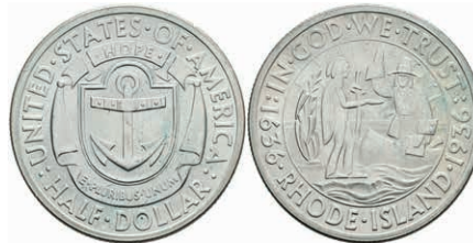
608 1/2 Dollar, 1936, Rhode Island, KM 185, minimaler Grünspan, vz. 50,—