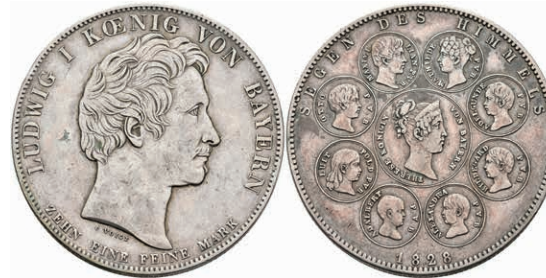
143 Geschichtstaler, 1828, Ludwig I., Segen des Himmels, AKS 121, J. 37, kl. Rf., ss. 100,—