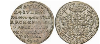
5329 Groschen, 1732, Franz Ludwig von Pfalz-Neuburg, auf seinen Tod, Slg. Walther 497, vz. Sehr selten! 200,—