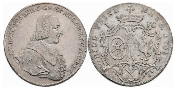
5354 Taler, 1768, Emmerich Joseph von Breitbach-Bürresheim, Dav. 2426, ss+. 180,—