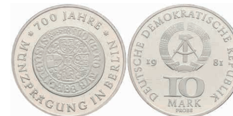
362 10 Mark, 1981, 700 Jahre Münzprägung in Berlin, Probe, in Kapsel verplombt, PP. J. 1582P1. 300,—