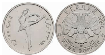
546 5 Rubel, Palladium, 1993, Russisches Ballett, Parchimowicz 1301a, wz. Flecken, st. 450,—