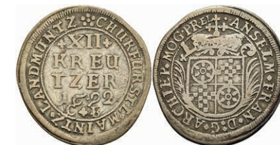
5303 12 Kreuzer, 1692, Anselm Franz von Ingelheim, Slg. Walther 428, ss. 80,—