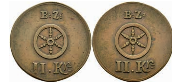
5473 Brückenzollmarke zu 2 Kreuzer, Kupfer, o.J. (18./19. Jh.). Av: Rad darüber "B.Z.", darunter II. Kr. Rev: Gleich Avers. Slg. Walther 805, ss. 30,—