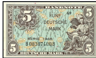
931 5 Deutsche Mark 1948, Kenn.-Bst. B/ Serie B, Ro. 236a, Erh. I. (Abbildung auf 50% verkleinert) 350,—