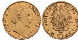
229 10 Mark, 1877, Ludwig II., ss-vz. J. 196 200,—