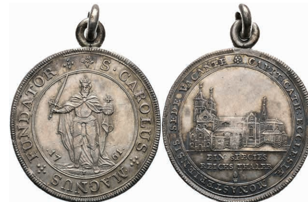
96 Taler, 1761, Sedisvakanz, Schulze 251, Dav. 2470, gehenkelt, ss-vz. 450,—