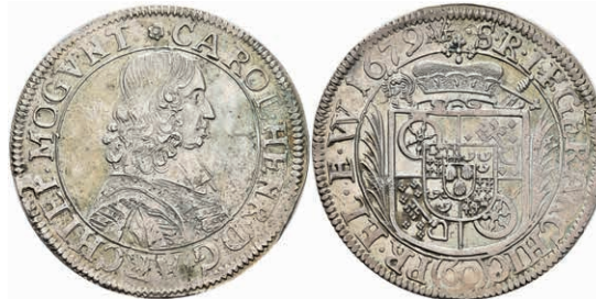
5273 Gulden (60 Kreuzer), 1679, Karl Heinrich von Metternich-Winneburg, Dav. 656, Slg. Walther 386, Prägeschwäche, vz. Sehr selten! 3500,—