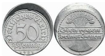
262 50 Pfennig, 1921, A, dezentriert, vz. J. 305 30,—