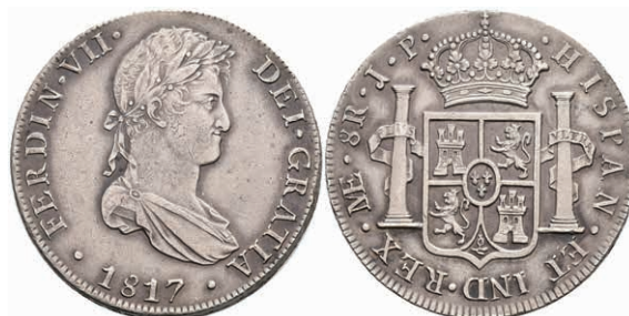
457 8 Reales, 1817, Ferdinand VII., Lima, JP, KM 117.1, ss+ 130,—