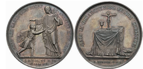
647 Silbermedaille (Dm. ca. 36,50mm, ca. 13,87g), o.J., von Heldt und Loos, Av: Christus segnet Kind, darum Umschrift. Rev: Altar, darum Umschrift. Schöne Patina, vz. 50,—