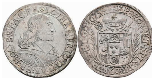
5263 Gulden (60 Kreuzer), 1675, Lothar Friedrich von Metternich-Burscheid, Dav. 648, Slg. Walther 349, ss. 150,—