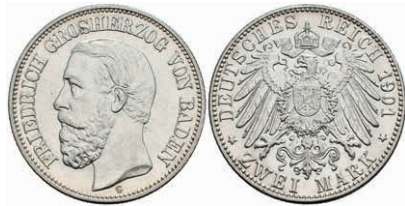
173 2 Mark, 1901, Friedrich I., vz-st. J. 28 500,—