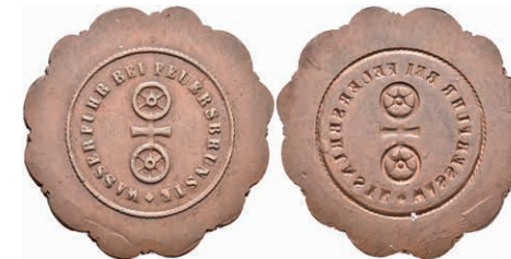
5503 Einseitige Kupfermarke, o.J. Av: Doppelrad, darum Umschrift. Slg. Walther -, ss. 50,—