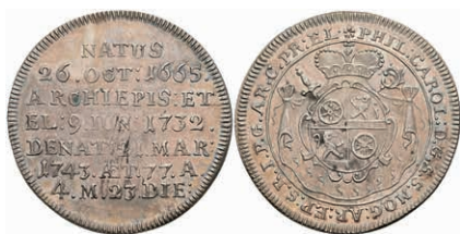
5332 1/4 Taler, 1743, Philipp Karl von Eltz-Kempenich, auf seinen Tod, Slg. Walther 505, f. st. Sehr selten! 500,—