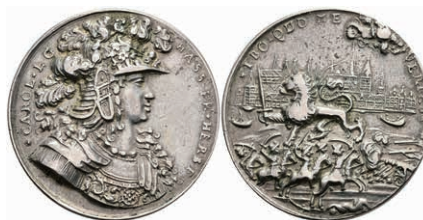
5405 Hessen-Kassel, Karl, Silbermedaille (Dm. ca. 30,20mm, ca. 10,39g), o.J. (1689), von J. Smelzing, auf die Einnahme von Mainz. Av: Brustbild nach rechts, darum Umschrift. Rev: Von der Hand Gottes geführter hessischer Löwe nach links, im Hintergrund die Stadt Mainz, im Vordergrund vier Reiter und eine Kanone, darum Umschrift. Schütz 1509, Müller 2426a, ss. 300,—