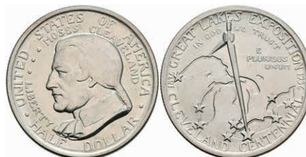
606 1/2 Dollar, 1936, Cleveland, KM 177, minimaler Grünspan, vz. 50,—