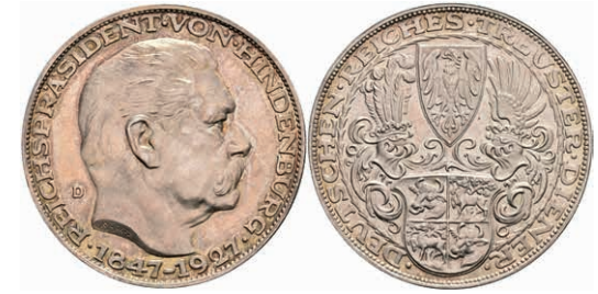
725 Silbermedaille (Dm. ca. 36,0mm, ca. 24,64g), 1927, von Karl Goetz, auf den 80. Geburtstag Hindenburgs. Av: Kopf Hindenburgs nach rechts, darum Umschrift. Rev: Wappen. Kienast 386. Rand punziert, wz. Kr., f. st. 30,—