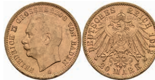
228 20 Mark, 1912, Friedrich II., kleine Randfehler, ss-vz. J. 192 300,—