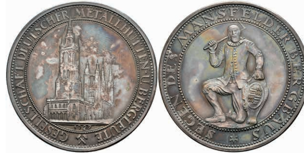
724 Mansfeld, Silbermedaille (Dm. ca. 42,6mm, ca. 29,65g), 1927, von F. Hörnlein, Gesellschaft Deutscher Metallhütten und Bergleute. Av: "Kamerad Martin" (Symbolfigur des Mansfelder Bergbaus) mit Keilhau und Wappenschild. Rev: Außenansicht des Roten Turms und der Marktkirche in Halle. St. 150,—