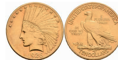
601 10 Dollars, Gold, 1926, Philadelphia, Indian Head, Fb. 165, ss-vz. 700,—