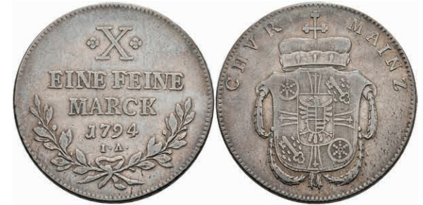
5376 Taler, 1794, Friedrich Karl Joseph von Erthal, Dav. 2432, Slg. Walther 650, ss. 120,—