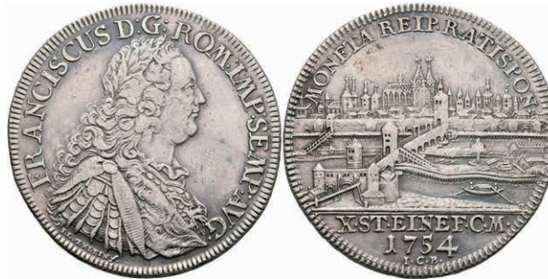
104 Taler, 1754, mit Titel Franz I., sign. Oexlein, Beckenbauer 7101, Dav. 2618B, berieben, ss. 150,—