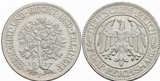
277 5 Reichsmark, 1927, F, Eichbaum, vz+. J. 331 160,—