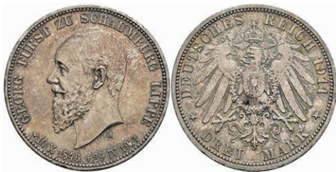
210 3 Mark, 1911, Georg, auf seinen Tod, schöne Patina, f. st. J. 166 150,—