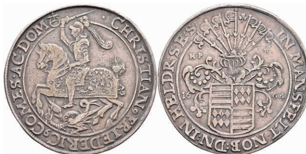
94 Taler, 1664, Christian Friedrich, Eisleben, Tornau 1424 e, ss. (Abbildung auf 92% verkleinert) 250,—