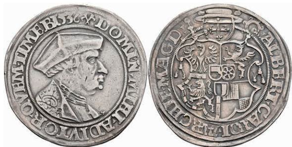
5138 Taler, 1536, Albrecht IV. von Brandenburg, Dav. 9432, ss. 1800,—