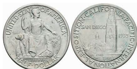
605 1/2 Dollar, 1935, S, California-Expo, KM 171, leichter Grünspan, vz. 50,—