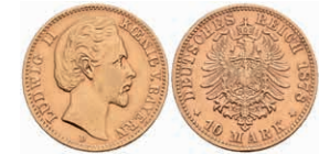
230 10 Mark, 1878, Ludwig II., ss. J. 196 180,—