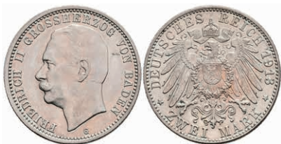
183 2 Mark, 1913, Friedrich II., minimal berieben, f. vz. J. 38 100,—