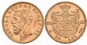
478 20 Lei, Gold, 1890, Karl I., Fb. 3, vz. (Abbildungen siehe Onlinekatalog) 350,—