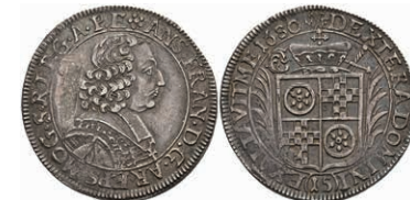
5276 1/4 Taler, 1680, Anselm Franz von Ingelheim, Slg. Walther 402, Schrötlingsfehler/Druckstelle, ss. Selten! 200,—