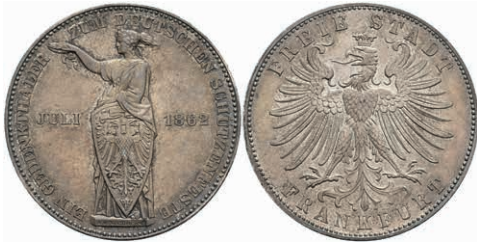
160 Taler, 1862, Schützenfest, AKS 44, J. 51, vz. 80,—