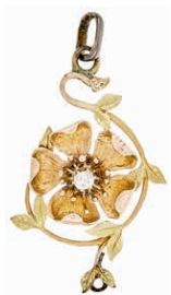
1257 Blumenanhänger mit kl. Brillant ca. 0,07ct, 585 Gelb- und Roségold gestempelt zus. E. K, 31,4x 20mm, ca. 3,1g. 120,—