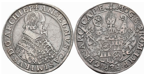
5240 Taler, o.J., Anselm Casimir von Umstadt, Dav. 5548, Grafitto, ss. (Abbildung auf 97% verkleinert) 300,—