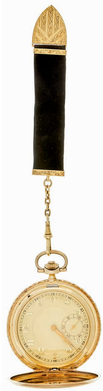
1307 Monopol Art déco Savonette Taschenuhr. Anfang 20. Jahrhundert, Gehäuse in 585 Gelbgold, 84,77 Gramm, ca. 52,7mm Durchmesser. Handaufzug, kleine Sekunde, goldenes 24h Ziffernblatt, Deckel punziert inklusive Meisterstempel, Staubdeckel aus Metall. Anhänger aus schwarzem Velours-Leder mit Gold-Applikationen. Außergewöhnlich guter Zustand, funktionstüchtig. (Abbildung auf 76% verkleinert) 1750,—