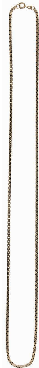
1268 Große Venezianerhalskette. 20. Jh. 333er GG, gestempelt. L. ca. 78,0 cm. Ca. 39,74 gr (Abbildung auf 86% verkleinert) 600,—