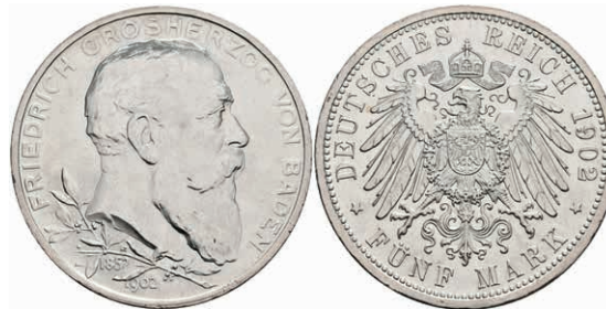
176 5 Mark, 1902, Friedrich I., zum Regierungsjubiläum, kl.Rf., vz-st. J. 31 130,—