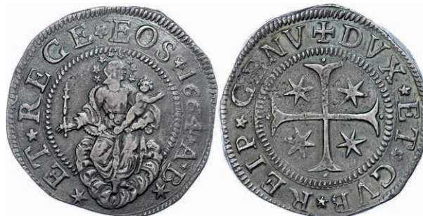
431 Genua, Scudo, 1664, Dav. 3901, ss-vz. 700,—