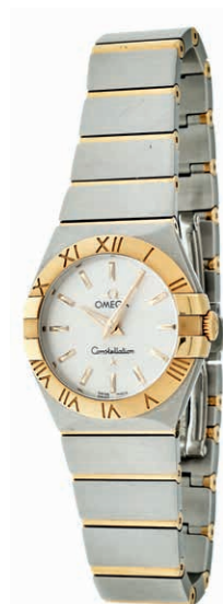
1338 Omega Constellation Damen Armbanduhr. Ca. 28mm, Edelstahl, entspiegeltes Saphirglas, Quarz, Ref.-Nr.: 91304922. Silbernes Zifferblatt, Zeiger fluoreszierend. Sehr guter Zustand. Original Omega Armband, versilberter Stahl mit Omega Faltschließe. Armband erweiterbar, ein weiteres Element enthalten. 1500,—