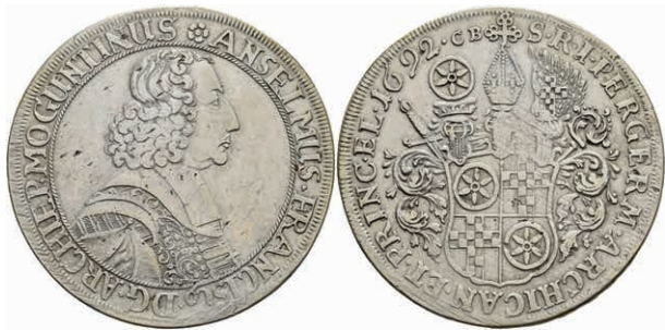
5305 Taler, 1692, Anselm Franz von Ingelheim, Dav. 5571, Slg. Walther 427, kl. Schrötlingsfehler, justiert, ss. Selten! (Abbildung auf 94% verkleinert) 800,—