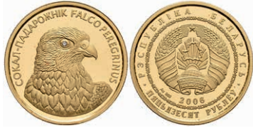
616 50 Rubel, Gold, 2006, Wanderfalke, Parchimowicz 508, PP. 300,—