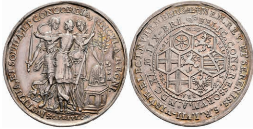
5400 Nürnberg, Silbermedaille (Dm. ca. 36mm, ca. 16,91g), 1611, von C. Maler, auf den Kurfürstentag in Nürnberg. Av: Stehende Concordia, Justitia und Prudentia im Kreis, darum Umschrift. Rev: 7 Wappen, darum Umschrift. Slg. Erlanger 1003, Slg. P. A. 332, ss. 130,—