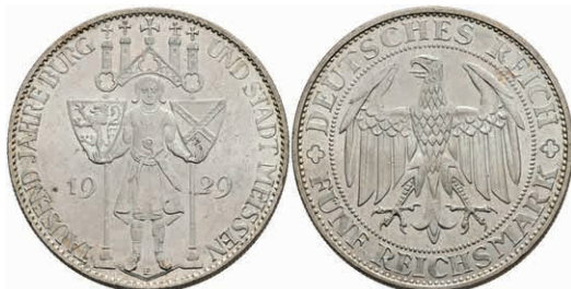
289 5 Reichsmark, 1929, Meißen, wz. Kratzer, kl. Rf., vz-st. J. 339 200,—