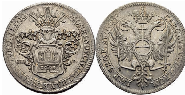
83 Taler, 1730, mit Titel Karl VI., auf die 200-Jahrfeier der Augsburger Konfession, Dav. 2282, Gaedeckens 524, J. 52, leicht berieben, ss. (Abbildung auf 93% verkleinert) 200,—