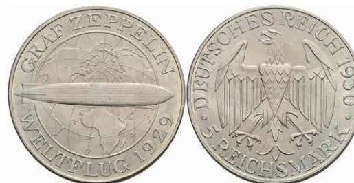
299 5 Reichsmark, 1930, F, Zeppelin, f. st. J. 343 160,—