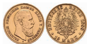
249 10 Mark, 1888, Friedrich III., Rand mit Feilspur, Kratzer im Aversfeld, ss, J. 247. 150,—