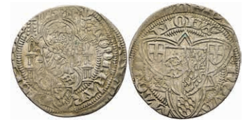
5200 Weißpfennig, o.J. (1461-1475), Adolf II. von Nassau, Slg. P. A. 184 var., ss. 50,—