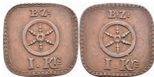
5493 Brückenzollmarke zu 1 Kreuzer, Kupfer, o.J. Av: Rad, darüber "B: Z:", darunter "I. Kr.". Rev: Gleich Avers. Slg. Walther -, ss+. 80,—