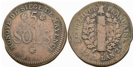
5370 5 Sols (12,88g), 1793, geprägt unter französischer Belagerung, Brause/Mansfeld Tf. 18, Nr. 10, Slg. P. A. 862, Slg. Walther 749, s-ss. 30,—