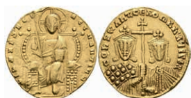
35 Constantinus VII. und Romanus I., 913-959, Solidus (4,28g), Konstantinopel. Av: Thronender Christus von vorn, darum Umschrift. Rev: Die Büsten von Constantinus VII. und Romanus II. von vorn, darum Umschrift. Sear 1750, tiefer Kratzer, ss. 350,—