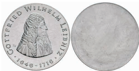
340 20 Mark, 1966, Gottfried Wilhelm Leibniz, einseitiger Aluminiumabschlag der Vorderseite, st. Auflage nur 300 Stück. J. 1518A. 50,—