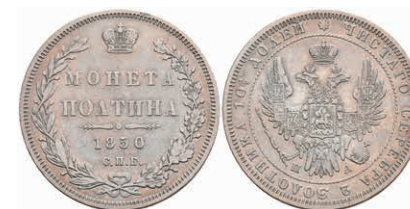
509 1/2 Rubel (Poltina), 1850, Nikolaus I., St. Petersburg, Bitkin 263, ss. 50,—