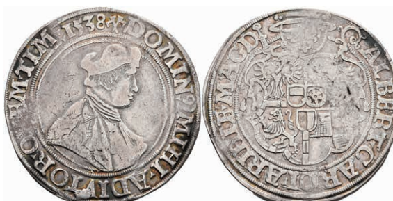
5140 Taler, 1538, Albrecht IV. von Brandenburg, Dav. 9433, kl. Schröttingsfehler, ss. 800,—