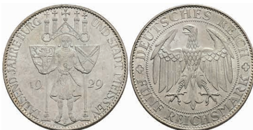
291 5 Reichsmark, 1929, Meißen, wz. Kratzer, vz. J. 339 180,—