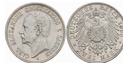
206 2 Mark, 1898, Carl Alexander, kl. Rf., vz+. J. 156 350,—