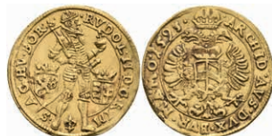
43 Dukat (3,59g), 1593, Rudolph II., Prag, Fb. 85, etwas wellig, Randfehler/Abschliff, ss. 2200,—