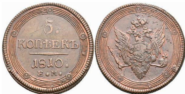
498 5 Kopeken, 1810, Alexander I., Ekaterinburg, Bitkin 300, Schrötlingsfehler, ss-vz (Abbildung auf 97% verkleinert) 80,—