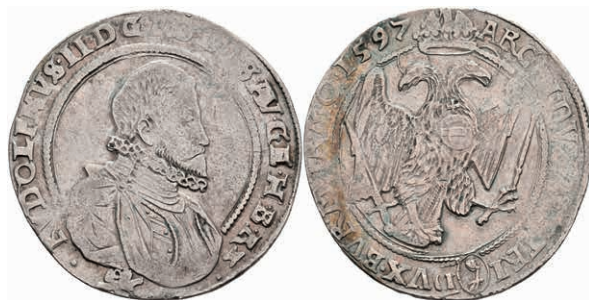
44 Taler, 1597, Rudolf II., Kuttenberg, Dav. 8079, Voglhuber 101/I, Prägeschwäche, kl. Rf., ss. 150,—