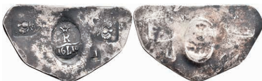
89 Notklippe zu 1 Taler (3,15g), 1610. Vier Stempel auf Silberplatte. Brause/Mansfeld -, ss. Vermutlich spätere Anfertigung! 100,—