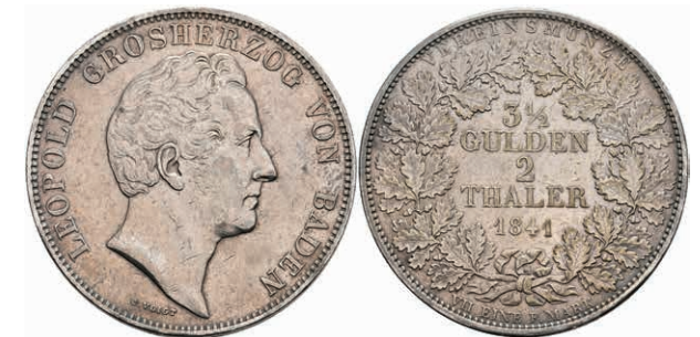
137 Doppeltaler, 1841, Carl Leopold Friedrich, AKS 88, J. 57, ss. 150,—