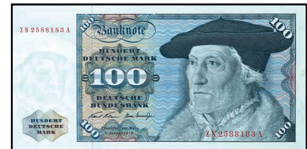
939 100 Deutsche Mark, 2.1.1970, Austauschnote zu Serie ZN/A, Ro. 273c, Erh. I (Abbildung auf 50% verkleinert) 300,—