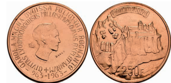
435 250 Francs, Kupfer, 1963, Charlotte, Essai, Haarlinien, st. 100,—