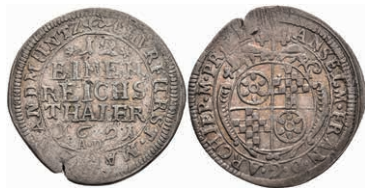
5293 1/12 Taler, 1691, Anselm Franz von Ingelheim, Slg. Walther 455, Schröttingsfehler am Rand, ss. Selten! 50,—