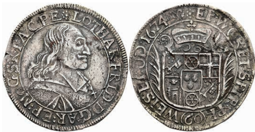
5258 Gulden (60 Kreuzer), 1674, Lothar Friedrich von Metternich-Burscheid, Dav. 648, Slg. Walther 348, kl. Schrötlingsfehler, ss. 150,—