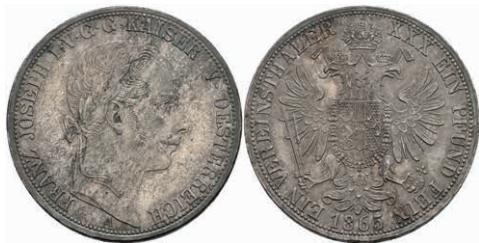
451 Taler, 1865, Franz Joseph I., Wien, Dav. 23, kl. Rf., vz. 80,—