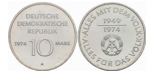
373 10 Mark, 1974, 25 Jahre DDR, Legierungsprobe Ag 500/Cu 500, st. J. 1551P. 200,—