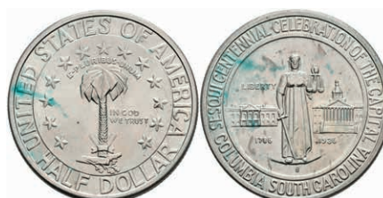
609 1/2 Dollar, 1936, S, Columbia, KM 178, etwas Grünspan, vz-st. 100,—