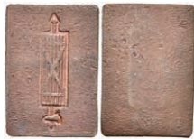
5479 Einseitig geprägte, rechteckige Kupfermarke, o.J. Av: Fascis. Slg. Walther 809, ss. 80,—