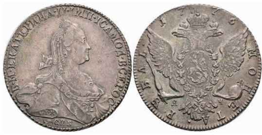
490 Rubel, 1776, Katharina II., St. Petersburg, Bitkin 211, kl. Kratzer, ss-vz. 200,—