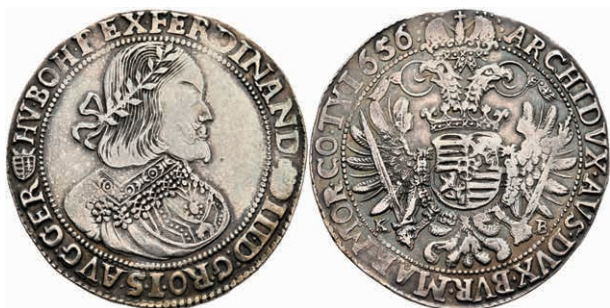
49 Taler, 1652, Ferdinand III., Kremnitz, Dav. 3198, Voglhuber 197, Herinek 484, ss. (Abbildung auf 95% verkleinert) 100,—