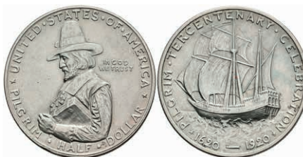
597 1/2 Dollar, 1920, Pilgrim Tercentenary, KM 147.1, vz. 50,—