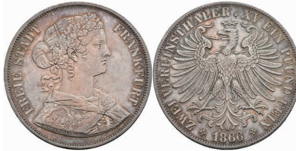
164 Doppeltaler, 1866, AKS 4, J. 43, wz. Rf., f. vz. 80,—