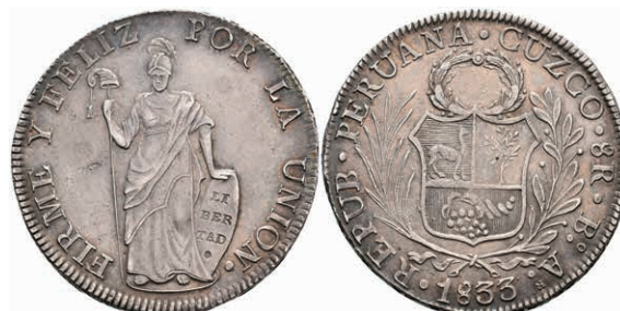
459 8 Reales, 1833, Cuzco, BoAr, KM 142.4, ss-vz. 110,—