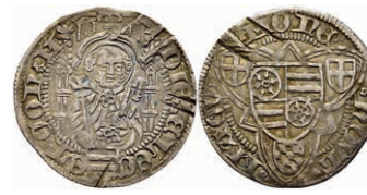
5206 Weißpfennig, o.J. (1475-1482), Dietrich II. von Isenburg, Slg. Walther -, Einhiebe, ss. 80,—