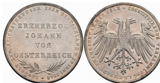
155 Doppelgulden, 1848, Erzherzog Johann von Österreich, AKS 39, J. 46, Kratzer, wz. Rf., vz-st. 70,—