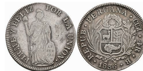
461 4 Reales, 1836, Cuzco, B, KM 151.1, kl. beriebene Stelle auf Avers, ss. 40,—