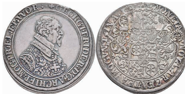
5230 Taler, 1627, Georg Friedrich von Greiffenklau, Dav. 5540, Slg. Walther 236, schöne Patina, ss-vz. Prachtexemplar! 2000,—