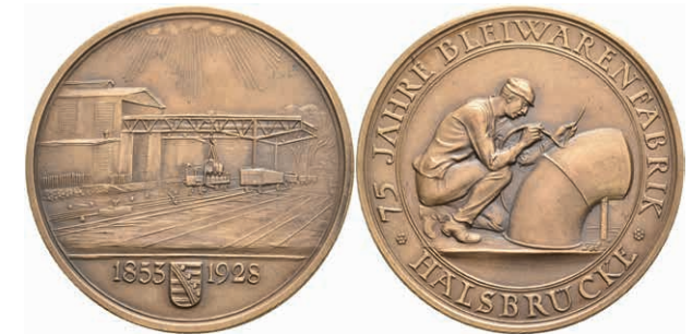
727 Sachsen, Bronzemedaille (Dm. ca. 45,20mm, ca. 34,81g), 1928, von Hörnlein, 75 Jahre Bleiwarenfabrik in Halsbrücke. Av: Kniender Arbeiter beim Schweißen, darum Umschrift. Rev: Ansicht des Fabrikgebäudes, im Abschnitt darunter Wappen zwischen Jahreszahlen. Wurzbach 222, vz-st. (Abbildung auf 92% verkleinert) 80,—