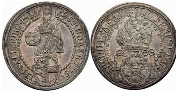
132 Taler, 1700, Johann Ernst Graf von Thurn und Hohenstein, Zöttl 2173, Probszt 1806, Dav. 3510, ss-vz. 150,—