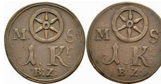
5469 Brückenzollmarke zu 1 Kreuzer, Kupfer, o.J. (18./19. Jh.). Av: Rad zwischen "M - S", darunter 1. Kr. / B.Z.". Rev: Gleich Avers. Slg. Walther 784, ss. 30,—