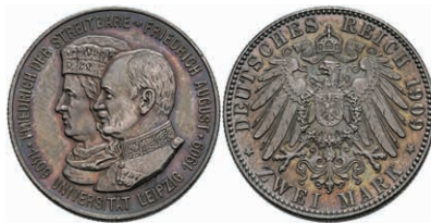
201 2 Mark, 1909, Friedrich August III., Universität Leipzig, kräftige Patina, vz-st. J. 138 60,—