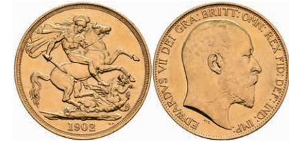
417 2 Pounds, Gold, 1902, Edward VII., London, Fb. 399, ss-vz. 600,—