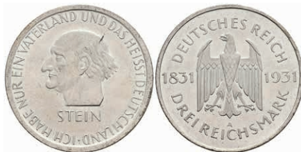
307 3 Reichsmark, 1931, Stein, f. st. J. 348 70,—