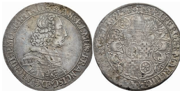
5299 Taler, 1691, Anselm Franz von Ingelheim, Dav. 5570, Slg. Walther -, Schröttingsfehler, ss. (Abbildung auf 96% verkleinert) 1500,—