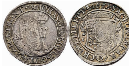
114 1/3 Taler, 1672, Johann Georg II., Kahnt 416b, Variante mit gestielter Rosette, Prägeschwäche, kl. Rf., ss. 50,—