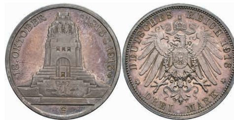
202 3 Mark, 1913, Volksheldenkmal, kl. Kratzer, schöne Patina, PP. J. 140 120,—