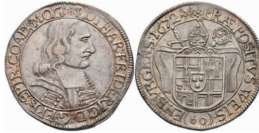
5510 Gulden (60 Kreuzer), 1672, Lothar von Metternich-Burscheid, Dav. 992, ss-vz. 300,—