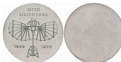
358 5 Mark, 1973, Otto Lilienthal, einseitiger Aluminiumabschlag der Vorderseite, st. Auflage nur 300 Stück. J. 1546A. 50,—