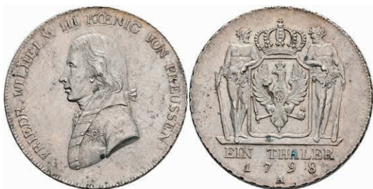
72 Taler, 1798, A, Friedrich Wilhelm III., J. 29, Dav. 2603, vz. 300,—