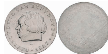
349 5 Mark, 1970, Ludwig van Beethoven, einseitiger Aluminiumabschlag der Vorderseite, st. Auflage nur 300 Stück. J. 1528A. 50,—