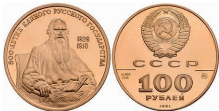
540 100 Rubel, Gold, 1991, Graf Leo Tolstoj, Parchimowicz 273, Fb. 209, in Originalausgabeschatulle, Fingerabdrücke, PP. 600,—