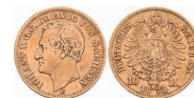
256 10 Mark, 1873, Johann, s-ss. J. 257 200,—