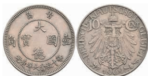
321 Kiautschou, 10 Cent, 1909, kl. Rf., ss-vz. J. N 730 150,—