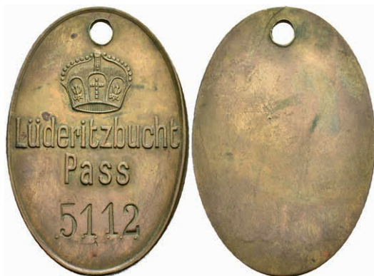
319 Deutsch-Südwestafrika, ovale Bronze-Kontrollmarke (ca. 35,4x52,3mm) Lüderitzbucht Pass mit der Nummer 5112 am Lederband. Diente als Ausweismarke für Eingeborene im Schutzgebiet der Firma Beck & Co., Leipzig. Gelocht, vz. 150,—