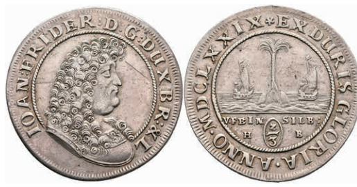
73 2/3 Taler (Palmbaumgulden), 1679, Johann Friedrich, HB, Welter 1730, Dav. 379, Kratzer, ss. 180,—