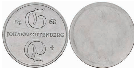
345 10 Mark, 1968, Johannes Gutenberg, einseitiger Aluminiumabschlag der Vorderseite, Kr. auf Rückseite, st. Auflage nur 300 Stück. J. 1523A. 50,—