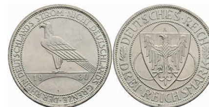
302 3 Reichsmark, 1930, A, Rheinlanddrümung, wz. Rf., vz-st. J. 345 30,—