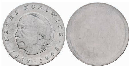
341 10 Mark, 1967, Käthe Kollwitz, einseitiger Aluminiumabschlag der Vorderseite, leicht angelaufen, st. Auflage nur 400 Stück. J. 1519A. 50,—