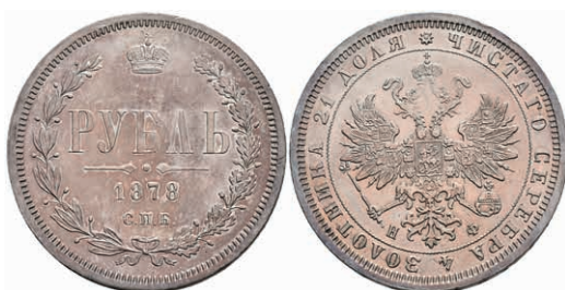
512 Rubel, 1878, Alexander II., St. Petersburg, Bitkin 92, kl. Rf., kl. Schrötlingsfehler, vz. 100,—