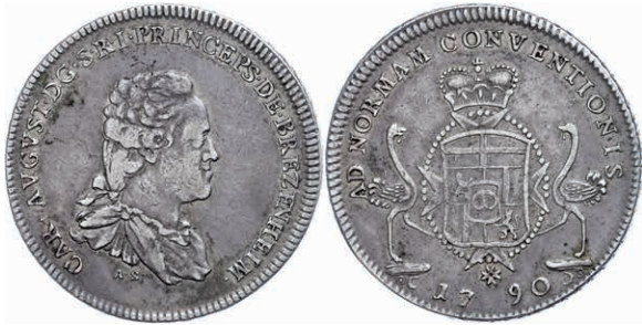
79 Taler, 1790, Karl August, Mannheim, Dav. 2055, ss. Selten! 1000,—