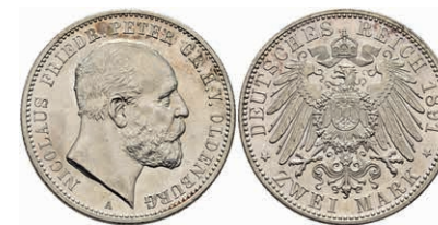
192 2 Mark, 1891, Nicolaus Friedrich Peter, winzige Randfehler, Avers vz, Revers vz-st. J. 93 300,—