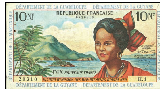
957 Französische Antillen, 10 Nouveaux Francs o. D. (1964). kl. RostlöcherP.5a. Erh. III. (Abbildung auf 50% verkleinert) 150,—