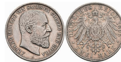
205 2 Mark, 1895, Alfred, ss. J. 145 500,—