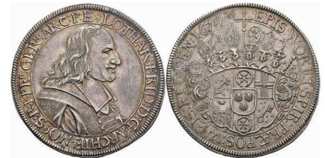
5256 Dicker Doppeltaler (57,35g), 1674, Lothar Friedrich von Metternich-Burscheid, Dav. 5559, Slg. Walther 345, schöne Patina, vz. Sehr selten! (Abbildung auf 93% verkleinert) 10000,—

Goldmünzen ab 1800 sowie Goldbarren sind als Anlagegold ggf. umsatzsteuerfrei (auch für das Aufgeld), soweit der Zuschlagpreis inkl. Aufgeld und Losgebühr nicht höher als der Goldwert + 80% ist.