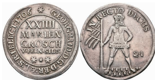
74 24 Mariengroschen, 1706, Georg Ludwig, Welter 2158, kl. Rf., ss. 50,—