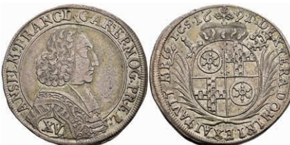
5297 15 Kreuzer, 1691, Anselm Franz von Ingelheim, Slg. Walther 454, ss. 100,—