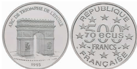
411 500 Francs, Platin, 1993, Triumphbogen, mit Zertifikat in Ausgabeschatulle, PP. 500,—