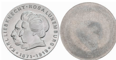
353 20 Mark, 1971, Liebknecht und Luxemburg, einseitiger Aluminiumabschlag der Vorderseite, st. Auflage nur 410 Stück. J. 1533A. 50,—