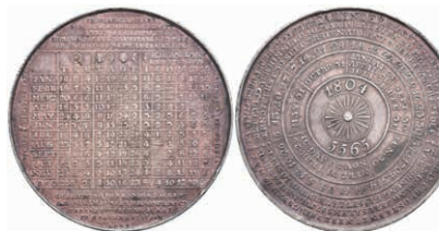
626 Preußen, Silbermedaille (Dm. ca. 44mm, ca. 18,52g), 1804, von Loos, Kalendermedaille. Av: Sonne, darum in mehreren Kreisen verschiedene Kalenderangaben. Rev: Kalenderangaben. Sommer A 111, kl. Druckstelle, kl. Rf., ss. (Abbildung auf 70 % verkleinert) 150,—