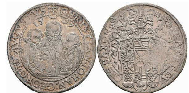
108 Taler, 1597, Christian II., Johann Georg und August, Schnee 754, Dav. 9820, ss. 100,—