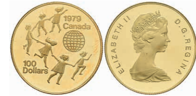
432 100 Dollars, Gold, 1979, Jahr des Kindes, mit Zertifikat in Ausgabeetui, Fb. 10, PP. 700,—