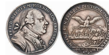
5452 Preußen, Friedrich Wilhelm II., Silbermedaille (Dm. ca. 25,40mm, ca. 6,36g), 1793, auf die Rückeroberung von Mainz. Av: Büste nach rechts, darum Umschrift. Rev: Ansicht der brennenden Stadt, darüber ein Adler mit ausgebreiteten Schwingen, darum Umschrift. Slg. Walther 762, kl. Rf., ss. 130,—