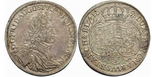
116 2/3 Taler, 1698, Friedrich August I., ILH, Dav. 819, Kahnt 118, f. vz. 200,—