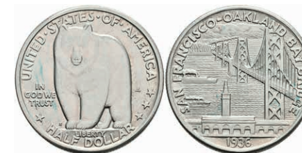
610 1/2 Dollar, 1936, San Francisco, KM 174, leichter Grünspan, vz-st. 70,—