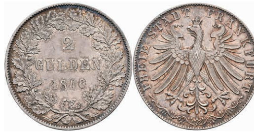
153 Doppelgulden, 1846, AKS 5, J. 28, ss-vz. 150,—