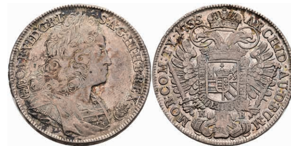
56 Taler, 1735, Karl VI., Kremnitz, Dav. 1060, Voglhuber 260/IV, Herinek 450, ss. 120,—