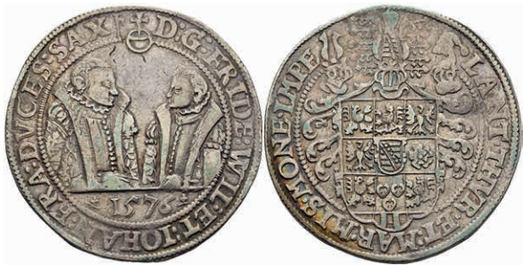
129 Taler, 1576, Friedrich Wilhelm und Johann, Dav. 9766, Kahnt 7b, Schnee 231, kleine Schrötlingsfehler, ss. 150,—