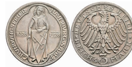
281 3 Reichsmark, 1928, Naumburg, kl. Rf., vz-st. J. 333 120,—