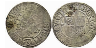
5213 Groschen, 1515, Albrecht II. von Brandenburg, Slg. Walther 184, Knickspur, s-ss. 50,—