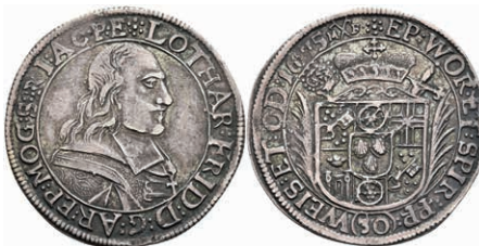
5261 1/2 Gulden (30 Kreuzer), 1675, Lothar Friedrich von Metternich-Burscheid, Slg. Walther 350, ss 200,—