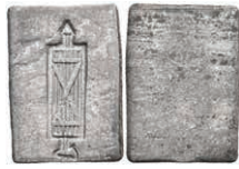
5478 Einseitig geprägte, rechteckige Eisenmarke, o.J. Av: Fascis. Slg. Walther 810, ss. 80,—