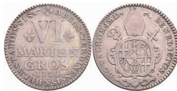
135 6 Mariengroschen, 1730, Benedikt von Geismar, Grote 58, ss. 100,—