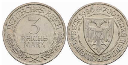
266 3 Reichsmark, 1926, Lübeck, wz. Rf., vz. J. 323 70,—