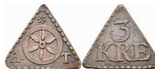
5500 Tormarke, Kupfer, o.J. Av: Rad zwischen "A. - T-", darüber Rosette. Rev: "3 / KRE". Slg. Walther -, ss. 80,—