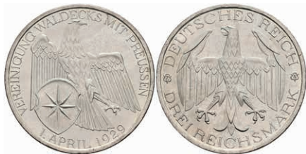
287 3 Reichsmark, 1929, Waldeck, vz. J. 337 80,—