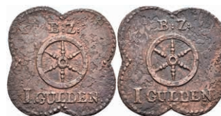
5501 Vierpassförmige Brückenzollmarke zu 1 Gulden, Kupfer, o.J. Av: Rad, darüber "B: Z:", darunter "I GULDEN". Rev: Gleich Avers. Slg. Walther 794, korrodiert, ss. 100,—