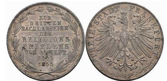
158 Doppelgulden, 1855, Säcularfeier, AKS 42, J. 49, kl. Rf., f. vz. 50,—