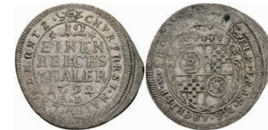
5301 1/12 Taler, 1692, Anselm Franz von Ingelheim, A D, Slg. Walther -, unediert?, Prägeschwäche, ss. 100,—