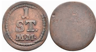
5480 Einseitige Holzmarke, Kupfer, o.J. Av: "1 / ST. / M. M.". Slg. Walther 799, ss. 50,—