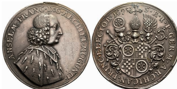
5311 Doppelter Schautaler (58,52g), 1695, Anselm Franz von Ingelheim, Slg. P. A. 603 var., Slg. Walther-, Hsp., Kratzer, ss-vz. Sehr selten! (Abbildung auf 85% verkleinert) 800,—