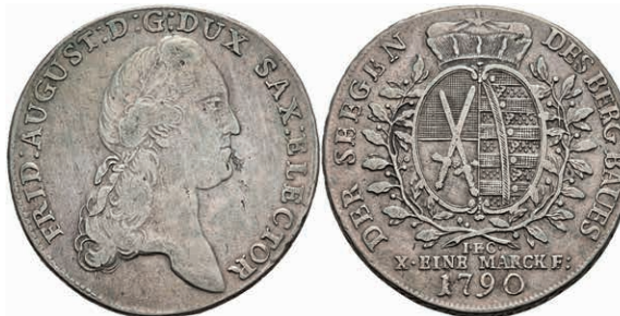
124 Taler, 1790, Friedrich August III., IEC, Dav. 2696, Kahnt 1082, Schnee 1087, kl. Schröttingsfehler, ss. 100,—