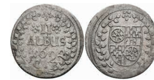
5304 2 Albus, 1692, Anselm Franz von Ingelheim, Slg. Walther 423, ss. 50,—