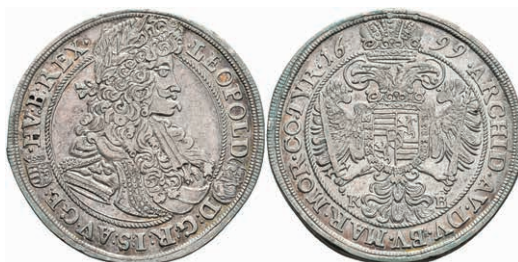
53 1/2 Taler, 1700, Leopold II., Kremnitz, Herinek 849, ss. 120,—