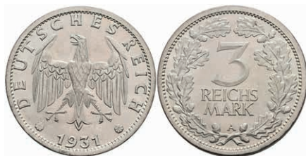
309 3 Reichsmark, 1931, A, vz-st. J. 349 220,—