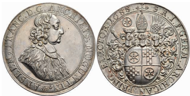
5281 Schautaler (28,62g), 1688, Anselm Franz von Ingelheim, Slg. Walther 412, vz. (Abbildung auf 92% verkleinert) 800,—