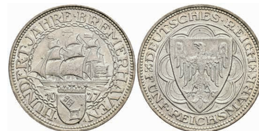
270 5 Reichsmark, 1927, Bremerhaven, wz. Rf., vz. J. 325 200,—