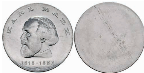
343 20 Mark, 1968, Karl Marx, einseitiger Aluminiumabschlag der Vorderseite, vz-st. Auflage nur 300 Stück. J. 1521A. 50,—