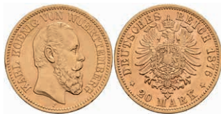
260 20 Mark, 1876, Karl, kl. Rf., vz. J. 293 350,—