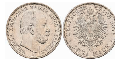
193 2 Mark, 1876, A, Wilhelm I., vz. J. 96 120,—