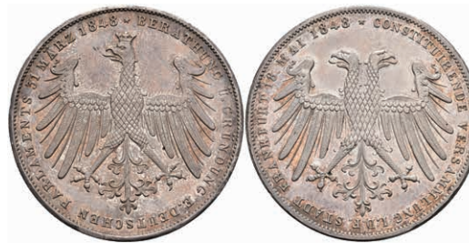
154 Doppelgulden, 1848, 18. Mai 1848, AKS 38, J. 45, minimale Randfehler, vz. 100,—