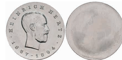
347 5 Mark, 1969, Heinrich Hertz, einseitiger Aluminiumabschlag der Vorderseite, wz. Kr., f. st. Auflage nur 350 Stück. J. 1526A. 50,—