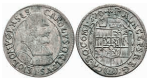
51 Olmütz, 3 Kreuzer, 1670, Karl II. von Lichtenstein, ss-vz. 20,—