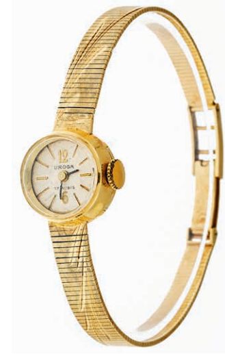
1312 Savonette mit separater Sekunde. Um 1900. Es handelt sich um eine Uhr, die versucht vorzugeben sie sei eine Breguet. Vorder- und Rückdeckel mit Eichhörchenpunze. Rückdeckel bez. "K14". Vorderdeckel bez. "K". Säuretest 585er RG, positiv. Dm. ca. 39 mm. Ca. 320,—