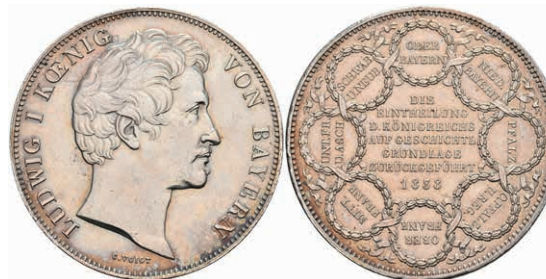
145 Geschichtsdoppeltaler, 1838, Ludwig I., Einteilung des Königreichs, AKS 99, J. 67, wz. Rf., kl. Kr., f. vz. 200,—