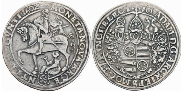
5224 Taler, 1602, Johann Adam von Bicken. Variante mit "MOGV: P. INCI: ELECT". Dav. 5531 var., Hsp., ss. 700,—