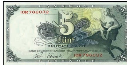
932 5 Deutsche Mark 9.12.1948 (Ausgabe 1956-1961), Europa auf dem Stier, Serie 10, Ro.252c/ Grab. BRD-1- 252e, Erh. I. (Abbildung auf 50% verkleinert) 150,—