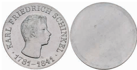
339 10 Mark, 1966, Karl Friedrich Schinkel, einseitiger Aluminiumabschlag der Vorderseite, st. Auflage nur 300 Stück. J. 1517A. 50,—