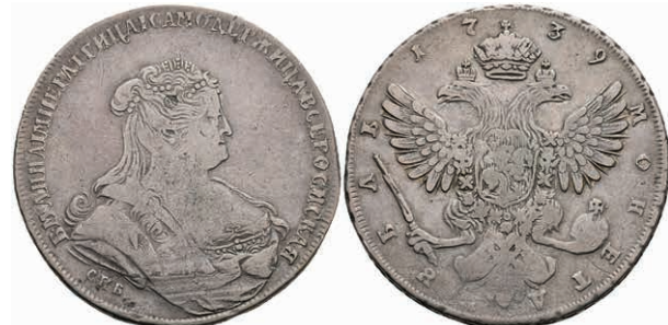
485 Rubel, 1739, Anna, St. Petersburg, Bitkin 236, ss. 200,—