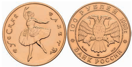
544 100 Rubel, Gold, 1993, Russisches Ballett, Parchimowicz 1803a, etw. angelaufen, st. 600,—