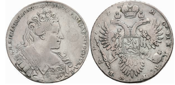
484 Rubel, 1732, Anna, Kadashevsky Münzhof, Bitkin 48, ss. 200,—