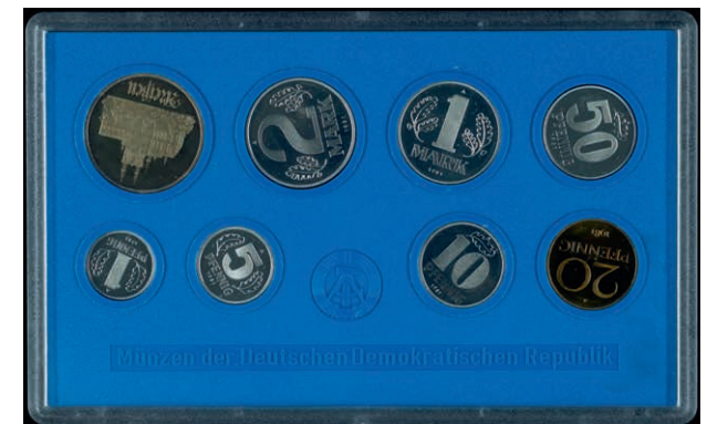
374 1 Pfennig bis 5 Mark, 1981, Meißener Dom, in Hartplastik, PP. Sehr selten, Auflage nur 40 Stück. (Abbildung auf 49% verkleinert) 5000,—