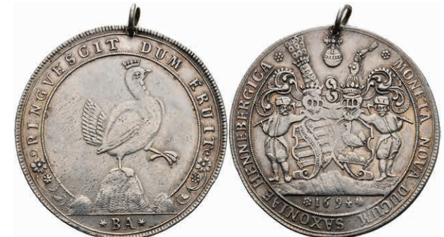
86 Taler, 1695, Ilmenau, Dav. 7484, Schnee 622, justiert, gelocht mit Henkel, gutes ss. (Abbildung auf 91% verkleinert) 300,—