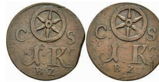
5468 Brückenzollmarke zu 1 Kreuzer, Kupfer, o.J. (18./19. Jh.). Av: Rad zwischen "C - S", darunter 1. Kr. / B.Z.". Rev: Gleich Avers. Slg. Walther 790, ss. 30,—