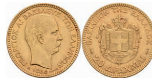
414 20 Drachmen, Gold, 1884, Georg I., Fb. 18, ss 250,—