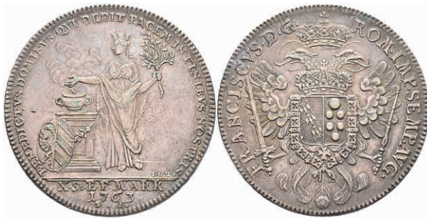
101 Taler, 1763, auf den Frieden von Hubertusburg, Dav. 2488, Kellner 340, Stempelfehler, f. vz. 150,—