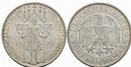
290 5 Reichsmark, 1929, Meißen, wz. Kratzer, vz-st. J. 339 200,—