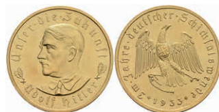
736 Adolf Hitler, Goldmedaille (Dm. 23 mm, 6,48g), 1933, unsigniert, auf die Ereignisse des Jahres. Av: Brustbild Hitlers nach links, darum Umschrift. Rev: Adler mit zerrissenen Fesseln, darum "Im Jahre deutscher Schicksals-wende 1933". Mit Randschrift "Preuss. Staatsmuenze Gold 18 Kar.", f. st. 1000,—