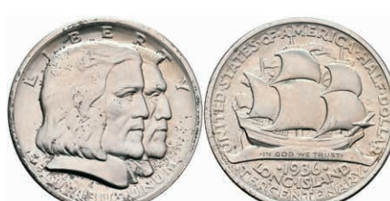
607 1/2 Dollar, 1936, Long Island, KM 182, vz-st. 30,—