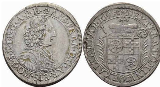
5312 Gulden (60 Kreuzer), 1695, Anselm Franz von Ingelheim, Dav. 658, Slg. Walther 439, ss. 150,—