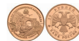
550 25 Rubel, Gold, 1994, Baikaltunnel, Parchimowicz 1419, in Kapsel, PP. 200,—