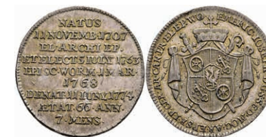
5364 1/6 Taler, 1774, Emmerich Joseph von Breitbach-Bürresheim, auf seinen Tod. Slg. Walther 627, ss-vz. 100,—