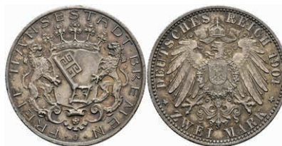
188 2 Mark, 1904, wz. Rf., vz. J. 59 80,—