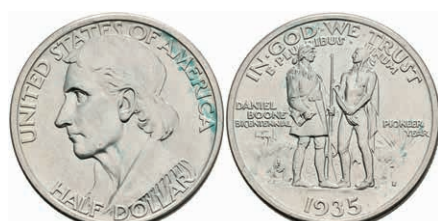
604 1/2 Dollar, 1935, S, Boone, KM 165.1, leichter Grünspan, vz. 80,—