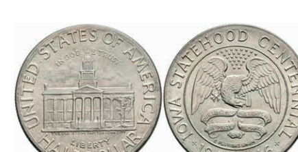
611 1/2 Dollar, 1946, Iowa, KM 197, minimaler Grünspan, wz. Kr., vz-st. 50,—