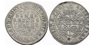
5288 12 Kreuzer, 1690, Anselm Franz von Ingelheim, Slg. Walther 448, ss. 130,—