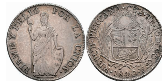
463 8 Reales, 1840, Cuzco, A, KM 142.9, ss 100,—