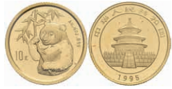
397 10 Yuan, 1995, Panda, large date, KM 716, verschleißt, fleckig, st. 200,—