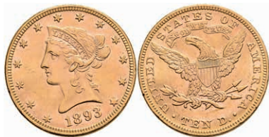
590 10 Dollars, Gold, 1893, Liberty Head, Philadelphia, Fb. 158, kl. Kr., kl. Rf., vz. 650,—