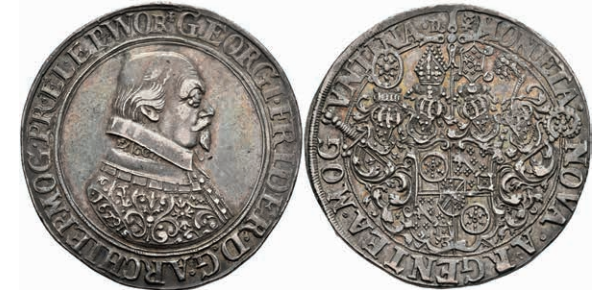
5232 Taler, 1629, Johann Schweickhardt von Kronberg, Dav. 5543, Slg. Walther 241, schöne Patina, ss-vz. Sehr selten! 2000,—