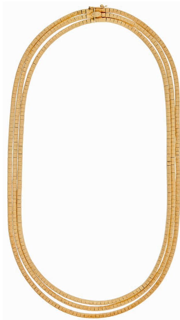
1264 Gold-Collier, Italien, Mitte der 70er Jahre, drei Reihen in verschiedener Länge, 14K GG, ca. 41,5g, dreifach punziert, L. ca. 42-44cm, in gutem Erhaltungszustand. (Abbildung auf 80% verkleinert) 1550,—