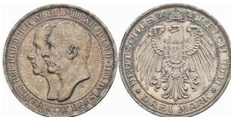
196 3 Mark, 1911, Universität Breslau, schöne Patina, kl. Rf., vz-st. J. 108 50,—