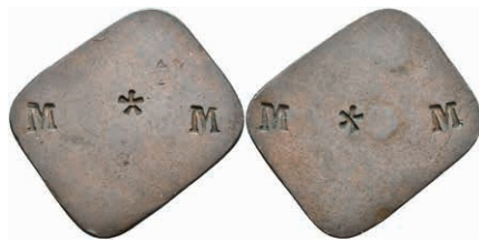
5465 Kupfermarke, o.J. Av: Oben links und unten rechts jeweils ein gepunztes "M", im Zentrum ein Stern. Rev: Gleich Avers. Slg. Walther -, ss. 50,—