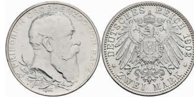
175 2 Mark, 1902, Friedrich I., zum Regierungsjubiläum, f. st. J. 30 40,—