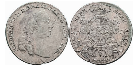
87 2/3 Taler, 1767, Friedrich II., Kassel, Müller 2733, Schrötlingsfehler am Rand, ss. 80,—