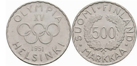
404 500 Markkaa 1951 und 1952, Silber, XV Olympiade in Helsinki 1952, KM 35, AKS 46, vz+ 250,—