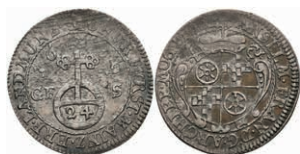
5283 1/12 Taler, 1689, Anselm Franz von Ingelheim, Slg. Walther 447, ss 120,—