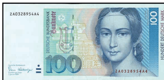
946 100 Deutsche Mark, 2.1.1989, Austauschnote Serie ZA/A4, Ro. 294b. Erh. I (Abbildung auf 50% verkleinert) 280,—