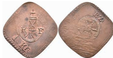
5498 Kupfermarke, o.J. Av: Fascis zwischen "R - F" auf Rad, darunter "I. Kr.". Rev: Rad, darüber "B: Z:". Überprägungsspuren. Slg. Walther -, ss. 50,—