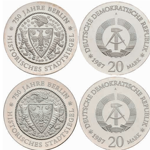
367 2x 20 Mark, 1987, Stadtsiegelpärchen, 2 Varianten, in Originaltut mit Zertifikat, in Kapsel, leicht angelaufen, PP. J. 1617. 500,—