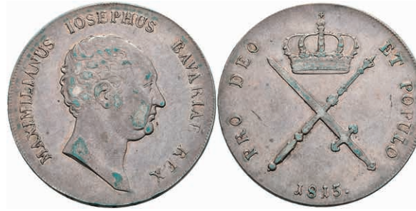
142 Taler, 1819, Maximilian I. Joseph, AKS 44, J. 14, etwas Grünspan, ss. 50,—