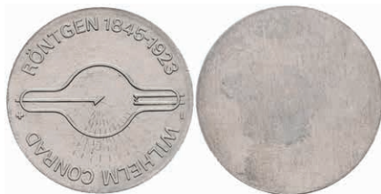
351 5 Mark, 1970, Wilhelm Conrad Röntgen, einseitiger Aluminiumabschlag der Vorderseite, st. Auflage nur 350 Stück. J. 1530A. 50,—