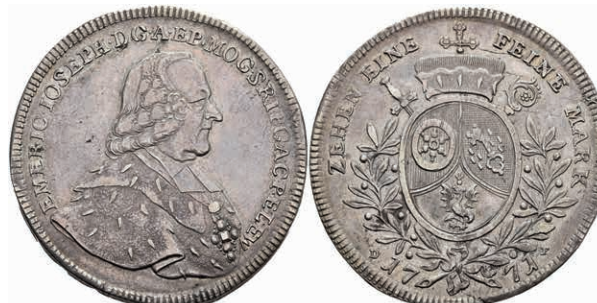
5359 Taler, 1771, Emmerich Joseph von Breitbach-Bürresheim, Dav. 2428, Slg. Walther 621, kl. Schrötlingsfehler am Rand, schöne Patina, ss-vz. 300,—