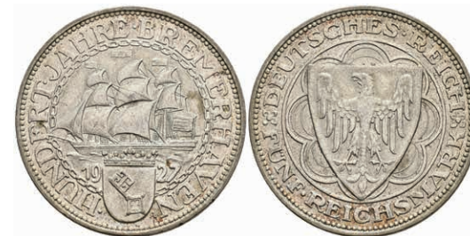
269 5 Reichsmark, 1927, Bremerhaven, kl. Rf., ss-vz. J. 325 180,—