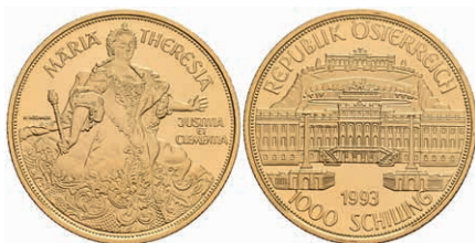
455 1000 Schilling, Gold, 1993, Schloss Schönbrunn - Maria Theresia, Fb. 918, in Originalschatulle mit Zertifikat, in Kapsel, PP. 600,—