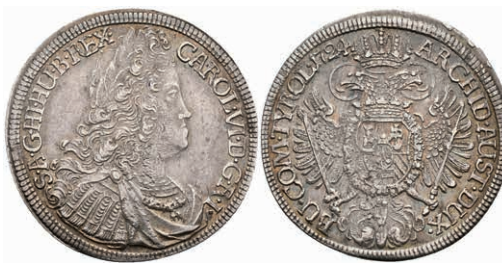
55 1/2 Taler, 1724, Karl VI., Hall, Herinek 486, M./T. 836, ss-vz. 150,—