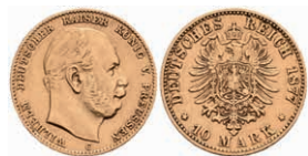
242 10 Mark, 1877, C, Wilhelm I., ss. J. 245. 150,—