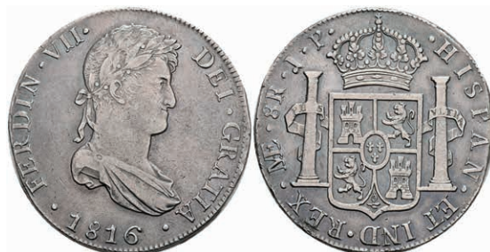
456 8 Reales, 1816, Ferdinand VII., Lima, JP, KM 117.1, ss+ 130,—