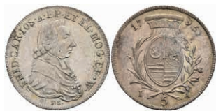
5380 5 Kreuzer, 1795, Friedrich Karl Joseph von Erthal, Slg. Walther 666, justiert, vz+. 50,—