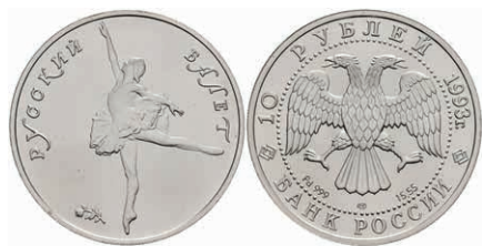
542 10 Rubel, Palladium, 1993, Russisches Ballett, Parchimowicz 1352a, st. 900,—