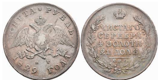
500 Rubel, 1829, Nikolaus I., St. Petersburg, Bitkin 107, kl. Rf., ss. 80,—