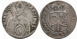
5269 6 Kreuzer, 1677, Damian Harthard von der Leyen, Slg. Walther 382, ss. 50,—