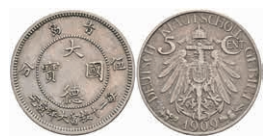
320 Kiautschou, 5 Cent, 1909, ss-vz. J. N 729 100,—