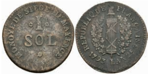
5367 1 Sol (2,87g), 1793, geprägt unter französischer Belagerung, Brause/Mansfeld Tf. 18, Nr. 15, Slg. P. A. 864, Slg. Walther 753, ss. 30,—