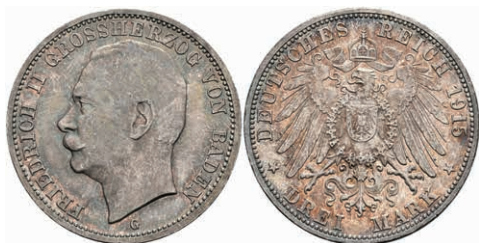
185 3 Mark, 1915, Friedrich II., kräftige Patina, vz-st. J. 39 80,—