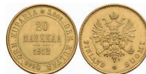
403 20 Markkaa, Gold, 1912, Nikolaus II., Fb. 3, vz. 350,—