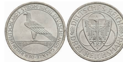
301 3 Reichsmark, 1930, A, Rheinlanddrümung, wz. Rf. und Kr., f. st. J. 345 30,—