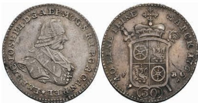
5348 30 Kreuzer, 1765, Emmerich Joseph von Breitbach-Bürresheim, Slg. Walther 598, etw. justiert, ss. 100,—