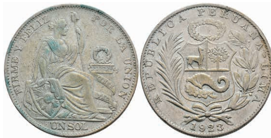
468 Sol, 1923, Lima, KM 217.1, kl. Rf., Grünspan, ss. 50,—