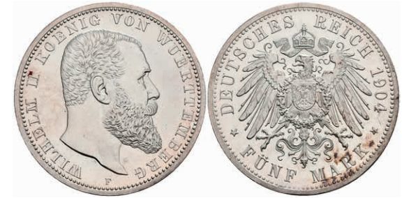
215 5 Mark, 1904, Wilhelm II., kl. Schröttingsfehler/Kratzer, Haarlinien, PP. J. 176 250,—