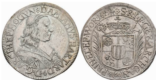
5262 Gulden (60 Kreuzer), 1675, Damian Hartard von der Leyen, Dav. 650, Slg. Walther 352, vz. 300,—