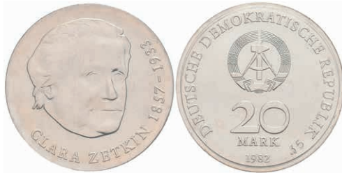
364 20 Mark, 1982, Clara Zetkin, Motivprobe, Nr. 35, in Kapsel verplombt, mit Zertifikat, st. Sehr selten, Auflage nur 90 Stück. J. 1587P. 4500,—