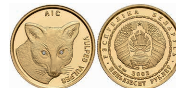
615 50 Rubel, Gold, 2002, Rotfuchs, Parchimowicz 506, PP. 300,—

Alle Einzellose und Zertifikate/Gutachten sind unter www.rhenumis.de farbig abgebildet!