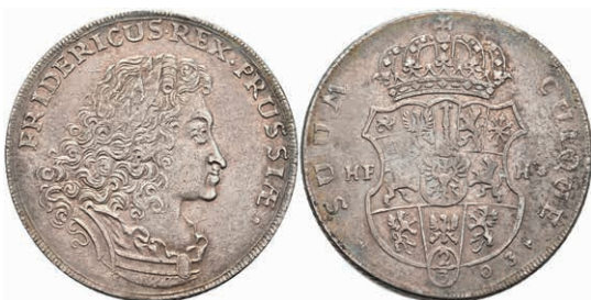
71 2/3 Taler, 1703, Friedrich III., HFH Magdeburg, Dav. 291, ss. 250,—