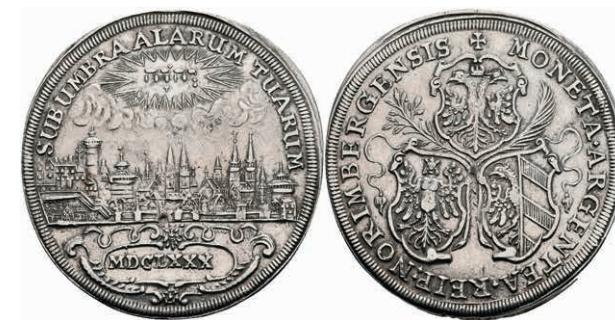
98 Taler, 1680, Stadtansicht, Kellner 259, Dav. 5661, gereinigt, ss. 200,—