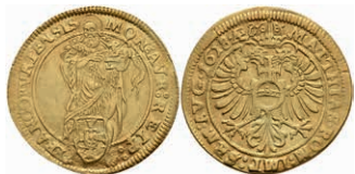
81 Goldgulden (3,15g), 1618, mit Titel Matthias, Joseph/Fellner 333, Fb. 960, etwas rauer Schrötling, ss+ 700,—