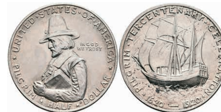
598 1/2 Dollar, 1920, Pilgrim, KM 147.1, kl. Kr., vz-st. 50,—