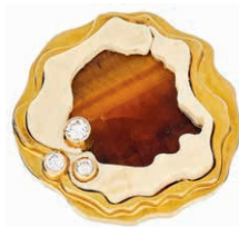
1248 Extravaganter, wohl unikater Damenfingerring mit repräsentativem mehrschichtigen Besatz aus einem Tigerauge, wohl Bein und drei Brillanten, getestet, mit jeweils einem Durchmesser von ca. 2,5 mm von zusammen ca. 0,177 ct. Ringkopf schwer einsehbar gestempelt "800", eventuell Teile Silber, vergoldet, Säuretest 750er GG, positiv. Massive Ringschiene 750er GG, gestempelt. 20. Jh. Aufgrund der fehlenden Goldschmiedepunze, Goldschmied nicht mehr eindeutig zuordenbar. Haarriss im Beinbesatz. Ringgröße: Deutschland: 51; USA/Kanada: 5,8; Großbritannien: L; Frankreich: 11. Ca. 37,96 gr. 1300,—