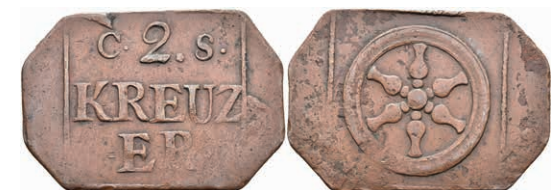
5476 Brückenzollmarke zu 2 Kreuzer, Kupfer, o.J. Av: "2." zwischen "C - S", darunter "KREUZ / ER". Rev: Rad. Slg. Walther 792, ss. 50,—