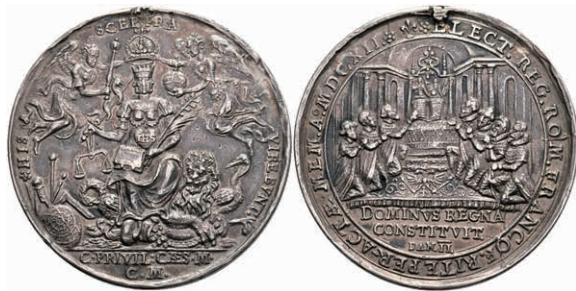
5401 RDR, Matthias, Silbermedaille (Dm. ca. 39,70mm, ca. 22,77g), 1612, von Ch. Maler, auf die Kaiserwahl. Av: Thronende weibliche Gestalt mit drei Gesichtern (Religio, Justitia und Pax) von vorn, links und rechts jeweils ein Genius. Rev: Altar, zu den Seiten die sieben knienden Fürsten, darum Umschrift. Slg. Erlanger 2590, Hsp., kl. Rf., ss. 200,—