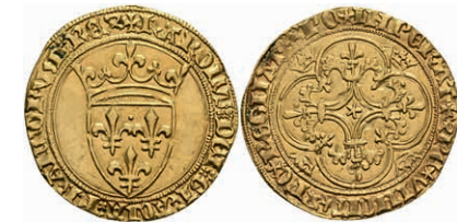
405 Ecu d'or, o.J.(1388-1422), Charles VI., Ciani 484, kl. Kratzer, f. vz. 700,—