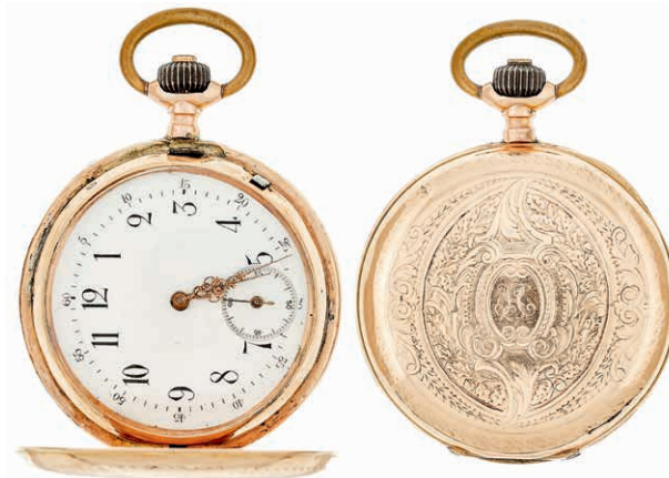
1310 Taschenuhr "Labor" um 1910 (Dm 50mm, 12mm), Schweiz. 585er Gold mehrfach punziert, Kronenaufzug, Seriennummer: 11584, Breguetspirale Zifferblatt: Email, arabische Ziffern, kleine Sekunde. kl. Dellen und Bearbeitungsspur am Gehäuse seitlich des Deckels, innen leicht berieben. (Abbildung auf 78% verkleinert) 800,—