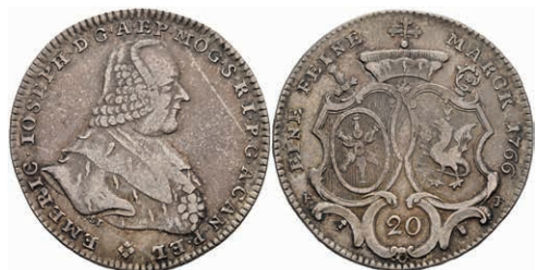
5351 1/2 Taler, 1766, Emmerich Joseph von Breitbach-Bürresheim, Slg. Walther 602, ss. 130,—