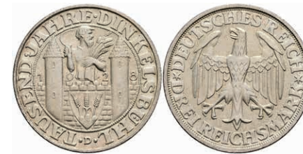
283 3 Reichsmark, 1928, Dinkelsbühl, kl. Rf., vz-st. J. 334 450,—