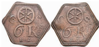
5467 Brückenmarke, Kupfer, o.J. Av: Rad zwischen "C - S". darunter "6 Kr. / B.Z.". Rev: Gleich Avers. Slg. Walther 787, ss. 80,—