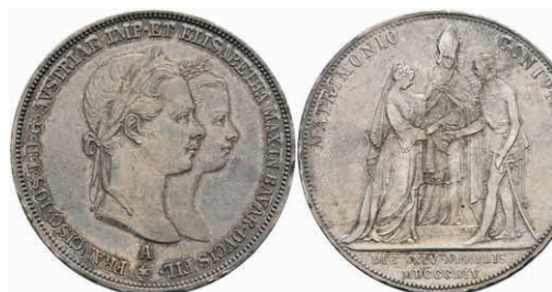
449 Doppelgulden, 1854, Franz Josef I., auf die Vermählung des Kaisers, J. 300, kl. Rf. und Kratzer, ss-vz. 120,—