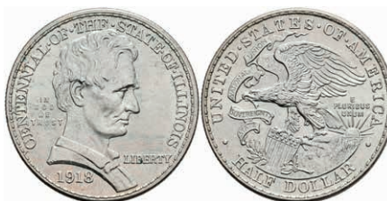
596 1/2 Dollar, 1918, Illinois-Lincoln, KM 143, leichter Grünspan, vz. 50,—