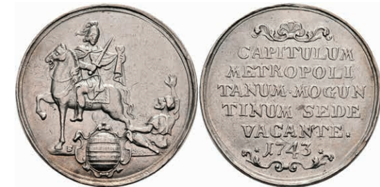
5330 1/2 Schautaler, 1743, Sedisvakanz, Slg. Walther 509, Slg. P. A. 668, Hsp., ss. 150,—