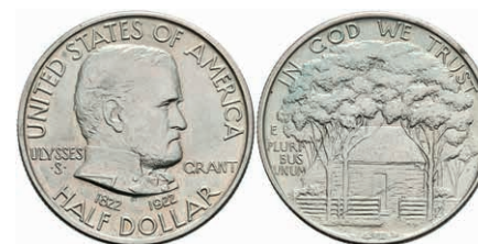
599 1/2 Dollar, 1922, Grant Memorial, KM 151.1, etwas Grünspan, vz. 50,—