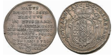
5319 3 Kreuzer, 1729, Lothar Franz von Schönborn, auf seinen Tod, Slg. Walther 490, vz. 80,—