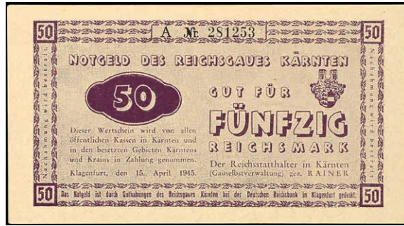
921 Kärnten, 50 Reichsmark, 1945, Ros. 187, Erhaltung II. (Abbildung auf 50% verkleinert) 350,—