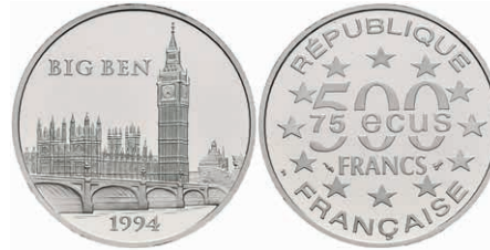
412 500 Francs, Platin, 1994, Big Ben, mit Zertifikat in Ausgabeschatulle, leicht angelaufen, PP. 500,—