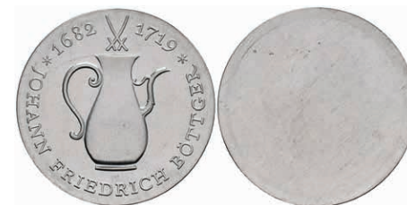
348 10 Mark, 1969, Johann Friedrich Böttger, einseitiger Aluminiumabschlag der Vorderseite, wz. Kr. f. st. Auflage nur 300 Stück. J. 1527A. 50,—