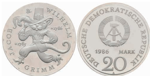
366 20 Mark, 1986, Gebrüder Grimm, in Hartplastik verplombt, PP. J. 1607. 200,—