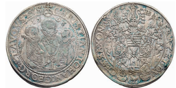
107 Taler, 1593, Christian II., Johann Georg und August, Dav. 9820, Kahnt 186, Schnee 754, etwas Grünspan, ss. 100,—