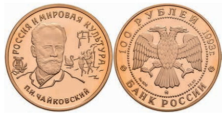
543 100 Rubel, Gold, 1993, P. Tschajkowski, Parchimowicz 1805, kl. Fleck, ohne Kapsel, PP. 600,—