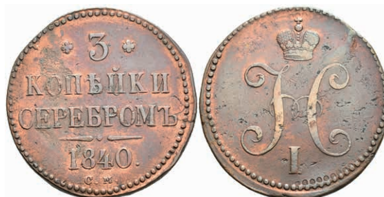
505 3 Kopeken, 1840, Nikolaus I., Suzun, Bitkin 721 (R), ss. 30,—