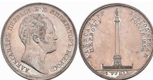
503 Rubel, 1834, Alexander I., St. Petersburg, auf die Enthüllung der Alexandersäule, Bitkin 894, Dav. 285, kl. Kratzer, schöne Patina, vz. 1000,—