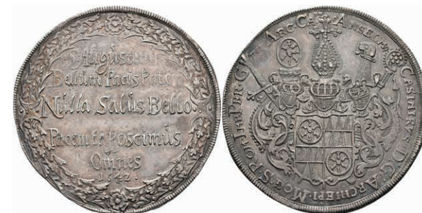
5243 Taler, 1642, Anselm Casimir von Umstadt, auf den Friedenswunsch, Slg. Walther 275, Dav. -, schöne Patina, vz. Sehr selten! (Abbildung auf 96% verkleinert) 4000,—