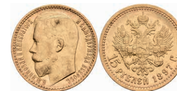
519 15 Rubel, Gold, 1897, Nikolaus II., St. Petersburg, Fb. 177, wz. Rf., ss. 600,—