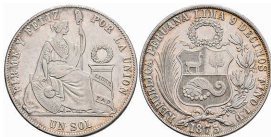
465 Sol, 1873, Lima, LD, KM 196.4, ss+. 100,—