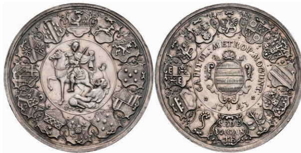
5431 Silbermedaille (Dm. ca. 47mm, ca. 34,24g), 1743, von W. Schäfer, Sedisvakanz. Av: St. Martin zu Pferd teilt den Mantel mit einem Bettler, im Außenkranz 12 Wappen. Rev: Wappen in Kartusche, darum Umschrift, im Außenkranz 11 Wappen. Slg. Walther 508, Slg. P. A. 667, kl. Rf., f. vz. (Abbildung auf 89% verkleinert) 700,—