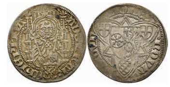
5201 Weißpfennig, o.J. (1461-1475), Adolf II. von Nassau, Slg. P. A. 186 var., ss. 80,—