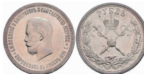
517 Rubel, 1896, Nikolaus II., St. Petersburg, Bitkin 322, wz. Rf., vz. 300,—