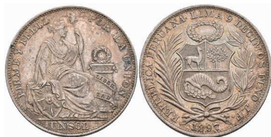
467 Sol, 1897, Lima, JF, KM 196.26, Randfehler, vz. 80,—