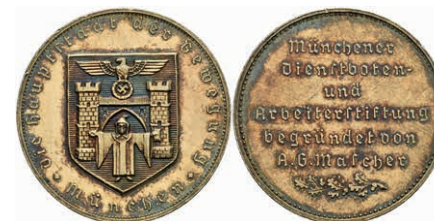
739 Silbermedaille (Dm. ca. 30mm, ca. 19,08g), o.J. (1933-1945), unsign., Verdienstmedaille der Münchner Dienboten- und Arbeiterstiftung. Av: Wappen, darum Umschrift. Rev: 6 Zeilen Schrift. Kl. Kratzer und Rf., vz. Selten! 50,—