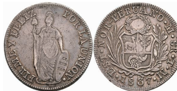
462 Nord Peru, 8 Reales, 1837, Lima, TM, KM 155, Hsp., ss. 60,—