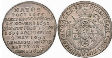
5318 1/8 Taler, 1729, Lothar Franz von Schönborn, auf seinen Tod, Slg. Walther 475, vz-st. 300,—