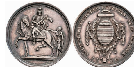
5363 1/4 Schautaler, 1774, Sedisvakanz, Slg. P. A. 757, Slg. Walther 642, vz. 300,—