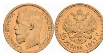
518 15 Rubel, Gold, 1897, Nikolaus II., Fb. 177, kl. Kratzer, kl. Rf., ss-vz. 700,—