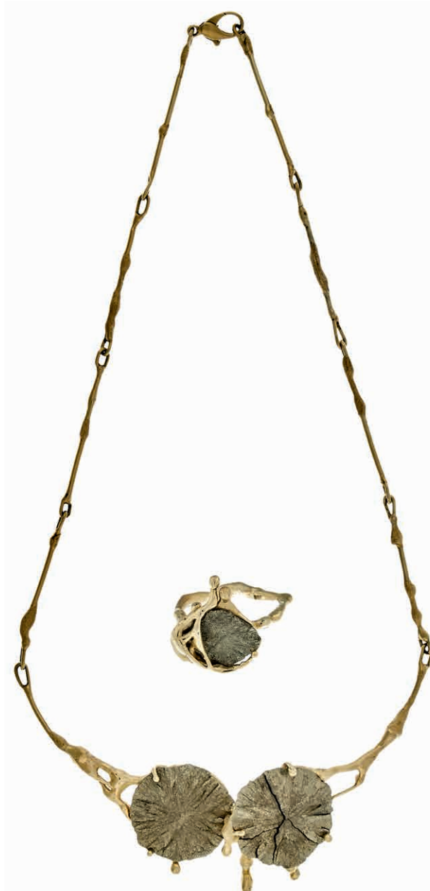
1258 Extravaganter Set aus Collier und Ring mit Pyritsonne, 585 Gold, gestempelt; Maße des Colliers (17,5x 12,5cm, 31,95g), Ring (Innen Dm= 19,4x20,5, 11,63g) Handarbeit, unbekannt. 1100,—