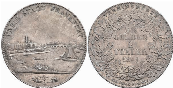
151 Doppeltaler, 1841, Stadtansicht, AKS 3, J. 15, Randfehler, ss. 150,—