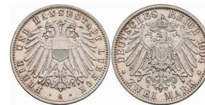
191 2 Mark, 1904, Stadtwappen, min. Rf., wz. Kratzer, f. st. J. 81 100,—