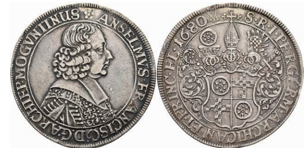
5278 Taler, 1680, Anselm Franz von Ingelheim, Dav. 5569, Slg. Walther 399, Hsp., ss. (Abbildung auf 95% verkleinert) 300,—