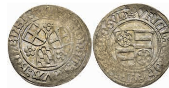
5212 Albus, 1512, Uriel von Gemmingen, Slg. P. A. 231, Slg. Walther 178 var., ss. 100,—