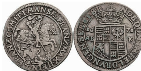
93 1/3 Taler, 1671, Franz Maximilian und Heinrich Franz, Eisleben, Tornau 310, ss. 30,—