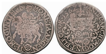
5216 1/4 Taler, 1567, Damian Brendel von Homburg, Slg. P. A. 298 var., Slg. Walther -, s. Sehr selten! 1000,—