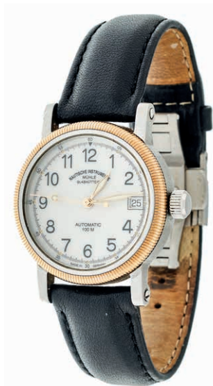
1337 Nautische Instrumente Mühle Glashütte Damen-Sport-Automatic Armbanduhr. Ca. 33,8mm, Ref.-Nr.: M1-31-70 Edelstahl mit Goldlünette, Saphirglas, Mineralglasboden, Automatik. Datumsanzeige, Zeiger fluoreszierend, leichte Gebrauchsspuren auf Lünette und rückseitig. Schwarzes Lederarmband mit originaler Mühle Faltschließe. In Box mit Original Papieren. 600,—