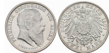
181 2 Mark, 1907, Friedrich I., auf seinen Tod, wz. Kratzer, st. J. 36 50,—