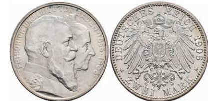
179 2 Mark, 1906, Friedrich I., zur goldenen Hochzeit, f. st. J. 34 30,—