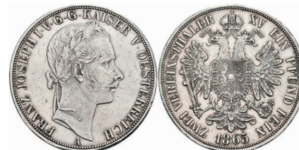
450 Doppeltaler, 1865, Franz Joseph I., Wien, Dav. 23, J. 313, kl. Rf., gereinigt, f. vz. 1300,—