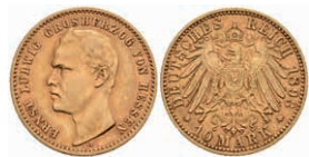
237 10 Mark, 1893, Ernst Ludwig, ss. J.222 1000,—