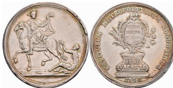
5338 1/2 Schautaler, 1763, Sedisvakanz, Slg. P. A. 707, Slg. Walther 590, ss. 200,—