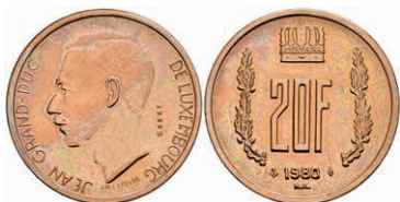
436 20 Francs, Bronze, 1980, Jean, Essai, Haarlinien, st. 50,—