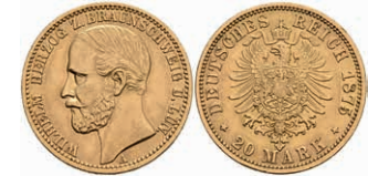
231 20 Mark, 1875, Wilhelm, kl. Rf., kl. Kr., ss-vz. J. 203 1200,—