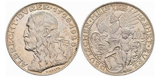
728 Silbermedaille (Dm. ca. 36,10mm, ca. 24,74g), 1928, von K. Goetz, auf den 400. Todestag Albrecht Dürers. Av: Büste Dürers nach links, darum Umschrift. Rev: Stehender nackter Knabe mit Schild und Dürermonogramm, im Außenkranz Umschrift. Kienast 388, Rand punziert, wz. Kr., kl. Rf., vz-st. 50,—