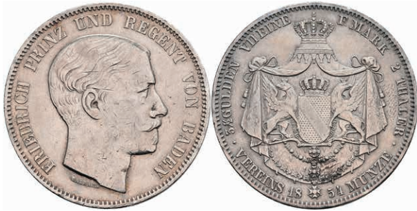
139 Doppeltaler, 1854, Friedrich I., AKS 114, kl. Rf., Kratzer, ss. 400,—