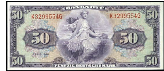
934 50 Deutsche Mark 1948, Kenn.- Bst. K/ Serie G, Ro. 242, Erh. I. (Abbildung auf 50% verkleinert) 1000,—