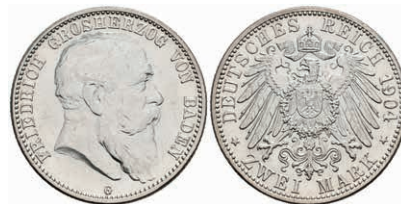
177 2 Mark, 1904, Friedrich I., Avers vz+, Revers f. st. J. 32 100,—