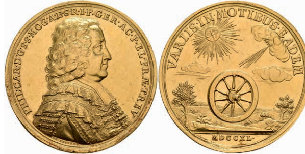
622 Mainz, Philipp Karl von Eitz-Kempenich, Goldmedaille (Dm. ca. 42mm, ca. 34,76g), 1740, von Becker. Av: Brustbild nach rechts, darum Umschrift. Rev: Das Mainzer Rad in einer Landschaft, darüber strahlende Sonne und Wolke, darum "VARIIS . IN . MATIBUS . EADEM". Slg. P. A. 662, Slg. Belli 1134, kl. Kratzer sowie Randfehler und Feilspuren, ss-vz. Sehr selten! (Abbildung auf 97% verkleinert) 5000,—

617 Lot von unterschiedlichen Ronden (1 Pfg bis 10 Mark BRD), vier ausgestanzte Zinkplatten und unterschiedliche Vorprägungen (Kaiserreich, BRD und DDR). Erhaltung unterschiedlich, meist zaponiert. (Abbildungen siehe Onlinekatalog) 300,—