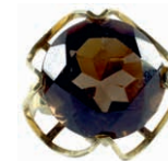
1252 Repräsentativer Damenfingerring mit einem Besatz aus einem facettierten wohl Rauchquarz, nicht getestet, mit einem Durchmesser von ca. 1,6 cm, in dekorativ ausgeführter, geschwungener Vier-Krappenfassung. 2. Hälfte 20. Jh. 585er GG, gestempelt. Ringgröße: Deutschland: 51; USA/Kanada: 5.6; Großbritannien: L; Frankreich: 12. Ca. 6,20 gr. 130,—