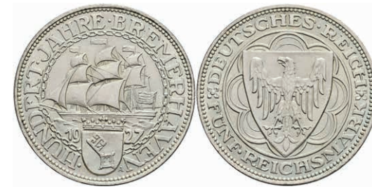
272 5 Reichsmark, 1927, Bremerhaven, kl. Rf., vz+. J. 326 280,—