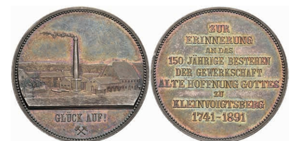
651 Sachsen, Silbermedaille (Dm. ca. 37,90mm, ca. 27,06g), 1891, unsign., auf das 150jährige Bestehen der Gewerkschaft "Alte Hoffnung Gottes" in Kleinvoigtsberg bei Freiberg. Av: Gebäudeansicht mit rauchendem Schornstein, im Abschnitt darunter "GLÜCK AUF!". Rev: 9 Zeilen Schrift. Kratzer, kl. Rf., schöne Patina, vz-st. Selten! 450,—