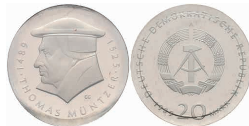
370 20 Mark, 1989, Thomas Müntzer, in Kapsel eingeschweißt, PP. J. 1624. 100,—