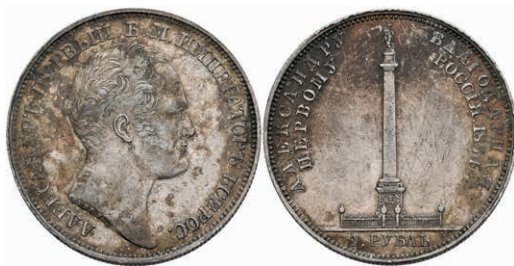
502 Rubel, 1834, Alexander I., St. Petersburg, auf die Enthüllung der Alexandersäule, Bitkin 894, Dav. 285, Kratzer, ss. 500,—