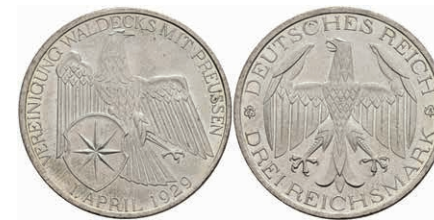
286 3 Reichsmark, 1929, Waldeck, f. st. J. 337 80,—