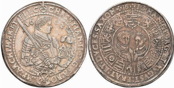
110 Taler, 1602, Christian II., HB, Keilitz/Kahnt 222, Schnee 758, ss. 150,—