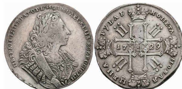
482 Rubel, 1729, Peter II., Kadashevsky Münzhof, Bitkin 121, Revers leicht berieben, kl. Schröttingsfehler und Zainende, ss. 200,—