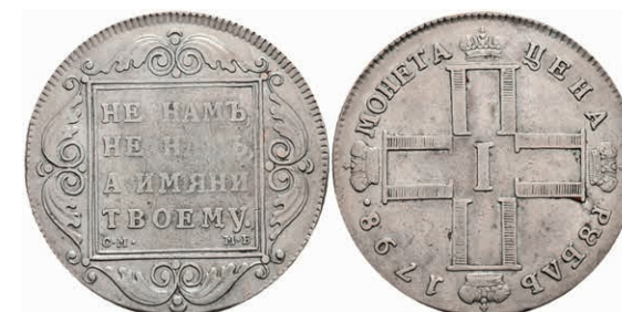
495 Rubel, 1798, Paul I., St. Petersburg, Bitkin 32, ss. 150,—