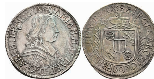
5266 Gulden (60 Kreuzer), 1676, Damian Hartard von der Leyen, Dav. 655, Slg. Walther 358, ss-vz. 200,—