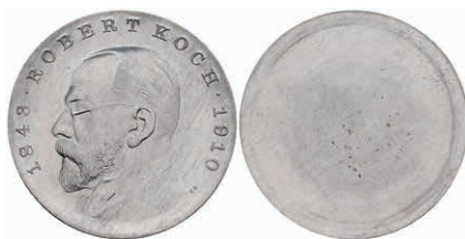
344 5 Mark, 1968, Robert Koch, einseitiger Aluminiumabschlag der Vorderseite, f. st. Auflage nur 350 Stück. J. 1522A. 50,—