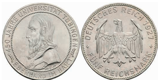
275 5 Reichsmark, 1927, Tübingen, wz. Kr., vz-st. J. 329 250,—