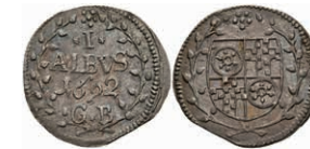
5300 1 Albus, 1692, Anselm Franz von Ingelheim, Slg. Walther 423, Zainende, vz-st. 50,—