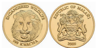
438 100 Kwacha, Gold, 2005, Löwe, PP. 350,—