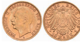
226 10 Mark, 1909, Friedrich II., ss-vz. J. 191 450,—