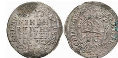
5302 1/12 Taler, 1692, Anselm Franz von Ingelheim, Slg. Walther 457, etwas Belag, ss+. 100,—