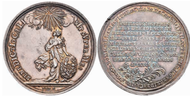
5441 Silbermedaille (Dm. ca. 45,50mm, ca. 25,68g), 1759, sign. van Loon, auf Emeric Joseph von Breitbach-Bürresheim und sein Jubiläum als Domdekan. Av: Stehende weibliche Gestalt mit Familienschild, darüber strahlender Name Jehovas. Slg. P. A. 841, Slg. Walther 719, Randfehler, Kratzer im Feld, vz. (Abbildung auf 92% verkleinert) 200,—