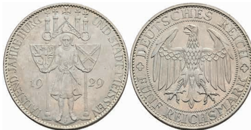
292 5 Reichsmark, 1929, Meißen, wz. Rf., vz. J. 339 230,—