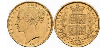
416 Sovereign, 1855, Victoria, Fb. 387e, kl. Rf., f. vz. 300,—