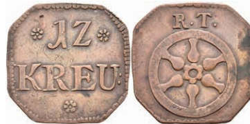
5483 Tormarke zu 12 Kreuzer, Kupfer, o.J. Av: 12 zwischen zwei Rosetten, darunter "KREU", darunter Rosette. Rev: Rad, darüber "R. T.". Slg. P. A. -, Slg. Walther -, ss. 80,—