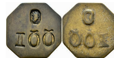
5504 Holzmarke zu 100 Wellen, o.J., Messing. Av: Eingestanzter Kopf nach rechts über "100". Slg. Walther 822, ss. 50,—