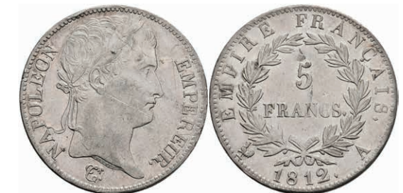
407 5 Francs, 1812, Napoleon I., Paris, Dav. 85, Gadoury 584, Kratzer, Randfehler, ss-vz. 50,—