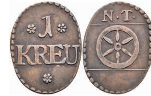
5488 Tormarke zu 1 Kreuzer, Kupfer, o.J. Av: 1 zwischen zwei Rosetten, darunter "KREU" und Rosette. Rev: Rad darüber "N. T.". Slg. Walther 778, ss. 30,—