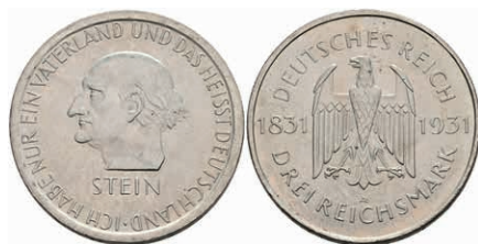
308 3 Reichsmark, 1931, Stein, vz-st. J. 348 60,—