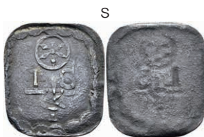
5497 Einseitige Holzmarke, Kupfer, o.J. Av: "I / S T", darunter Rad. Slg. Walther -, ss. 30,—