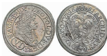
52 6 Kreuzer, 1681, Leopold I., Wien, Herinek 1141, vz. 20,—