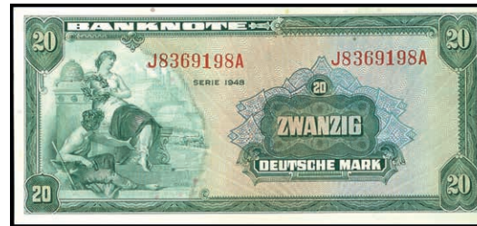
930 20 Deutsche Mark 1948, Kenn.- Bst. J/ Serie A, Ro. 240, Erh. I. (Abbildung auf 50% verkleinert) 350,—