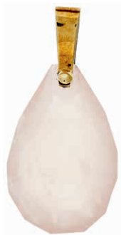
1256 Anhänger mit einem tropfenförmig facettierten Rosenquarz, 3,7x2,6cm, 585 GG, 13,41g. 100,—