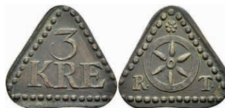
5486 Tormarke zu 3 Kreuzer, Kupfer, o.J. (18. Jh.). Av: "3 / KRE". Rev: Rad zwischen "R - T". Vgl. Slg. Walther 774, ss. 30,—