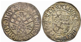
5214 Groschen, 1516, Albrecht II. von Brandenburg, Slg. Walther -, Prägeschwäche, ss. 200,—