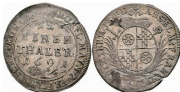
5294 1/12 Taler, 1691, Anselm Franz von Ingelheim, Slg. Walther 455, Schröttingsriss, ss-vz. 50,—