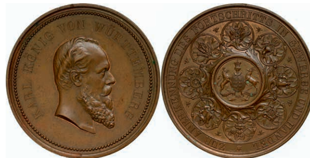
639 Württemberg, Karl, Bronzemedaille (Dm. ca. 60,10mm, ca. 94,22g), o.J., von K. Schwenzer und G. Schiller, Prämienmedaille zur Anerkennung des Fortschritts in Gewerbe und Handel. Av: Kopf nach rechts, darum Umschrift. Rev: Wappen, darum Ranken mit Gewerbesymbolen, in den Winkeln jeweils eine Biene, im Außenkranz Umschrift. Ebner 85, wz. Kr., kl. Rf., vz. (Abbildung auf 69% verkleinert) 160,—