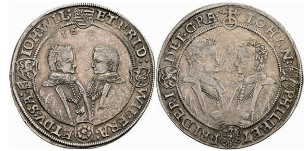
125 Taler, 160(?)?, Johann Philipp und seine drei Brüder, Dav. 7361, Schnee 266, ss. 150,—