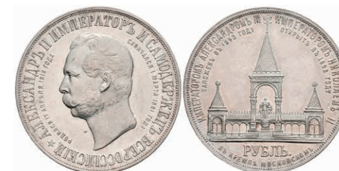
521 Rubel, 1898, Nikolaus II., St. Petersburg, Denkmal für Alexander II., Bitkin 323(R), kl. Kratzer/berieben, vz. 1800,—