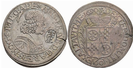
5292 Gulden (60 Kreuzer), 1690, Anselm Franz von Ingelheim, mit Gegenstempel, vgl. Dav. 658, vgl. Slg. Walther 417, Stempelfehler, ss. Sehr selten! 500,—