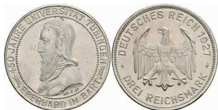
274 3 Reichsmark, 1927, Tübingen, vz-st. J. 328 230,—