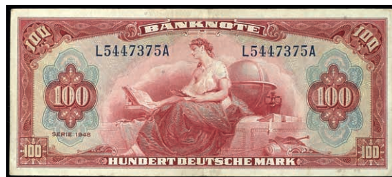
928 100 Deutsche Mark 1948, Kennbst. L/ Serie A, KN 7-stellig schwarzblau, Ro. 244 /P8a, Erh. III. (Abbildung auf 50% verkleinert) 400,—