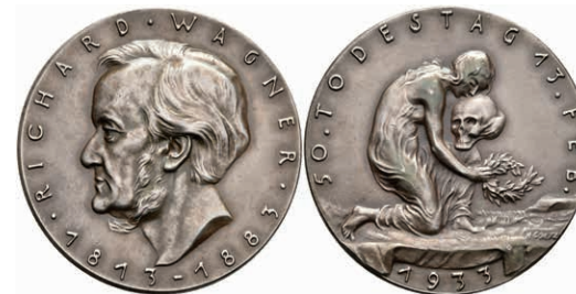
740 Silbermedaille (Dm. ca. 36mm, ca. 19,39g), 1933, von K. Goetz, auf den 50. Todestag von Richard Wagner. Av: Kopf nach links, darum Umschrift. Rev: Kniende weibliche Gestalt mit Totenkopf und Lorbeerzweig nach rechts. Kienast 482, Rand punziert, vz-st. 100,—

Goldmünzen ab 1800 sowie Goldbarren sind als Anlagegold ggf. umsatzsteuerfrei (auch für das Aufgeld), soweit der Zuschlagpreis inkl. Aufgeld und Losgebühr nicht höher als der Goldwert + 80% ist.