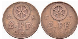
5466 Brückenmarke zu 2 Kreuzer, Kupfer, o.J. Av: Rad zwischen "C - S", darunter "2 Kr. / B.Z.". Rev: Gleich Avers. Slg. Walther 791, ss. 50,—