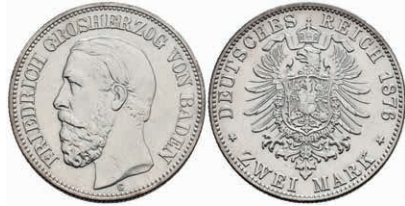
171 2 Mark, 1876, Friedrich I., f. vz. J. 26 150,—