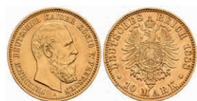
250 10 Mark, 1888, Friedrich III., f. vz. J. 247 150,—