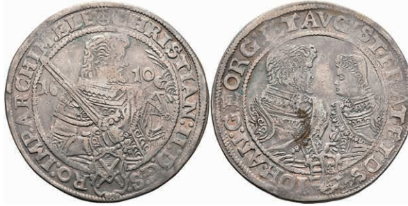
112 Taler, 1610, Christian II., Johann Georg I. und August, Dresden, Schnee 767, Dav. 7566, Kahnt 228, ss. 100,—