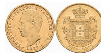
477 5000 Reis, Gold, 1869, Luis I., Fb. 153, vz 400,—