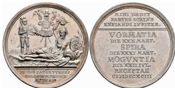
5456 Silbermedaille (Dm. ca. 41,60mm, ca. 29,94g), 1793, von Stockmar, auf den Entsatz der Städte Worms, Speyer und Mainz. Av: Liegender Flussgott mit Mainzer Schild nach rechts, dahinter Trophäe und Krieger, im Abschnitt darunter 3 Zeilen Schrift. Rev: 11 Zeilen Schrift. Slg. P. A. 859, Slg. Walther -, kl. Kratzer und Rf., vz. 800,—