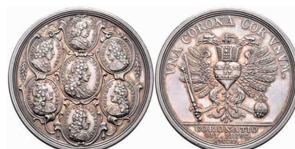
5425 RDR, Silbermedaille (Dm. ca. 48,70mm, ca. 44,97g), 1711, von P. H. Müller, auf die Krönung Karls VI. zum römischen Kaiser. Av: Brustbild des Kaisers im Medaillon nach rechts, darum 6 weitere Medaillons. Rev: Doppeladler mit Zepter, Schwert und Reichsapfel, auf der Brust ein Herz, darüber Krone. Förschner 163, Forster 774, Slg. Mont. 1369, schöne Patina, f. st. (Abbildung auf 82% verkleinert) 1000,—