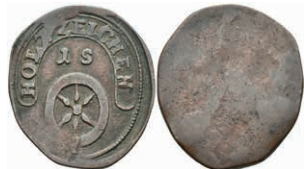
5481 Einseitige Holzmarke, Kupfer, o.J. Av: "1 S", darüber Spruchband, darunter Rad. Slg. Walther 798, ss. 50,—