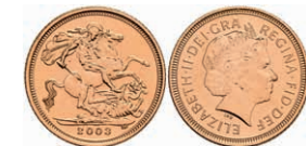
420 1/2 Sovereign, 2003, Elisabeth II., Fb. 455, st. 150,—