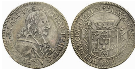
5252 1/2 Gulden (30 Kreuzer), 1673, Lothar Friedrich von Metternich-Burscheid, Slg. Walther 343, ss. 200,—