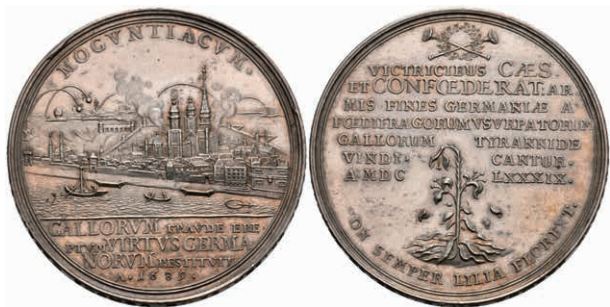
5409 Silbermedaille (Dm. ca. 49,50mm, ca. 44,79g), 1689, von P. H. Müller, auf die Wiedereinnahme der Stadt. Av: Ansicht der unter Beschuss stehenden Stadt, im Abschnitt darunter 4 Zeilen Schrift. Rev: 7 Zeilen Schrift, darüber zwei gekreuzte Posaunen, darunter geknickte Lilie. Slg. P. A. 850/853, Slg. Walther 743, Felder etwas poliert, kl. Kratzer, vz. (Abbildung auf 84% verkleinert) 1000,—