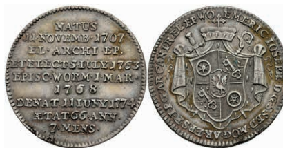
5362 1/3 Taler, 1774, Emmerich Joseph von Breitbach-Bürresheim, auf seinen Tod. Slg. Walther 626, Schrötlingsfehler am Rand, ss-vz. 150,—

Bitte geben Sie realistische Gebote ab! Gebote deutlich unter Metallwert sind praktisch chancenlos und für alle Seiten Zeitverschwendung!