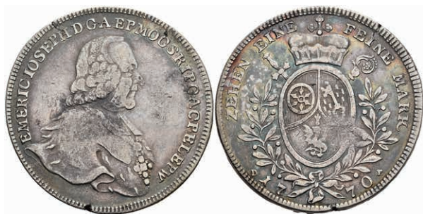
5358 Taler, 1770, Emmerich Joseph von Breitbach-Bürresheim, Dav. 2428, Slg. Walther 619, Schrötlingsfehler am Rand, schöne Patina, ss. 150,—