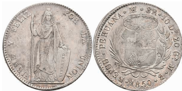
464 8 Reales, 1850, Lima, MB, Roped edge, KM 142.10, kl. Rf., vz. 400,—