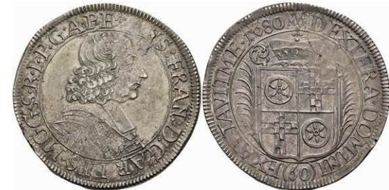
5277 Gulden (60 Kreuzer), 1680, Anselm Franz von Ingelheim, Dav. 657, Slg. Walther 400, Prägeschwäche, schöne Patina, vz. 250,—