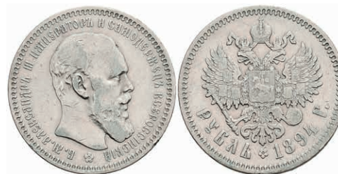
516 Rubel, 1894, Alexander III., St. Petersburg, Bitkin 78, kl. Rf., ss. 80,—