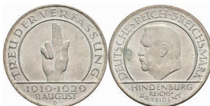
294 3 Reichsmark, 1929, Schwurhand, D, vz-st. J. 340 30,—