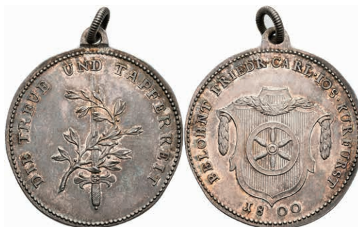
5459 Friedrich Karl Joseph von Erthal, gehenkelte Tapferkeitsmedaille (Dm. 35,70mm, ca. 15,18g), Silber, 1800, unsign., für den Kurmainzer Landsturm in den Gefechten bei Aschaffenburg. Av: Schwert und Lorbeerzweig, darum Umschrift. Rev: Wappen, darum Umschrift. Slg. P. A. 797, Slg. Walther 673, kl. Kratzer, vz-st. Sehr selten! 800,—