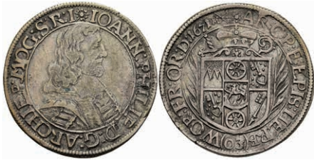
5247 1/2 Gulden (30 Kreuzer), 1671, Johann Philipp von Schönborn, Slg. Walther 327, ss. 200,—