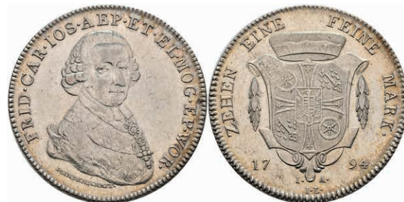
5374 Taler, 1794, Friedrich Karl Joseph von Erthal, Dav. 2430, Slg. Walther 648, ss-vz. 350,—