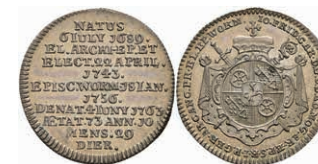
5344 Groschen, 1763, Johann Friedrich Karl von Ostein, auf seinen Tod, Slg. Walther 526, st. 250,—

Alle Einzellose und Zertifikate/Gutachten sind unter www.rhenumis.de farbig abgebildet!