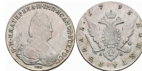
494 Rubel, 1793, Katharina II., St. Petersburg, Bitkin 262, ss. 200,—