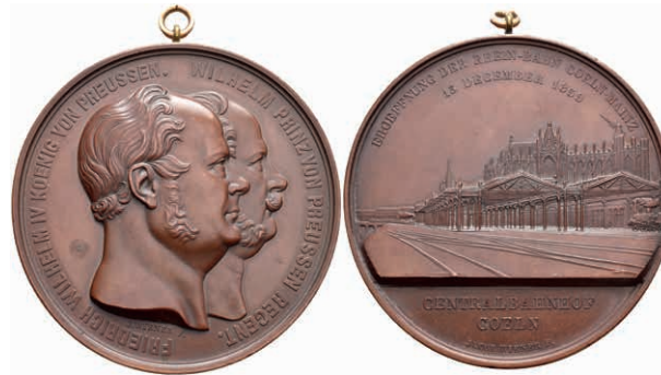
635 Köln, Friedrich Wilhelm IV., Bronzemedaille (Dm. ca. 70mm, 166,27g), 1859, von J. Wiener, auf die Eröffnung der Rheinbahn. Av: Doppelportrait nach rechts, darum Umschrift. Rev: Ansicht des Kölner Hauptbahnhofs, im Abschnitt darunter 2 Zeilen Schrift. Weiler 2473, Slg. Marienburg 5547, gehandelt, vz. (Abbildung auf 58% verkleinert) 100,—