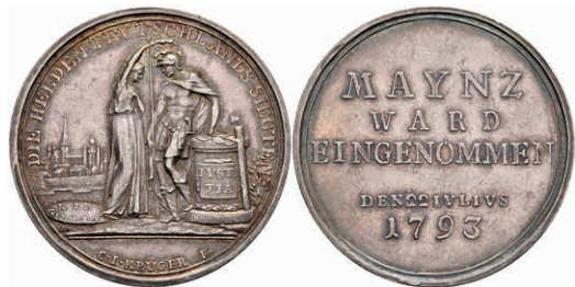
5455 Silbermedaille (Dm. ca. 36mm, ca. 14,14g), 1793, von Krüger, auf die Rückeroberung der Stadt. Av: Germania bekrönt Krieger. Rev: 5 Zeilen Schrift. Slg. P. A. 760, Slg. Walther 860, f. vz. 150,—