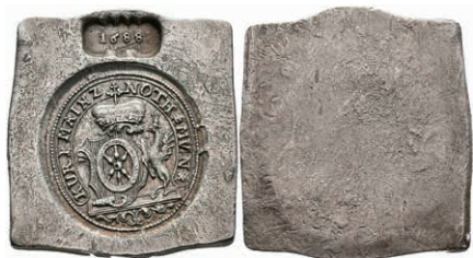
5280 Klippe (24,12g), 1688, Bäckersche Fälschung, Hill 352, Brause/Mansfeld Tf. 17, Nr. 3, ss. 100,—