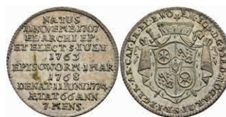
5360 1/12 Taler, 1774, Emmerich Joseph von Breitbach-Bürresheim, auf seinen Tod, Slg. Walther 628, vz. 80,—