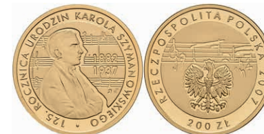
476 200 Zloty, Gold, 2007, 125. Geburtstag von Karol Szymanowski, ohne Kapsel, PP. 600,—