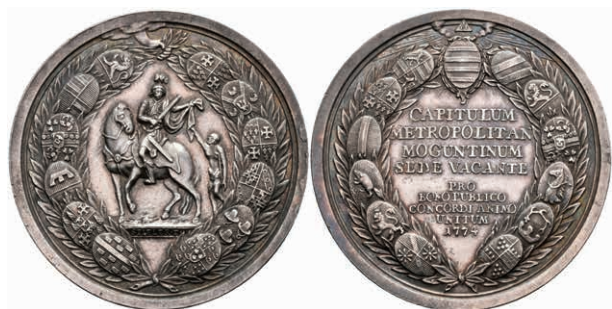
5447 Silbermedaille (Dm. ca. 52,20mm, ca. 43,62g), 1774, von A. F. Stieler, Sedisvakanz. Av: St Martin zu Pferd, den Mantel mit einem Bettler teilend, darum ein Lorbeer-Wappenkranz. Rev: 9 Zeilen Schrift, darum Lorbeer-Wappenkranz. Slg. P. A. 754, Slg. Walther 639, wz. Bohrstelle am Rand, ss-vz. (Abbildung auf 80% verkleinert) 400,—