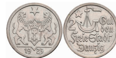
317 Danzig, 2 Gulden, 1923, Kogge, kleine Kratzer, vz. J. D8 100,—

Alle Einzellose und Zertifikate/Gutachten sind unter www.rhenumis.de farbig abgebildet!