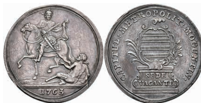
5339 1/4 Schautaler, 1763, Sedisvakanz, Slg. P. A. 708, Slg. Walther 591, kl. Rf., Stempelfehler, ss. 200,—