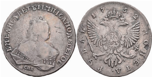
487 Rubel, 1752, Elisabeth, St. Petersburg, Bitkin 269, Kratzer, ss. 150,—