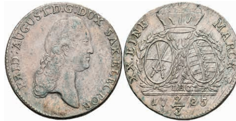
123 2/3 Taler, 1785, Friedrich August III., IEC, Kahnt 1105, Justierspuren, ss-vz. 70,—