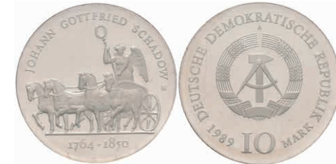
371 10 Mark, 1989, Johann Gottfried Schadow, in Kapsel eingeschweißt, PP. J. 1629. 100,—