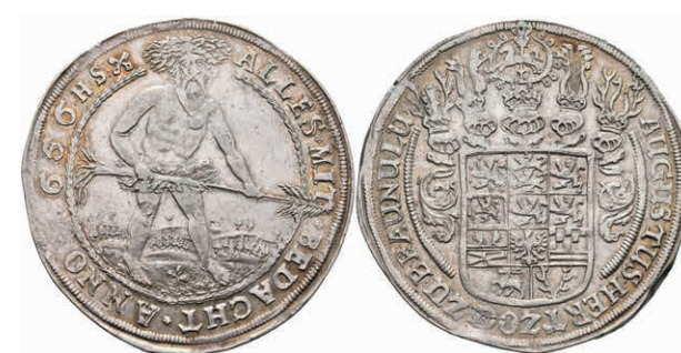
77 Taler, 1663, August der jüngere, Hausknechtstaler, Welter 822, Dav. 6341, kl. Rf., ss+. (Abbildung auf 93% verkleinert) 200,—