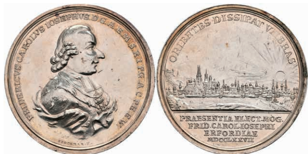
5448 Friedrich Karl Joseph von Erthal, Silbermedaille (Dm. ca. 47,15mm, ca. 36,22g), 1777, von Stockmar, auf den Besuch in Erfurt. Av: Brustbild nach rechts, darum Umschrift. Rev: Stadtansicht, im Abschnitt darunter 4 Zeilen Schrift. Slg. P. A. 760, Slg. Walther 674, kl. Kratzer, vz. (Abbildung auf 88% verkleinert) 250,—