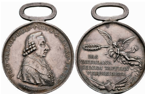
5458 Friedrich Karl Joseph von Erthal, tragbare Tapferkeitsmedaille (Dm. ca. 38,60mm, ca. 17,02g), Silber, o.J. (1795), von Lindenschmit. Av: Brustbild nach rechts, darum Umschrift. Rev: Genius auf Wolken nach links, darunter "4 Zeilen Schrift". Slg. 654, Slg. P. A. 801, Randfehler, ss-vz. Sehr selten! 800,—