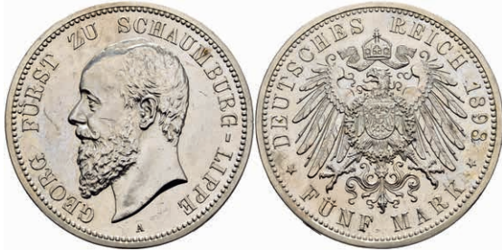
208 5 Mark, 1898, Georg, Kratzer, vz-st. J. 165 600,—