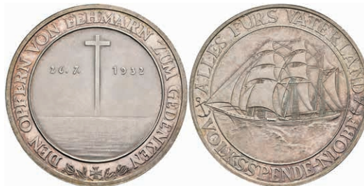
735 Silbermedaille, (Dm. ca. 36mm, ca. 21,80g), 1932, unsign., auf den Untergang des Segelschulschiffes "Niobe". Av: Schiff, darum Umschrift. Rev: Kreuz zwischen Daten, darum Umschrift. Vz-st. 70,—