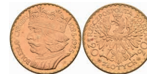
473 20 Zloty, Gold, 1925, Boleslaw I., Fb. 115, roter Fleck, vz. 500,—