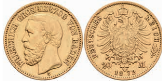
220 20 Mark, 1872, Friedrich I., ss. J. 184 280,—