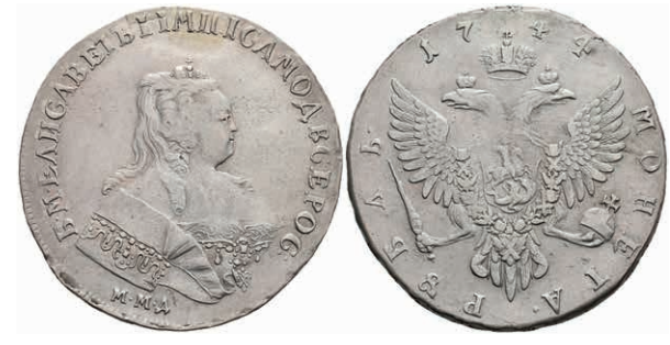
486 Rubel, 1744, Elisabeth, Moskau, Roter Münzhof, Bitkin 114(R1), Hsp., f. ss. 150,—