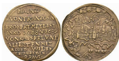
5412 Æ-Jeton (Dm. ca. 29,70mm, ca. 4,25g), 1689, unsign., auf die Wiedereinnahme der Stadt. Av: Ansicht der unter Beschuss stehenden Stadt. Rev: 9 Zeilen Schrift. Slg. P. A. 855, Slg. Walther -, ss. 70,—