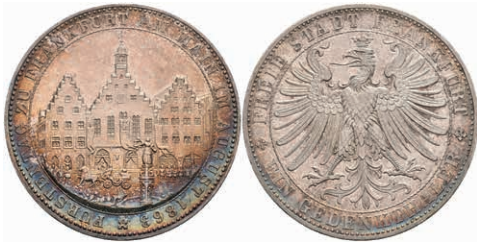
162 Taler, 1863, Fürstentag, AKS 45, J. 52, kleine Randfehler, vz. 100,—