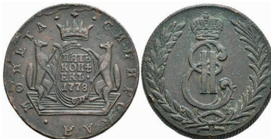
491 5 Kopeken, 1778, Katharina II., Suzun, Bitkin 1082, Randfehler, ss. 50,—