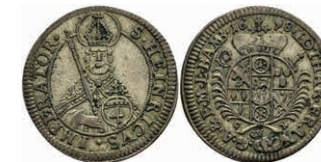
5313 Batzen (4 Kreuzer), 1698, Lothar Franz von Schönborn, Slg. P. A.-, Slg. Walther -, ss. 30,—