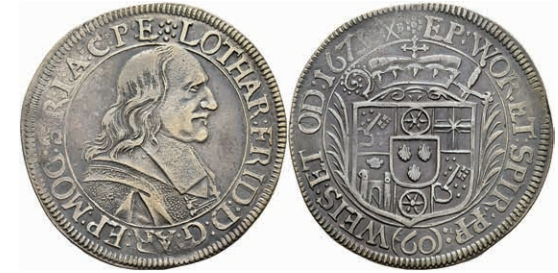
5254 Gulden (60 Kreuzer), 1673, Lothar Friedrich von Metternich-Burscheid, Dav. 648, Slg. Walther 341, ss. 200,—