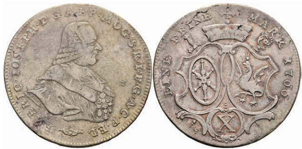
5352 Taler, 1766, Emmerich Joseph von Breitbach-Bürresheim, Dav. 2425, Slg. Walther 601, Schrötlingsfehler, ss. 150,—