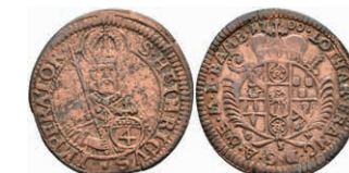
5314 Batzen (4 Kreuzer), 1700, Kupferabschlag, Lothar Franz von Schönborn, Slg. P. A.-, Slg. Walther -, ss. Sehr selten! 100,—