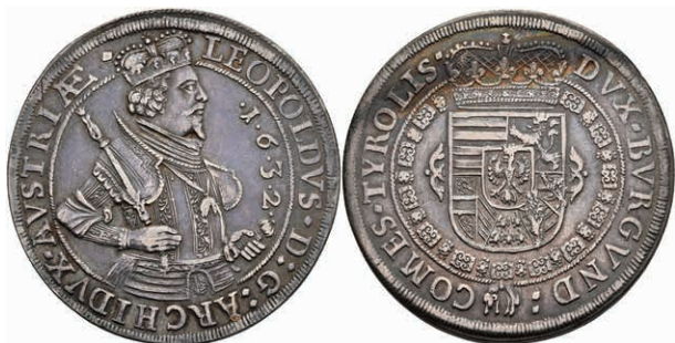
48 Taler, 1632, Leopold V., Hall, Dav. 3338, Voglhuber 183/IV, ss. 120,—