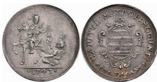
5333 1/8 Schautaler, 1743, Sedisvakanz, Slg. Walther 511, Slg. P. A. 670, schöne Patina, vz. Sehr selten! 500,—