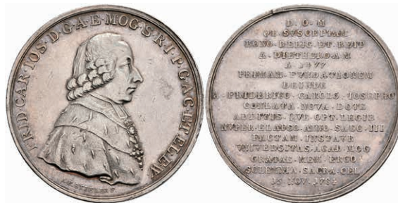
5449 Friedrich Karl Joseph von Erthal, Silbermedaille (Dm. ca. 39,20, ca. 29,18g), 1784, von Stieler, auf das 300-jährige Jubiläum der Universität Mainz. Av: Brustbild nach rechts, darum Umschrift. Rev: 16 Zeilen Schrift. Slg. P. A. 765, Slg. Walther 644, kl. Kratzer, ss-vz 150,—