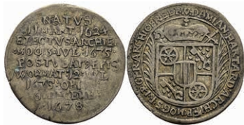
5270 1/8 Taler, 1678, Damian Hartard von der Leyen, auf seinen Tod, Slg. Walther 361, ss. Selten! 250,—