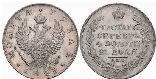
499 Rubel, 1823, Alexander I., St. Petersburg, Bitkin 137, vz. 200,—