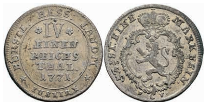
88 1/4 Taler, 1771, Friedrich II., Müller 2746, ss 30,—