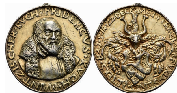
5398 Vergoldete Silbermedaille (Dm. ca. 42,20mm, ca. 32,06g), 1574, un-sign., auf den 82. Geburtstag von Friedrich Kuch. Av: Brustbild von vorn, darum "FRIDERCVS•KVCH•MAINTZISCHER•KVCH". Rev: Wappen, darum Umschrift. Slg. Walther -, Randfehler, ss. 400,—