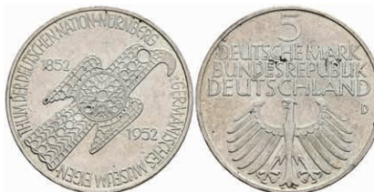
323 5 Mark, 1952, Germanisches Museum, vz. J. 388 200,—