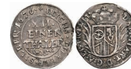
5264 1/12 Taler, 1676, Damian Hartard von der Leyen, Slg. P. A. -, Slg. Walther -, unediert?, Randfehler, ss. 100,—