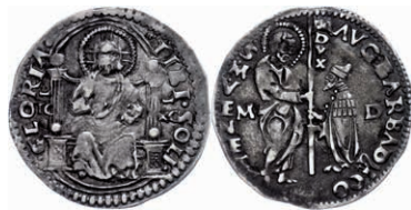
427 Venedig, Marcello (1/2 Lira), o.J. (1486-1501), Agostino Barbarigo, MD, ss. 120,—