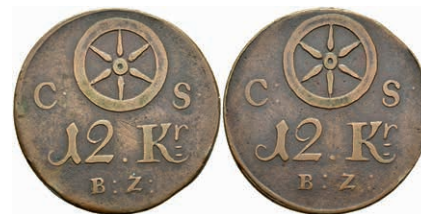
5472 Brückenzollmarke zu 12 Kreuzer, Kupfer, o.J. (18./19. Jh.). Av: Rad zwischen "C - S", darunter 12. Kr. / B.Z.". Rev: Gleich Avers. Slg. Walther 786, ss. 30,—