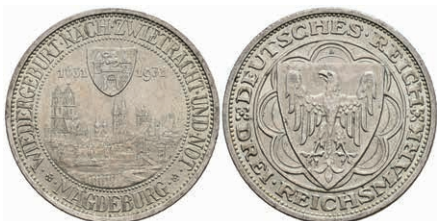
304 3 Reichsmark, 1931, Magdeburg, kl. Rf., vz. J. 347 100,—