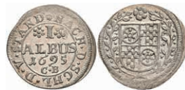
5309 1 Albus, 1695, Anselm Franz von Ingelheim, Slg. Walther 441, vz-st. 100,—