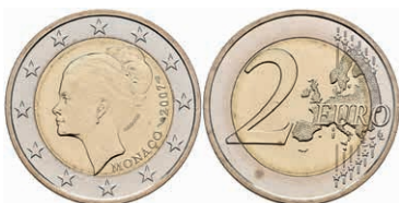
440 2 Euro, 2007, Grace Patricia Kelly zum 25. Todestag, KM 186, in Ausgabeschatulle, kl. Flecken, vz-st. 2800,—