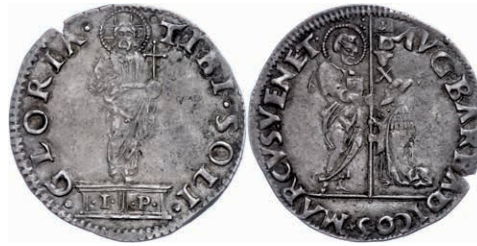
428 Venedig, Mocenigo (Lira), o.J. (1486-1501), Agostino Barbarigo, IP, Randfehler, ss-vz. 200,—