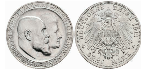
217 3 Mark, 1911, Wilhelm II., zur Silbernen Hochzeit, Variante mit hohem Querstrich im Buchstaben "H" von Charlotte, vz-st. J. 177b 400,—