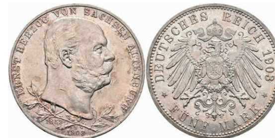
204 5 Mark, 1903, Ernst I., zum 50jährigen Regierungsjubiläum, kl. Kr., kl. Rf., vz. J. 144. 200,—