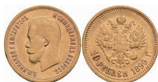
514 10 Rubel, Gold, 1899, Nikolaus II., Fb. 179, kl. Rf., ss. (Abbildungen siehe Onlinekatalog) 450,—