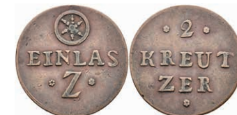
5477 Einlassmarke zu 2 Kreuzer, Kupfer, o.J. Av: 2 zwischen zwei Rosetten, darunter "KREUT / ZER", darunter Rosette. Rev: Rad, darunter "EINLAS" und "Z" zwischen zwei Rosetten. Slg. Walther 772, ss. 30,—