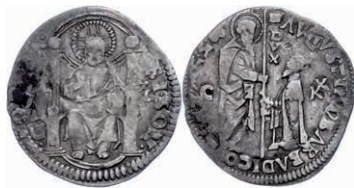
426 Venedig, Marcello (1/2 Lira), o.J. (1486-1501), Agostino Barbarigo, CK, Doppelschlag, s-ss. 100,—