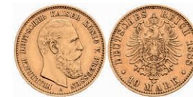
252 10 Mark, 1888, Friedrich III., kl. Kratzer, ss, J. 247. 170,—