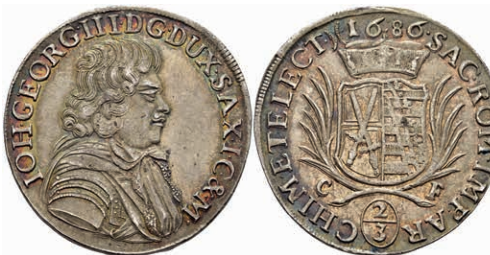
115 2/3 Taler, 1686, Johann Georg III., CF, Dav. 808, Kahnt 588, Hsp., ss-vz. 80,—