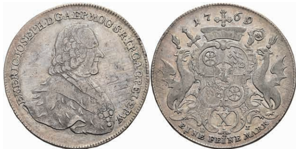
5356 Taler, 1769, Emmerich Joseph von Breitbach-Bürresheim, Dav. 2427, Slg. Walther 617, leicht justiert, ss+. 150,—