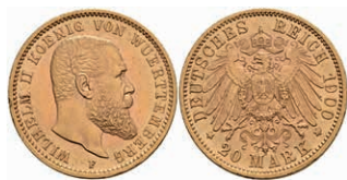
261 20 Mark, 1900, Wilhelm II., kl. Rf., f. vz. J. 296 350,—