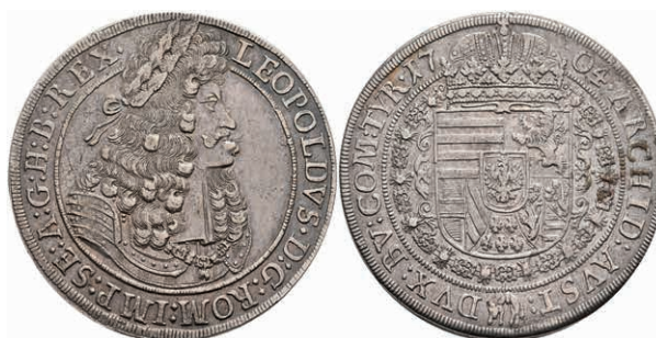
54 Taler, 1704, Leopold I., Hall, Voglhuber 221/7, Herinek 652, Rand bearbeitet, wz. Schröttingsfehler, ss. 120,—