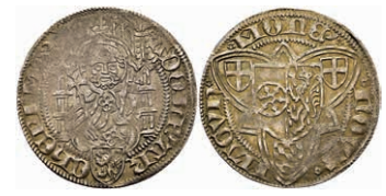
5202 Weißpfennig, o.J. (1461-1475), Adolf II. von Nassau, Slg. P. A. 189 var., ss. 80,—