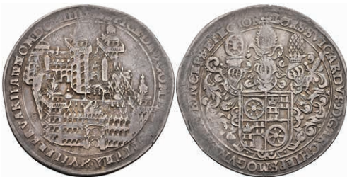
5227 1/4 Taler, 1614, Johann Schweickhardt von Kronberg, auf die Einweihung des Aschaffener Schlosses. Slg. Walther 228, schöne Patina, ss. Sehr selten! 1000,—