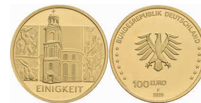
337 100 Euro, 2020, Einigkeit, mit Zertifikat in Ausgabeschatulle, st. 750,—