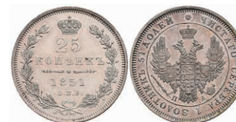
510 25 Kopeken, 1851, Nikolaus I., St. Petersburg, Bitkin 302, vz. 70,—

Alle Einzellose und Zertifikate/Gutachten sind unter www.rhenumis.de farbig abgebildet!