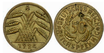
263 50 Reichspfennig, 1924, A, Schrötlingsfehler, ss. J. 318 400,—