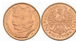
472 10 Zlotych, Gold, 1925, Boleslaw I., Fb. 116, vz-st. 500,—