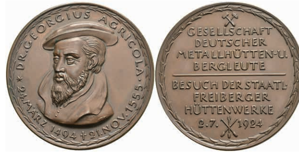
720 Sachsen, Bronzemedaille (Dm. ca. 38,74g, ca. 45mm), 1924, von Hörnlein, auf den Besuch der staatlichen Freiburger Hüttenwerke am 2. Juli. 1924. Av: Brustbild Georgius Agricola halblinks, darum Umschrift. Rev: 7 Zeilen Schrift. St. Selten! Auflage nur 51 Stück. (Abbildung auf 92% verkleinert) 120,—