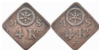
5495 Brückenzollmarke zu 4 Kreuzer, Kupfer, o.J. Av: Rad zwischen "M. - S.", darunter "4. Kr. / B. Z.". Rev: Gleich Avers. Slg. Walther -, ss. 50,—