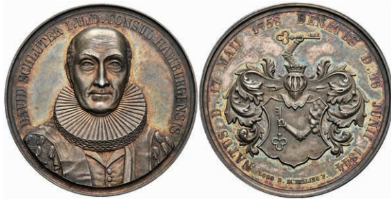
630 Hamburg, Silbermedaille (Dm. ca. 38,90mm, ca. 20,70g), 1844, sign. Loos D. Schilling F., Tod des Bürgermeisters David Schlüter. Av: Brustbild von vorn, darum Umschrift. Rev: Wappen, darum Umschrift. Schöne Patina, vz-st. 80,—