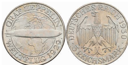
296 3 Reichsmark, 1930, F, Zeppelin, f. st. J. 342 50,—