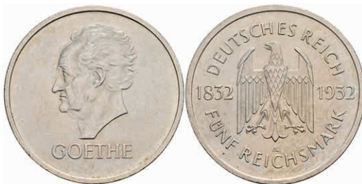
311 5 Reichsmark, 1932, A, Goethe, wz. Rf., vz. J. 351 1700,—