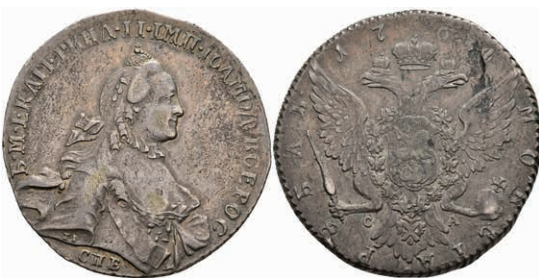
489 Rubel, 1764, Katharina II., St. Peterburg, Bitkin 186, Schrötlingsfehler, ss. 150,—