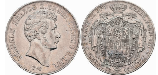
147 Doppeltaler, 1843, Wilhelm, AKS 72, kl. Rf. und Kr., ss. 150,—