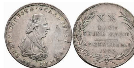
5506 1/2 Taler, 1809, Karl Theodor von Dalberg, AKS 8, J. 5, Slg. Walther 700, kl. Einriss, ss. 50,—