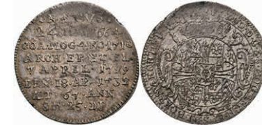
5327 1/8 Taler, 1732, Franz Ludwig von Pfalz-Neuburg, auf seinen Tod, Slg. Walther 496, Prägeschwäche, vz. 250,—