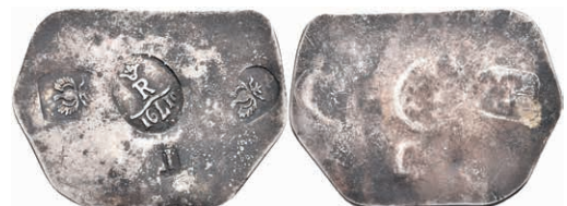
90 Notklippe zu 1 Taler (3,72g), 1610. Vier Stempel auf Silberplatte. Brause/Mansfeld -, ss. Vermutlich spätere Anfertigung! 100,—