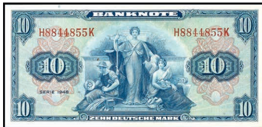
927 10 Deutsche Mark 1948, Kenn.- Bst. H/ Serie K, Ro. 238, Erh. I. (Abbildung auf 50% verkleinert) 300,—