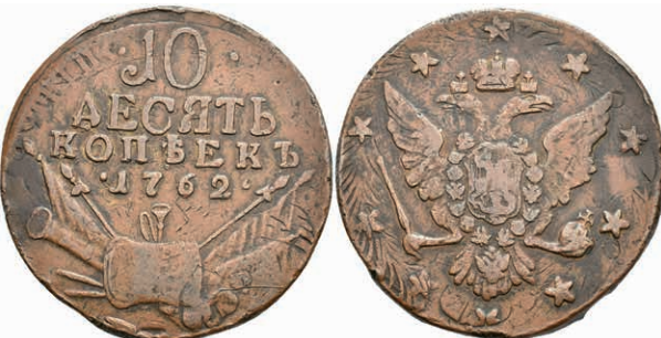
488 10 Kopeken, 1762, Peter III., Bitkin 17, Randfehler, s-ss. (Abbildung auf 96% verkleinert) 200,—