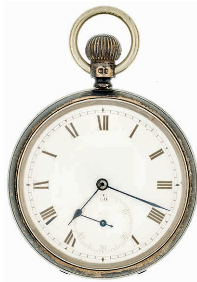
1309 Schwere Taschenuhr, ca. 1914. 925er Silber, punziert, schweizer Uhrwerk, kleine Sekunde, Handaufzug. emailliertes Ziffernblatt, römische Ziffern, blaue Zeiger. Innendeckel aus Silber, punziert, funktionstüchtig. 118,54g, ca. 50,8mm. 100,—