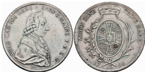
5383 Taler, 1796, Friedrich Karl Joseph von Erthal, Dav. 2435, Slg. Walther 671, ss. 150,—