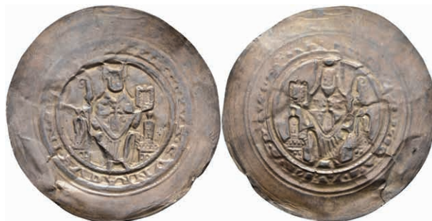
5180 Brakteat (0,71g), Konrad von Wittelsbach, 1183-1200. Thronender Erzbischof mit Kreuzstab und Buch von vorn. Fd von Seega 197, Fd von Erfurt 8, winzige Löcher, ss. (Abbildung auf 95% verkleinert) 400,—

Goldmünzen ab 1800 sowie Goldbarren sind als Anlagegold ggf. umsatzsteuerfrei (auch für das Aufgeld), soweit der Zuschlagpreis inkl. Aufgeld und Losgebühr nicht höher als der Goldwert + 80% ist.