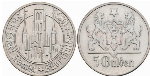
318 Danzig, 5 Gulden, 1923, Marienkirche, kl. Kr., wz. Rf., ss-vz. J. D9 180,—