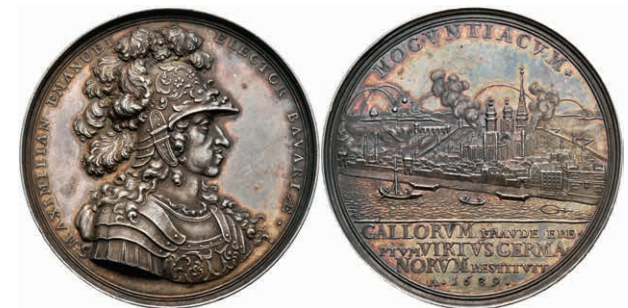
5408 Silbermedaille (Dm. ca. 49,50mm, ca. 44,61g), 1689, von P. H. Müller, auf die Einnahme der Stadt. Av: Brustbild Maximilian II. Emanuel nach rechts, darum Umschrift. Rev: Ansicht der unter Beschuss stehenden Stadt, im Abschnitt darunter 4 Zeilen Schrift. Randschrift. Slg. P. A. 851, Slg. Walther -, wz. Rf., schöne Patina, vz. (Abbildung auf 85% verkleinert) 1500,—