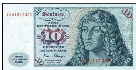
942 10 Deutsche Mark, 2.1.1980, Austauschnote Serie YE/C Ro. 281b. Erh. I (Abbildung auf 50% verkleinert) 200,—