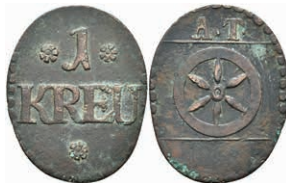
5487 Tormarke zu 1 Kreuzer, Kupfer, o.J. Av: 1 zwischen zwei Rosetten, darunter "KREU" und Rosette. Rev: Rad darüber "A. T.". Slg. Walther 779, ss. 30,—