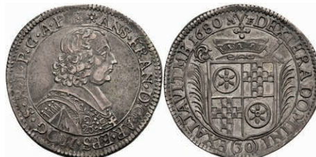
5275 1/2 Gulden (30 Kreuzer), 1680, Anselm Franz von Ingelheim, Slg. Walther 401, ss-vz. Selten! 500,—