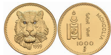
444 1000 Tugrik, Gold, 1999, Tiger, Fb. 43, mit Zertifikat, PP. Auflage nur 1000 Stück. 200,—

443 2500 Tugrik 1995, Transsibirische Eisenbahn, 5 Unzen Silber, KM 102, in Kapsel (Randausbruch), leichte Patina, PP. 130,—