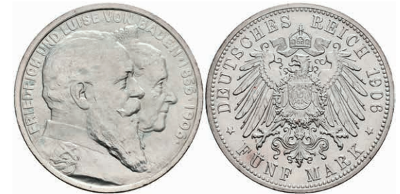
180 2 Mark, 1906, Friedrich I., zur goldenen Hochzeit, st. J. 35 130,—