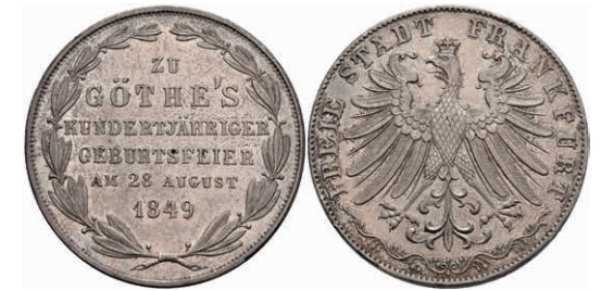
157 Doppelgulden, 1849, Goethe, AKS 41, J. 48, kleine Kratzer und Randfehler, vz. 100,—