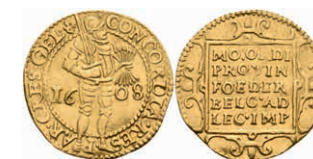
447 Gerlerland, Dukat, 1608, Fb. 237, ss. 300,—