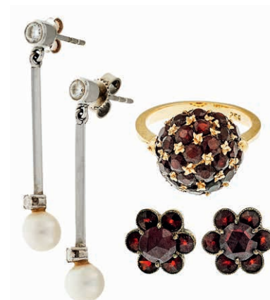
1254 Konvolut aus Ring mit Besatz 31 Granate, GG 18K (6,77g) Innen Dm 16 mm, Paar Ohrstecker blütenförmig mit 6 kleineren und 1 großen Granaten in Normgold (2,43g) und Paar Perlen-Ohrstecker mit Brillantenbesatz 585 WG (2,91g), ein Verschluss 925 Silber. (Abbildungen siehe Onlinekatalog) 450,—

Goldmünzen ab 1800 sowie Goldbarren sind als Anlagegold ggf. umsatzsteuerfrei (auch für das Aufgeld), soweit der Zuschlagpreis inkl. Aufgeld und Losgebühr nicht höher als der Goldwert + 80% ist.