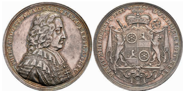
5429 Philipp Karl von Eltz-Kempenich, Silbermedaille (Dm. ca. 42,60mm, ca. 34,39g), 1740, von Becker. Av: Brustbild nach rechts, darum Umschrift. Rev: Wappen, darum Umschrift. Slg. P. A. 663, Slg. Walther -, kl. Rf. und Kr., ss-vz. 1000,—