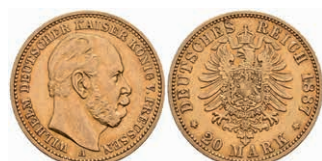
247 20 Mark, 1887, Wilhelm I., kl. Kr., ss. J. 246 300,—