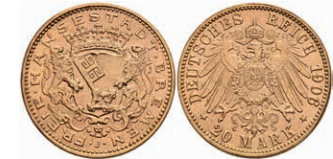
232 20 Mark, 1906, Rand stark bearbeitet, vz. J. 205 1200,—