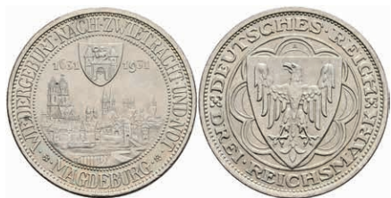
306 3 Reichsmark, 1931, Magdeburg, wz. Rf., vz+. J. 347 100,—