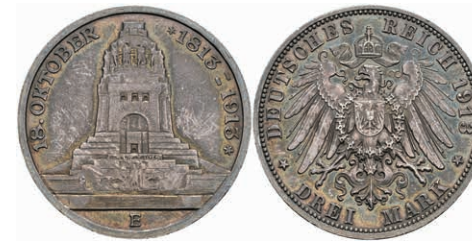
203 3 Mark, 1913, Volksheldenkmal, wz. Rf., schöne Patina, vz-st. J. 140. 30,—