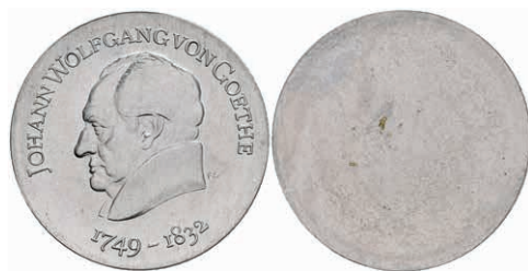
346 20 Mark, 1969, Johann Wolfgang von Goethe, einseitiger Aluminiumabschlag der Vorderseite, Kratzer auf Rückseite, st. Auflage nur 300 Stück. J. 1525A. 50,—