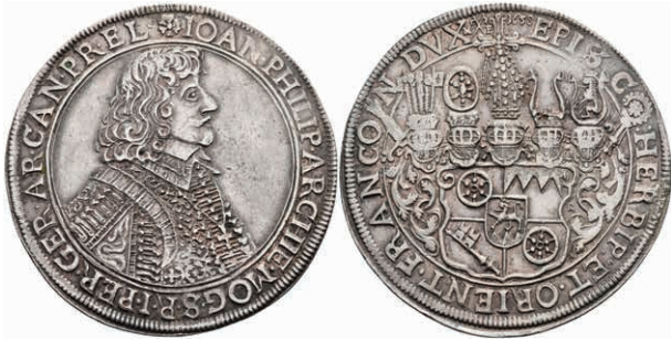
5246 Taler, 1658, Johann Philipp von Schönborn, Dav. 5568, Slg. Walther 310, Hsp., f. vz. (Abbildung auf 93% verkleinert) 800,—