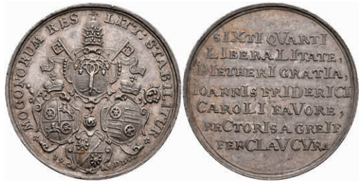
5438 Johann Friedrich Karl von Ostein, Silbermedaille (Dm. ca. 35,45mm, ca. 14,70g), 1746, auf das Stiftungsjubiläum. Av: 4 Wappen, darum Umschrift. Rev: 7 Zeilen Schrift. Slg. Walther -, Slg. P. A. 675, vz. Selten! 300,—