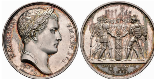
5460 Frankreich, Napoleon, Silbermedaille (Dm. ca. 40,60mm, ca. 38,77g), 1806, von Andrieu und Brenet, auf die Gründung des Rheinbundes. Av: Kopf nach rechts, darum Umschrift. Rev: Schwurszene. Bramsen 534, Slg. Julius 1587, f. st. 400,—