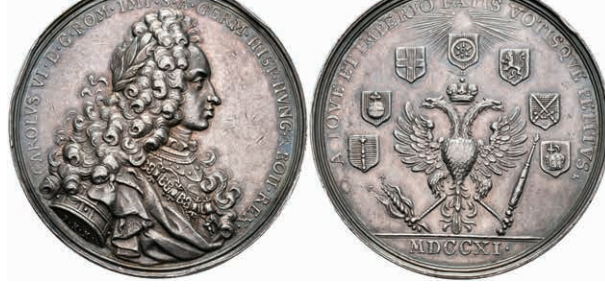
5424 RDR, Silbermedaille (Dm. ca. 44,59mm, ca. 48,70g), 1711, von P. H. Müller, auf die Krönung Karls VI. zum römischen Kaiser. Av: Brustbild des Kaisers nach rechts, Umschrift. Rev: Gekrönter Doppeladler mit Zepter und Blitz, darum 7 Wappen und Umschrift. Förschner 132, Forster 772, Slg. Mont. 1359, Randfehler, schöne Patina, ss. (Abbildung auf 82% verkleinert) 200,—