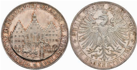
163 Taler, 1863, Fürstentag, AKS 45, vz-st. 150,—