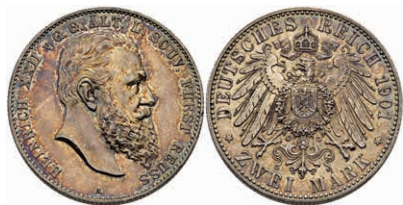
198 2 Mark, 1901, Heinrich XXII., kl. Rf., ss-vz. J. 118 150,—