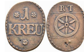
5489 Tormarke zu 1 Kreuzer, Kupfer, o.J. Av: 1 zwischen zwei Rosetten, darunter "KREU" und Rosette. Rev: Rad darüber "R.T.". Slg. Walther 780, ss. 30,—