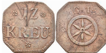
5485 Tormarke zu 12 Kreuzer, Kupfer, o.J. Av: 12 zwischen zwei Rosetten, darunter "KREU:", darunter Rosette. Rev: Rad, darüber "G. T.". Slg. Walther 775, Kratzer, ss. 80,—