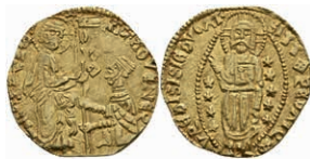
425 Imitation eines Zecchino (3,46g), vermutlich 14. Jh., ss-vz. 200,—