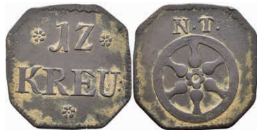
5482 Tormarke zu 12 Kreuzer, Kupfer, o.J. Av: 12 zwischen zwei Rosetten, darunter "KREU", darunter Rosette. Rev: Rad, darüber "N. T.". Slg. P. A. 896, ss. 80,—