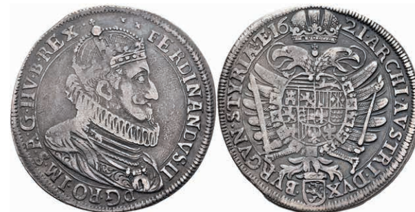
47 Taler, 1621, Ferdinand II., Graz, Dav. 3102, Herinek 413, Voglhuber 134/II Var., Avers etwas bearbeitet, ss. 150,—