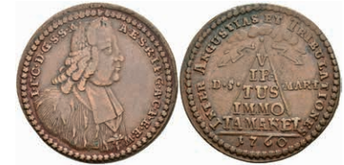
5443 Kupfermedaille (Dm. ca. 25,90mm, ca. 6,68g), 1760, unsign. Av: Brustbild Johann Friedrich Karl von Ostein nach rechts, darum Umschrift. Rev: Pyramide, darin in 5 Zeilen "V / IR / TUS / IMMO / TAMANET", darüber Wolke mit Blitzen, darum Umschrift. Slg. P. A. -, Slg. Walther -, ss. 100,—