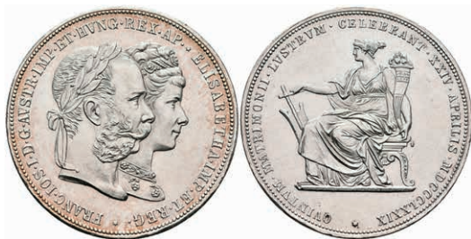
453 Doppelgulden, 1879, Franz Joseph I., zur Silberhochzeit, J. 369, kl. Rf., Kratzer, vz-st. 80,—