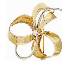
1279 Schleifenbrosche mit Zirkonia, 585 Gelb- und Weißgold, 3,55g, gemarkt "EH11", Größe ca 2,7x 2,8cm. 180,—

Goldmünzen ab 1800 sowie Goldbarren sind als Anlagegold ggf. umsatzsteuerfrei (auch für das Aufgeld), soweit der Zuschlagpreis inkl. Aufgeld und Losgebühr nicht höher als der Goldwert + 80% ist.