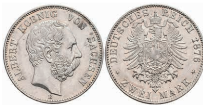
199 2 Mark, 1876, Albert, vz. J. 121 500,—