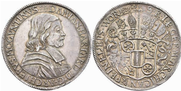
5268 Taler, 1676, Damian Hartard von der Leyen, Dav. 5562, Slg. Walther 357, schöne Patina, ss-vz. Sehr selten! (Abbildung auf 95% verkleinert) 4000,—