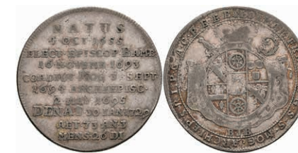
5317 1/4 Taler, 1729, Lothar Franz von Schönborn, auf seinen Tod, Slg. Walther 374, f. ss. 150,—