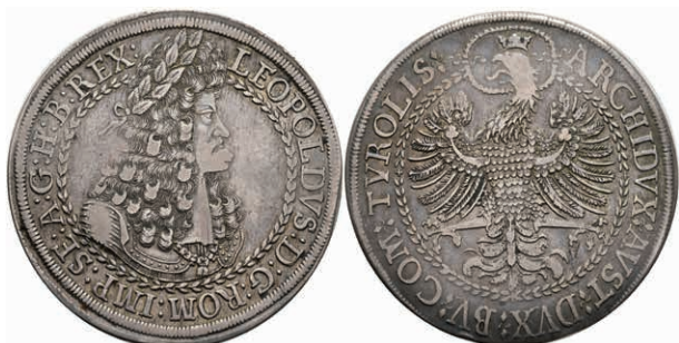
50 Doppeltaler, o.J. (1657-1705), Hall, Herinek 574, Dav. 3252, Randfehler, ss. (Abbildung auf 89% verkleinert) 500,—