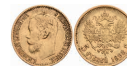
520 5 Rubel, Gold, 1898, Nikolaus II., St. Petersburg, Fb. 180, kl. Rf. und Kratzer, ss. 180,—