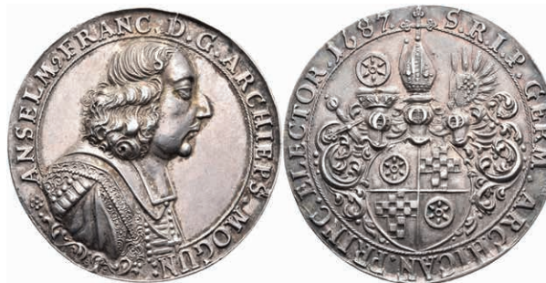
5404 Anselm Franz von Ingelheim, Silbermedaille (Dm. ca. 45,50mm, ca. 31,67g), 1687. Av: Brustbild nach rechts, darum Umschrift. Rev: Dreifach behelmtes Wappen, darum Umschrift. Slg. P. A. 570, Slg. Walther -, vz. (Abbildung auf 91% verkleinert) 1200,—