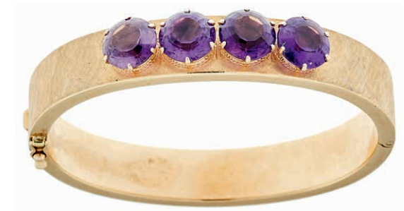
1272 Armreif im Stil des Art déco mit 4 rundfacettierte Amethyste, Österreich, 1. Hälfte 20. Jh., 585 Roségold gestempelt, zusätzlich zweifach amtliche Feingehaltspunze Österreich "Pferdekopf W" und Juwelierspunze, Dm 52,3x 66mm, 32,7g. 1000,—