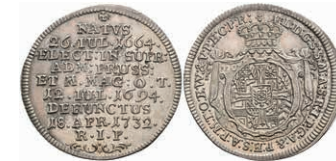
5328 Groschen, 1732, Franz Ludwig von Neuburg, auf seinen Tod, Slg. Walther 498, vz-st. Sehr selten! 200,—