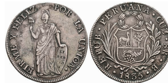
460 8 Reales, 1835, Cuzco, B, KM 142.5, ss 180,—