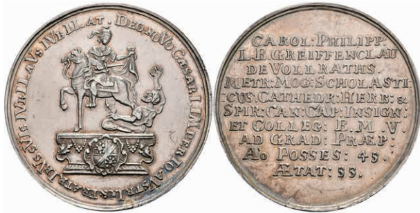
5437 Silbermedaille (Dm. ca. 43,20mm, ca. 27,61g), 1745, auf Karl Philipp von Greiffenklau-Vollraths und sein Jubiläum als Mainzer Domkanonikus. Av: St. Martin zu Pferd auf einem Postament nach links, den Mantel mit einem Bettler teilend, darum Umschrift. Rev: 10 Zeilen Schrift. Slg. P. A. 838, Slg. Walther 716, kl. Rf., f. vz. Exemplar der Sammlung R. Walther. Los 716 der 275. Auktion. Dr. Busso Peus, Frankfurt a.M., 1971. (Abbildung auf 97% verkleinert) 150,—