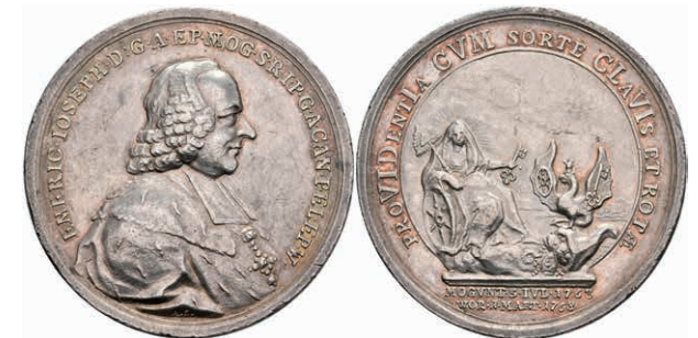
5444 Emmerich Joseph von Breitbach-Bürresheim, Silbermedaille (Dm. ca. 42,20mm, ca. 29,23g), 1768, von A. Stieler, auf die Bischof von Worms. Av: Brustbild nach rechts, darum Umschrift. Rev: Sitzende Vorsehung mit Zepter, Schlüssel und Rad, vor ihr der Breitbacher Basilisk mit Rad und Schlüssel auf seinen Flügeln. Slg. P. A. 736, Slg. Walther 609, kl. Rf., ss-vz. 250,—