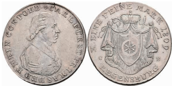
5508 Taler, 1809, Karl Theodor von Dalberg, AKS 7, J. 7, Slg. Walther 699, kl. Einriss, ss-vz. 250,—