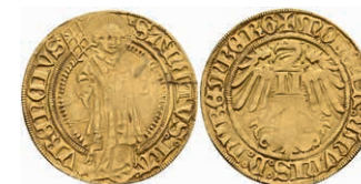
97 Goldgulden, o.J. (1469-1471), Kellner 4, Fb. 1801., Schrötlingsfehler am Rand, ss. 500,—