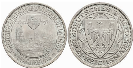
305 3 Reichsmark, 1931, Magdeburg, vz-st. J. 347 120,—