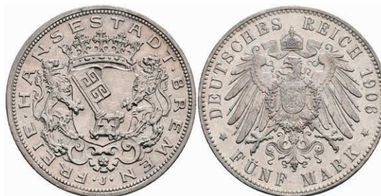
189 5 Mark, 1906, Stadtwappen, Rf., ss-vz. J. 60 150,—

Alle Einzellose und Zertifikate/Gutachten sind unter www.rhenumis.de farbig abgebildet! Dort sind auch 271 weitere Lose zu finden, die nicht im gedruckten Katalog, sondern nur im Internet zu finden sind!