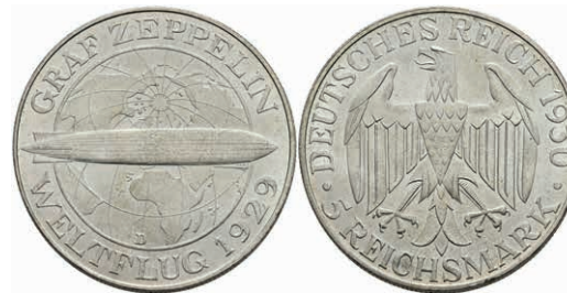
298 5 Reichsmark, 1930, D, Zeppelin, kl. Rf., vz+. J. 343 150,—