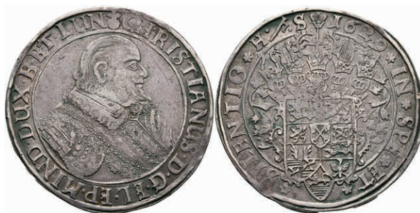
75 Taler, 1632, Christian, Bischof von Minden. Dav. 6475, Welter 924, kleine Schröttingsfehler, ss. 150,—