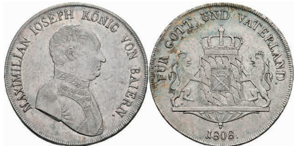
140 Taler, 1813, Maximilian I. Joseph, AKS 48, J. 13, ss-vz. 100,—