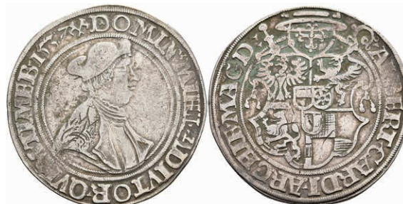
5139 Taler, 1537, Albrecht IV. von Brandenburg, Dav. 9433, ss. 450,—