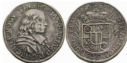
5260 1/2 Gulden (30 Kreuzer), 1675, Damian Hartard von der Leyen, Slg. Walther 354, ss. 250,—