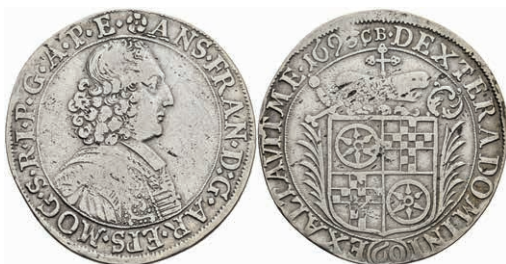
5307 Gulden (60 Kreuzer), 1693, Anselm Franz von Ingelheim, Dav. 658, Slg. Walther 429, Schrötlingsfehler, ss. Selten! 300,—