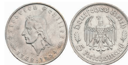
316 5 Reichsmark, 1934, Friedrich von Schiller, Kratzer, vz. J. 359 80,—