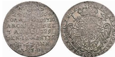
5324 1/4 Taler, 1732, Franz Ludwig von Pfalz-Neuburg, auf seinen Tod, Slg. Walther 495, ss-vz. 400,—