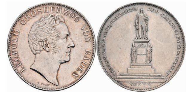
138 Doppeltaler, 1844, Carl Leopold Friedrich, Carl-Friedrich-Denkmal, AKS 110, J. 59, kl. Rf., ss. 150,—