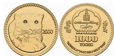
445 1000 Tugrik, Gold, 2000, Schneeleopard, mit Zertifikat, PP. Auflage nur 1000 Stück. 200,—