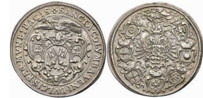
5513 Regensburg, Silberabschlag des Dukaten, 1641, auf den Friedenswunsch. Av: Friedenstaube nach links über Wappen, darum Umschrift. Rev: Doppeladler, darum Wappenkranz. Plato 168, ss. 100,—