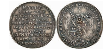
5320 Groschen, 1729, Lothar Franz von Schönborn, auf seinen Tod, Slg. Walther 476, vz. 130,—