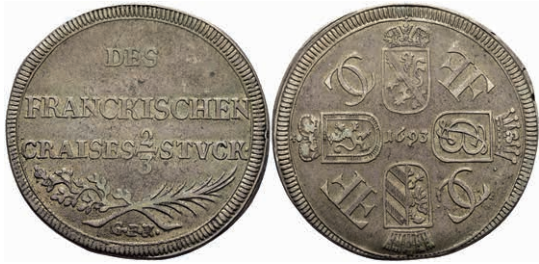
99 Fränkischer Kreis, 2/3 Taler, 1693, GFN, Nürnberg, Dav. 518, kl. Rf., ss. 100,—