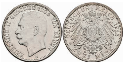
184 2 Mark, 1913, Friedrich II., vz. J. 38 250,—