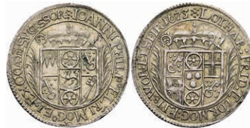
5251 1/10 Taler, 1673, Lothar Friedrich von Metternich-Burscheid, auf seine Inthronisation, Slg. Walther 339, ss-vz. Sehr selten! 500,—