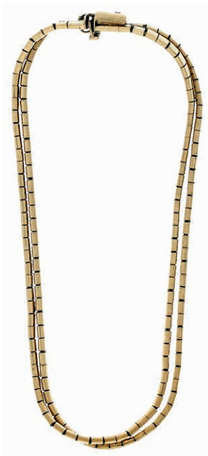
1275 Doppelreihiges Armband in 333 GG, flaches Glieder-Schlangenmuster, Kastenschloss mit Sicherheitsacht, Reparaturstelle, L= 20cm, 12,81g. 200,—