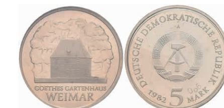
363 5 Mark, 1982, Goethes Gartenhaus, Probe, Nr. 66, in Kapsel verplombt, mit Zertifikat, PP. Sehr selten, Auflage nur 210 Stück. J. 1585P. 1500,—

Alle Einzellose und Zertifikate/Gutachten sind unter www.rhenumis.de farbig abgebildet!