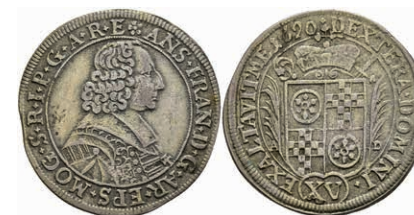
5289 15 Kreuzer, 1690, Anselm Franz von Ingelheim, Slg. Walther 450, ss. 100,—