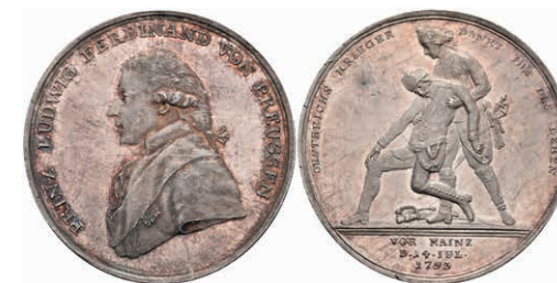
5453 Preußen, Friedrich Wilhelm II., Silbermedaille (Dm. ca., 34,80mm, ca. 14,56g), 1793, von A. Abramson, auf die Tapferkeit des Prinzen Friedrich Ludwig Christian. Av: Brustbild nach links, darum Umschrift. Rev: Der Prinz stützt einen österreichischen Soldaten, darum Umschrift. Slg. Walther -, Slg. Henckel 1995, kl. Kratzer, schöne Patina, vz-st. 400,—