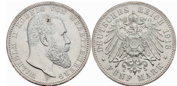
216 5 Mark, 1913, Wilhelm II., vz. J. 176 50,—