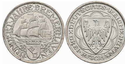
268 3 Reichsmark, 1927, Bremerhaven, kl. Rf., vz-st. J. 325 120,—