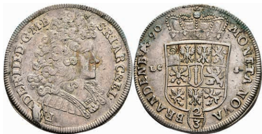
70 2/3 Taler, 1690, Friedrich III, Berlin, Dav. 270, Stempelfehler, ss-vz. 100,—