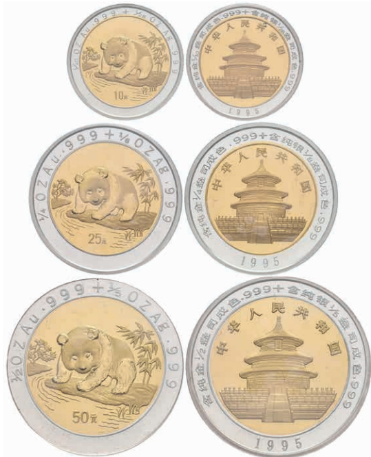
398 Bimetall Set zu 10, 25 und 50 Yuan, Gold/Silber, 1995, Panda. Jeweils in Kapsel verschleißt. Mit Zertifikat in Ausgabeschatulle. Auflage nur 2000 Sätze. 1500,—