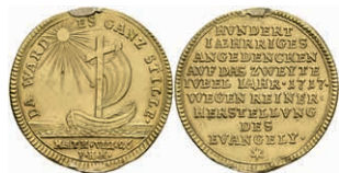
620 Goldmedaille (Dm. ca. 21,80mm, ca. 3,68g), 1717, von P. H. Müller, auf das 200jährige Reformationsjubiläum. Av: Schiff auf ruhiger See mit Kreuz als Mastbaum, darum "DA WARD ES GANZ STILLE". Rev: 9 Zeilen Schrift. Hsp., kl Druckstelle, wellig, Randfehler, ss. 300,—