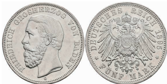
174 5 Mark, 1895, Friedrich I., kl. Kr. und Rf., vz-st. J. 29 700,—