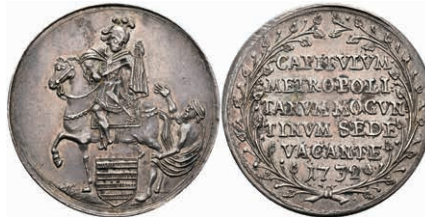
5323 1/4 Schautaler, 1732, Sedisvakanz, Slg. Walther 501, Hsp., f. vz. Exemplar der Sammlung R. Walther. Los 501 der 275. Auktion. Dr. Busso Peus, Frankfurt a. M., 1971 200,—