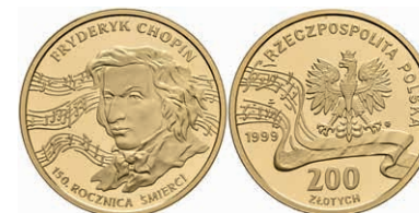
475 200 Zloty, Gold, 1999, 150. Todestag von Frederic Chopin, ohne Kapsel, kl. Flecken, PP. 600,—