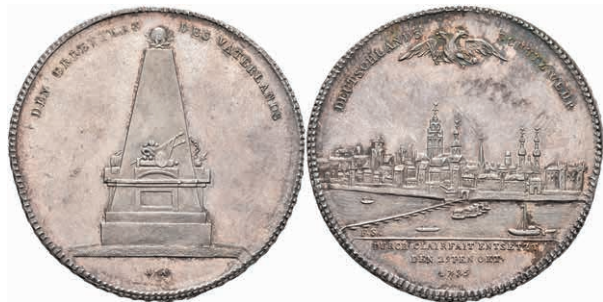
5381 Taler, 1795, auf den Entsat der von den Franzosen belagerten Stadt, Dav. 2434, Slg. Walther 661, wz. Kratzer, f. st. 2200,—