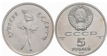
541 5 Rubel, Palladium, 1991, Russisches Ballett, Parchimowicz 227, wz. Flecken, st. 450,—