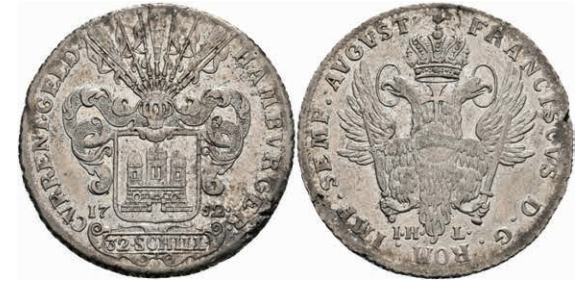
85 32 Schilling, 1752, mit Titel Franz I., Dav. 540, Gaedeckens 637, Schrötlingsfehler am Rand, ss-vz. 70,—