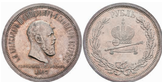
513 Rubel, 1883, Alexander III., St. Petersburg, auf seine Krönung, Bitkin 217, wz. Rf. und Kratzer, ss-vz. 250,—