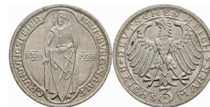
282 3 Reichsmark, 1928, Naumburg, kl. Rf., vz. J. 333 80,—