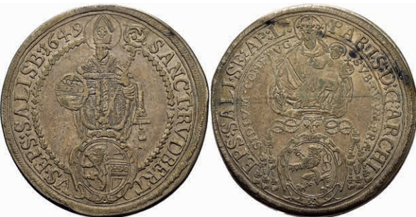
131 Taler, 1649, Paris Graf Lodron, Zöttl 1500, Probszt 1228, ss. 80,—