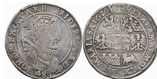
46 1/2 Taler (48 Kreuzer), 1620, Friedrich von der Pfalz, Kuttenberg, Herinek 20, Schrötlingsfehler, ss. 200,—