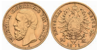
221 20 Mark, 1873, Friedrich I., kl. Rf., ss. J. 184 350,—