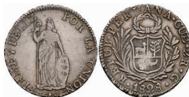
458 2 Reales, 1828, Cuzco, G, KM 141.2, ss. 50,—