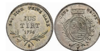
5379 5 Kreuzer, 1795, Friedrich Karl Joseph von Erthal, Slg. Walther 665, vz+. 50,—