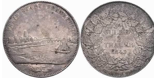
152 Doppeltaler, 1843, Stadtansicht, AKS 3, kleine Kratzer, ss-vz. 150,—