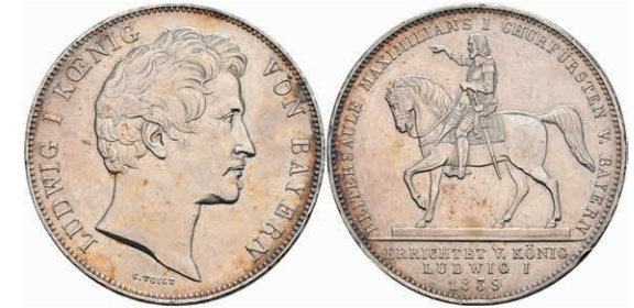
146 Geschichtsdoppeltaler, 1839, Ludwig I., Reiterstatue Maximilian I., AKS 100, kl. Rf., kl. Kr., ss-vz. 180,—