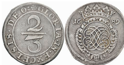
5287 2/3 Taler, 1689, geprägt unter französischer Belagerung, Dav. 660, Slg. Walther 737, ss. 800,—