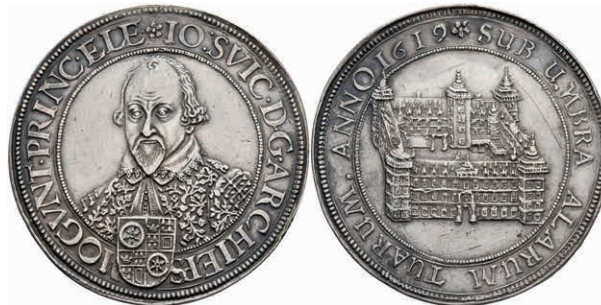
5229 Taler, 1619, Johann Schweickhardt von Kronberg, Dav. 5539, Slg. Walther 229, Hsp., Felder stellenweise bearbeitet, ss-vz. Sehr selten! Mit Unterlegzettel der Münzhandlung R. Kaiser, Frankfurt. (Abbildung auf 95% verkleinert) 2500,—