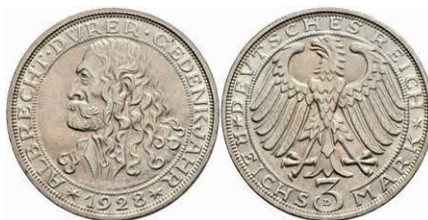
280 3 Reichsmark, 1928, Dürer, f. st. J. 332 300,—