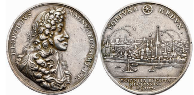
5407 Silbermedaille (Dm. ca. 42,70mm, ca. 32,82g), 1689, von G. Hautsch, auf die Einnahme der Stadt. Av: Büste Leopold I. nach rechts, darum Umschrift. Rev: Ansicht der unter Beschuss stehenden Stadt, im Abschnitt darunter 3 Zeilen Schrift. Slg. P. A. 846, Slg. Walther 747, Felder und Rand bearbeitet, ss. 150,—