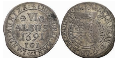
5298 6 Albus, 1691, Anselm Franz von Ingelheim, Slg. Walther 420, ss. Selten! 150,—