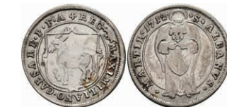
5315 Ritterstift St. Albern, Silberabschlag vom Goldgulden 1712, Slg. P. A.-, Slg. Walther -, ss. Selten! 300,—