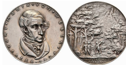
723 Silbermedaille (Dm. ca. 36mm, ca. 19,36g), 1926, von K. Goetz, auf die fünften Wartburger Maientage. Av: Büste Webers halbrechts, darum Umschrift. Rev: Menschengruppe im Wald, im Hintergrund auf dem Hügel die Wartburg. Kienast 396, Rand punziert, vz. 100,—