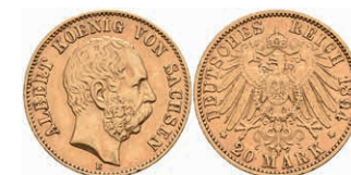
258 20 Mark, 1894, Albert, kl. Rf., ss. J. 264 350,—

Alle Einzellose und Zertifikate/Gutachten sind unter www.rhenumis.de farbig abgebildet!