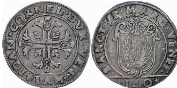
429 Venedig, Scudo, o.J. (1624-1629), Giovanni I. Corner, IAM, Dav. 4244, schöne Patina, ss. 250,—