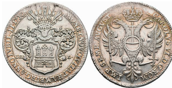
84 Taler, 1730, mit Titel Karl VI., auf die 200Jahrfeier der Augsburger Konfession, Dav. 2282, Gaedeckens 524, J. 52, kl. Kr., Prägeglanz, ss-vz. (Abbildung auf 93% verkleinert) 150,—