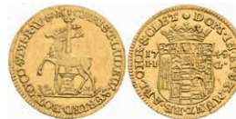
133 ½ Dukat, 1745, Christoph Ludwig II. und Friedrich Botho, Friedrich 1867, Fb. 3337, kl. Druckstellen, leicht wellig, f. vz. 800,—