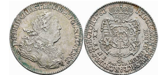
117 2/3 Taler, 1763, Friedrich Christian, Dresden, Dav. 831, Kahnt 1006, f. vz. 200,—