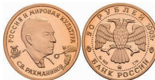
547 50 Rubel, Gold, 1993, S. Rahmaninow, Parchimowicz 1608, min. angelaufen, ohne Kapsel, PP. 300,—