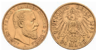
259 20 Mark, 1895, Alfred, kl. Rf., ss-vz. J. 272 2500,—