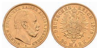
246 20 Mark, 1876, A, Wilhelm I., ss. J. 246. 340,—