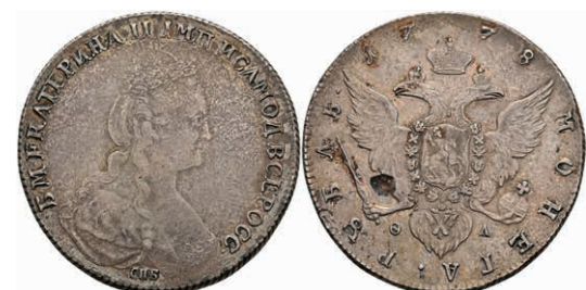
492 Rubel, 1778, Katharina II., St. Peterburg, Bitkin 226, Schrötlingsfehler, ss. 150,—