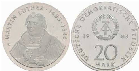
365 20 Mark, 1983, Martin Luther, in Hartplastik verplombt, PP. J. 1591. 180,—