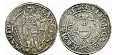
5137 Groschen, 1524, Albrecht IV. von Brandenburg, von Schrötter 183, ss. 180,—