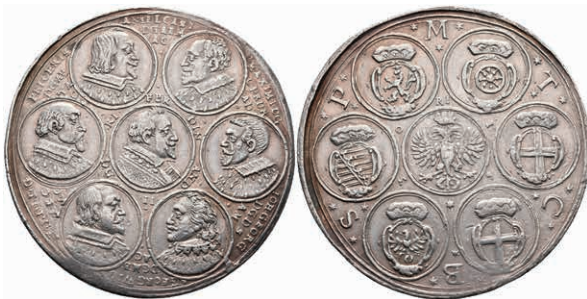
5402 RDR, Silbermedaille (Dm. ca. 40,80mm, ca. 25,84g), 1630, auf den Reichstag zu Regensburg. Av: Büste des Kaisers im Medaillon nach rechts, darum sechs weitere Medaillons. Rev: Gekrönter Doppeladler im Medaillon, darum sechs weitere Medaillons. Slg. P. A. 356, Slg. Mont. 766, Slg. Horsky 1605, kl. Rf., ss. 250,—