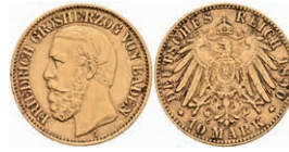
224 10 Mark, 1890, Friedrich I., kl. Rf., ss. J. 188 180,—