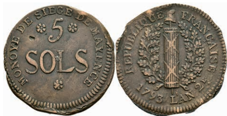
5371 5 Sols (22,79g), 1793, geprägt unter französischer Belagerung, Brause/Mansfeld Tf. 18, Nr. 10, Slg. P. A. 862, Slg. Walther 749, ss. 80,—