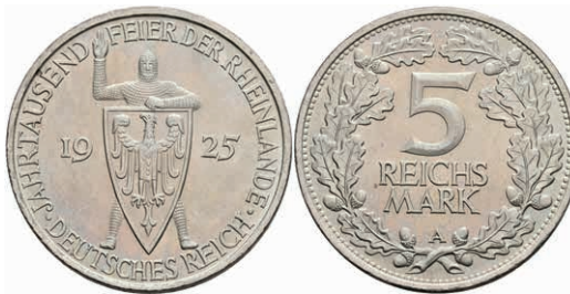
265 5 Reichsmark, 1925, A, Rheinlande, wz. Rf., vz-st. J. 322 70,—