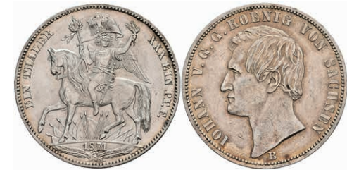
169 Taler, 1871, Johann, AKS 159, J. 132, wz. Rf., vz. 70,—