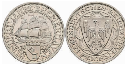
267 3 Reichsmark, 1927, Bremerhaven, kl. Flecken, leicht angelaufen, PP. J. 325 250,—