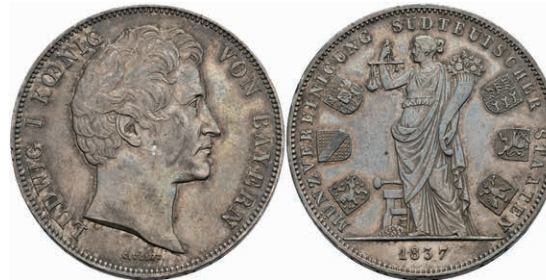
144 Geschichtsdoppeltaler, 1837, Ludwig I., Münzvereinigung süddeutscher Staaten, AKS 98, J. 66, Kratzer, kl. Rf., ss+ 220,—