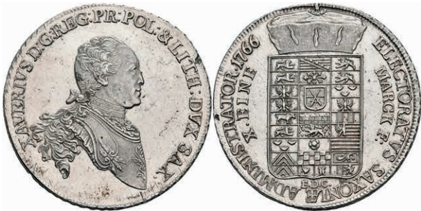
120 Taler, 1766, Xaver, Schnee 1055, Dav. 2678, kl. Schröttingsfehler am Rand, min. justiert, gereinigt, vz-st. 500,—