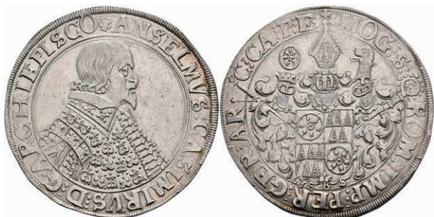
5237 Taler, 1636, Anselm Casimir von Umstadt, Dav. 5548, ss. (Abbildung auf 96% verkleinert) 500,—