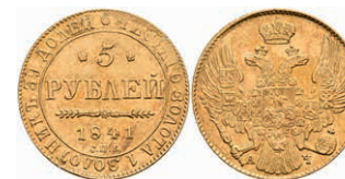
506 5 Rubel, Gold, 1841, Nikolaus I., St. Petersburg, Bitkin 18, Kratzer, ss. 400,—