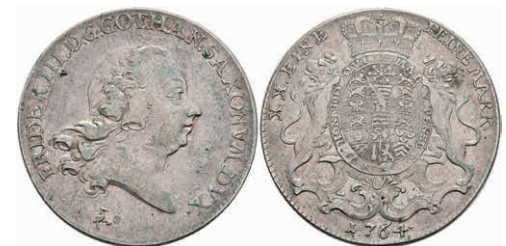
127 1/2 Taler, 1764, Friedrich III., Slg. Mersb. 3245, ss. 80,—