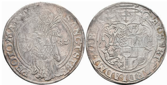
5135 Taler, 1542, Albrecht II. von Brandenburg, Dav. 9210, ss+. 400,—