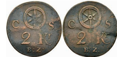
5474 Brückenzollmarke zu 2 Kreuzer, Kupfer, o.J. (18./19. Jh.). Av: Rad zwischen "C - S", darunter 2. Kr. / B.Z.". Rev: Gleich Avers. Slg. Walther 786, Knickspur, ss. 30,—