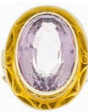
1245 Ring mit ovalfacettierten Amethyst, Mitte des 20. Jh., Gelbgold 585, 8,37 g, leichte Tragespuren, Amethyst Facettkanten berieben, Innendurchmesser 18,6 mm. Hochwertige Handarbeit. 270,—