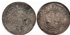
5179 Pfennig (0,66g), Christian von Buch, 1165-1183. Brustbild des Erzbischofs mit Krummstab und Buch von vorn. Rev: Kreuz, in den Winkeln jeweils eine Kugel. Slg. Walther -, Cappe -, kl. Schrötlingsriss, f. ss. Wohl unediert. Mit Unterlegzettel der Westfälischen Auktionsgesellschaft, Arnsberg. 1000,—