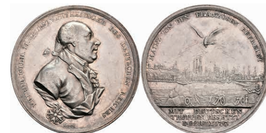
5454 Preußen, Friedrich Wilhelm II., Silbermedaille (Durchmesser ca. 37mm, 13,95g), 1793, von Loos, auf den Entsatz der Stadt. Brustbild nach rechts, darum Umschrift. Rev: Adler mit Blitzen über der Stadt, im Abschnitt darunter 3 Zeilen Schrift. Slg. Walther 761, Slg. P. A. 858, kl. Kr., vz. 80,—

Alle Einzellose und Zertifikate/Gutachten sind unter www.rhenumis.de farbig abgebildet!