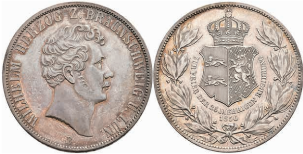
149 Doppeltaler, 1856, Wilhelm, 25jähriges Regierungsjubiläum, AKS 97, J. 252, ss-vz. 150,—