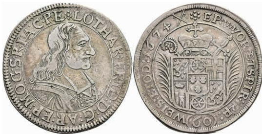
5257 Gulden (60 Kreuzer), 1674, Lothar Friedrich von Metternich-Burscheid, Dav. 648, Slg. Walther 347, ss. 200,—