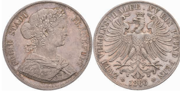
165 Doppeltaler, 1866, AKS 4, vz-st. 100,—