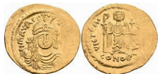
34 Mauricius Tiberius, 582-602, Solidus (4,31g), Konstantinopel. Av: Brustbild mit Schild und Kreuzglobus von vorn, darum Umschrift. Rev: Stehender Engel mit Christogramm Stab und Kreuzglobus von vorn, darum Umschrift. Sear 478, Prägeschwäche, f. vz. 250,—