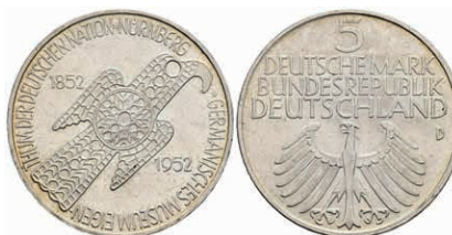
324 5 Mark, 1952, Germanisches Museum, vz. J. 388 200,—