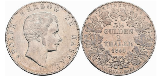
167 Doppeltaler, 1840, Adolph, AKS 58, kl. Rf. und Kr., ss. 200,—