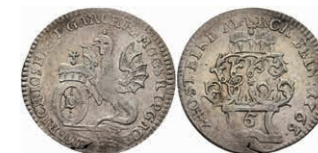
5343 5 Kreuzer, 1763, Emmerich Joseph von Breitbach-Bürresheim, Slg. Walther 593, Schrötlingsfehler am Rand, ss-vz. 150,—