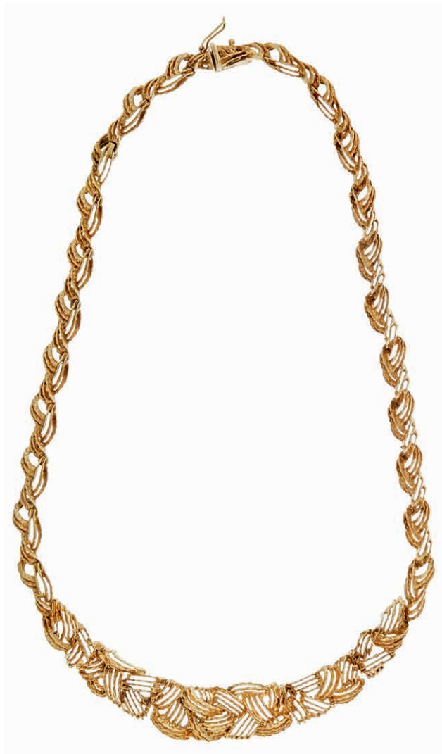
1263 Gold-Collier, 585 GG, zweifache Punze, gegliederter Zopfmuster im Verlauf, Kastenschloss, 41,89g. (Abbildung auf 75% verkleinert) 1250,—