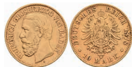
223 10 Mark, 1878, Friedrich I., kl. Rf., ss. J. 186 220,—