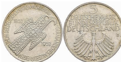
325 5 Mark, 1952, Germanisches Museum, vz. J. 388 200,—