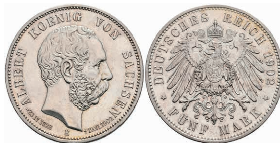
200 5 Mark, 1902, Albert, auf seinen Tod, kl. Kr., ss-vz. J. 128 80,—