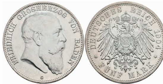
178 5 Mark, 1904, Friedrich I., wz. Rf., Kratzer, vz-st. J. 33 170,—