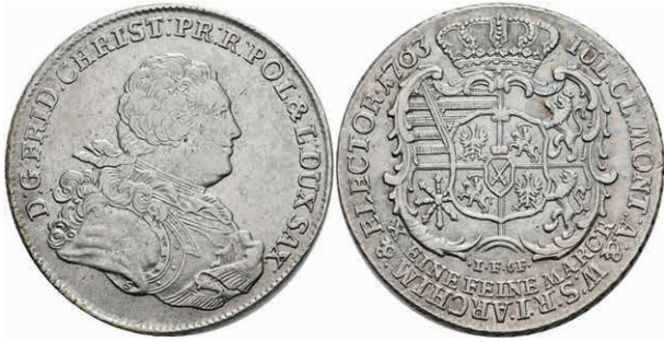
119 Taler, 1763, Friedrich Christian, Schnee 1053, ss. 150,—