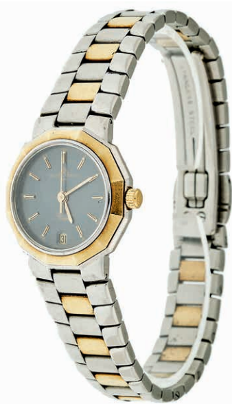
1336 Damen Armbanduhr "Baume & Mercier" Modell Riviera 1989, Ser. Nr. 1468783, Stahl/Gold flaches Gehäuse, schwarzes Zifferblatt, Sekundenanzeiger und Datum analog Quarzwerk, verdeckter Schließe. Mit internationale Garantiekarte, orig. Gebrauchsanweisung und Kaufbeleg von 31.06.1989. Leichte Gebrauchsspuren, Deckel etw. zerkratzt, revisionsbedürftig. 1000,—