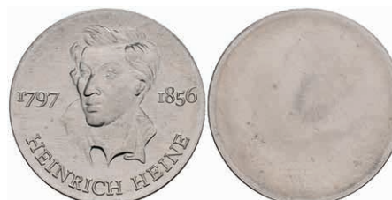
357 10 Mark, 1972, Heinrich Heine, einseitiger Aluminiumabschlag der Vorderseite, st. Auflage nur 300 Stück. J. 1542A. 50,—