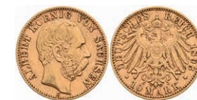
257 10 Mark, 1893, Albert, ss. J. 263 200,—