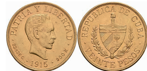
434 20 Pesos, Gold, 1915, Fb. 1, kl. Rf., kl. Kratzer, vz. 1500,—