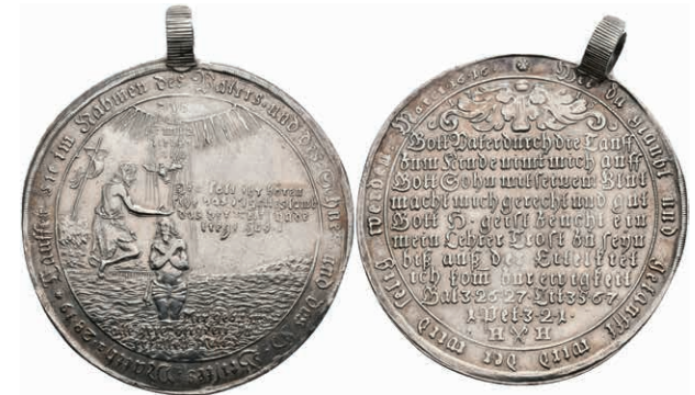
136 Taler, 1715, Münzmeister Heinrich Horst. Av: Taufszene. Rev: 11 Zeilen Schrift. Mit altem Henkel, etwas poliert, ss-vz. (Abbildung auf 76% verkleinert) 150,—