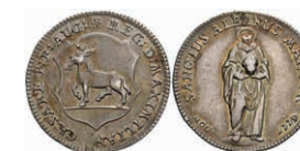
5366 Ritterstift St. Albern, Silberabschlag vom Goldgulden 1779, Slg. P. A. -, Slg. Walther 733, ss. Seltene! 400,—