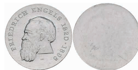
350 20 Mark, 1970, Friedrich Engels, einseitiger Aluminiumabschlag der Vorderseite, st. Auflage nur 330 Stück. J. 1529A. 50,—