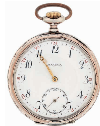
1313 Herrentaschenuhr mit separater Sekunde der Firma Saxonia. 1. Hälfte 20. Jh. Gehäuse 800er Silber, gestempelt. Feingehaltsstempel Schweiz und Reichsstempel Deutschland. Staubdeckel aus Metall. Modellnr. 3418831. Rückdeckel wohl per Hand bez. "FB", Rückdeckel innen bez. "Fr. Bruns" u.a. Dm. ca. 4,1/4,9 cm. Gebrauchs- und Altersspuren. Ca. 73,69 gr. Uhrwerk nicht geprüft. 60,—