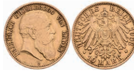
225 10 Mark, 1903, Friedrich I., kl. Rf., ss. J. 190 200,—