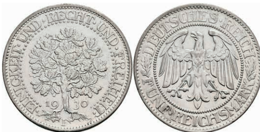
279 5 Reichsmark, 1930, F, Eichbaum, kl. Rf., ss-vz. J. 331 350,—