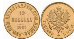
402 10 Markkaa, Gold, 1881, Alexander III., Fb. 5, kl. Kratzer, vz+. 200,—