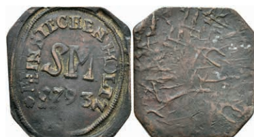
5502 Einseitige Holzmarke, Kupfer, 1793. Av: "SM / 1793", darum Umschrift. Slg. Walther -, wohl unediert, ss. 100,—