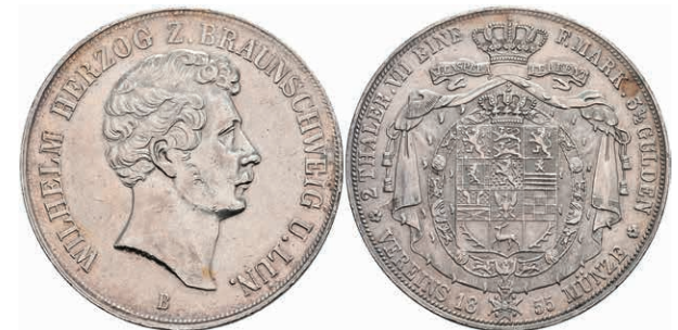
148 Doppeltaler, 1855, Wilhelm, AKS 73, kl. Rf. und Kr., ss. 100,—