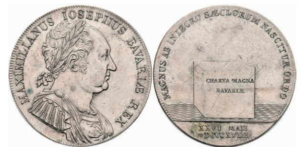
141 Taler, 1818, Maximilian I. Joseph, AKS 59, J. 15, wz. Rf., vz. 150,—