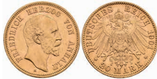
219 20 Mark, 1901, Friedrich I., kl. Rf., ss+. J. 181 1600,—