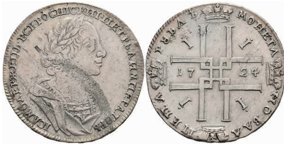
479 Rubel, 1724, Peter I., Moskau, Roter Münzhof, Bitkin 921ff., Schröttingsfehler, ss. 400,—