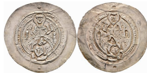
5181 Brakteat (0,88g), Konrad von Wittelsbach, 1183-1200. Brustbild des Hl. Martin mit segnender Rechten und Buch von vorn. Darunter der kniende Erzbischof mit erhobenen Händen nach links. Slg. Löbbecke 610, zaponiert, ss-vz. (Abbildung auf 91% verkleinert) 300,—

Bitte geben Sie realistische Gebote ab! Gebote deutlich unter Metallwert sind praktisch chancenlos und für alle Seiten Zeitverschwendung!