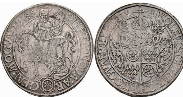
5220 Taler, 1586, Wolfgang von Dalberg, Dav. 9464, ss. Selten! 1300,—