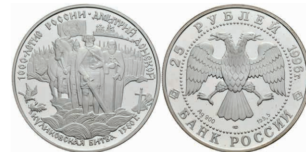
555 25 Rubel, 1996, Schlacht auf dem Schnepfenfeld, 5 Unzen Silber, Parchimowicz 1426, in Kapsel, PP. (Abbildung auf 68% verkleinert) 150,—