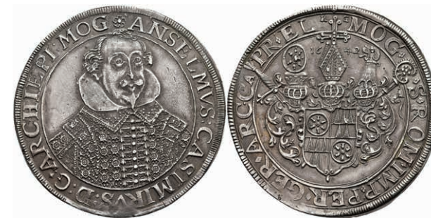
5242 Taler, 1642, Anselm Casimir von Umstadt, Dav. 5552, Slg. Walther 274, bearbeitete Stelle, vz. (Abbildung auf 95% verkleinert) 1500,—