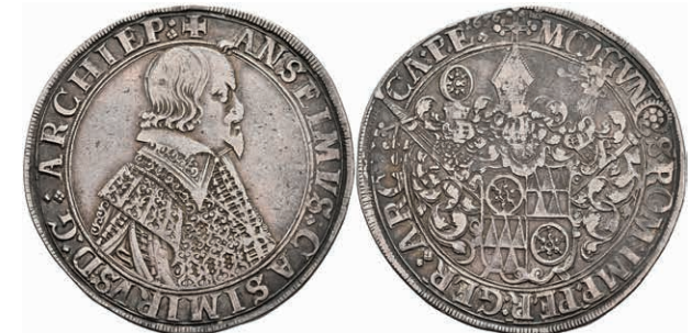
5233 Taler, 1636, Anselm Casimir von Umstadt, Dav. 5548, ss. (Abbildung auf 97% verkleinert) 350,—