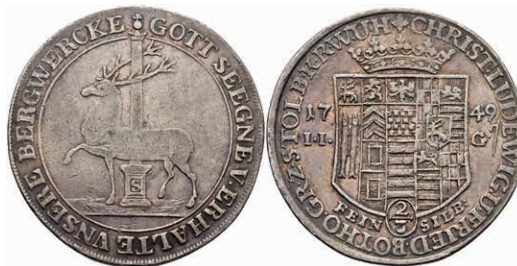
134 2/3 Taler, 1749, Christoph Ludwig und Friedrich Botho, Dav. 1006, Friedrich 1897, ss. 70,—