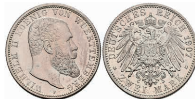
214 2 Mark, 1907, Wilhelm II., st. J. 174 50,—