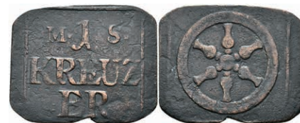
5471 Brückenzollmarke zu 1 Kreuzer, Kupfer, o.J. Av: 1 zwischen "M - S.", darunter "KREUZ / ER". Rev: Rad. Slg. Walther 785, ss. 50,—