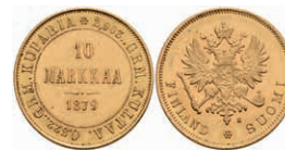
401 10 Markkaa, Gold, 1879, Alexander II., Fb. 4, vz. 220,—