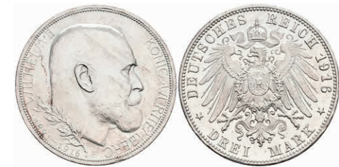
218 3 Mark, 1916, Wilhelm II., zum 25jährigen Regierungsjubiläum, Randfehler, Avers st matt, Revers PP. J. 178 6000,—