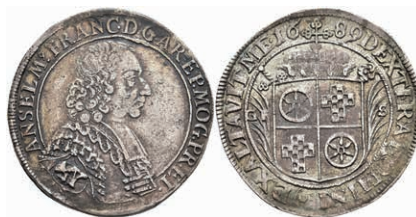
5285 15 Kreuzer, 1689, Anselm Franz von Ingelheim, Slg. P. A. -, Slg. Walther -, Sehr selten! 500,—