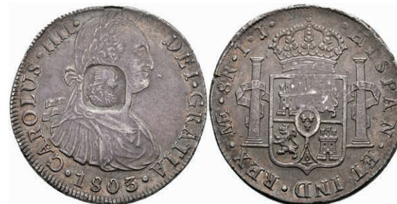
415 Dollar, o.J. (1804), mit Gegenstempel (Büste Georg III. nach rechts) auf 8 Reales 1803 Lima IJ. KM 658, Randkerbe, schöne Patina, vz. 600,—