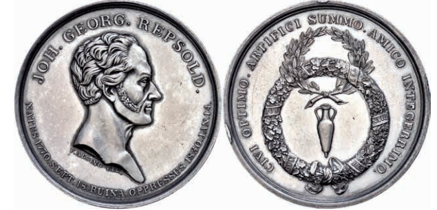
628 Hamburg, versilberte Bronzemedaille (Dm. ca. 43mm, ca. 43,44g), 1830, von Alsing, auf den Tod von Johann Georg Repsold. Av: Kopf nach rechts, darum Umschrift. Amphore im doppelten Kranz, darum Umschrift. Wz. Rf., vz-st. 300,—