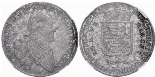
121 2/3 Taler, 1768, Xaver, EDC, hübsche Patina, im Plastiklab der NGC mit der Bewertung XF 45. 400,—