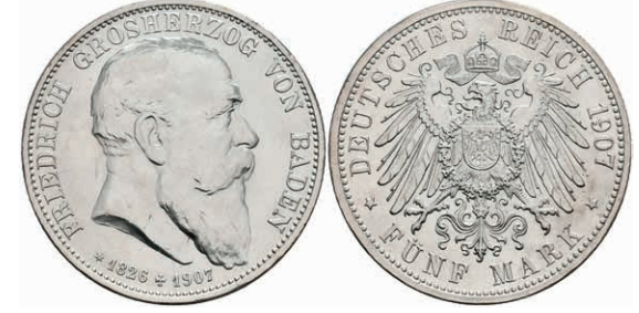
182 5 Mark, 1907, Friedrich I., auf seinen Tod, wz. Rf., vz-st. J. 37 150,—