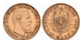
251 10 Mark, 1888, Friedrich III., kl. Kratzer, ss+, J. 247. 170,—