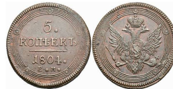
497 5 Kopeken, 1804, Alexander I., Ekaterinburg, Bitkin 290, ss-vz. (Abbildung auf 95% verkleinert) 50,—

Alle Einzellose und Zertifikate/Gutachten sind unter www.rhenumis.de farbig abgebildet! Dort sind auch 271 weitere Lose zu finden, die nicht im gedruckten Katalog, sondern nur im Internet zu finden sind!