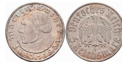
314 5 Reichsmark, 1933, J, Luther, kl. Rf., vz. J. 353 100,—