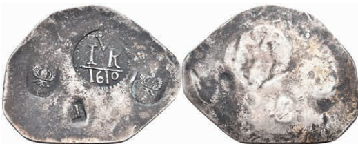
91 Notklippe zu 1 Taler (4,24g), 1610. Vier Stempel auf Silberplatte. Brause/Mansfeld -, ss. Vermutlich spätere Anfertigung! 100,—