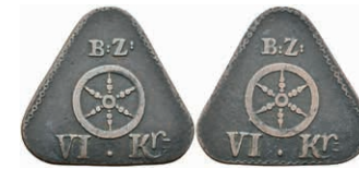
5490 Brückenzollmarke zu 6 Kreuzer, Kupfer, o.J. Av: Rad darüber "B: Z:", darunter "VI. Kr.". Rev: Gleich Avers. Slg. Walther -, ss. 50,—