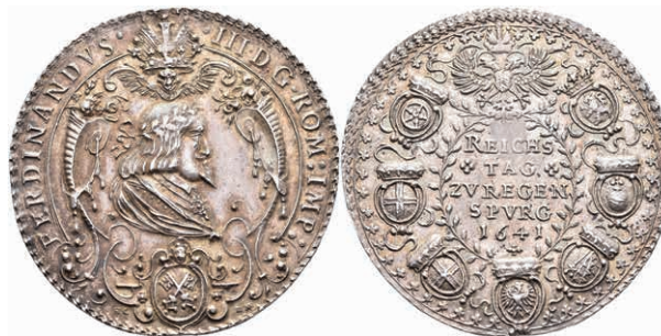
5512 Regensburg, Ferdinand III., Silbermedaille (Dm. ca. 43mm, ca. 18,81g), 1641, von H. G. Bahre, auf die Eröffnung des Reichstages. Av: Büste Ferdinand III. nach rechts, darunter Stadtappen, darüber Krone, darum Umschrift. Rev: 5 Zeilen Schrift, darum Wappenkranz. Plato 88, Slg. Montenuovo 811, ss-vz. (Abbildung auf 97% verkleinert) 300,—