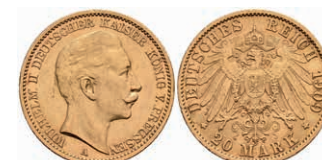
254 20 Mark, 1909, J, Wilhelm II., Rf., ss-vz. J. 252. 300,—