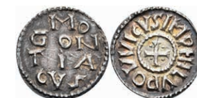
5146 Denar (1,82g), Ludwig der Fromme, 813-840, Mainz. Av: Kreuz, in den Winkeln jeweils eine Kugel, darum "HLVDOWICVSIMP". Rev: "MO / GON / TIA / GVS". Morrison/Grunthal 321, Prou 34. Exemplar der Slg. Dr. R. Walther (Nr. 4). Kl. Schröttingsfehler, schöne Patina, ss. 1300,—

Goldmünzen ab 1800 sowie Goldbarren sind als Anlagegold ggf. umsatzsteuerfrei (auch für das Aufgeld), soweit der Zuschlagpreis inkl. Aufgeld und Losgebühr nicht höher als der Goldwert + 80% ist.