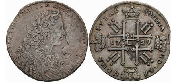
483 Rubel, 1729, Peter II., Moskau, Münzhof Kadashevsky, Bitkin 111, Dav. 1669, Zainende, Schröttingsfehler, ss. 250,—