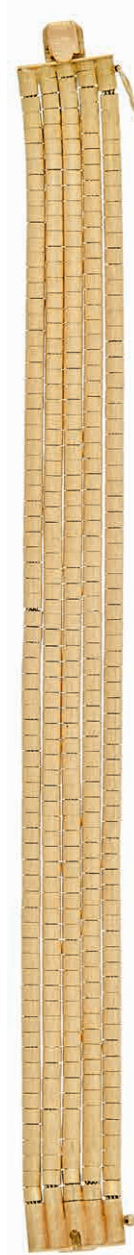
1276 Gold-Armband, Italien, 20. Jh., 4-reihig, 750 Gelbgold, punziert, L. 17cm, 25, 25g, Tragespuren. (Abbildung auf 93% verkleinert) 950,—