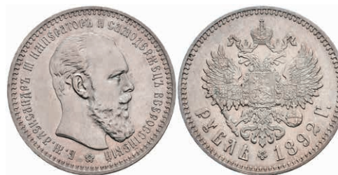
515 Rubel, 1892, Alexander III., St. Petersburg, Bitkin 76, kl. Kratzer, vz. 400,—