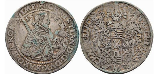
106 Taler, 1588, Christian I., Dav. 9806, Kahnt 142, Schnee 731, Hsp., ss. 150,—