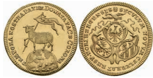
100 Dukat (Lammdukat), o.J. (1700), ohne Münzmeisterzeichen, Kellner 71, Fb. 1885, etwas wellig, vz-st. 600,—