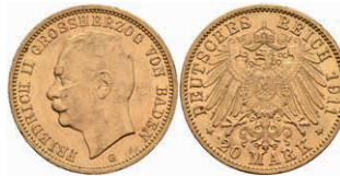
227 20 Mark, 1911, Friedrich II., kl. Kr. und Rf., vz. J. 192 300,—