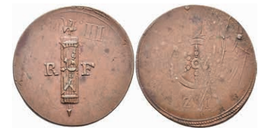
5499 Kupfermarke, o.J. Av: Fascis zwischen "R - F". Rev: Rad, darüber "B: Z.". Überprägungsspuren. Slg. Walther -, ss. 30,—