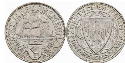
271 5 Reichsmark, 1927, Bremerhaven, kl. Rf., vz. J. 326 320,—