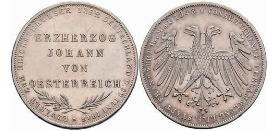
156 Doppelgulden, 1848, Erzherzog Johann von Österreich, AKS 39, J. 46, kleine Kratzer, vz. 100,—