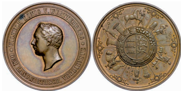
632 Württemberg, Wilhelm I., Bronzemedaille (Dm. ca. 45,20mm, ca. 52,93g), o.J. (ab 1858), signiert G.A. Dietelbach, für landwirtschaftliche Verdienste. Av: Kopf nach rechts, im Außenkranz Umschrift. Rev: Wappen im Kranz, darum landwirtschaftliche Darstellungen. Ebner 412, Tintensignatur auf dem Rand, vz-st. (Abbildung auf 93% verkleinert) 150,—