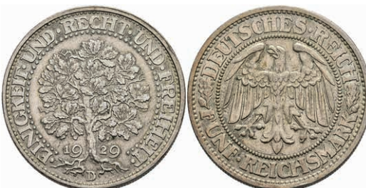
278 5 Reichsmark, 1929, D, Eichbaum, kl. Rf., ss. J. 331 120,—