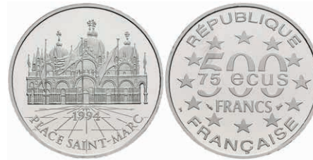
413 500 Francs, Platin, 1994, Markusdom in Venedig, mit Zertifikat in Ausgabeschatulle, leicht angelaufen, PP. 500,—