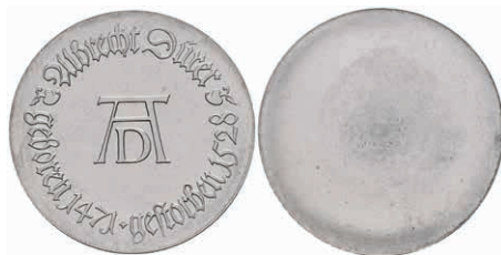
352 10 Mark, 1971, Albrecht Dürer, einseitiger Aluminiumabschlag der Vorderseite, wz. Kr., f. st. Auflage nur 300 Stück. J. 1532A. 50,—