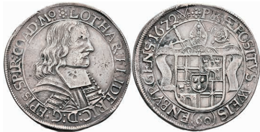
5509 Gulden (60 Kreuzer), 1672, Lothar von Metternich-Burscheid, Dav. 992, Rand bearbeitet, ss. 200,—