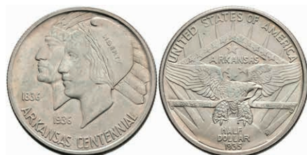
603 1/2 Dollar, 1935, D, Arkansas, KM 168, etwas Grünspan, vz. 50,—