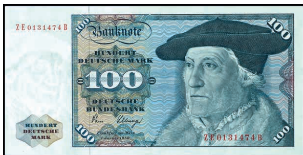
943 100 Deutsche Mark, 2.1.1980, Austauschnote Serie ZE/B Ro. 284b, Erh. II-III. (Abbildung auf 50% verkleinert) 250,—