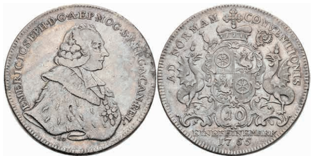
5349 Taler, 1765, Emmerich Joseph von Breitbach-Bürresheim, Dav. 2424, Slg. Walther 596, ss. 150,—