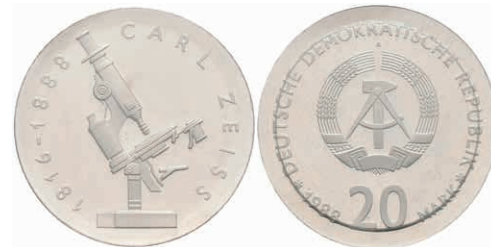
368 20 Mark, 1988, Carl Zeiss, in Kapsel eingeschweißt, PP. J. 1621. 200,—