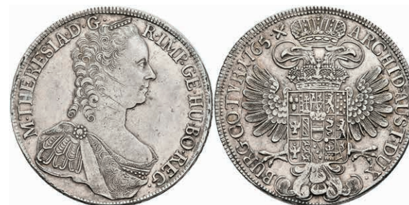
58 Taler, 1765, Maria Theresia, Wien, Dav. 1112, Eypeltauer 74, min. justiert, ss-vz. 100,—