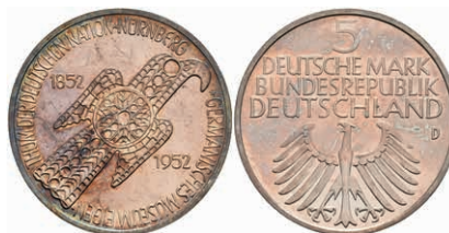
322 5 Mark, 1952, Germanisches Museum, Patina, wz. Kr., PP. J. 388. 1000,—