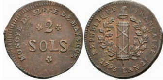
5369 2 Sols (7,94g), 1793, geprägt unter französischer Belagerung, Brause/Mansfeld Tf. 18, Nr. 11, Slg. P. A. 863, Slg. Walther 752, ss. 30,—