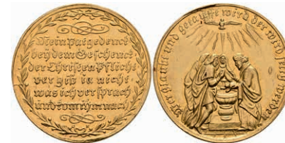
623 Nürnberg, Goldmedaille (Dm. ca. 28,10mm, ca. 6,95g), o.J. (18. Jh.), unsign. Av: Taufszene. Rev: 6 Zeilen Schrift im Lorbeerkranz. Slg. Erlanger 2446, Slg. Goppel 4383, kl. Rf., ss-vz. 500,—