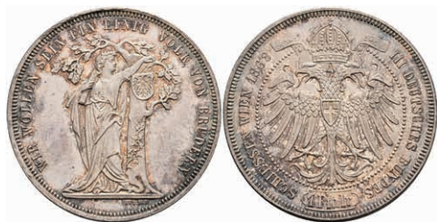
452 Taler, 1868, Franz Josef I. auf das III. Deutsche Bundesschiessen in Wien, Herinek 482, Dav. 28., kleine Randfehler, vz-st. 100,—