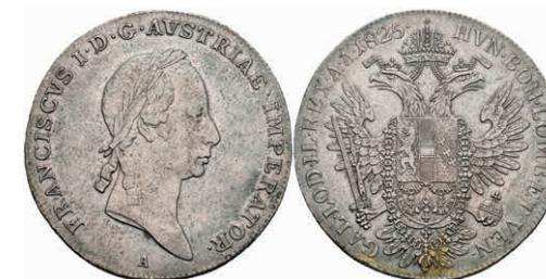
448 1/2 Taler, 1825, Franz I., Wien, J. 197, Reste von Zaponlack, ss-vz. 80,—