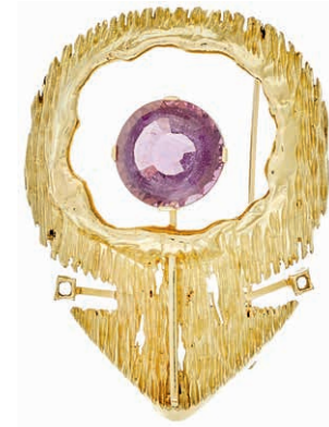
1278 Brosche mit Amethyst, 585 Gelbgold, Stein rund facettiert 18,7 mm, Handarbeit, 5,67x 4,34cm, 22,36g. 600,—