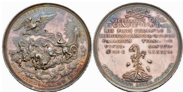
5410 Silbermedaille (Dm. ca. 49,50mm, ca. 44,79g), 1689, von P. H. Müller, auf die Wiedereinnahme der Stadt. Av: Sturz des Phaetons aus der Sonnenquadriga, darüber ein Adler mit Blitzen. Rev: 7 Zeilen Schrift, darüber zwei gekreuzte Posaunen, darunter geknickte Lilie. Slg. P. A. 853 (Zinn), Slg. Walther 746, schöne Patina, Kratzer, vz. (Abbildung auf 84% verkleinert) 1000,—