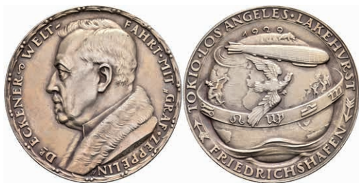
730 Silbermedaille (Dm. ca. 36,1mm, ca. 19,89g), 1929, von Karl Goetz, auf Dr. Hugo Eckener und die Weltfahrt des LZ 127 Graf Zeppelin. Av: Büste Dr. Eckeners nach links, darum Umschrift. Rev: Zeppelin und Vogel vor Weltkugel. Kienast 429. Kl. Kr., kl. Rf., vz-st. 80,—