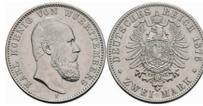
211 2 Mark, 1876, Karl, vz. J. 172 500,—