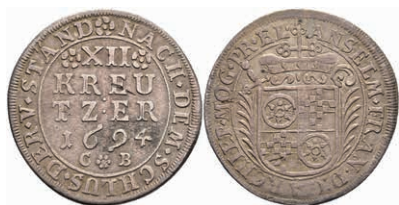
5308 12 Kreuzer, 1694, Anselm Franz von Ingelheim, Slg. Walther 436, kl. Schrötlingsfehler, ss. 50,—