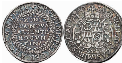
5241 1/2 Taler, 1642, Anselm Casimir von Umstadt, Slg. Walther 277, schöne Patina, ss-vz. Sehr selten! 1500,—