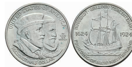
600 1/2 Dollar, 1924, Hugueno-Walloon, KM 154, leichter Grünspan, vz. 50,—