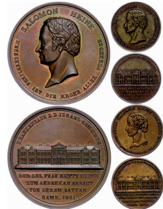
629 Hamburg, Bronzemedaille (Dm. ca. 45mm), 1841, von H.F. Alsing, auf die Erbauung des Krankenhauses der israelitischen Gemeinde durch Salomon Heide. Dazu dieselbe (2x) Revers mit leichter Abweichung (Dm. ca. 23mm). Gaedeckens 2070, ss-vz. 400,—

Alle Einzellose und Zertifikate/Gutachten sind unter www.rhenumis.de farbig abgebildet!