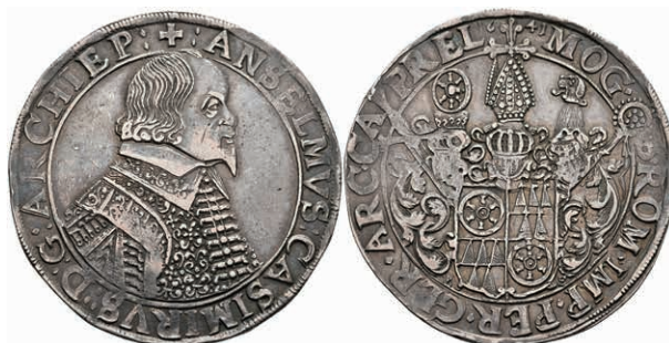
5239 Taler, 1641, Anselm Casimir von Umstadt, Dav. 5548, Slg. Walther 269, schöne Patina, ss. 600,—