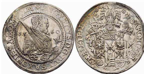
105 Taler, 1560, August, Dav. 9795, Kahnt 56.1, Schnee 713, gereinigt, Hsp., ss. 100,—