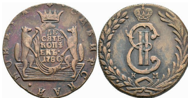
493 10 Kopeken, 1780, Katharina II., Suzun, Bitkin 1044, Randfehler, ss. (Abbildung auf 90% verkleinert) 80,—