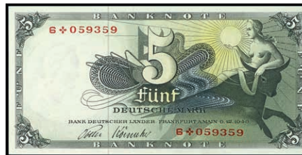
933 5 Deutsche Mark 9.12.1948, Europa auf dem Stier, Austauschnote, Serie 6 mit Kreuzstern vor der KN, Ro.252 d, Erh. I. (Abbildung auf 50% verkleinert) 700,—