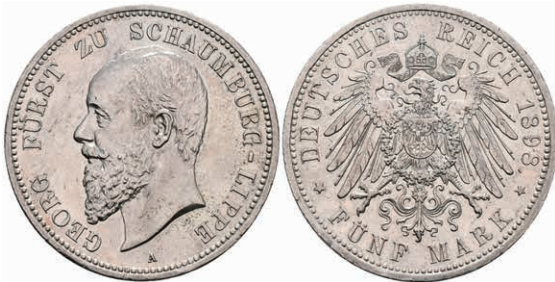
209 5 Mark, 1898, Georg, kl. Rf., vz. J. 165 1200,—