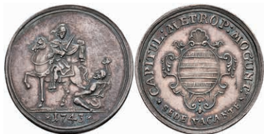
5331 1/4 Schautaler, 1743, Sedisvakanz, Slg. Walther 510, Slg. P. A. 669, schöne Patina, vz. 400,—