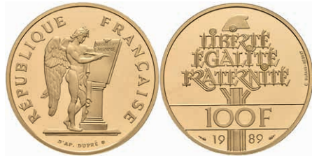
409 100 Francs, Gold, 1989, mit Zertifikat und Original-Etui, Auflage 20.000 Ex., PP. 750,—