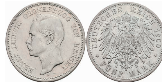
190 5 Mark, 1900, Ernst Ludwig, kl. Kr., ss. J. 73 120,—