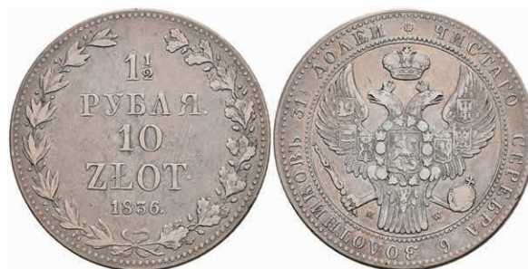
470 1 1/2 Rubel (10 Zloty), 1836, Nikolaus I., Warschau, Bitkin 1132, kl. Rf., s-ss. 150,—