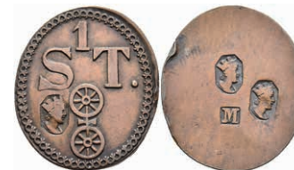
5491 Holzmarke, Kupfer, o.J. Av: "1 / ST.", darunter Doppelrad und Punze. Rev: Drei Punzen. Slg. Walther 811, Slg. P. A. 902, Randfehler, ss. 80,—