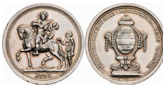
5361 1/2 Schautaler, 1774, Sedisvakanz, Slg. P. A. 756, Slg. Walther 641, Randfehler, ss-vz. 200,—