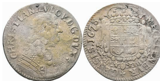
95 2/3 Taler, 1678, Christian Ludwig I., Ratzeburg, Dav. 669, Schrötlingsfehler, ss. 100,—