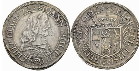
5250 Gulden (60 Kreuzer), 1672, Johann Philipp von Schönborn, Dav. 646, Slg. Walther 329, kl. Schrötlingsfehler, ss-vz. 250,—