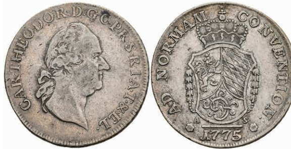
103 Taler, 1775, Karl Theodor, Mannheim, Dav. 2544, ss. 100,—