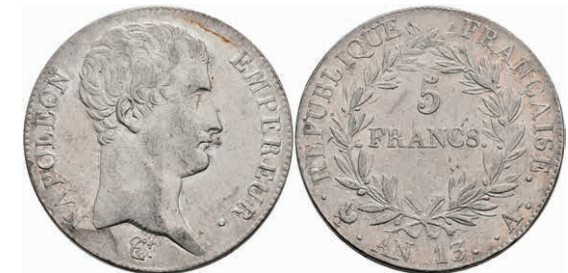
406 5 Francs, AN 13 (1804/1805), Napoleon I., Paris, Dav. 83, Gadoury 580, ss+. 150,—