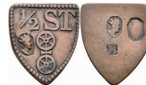
5492 Schildförmige Holzmarke, Kupfer, o.J. Av: "1/2 ST, darunter Doppelrad und Punze. Rev: Drei Punzen. Slg. Walther 814, ss. 100,—