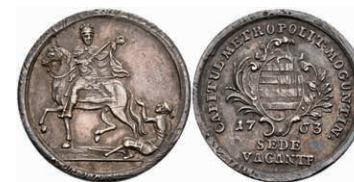
5341 1/8 Schautaler, 1763, Sedisvakanz, Slg. P. A. 709, Slg. Walther 592, kl. Rf., f. vz. 350,—