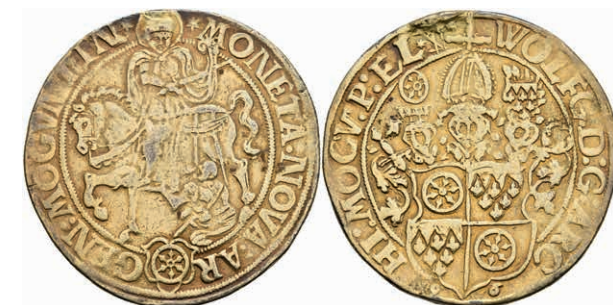
5222 Taler, 1596, Wolfgang von Dalberg, Dav. 9468, Hsp., altvergoldet, ss. 500,—