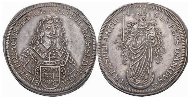
5511 Taler, 1652, Johann Philipp von Schönborn, Dav. 5980, wz. Hsp., schöne Patina, f. vz. 400,—