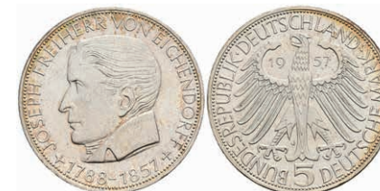
328 5 Mark, 1957, Eichendorff, f. st. J. 391 80,—