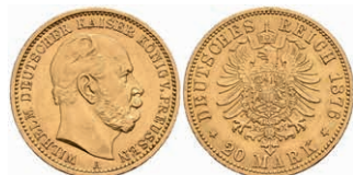
245 20 Mark, 1876, A, Wilhelm I., kl. Rf., ss-vz. J. 246 300,—