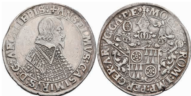
5238 Taler, 1639, Anselm Casimir von Umstadt, Dav. 5549, berieben, kl. Schrötungsfehler, ss. (Abbildung auf 96% verkleinert) 200,—