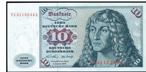
938 10 Deutsche Mark, 2.1.1970, Austauschnote, Serie YC/A, Ro.270c, Erh. I. (Abbildung auf 50% verkleinert) 100,—