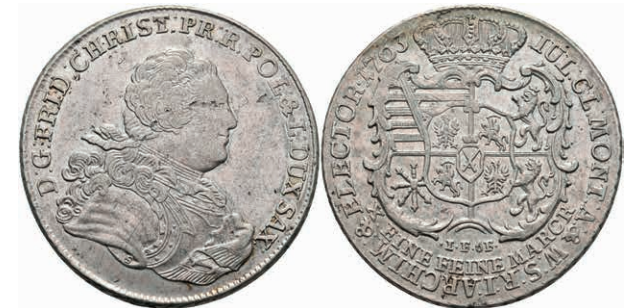
118 Taler, 1763, Friedrich Christian, Leipzig, Dav. 2677, Kahnt 1005, Schnee 1052, kl. Kr., ss-vz. 250,—