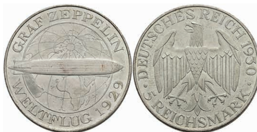
297 5 Reichsmark, 1930, A, Zeppelin, wz. Rf., vz-st. J. 343 130,—