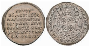
5334 1/8 Taler, 1743, Philipp Karl von Eltz-Kempenich, auf seinen Tod, Slg. Walther 506, vz. 150,—