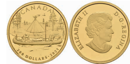
433 200 Dollars, Gold, 2021, Pelzhandel, 15,42g fein, mit Zertifikat in Schatulle, PP (Abbildungen siehe Onlinekatalog) 800,—