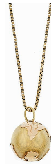
1265 Goldkette mit Anhänger Weltkugel, 585 Gelbgold, Kette mit Meisterpunze „Friedrich Binder Mönshheim“ (8,26g), Anhänger Dm 19,6mm mit Meisterpunze „MEP“ (6,58g). 420,—