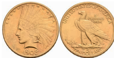
594 10 Dollars, Gold, 1908, Denver, Indian Head, Fb. 165, kl. Rf., ss. 700,—