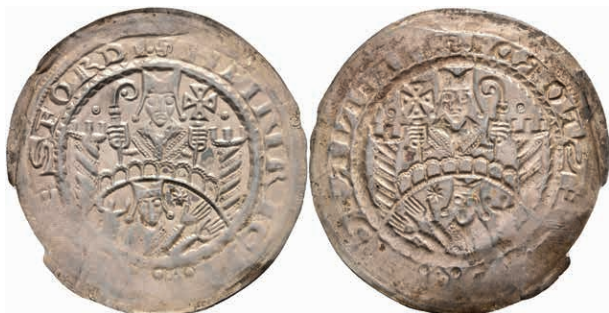
5175 Brakteat (0,92g), Heinrich von Harburg, 1142-1153, Münzstätte Erfurt. Brustbild des Hl. Martin mit Mitra, Krummstab und Kreuzstab über Mauerbogen von vorn, darunter der Erzbischof mit erhobenen Händen zwischen Turm und Stern nach rechts. Berger 2124, Slg. Löbbecke 585, Randausbruch, zaponiert, f. vz. (Abbildung auf 97% verkleinert) 200,—