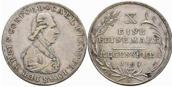
5507 Taler, 1809, Karl Theodor von Dalberg, AKS 6, J. 6, Slg. Walther 698, ss. 150,—