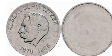
360 10 Mark, 1975, Albert Schweitzer, einseitiger Aluminiumabschlag der Vorderseite, st. Auflage nur 306 Stück. J. 1554A. 50,—