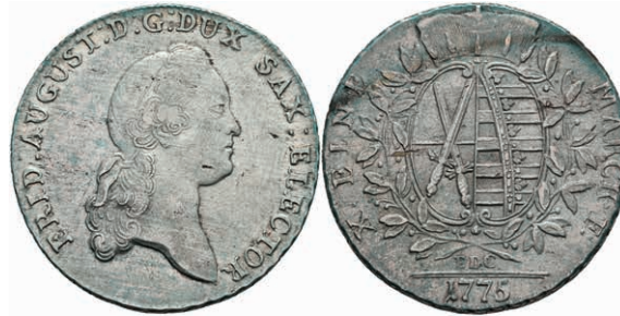
122 Taler, 1775, Friedrich August III., EDC, Dav. 2690, Kahnt 1074, Schnee 1073, etwas Grünspan, ss-vz. 80,—