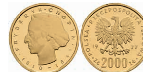
474 2000 Zloty, Gold, 1977, Frederic Chopin, Fb. 119, kl. rote Flecken, PP. 250,—