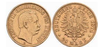
235 20 Mark, 1874, Ludwig III., kl. Rf., ss. J. 217. 500,—