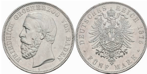
172 5 Mark, 1875, Friedrich I., kl. Rf., vz. J. 27 600,—