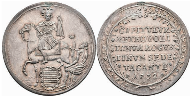
5321 1 Schautaler, 1732, Sedisvakanz, Slg. Walther 499, Hsp., ss-vz. 400,—