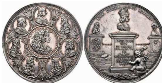
5415 Silbermedaille (Dm. ca. 47,80mm, ca. 41,81g), von P. H. Müller, auf die Krönung Josephs I. in Augsburg. Av: Büste Josephs und seines Sohnes im Medaillon nach rechts, darum 7 weitere Medaillons mit Büsten. Rev: Büste auf Postament, darunter weißelnder Genius. Slg. Mont. 1211, Forster 663, kl. Kr., vz-st. (Abbildung auf 80 % verkleinert) 700,—