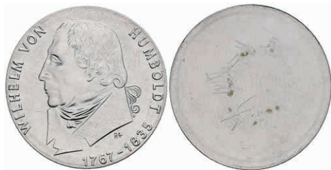
342 20 Mark, 1967, Wilhelm von Humboldt, einseitiger Aluminiumabschlag der Vorderseite, kl. Kr., Kr. auf Rückseite, vz-st. Auflage nur 400 Stück. J. 1520A. 50,—