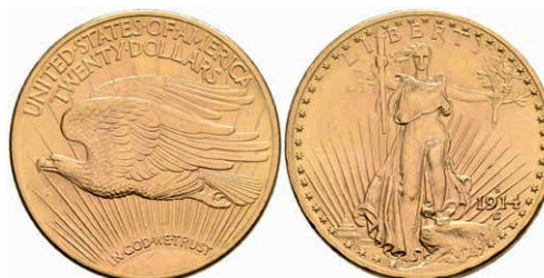
595 20 Dollars Gold, 1914, Double Eagle, Liberty Standing, Mzz D Denver, Fb. 187, kl. Kr., vz. 1200,—