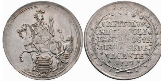
5322 1/2 Schautaler, 1732, Sedisvakanz, Slg. Walther 500, Stempelfehler, f. vz. 500,—