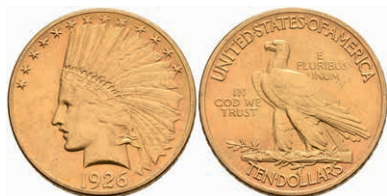
602 10 Dollars, Gold, 1926, Philadelphia, Indian Head, Fb. 165, ss-vz. 700,—