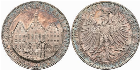
161 Taler, 1863, Fürstentag, AKS 45, kl. Rf., schöne Patina, vz. 150,—