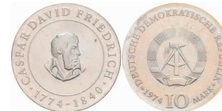
359 10 Mark, 1974, Caspar David Friedrich, in Kapsel, zweifach verplombt, PP. Auflage nur 100 Stück. J. 1553. 1500,—