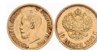
523 10 Rubel, Gold, 1899, Nikolaus II., St. Petersburg, Fb. 179, kl. Rf., ss. 350,—