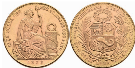
469 100 Soles, Gold, 1963, Fb. 78, vz+. 1800,—