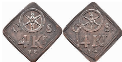
5494 Brückenzollmarke zu 4 Kreuzer, Kupfer, o.J. Av: Rad zwischen "C. - S.", darunter "4. Kr. / B. Z.". Rev: Gleich Avers. Slg. Walther 788, ss. 50,—