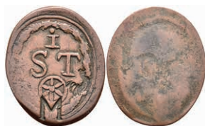
5496 Einseitige Holzmarke, Kupfer, o.J. Av: "I / S T", darunter Rad und Punze "M". Slg. Walther -, ss. 50,—