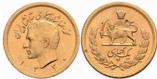
424 Pahlavi, Gold, 1951 (SH 1330), Mohammed Reza Pahlavi, Fb. 101, kl. schwarze Punkte, vz-st. 320,—