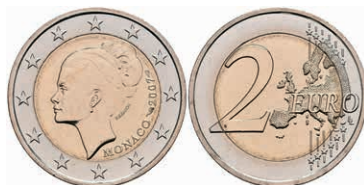
441 2 Euro, 2007, Grace Patricia Kelly zum 25. Todestag, KM 186, in Ausgabeschatulle, vz-st. 2800,—

442 2 Euro, 2015, 800 Jahre Bau der ersten Festung auf dem Felsen (1215- Fondation de la forteresse), in Kapsel, in Originalschatulle mit Zertifikat und Umverpackung, PP. 2400,—