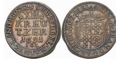
5296 12 Kreuzer, 1691, Anselm Franz von Ingelheim, Slg. Walther 419, kl. Zainende, ss+. 50,—