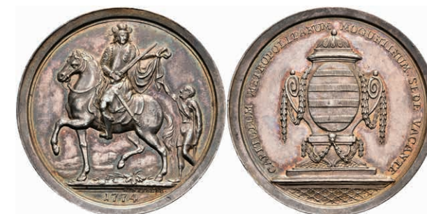
5365 Schautaler, 1774, Sedisvakanz, Slg. P. A. 755, Slg. Walther 640, vz. (Abbildung auf 95% verkleinert) 1800,—

Goldmünzen ab 1800 sowie Goldbarren sind als Anlagegold ggf. umsatzsteuerfrei (auch für das Aufgeld), soweit der Zuschlagpreis inkl. Aufgeld und Losgebühr nicht höher als der Goldwert + 80% ist.