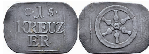
5470 Brückenzollmarke zu 1 Kreuzer, Kupfer, o.J. Av: 1 zwischen "C - S.", darunter "KREUZ / ER". Rev: Rad. Slg. Walther 783, ss. 50,—