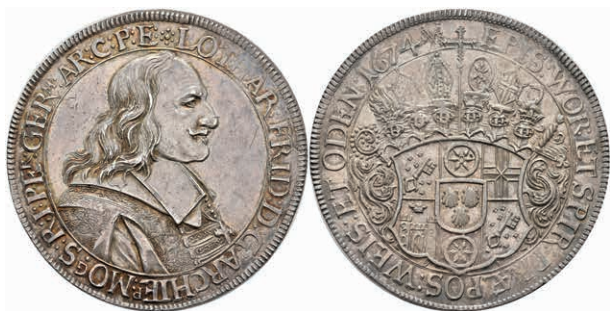
5259 Taler, 1674, Lothar Friedrich von Metternich-Burscheid, Dav. 5560, schöne Patina, vz. Sehr selten! Exemplar der Sammlung R. Walther. Los 346 der 275. Auktion. Dr. Busso Peus, Frankfurt a.M., 1971. (Abbildung auf 96% verkleinert) 5000,—