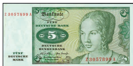
941 5 Deutsche Mark, 2.1.1970, Austauschnote, Serie Z/A, Ro. 269. b. Erh. I. (Abbildung auf 50% verkleinert) 800,—