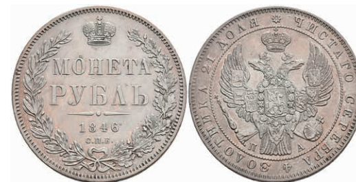
508 Rubel, 1846, Nikolaus I., St. Petersburg, Bitkin 208, wz. Rf., leicht berieben, ss-vz. 50,—