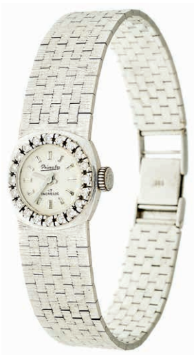
1335 Diamantdamenuhr "Primato" 17 Incabloc, Lünette verziert mit 20 Brillanten, nach 1970, Armband und Gehäuse 14K/ 585 Weißgold, Milanese Armband, Länge: ca. 17,5 cm, ca. 38,1g, gehfähig. 1000,—