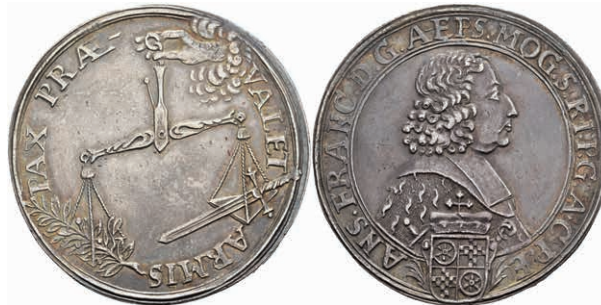
5274 Taler, o.J., Anselm Franz von Ingelheim, Dav. 5567, Slg. Walther 394, Felder teilw. leicht berieben, kräftige Patina, ss-vz. (Abbildung auf 93% verkleinert) 1500,—