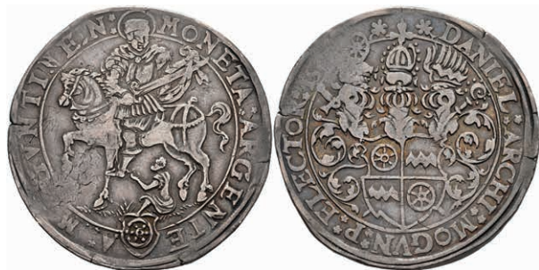
5217 Taler, 156(7)?, Daniel Brendel von Homburg, Dav. 9457, Slg. Walther 199, Prägeschwäche, ss+. 1800,—

Alle Einzellose und Zertifikate/Gutachten sind unter www.rhenumis.de farbig abgebildet! Dort sind auch 271 weitere Lose zu finden, die nicht im gedruckten Katalog, sondern nur im Internet zu finden sind!