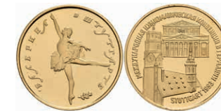
548 Goldmedaille in 50 Rubel Größe, 1993, sog. Stuttgartballerina, in Kapsel, PP. Auflage nur 500 Exemplare! 400,—