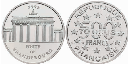
410 500 Francs, Platin, 1993, Brandenburger Tor, mit Zertifikat in Ausgabeschatulle, PP. 500,—