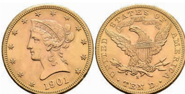
592 10 Dollars, Gold, 1901, Liberty Head, Mzz S San Francisco, Fb. 160, kl. Kr. und Rf., vz+. 600,—