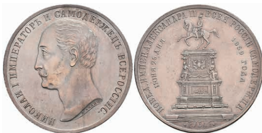
511 Rubel, 1859, Alexander II., St. Petersburg, Denkmal für Nikolaus I., Bitkin 567, Dav. 290, kl. Feilspur am Rand, berieben, f. vz. 500,—