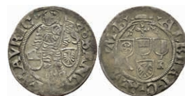
5141 Körtling, 1540, Albrecht IV. von Brandenburg, von Schrötter 186, ss. 50,—