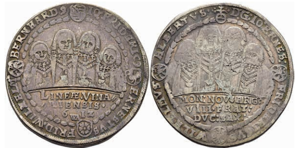
130 Taler, 1612, Johann Ernst und seine Brüder, Dav. 7523, Koppe 193, Schnee 341, kleine Schrötlingsfehler, ss. 150,—