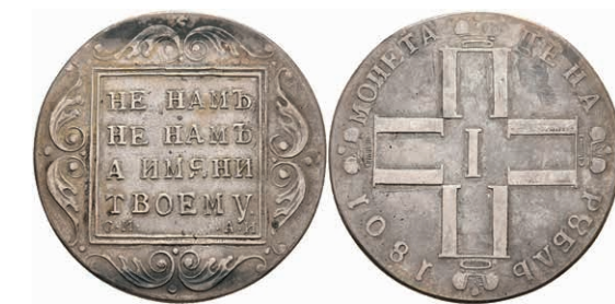
496 Rubel, 1801, Paul I., St. Petersburg, Bitkin 46, ss. 150,—