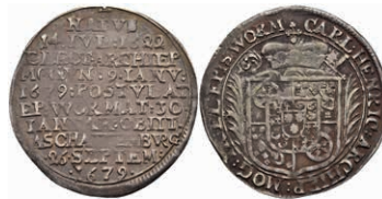
5272 1/8 Taler, 1679, Karl Heinrich von Metternich-Winneburg, auf seinen Tod, Slg. Walther 392, ss. 150,—