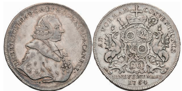
5347 Taler, 1764, Emmerich Joseph von Breitbach-Bürresheim, Dav. 2424, Slg. Walther 594, ss. 200,—