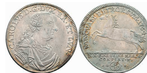
78 2/3 Taler, 1764, Karl I., Welter 2733, vz. 50,—