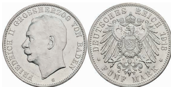
186 5 Mark, 1913, Friedrich II., kl. Rf., vz. J. 40 80,—