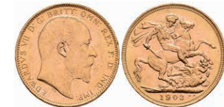
418 Sovereign, Gold, 1903, Edward VII, KM 805, Rf., ss-vz. 340,—