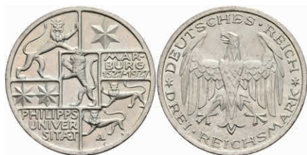
276 3 Reichsmark, 1927, Marburg, wz. Rf., vz. J. 330 90,—