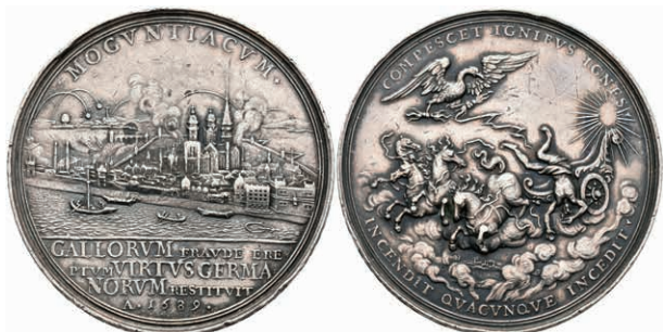
5411 Silbermedaille (Dm. ca. 49mm, ca. 44,74g), 1689, auf die Einnahme der Stadt. Av: Sturz des Phaetons aus der Sonnenquadriga, darüber Adler mit Blitzbündeln, darum Umschrift. Rev: Ansicht der unter Beschuss stehenden Stadt, im Abschnitt darunter 4 Zeilen Schrift. Slg. P. A. 850, Slg. Walther 744, Forster 652, Hsp., kl. Rf., ss. (Abbildung auf 81% verkleinert) 200,—