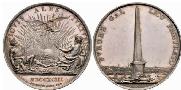
5457 Silbermedaille (Dm. ca. 56mm, ca. 56,31g), 1793, von F. H. Krüger, auf die Rückeroberung der Stadt. Av: Obelisk, im Hintergrund Stadtansicht. Rev: Doppeladler über aufgehender Sonne, zu den Seiten die beiden Flussgötter Moenus und Rhenus. Slg. P. A. 857, Slg. Walther 759, Kratzer, vz-st. (Abbildung auf 74% verkleinert) 300,—