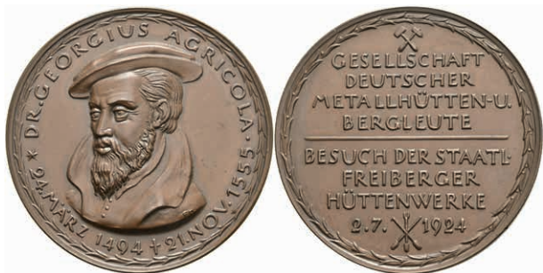
719 Sachsen, Bronzemedaille (Dm. ca. 37,30g, ca. 45mm), 1924, von Hörnlein, auf den Besuch der staatlichen Freiburger Hüttenwerke am 2. Juli. 1924. Av: Brustbild Georgius Agricola halblinks, darum Umschrift. Rev: 7 Zeilen Schrift. F. st. Selten! Auflage nur 51 Stück. (Abbildung auf 92% verkleinert) 120,—