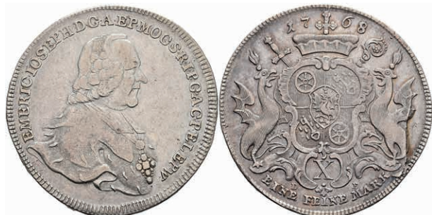
5355 Taler, 1768, Emmerich Joseph von Breitbach-Bürresheim, Dav. 2427, Slg. Walther 612, Stempelbruch, ss. 200,—

Alle Einzellose und Zertifikate/Gutachten sind unter www.rhenumis.de farbig abgebildet!