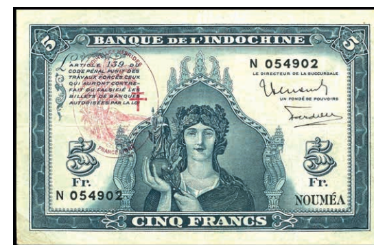
967 Neue Hebriden, Banque de L'Indo-Chine. 5 Franken, o.D (1945). Neue Hebriden-Banknote gedruckt auf der französischen Indo-China 5-Franc-Banknote P.48. Roter Ovalstempel links zur Anzeige des Länderwechsels "NOUVELLES HEBRIDES FRANCE LIBRE". P. 5, Erh. II, selten! (Abbildung auf 50% verkleinert) 150,—