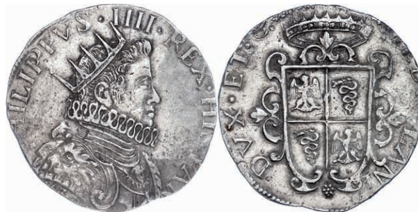
430 Mailand, Ducaton, 1630, Filippo IV., Dav. 4001, vz. 750,—