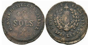
5368 2 Sols (6,12g), 1793, geprägt unter französischer Belagerung, Brause/Mansfeld Tf. 18, Nr. 12, Slg. P. A. 863, Slg. Walther 751, ss. 30,—