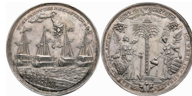
5435 Johann Friedrich Karl von Ostein, Silbermedaille (Dm. ca. 46,40mm, ca. 30,85g), o.J. (1744), unsign., auf die Förderung der freien Rheinschiffahrt. Av: Palmbaum, zu den Seiten zwei Genien, darüber das strahlende Auge Gottes, darum Umschrift. Rev: Vier bemannte Rheinschiffe (Mainz, Trier, Cöln und Pfalz), darüber Hand aus Wolke mit Füllhorn und "WOHLFAHRT DES RHEINSTROMS". Slg. P. A. -, Slg. Walther 514, kl. Rf., vz. Sehr selten! (Abbildung auf 90% verkleinert) 2500,—