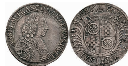
5290 15 Kreuzer, 1690, Anselm Franz von Ingelheim, Slg. Walther 452, Schröttingsfehler, kl. Rf., ss. 50,—