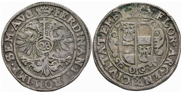
80 Gulden (28 Stüber), o.J. (1624-1637), mit Titel Ferdinand II., Dav. 508, kl. Rf., ss. 50,—