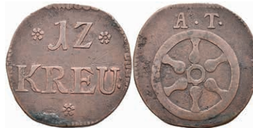
5484 Tormarke zu 12 Kreuzer, Kupfer, o.J. Av: 12 zwischen zwei Rosetten, darunter "KREU:", darunter Rosette. Rev: Rad, darüber "A. T.". Slg. P. A. -, Slg. Walther -, ss. 30,—