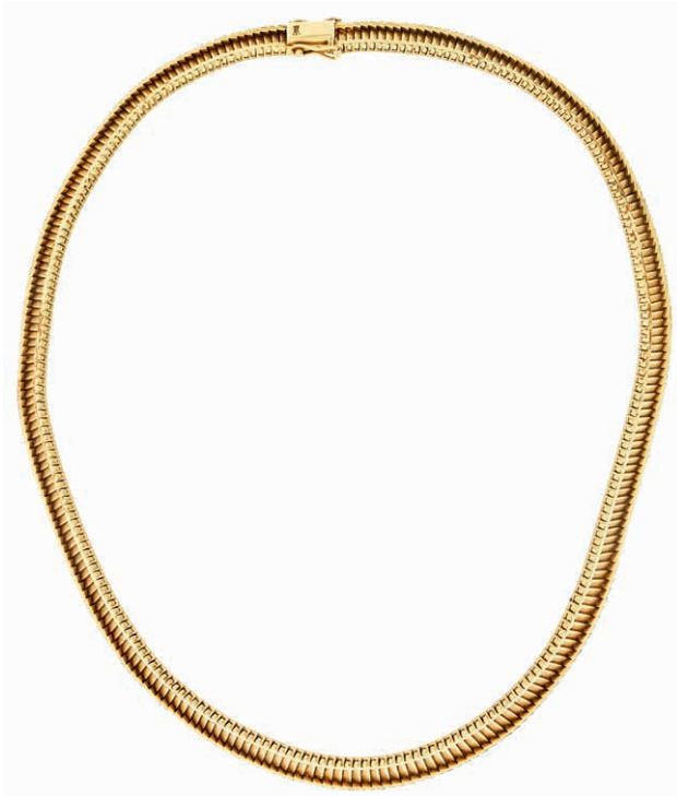
1267 Zeitloses Collier mit geometrischem Dekor. 2. Hälfte 20. Jh. 585er GG, gestempelt. L. ca. 41,0 cm. Ca. 56,35 gr. Das passende Armband wird ebenfalls in der Auktion angeboten. (Abbildung auf 61% verkleinert) 1600,—