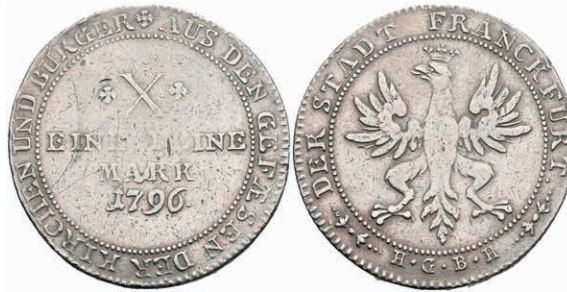
82 Taler, 1796, Dav. 2229, ss. 80,—