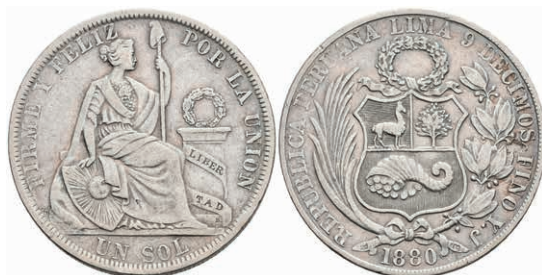
466 Sol, 1880, Lima, YJ, KM 196.5, kl. Rf., ss. 100,—