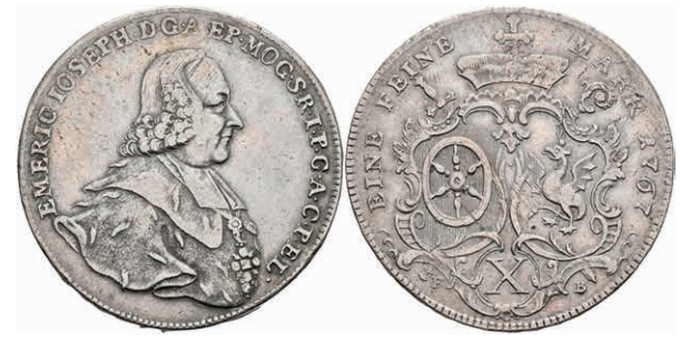
5353 Taler, 1767, Emmerich Joseph von Breitbach-Bürresheim, Dav. 2426, Slg. Walther 606, ss. 200,—