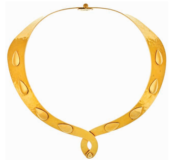
1262 Extravagantes und unikates Collier, das nach Kundenwunsch von der Firma Hans Münstermann, Königsallee 92, Düsseldorf in Handarbeit gefertigt wurde. Um 2000. 750er GG, gestempelt. Hans Münstermann, gestempelt. Bez. "HANDARBEIT". Dm. ca. 12,2/15,8 cm. Ca. 118,05 gr. (Abbildung auf 57% verkleinert) 4400,—