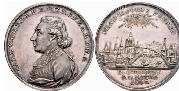
5462 Frankfurt, Carl Theodor von Dalberg, Silbermedaille (Dm. ca. 41,35mm, ca. 26,95g), 1807, unsign., auf die Huldigung der Stadt Frankfurt. Av: Brustbild nach links, darum Umschrift. Rev: Stadtansicht. Slg. P. A. 802, Slg. Walther 689, Joseph/Fellner 987, kl. Kratzer, vz-st. 400,—