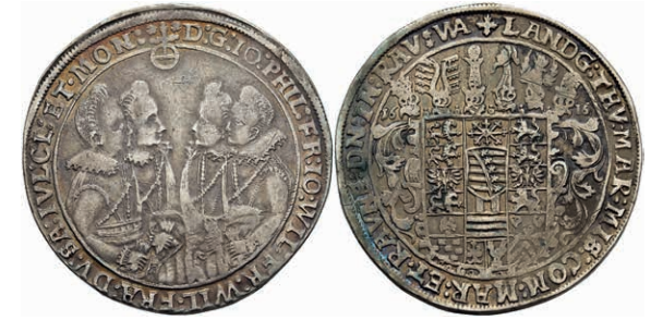
126 Taler, 1616, Johann Philipp, Friedrich, Johann Wilhelm und Friedrich Wilhelm II., Dav. 7365, Schnee 270, kl. Rf., minimal justiert, ss. 200,—