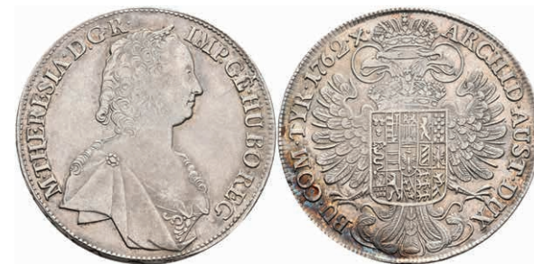
57 Taler, 1762, Maria Theresia, Hall, Dav. 1121, Eypeltauer 79, ss+. 120,—