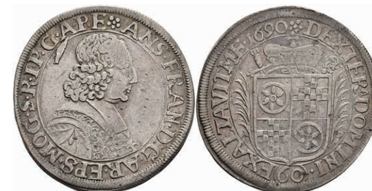
5291 Gulden (60 Kreuzer), 1690, Anselm Franz von Ingelheim, Dav. 658, Slg. Walther 417, Stempelfehler, ss. 150,—

Alle Einzellose und Zertifikate/Gutachten sind unter www.rhenumis.de farbige abgebildet! Dort sind auch 271 weitere Lose zu finden, die nicht im gedruckten Katalog, sondern nur im Internet zu finden sind!