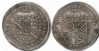
5310 1/8 Taler, 1695, Lothar Franz von Schönborn, auf seine Inthronisation, Slg. P. A. 607, Slg. Walther 458, ss-vz. Selten! 200,—