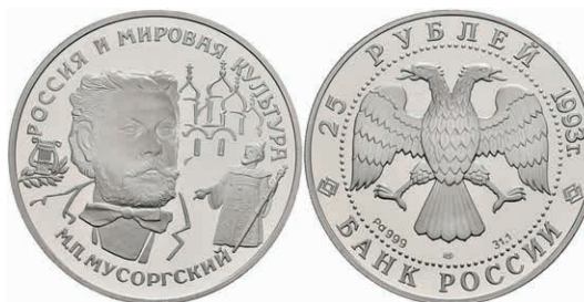
545 25 Rubel, Palladium, 1993, M. Mussorgski, Parchimowicz 1409, kl. Fleck, ohne Kapsel, PP. 1800,—