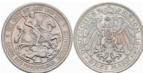
197 3 Mark, 1915, Mansfeld, ss. J. 115 250,—