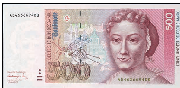
948 500 Deutsche Mark, 1.8.1991, Serie AA/D, Ro. BRD-45a, Erhaltung I. (Abbildung auf 49% verkleinert) 300,—