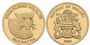
437 100 Kwacha, Gold, 2005, Leopard, PP. 350,—