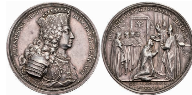
5436 RDR, Franz I. Stephan, Silbermedaille (Dm. ca. 49,10mm, ca. 43,69g), 1745, von M. Holtzhey, auf die Krönung zum römischen Kaiser. Av: Brustbild nach rechts, darum Umschrift. Rev: Krönungsszene. Slg. Mont. 1765, kl. Kratzer und Rf., ss. (Abbildung auf 85% verkleinert) 500,—