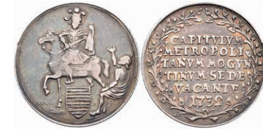
5326 1/8 Schautaler, 1732, Sedisvakanz, Slg. Walther 502, f. ss. 200,—