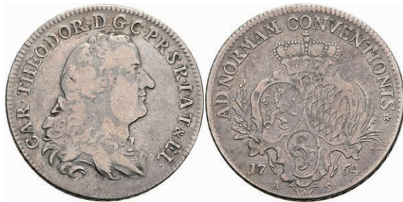
102 Pfalz-Sulzbach, Taler, 1764, Karl Theodor, Mannheim, Dav. 2539A, ss. 100,—