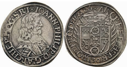
5249 1/2 Gulden (30 Kreuzer), 1672, Johann Philipp von Schönborn, Slg. Walther 330, ss. 200,—