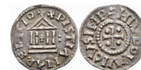
5145 Denar (1,77g), Ludwig der Fromme, 813-840. Av: Kreuz, in den Winkeln jeweils eine Kugel, darum "HLVDOWICVSIMP". Rev: Tempel, links senkrecht zwei Kugeln, darum "XPISTIANARELIGIO". Morrison/Grunthal -, Prou -, ss. 220,—