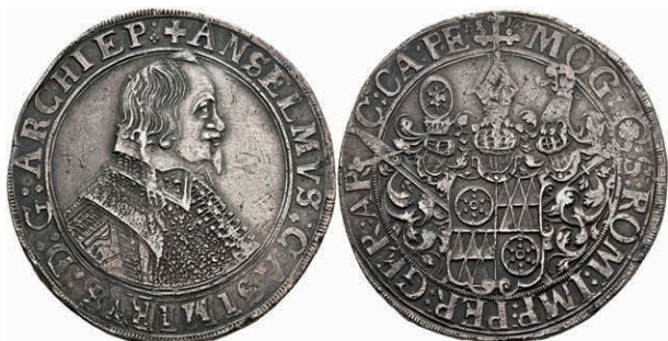
5236 Taler, 1637, Anselm Casimir von Umstadt, Dav. 5548, Slg. Walther 255, Kratzer/bearbeitet, ss. (Abbildung auf 97% verkleinert) 250,—