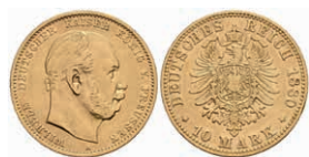
244 10 Mark, 1880, A, Wilhelm I., kl. Rf., ss. J. 245. 150,—