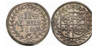
5279 2 Albus, 1681, Anselm Franz von Ingelheim, Slg. Walther 405, f. vz. 40,—