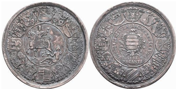
5345 Schautaler, 1763, Sedisvakanz, Slg. P. A. 706, Slg. Walther 589, schöne Patina, ss+. (Abbildung auf 89% verkleinert) 500,—