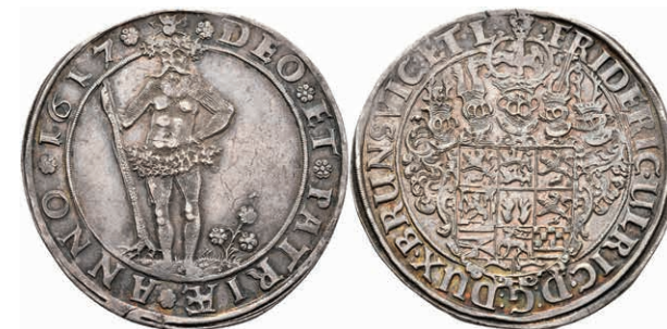
76 Taler, 1617, Friedrich Ulrich, Welter 1057A, Dav. 6303, Schröttingsfehler, ss-vz. 200,—