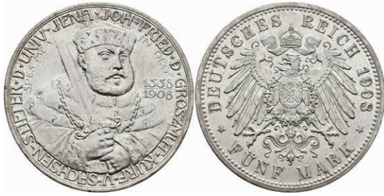
207 5 Mark, 1908, Wilhelm Ernst zur 350-Jahrfeier der Universität Jena, kl. Rf., vz-st. J. 161. 150,—