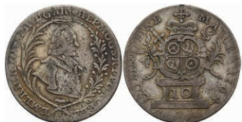
5346 10 Kreuzer, 1764, Emmerich Joseph von Breitbach-Bürresheim, Slg. Walther 595, justiert, f. ss. 30,—