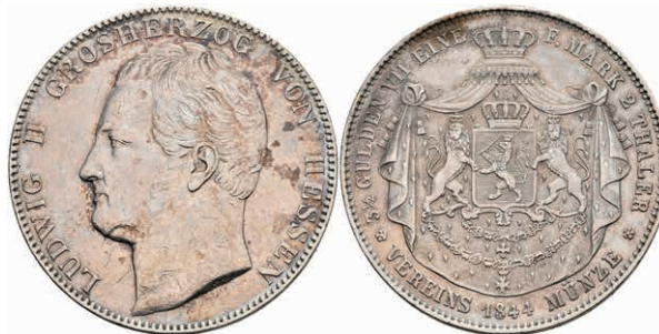
166 Doppeltaler, 1844, Ludwig II., AKS 100, J. 41, kl. Rf. und Kr., ss. 100,—