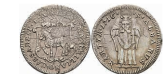
5316 Ritterstift St. Albern, Silberabschlag vom Goldgulden 1716, Slg. P. A. 824, Slg. Walther 727, Schrötlingsfehler, ss. Selten! 100,—