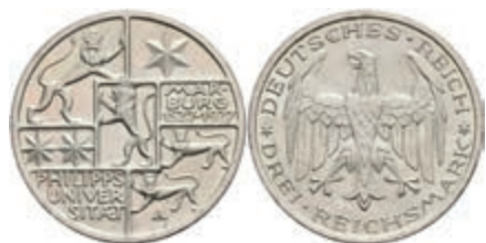
276 3 Reichsmark, 1927, Marburg, wz. Rf., vz. J. 330 90,—