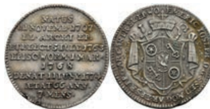
5362 1/3 Taler, 1774, Emerich Joseph von Breitbach-Bürresheim, auf seinen Tod. Slg. Walther 626, Schrötlingsfehler am Rand, ss-vz. 150,—

Bitte geben Sie realistische Gebote ab! Gebote deutlich unter Metallwert sind praktisch chancenlos und für alle Seiten Zeitverschwendung!