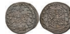
5300 1 Albus, 1692, Anselm Franz von Ingelheim, Slg. Walther 423, Zainende, vz-st. 50,—