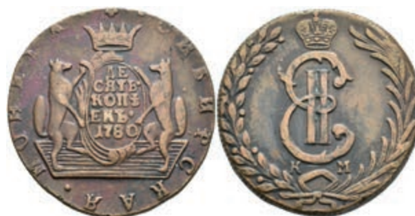
493 10 Kopeken, 1780, Katharina II., Suzun, Bitkin 1044, Randfehler, ss. (Abbildung auf 90% verkleinert) 80,—