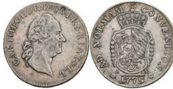
103 Taler, 1775, Karl Theodor, Mannheim, Dav. 2544, ss. 100,—