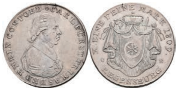
5508 Taler, 1809, Karl Theodor von Dalberg, AKS 7, J. 7, Slg. Walther 699, kl. Einriss, ss-vz. 250,—