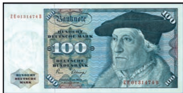
943 100 Deutsche Mark, 2.1.1980, Austauschnote Serie ZE/B Ro. 284b, Erh. II-III. (Abbildung auf 50% verkleinert) 250,—