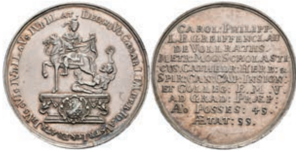
5437 Silbermedaille (Dm. ca. 43,20mm, ca. 27,61g), 1745, auf Karl Philipp von Greiffenklau-Vollraths und sein Jubiläum als Mainzer Domkanonikus. Av: St. Martin zu Pferd auf einem Postament nach links, den Mantel mit einem Bettler teilend, darum Umschrift. Rev: 10 Zeilen Schrift. Slg. P. A. 838, Slg. Walther 716, kl. Rf., f. vz. Exemplar der Sammlung R. Walther. Los 716 der 275. Auktion. Dr. Busso Peus, Frankfurt a.M., 1971. (Abbildung auf 97% verkleinert) 150,—