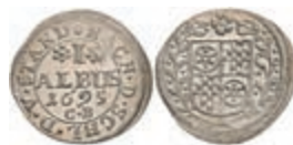
5309 1 Albus, 1695, Anselm Franz von Ingelheim, Slg. Walther 441, vz-st. 100,—