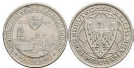
306 3 Reichsmark, 1931, Magdeburg, wz. Rf., vz+. J. 347 100,—