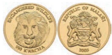
438 100 Kwacha, Gold, 2005, Löwe, PP. 350,—