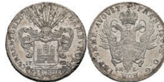
85 32 Schilling, 1752, mit Titel Franz I., Dav. 540, Gaedechens 637, Schröttingsfehler am Rand, ss-vz. 70,—