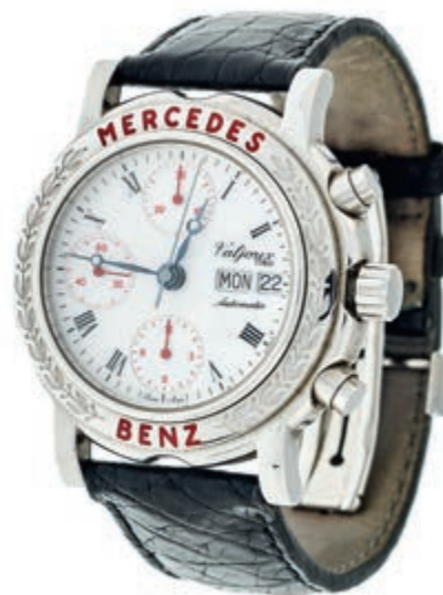
1327 Mercedes-Benz Collection Classic Valjoux 7750 Chronograph Herren Armbanduhr. Ca. 39mm, Edelstahl, Boden aus Saphirglas, gewölbtes Saphirglas auf Oberseite mit feiner Metallisation - durch Anhauchen wird der Mercedes-Stern sichtbar, Automatik. Weißes Ziffernblatt, temperaturgebläute Stahlzeiger, Datums und Tagesanzeige. 3 Totalisatoren mit Sekunde, 1/10 Sekunde und Minutenanzeige. Exemplar No. 646 von 1000 limitierten Stücken. Sehr guter Zustand. Original Mercedes Lederarmband in schwarz mit Original Mercedes Faltschnalle. Mit Bedienungsanleitung und Zertifikat. 500,—