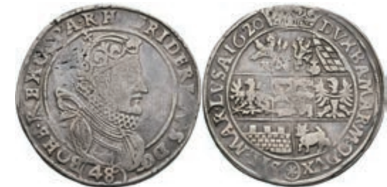
46 1/2 Taler (48 Kreuzer), 1620, Friedrich von der Pfalz, Kuttenberg, Herinek 20, Schrötlingsfehler, ss. 200,—