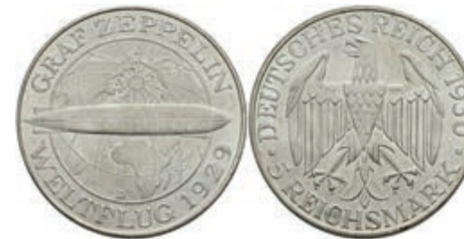
298 5 Reichsmark, 1930, D, Zeppelin, kl. Rf., vz+. J. 343 150,—