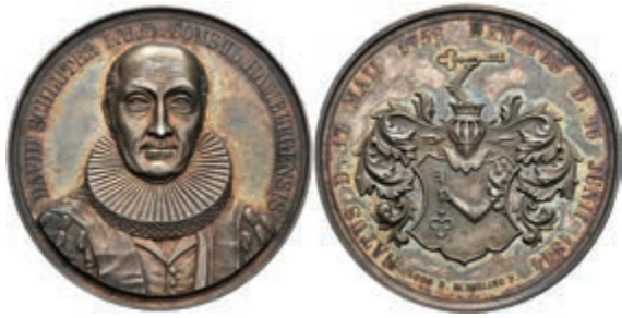
630 Hamburg, Silbermedaille (Dm. ca. 38,90mm, ca. 20,70g), 1844, sign. Loos D. Schilling F., Tod des Bürgermeisters David Schlüter. Av: Brustbild von vorn, darum Umschrift. Rev: Wappen, darum Umschrift. Schöne Patina, vz-st. 80,—