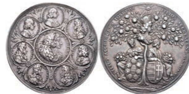
5416 Silbermedaille (Dm. ca. 48,25mm, ca. 34,32g), 1690, von P. H. Müller, auf die Krönung Josephs I. in Augsburg. Av: Büste Josephs und seines Sohnes im Medaillon nach rechts, darum 7 weitere Medaillons mit Büsten. Rev: Thronende Germania und Hungaria unter einem Baum mit Büste Joseph I.. Slg. Mont. 1210, Forster 828, ss. (Abbildung auf 87% verkleinert) 600,—