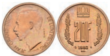
436 20 Francs, Bronze, 1980, Jean, Essai, Haarlinien, st. 50,—