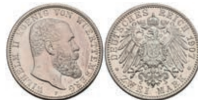
214 2 Mark, 1907, Wilhelm II., st. J. 174 50,—