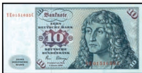
942 10 Deutsche Mark, 2.1.1980, Austauschnote Serie YE/C Ro. 281b. Erh. I (Abbildung auf 50% verkleinert) 200,—