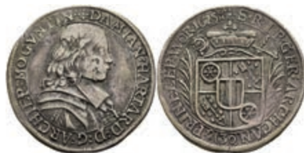
5260 1/2 Gulden (30 Kreuzer), 1675, Damian Harthard von der Leyen, Slg. Walther 354, ss. 250,—