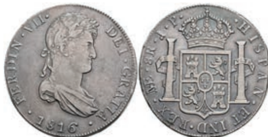
456 8 Reales, 1816, Ferdinand VII., Lima, JP, KM 117.1, ss+. 130,—