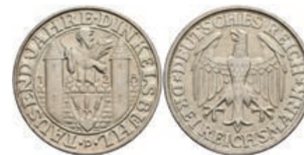
283 3 Reichsmark, 1928, Dinkelsbühl, kl. Rf., vz-st. J. 334 450,—