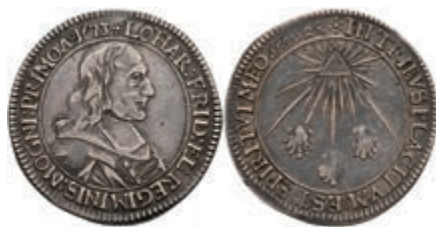
5295 1/4 Taler, 1673, Lothar Friedrich von Metternich-Burscheid, Slg. P. A. 506, Slg. Walther -, Slg. Heerdt 398, ss. Sehr selten! 500,—