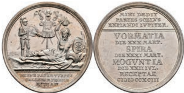
5456 Silbermedaille (Dm. ca. 41,60mm, ca. 29,94g), 1793, von Stockmar, auf den Entsatz der Städte Worms, Speyer und Mainz. Av: Liegender Flussgott mit Mainzer Schild nach rechts, dahinter Trophäe und Krieger, im Abschnitt darunter 3 Zeilen Schrift. Rev: 11 Zeilen Schrift. Slg. P. A. 859, Slg. Walther -, kl. Kratzer und Rf., vz. 800,—