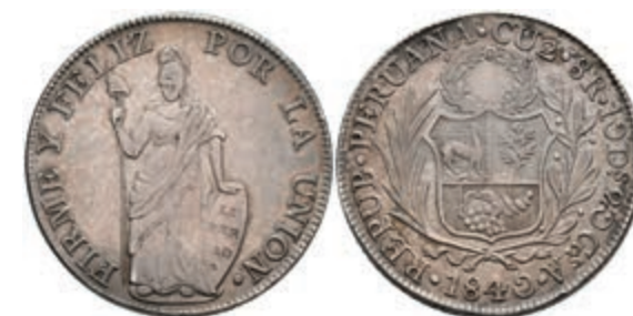
463 8 Reales, 1840, Cuzco, A, KM 142.9, ss 100,—