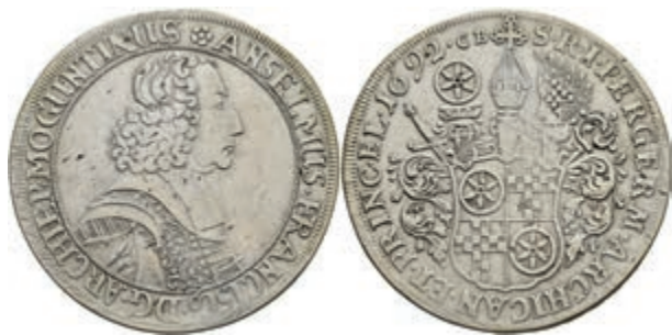
5305 Taler, 1692, Anselm Franz von Ingelheim, Dav. 5571, Slg. Walther 427, kl. Schrötlingsfehler, justiert, ss. Selten! (Abbildung auf 94% verkleinert) 800,—