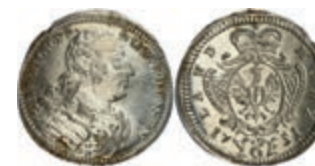
66 6 Kreuzer, 1751, Karl Wilhelm Friedrich, Slg. Wilm. 1036, vz-st. 80,—