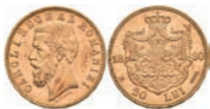
478 20 Lei, Gold, 1890, Karl I., Fb. 3, vz. (Abbildungen siehe Onlinekatalog) 350,—