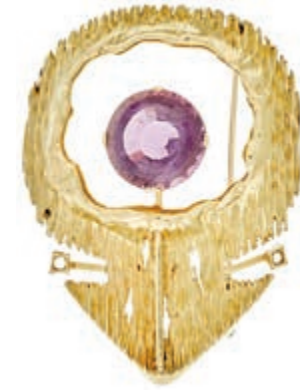
1278 Brosche mit Amethyst, 585 Gelbgold, Stein rund facettiert 18,7 mm, Handarbeit, 5,67x 4,34cm, 22,36g. 600,—