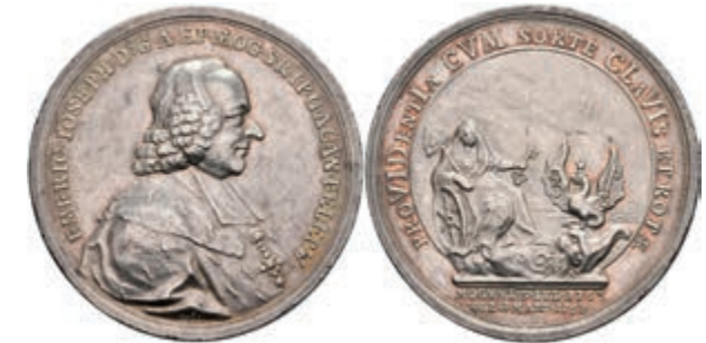
5444 Emmerich Joseph von Breitbach-Bürresheim, Silbermedaille (Dm. ca. 42,20mm, ca. 29,23g), 1768, von A. Stieler, auf die Bischof von Worms. Av: Brustbild nach rechts, darum Umschrift. Rev: Sitzende Vorsehung mit Zepter, Schlüssel und Rad, vor ihr der Breitbacher Basilisk mit Rad und Schlüssel auf seinen Flügeln. Slg. P. A. 736, Slg. Walther 609, kl. Rf., ss-vz. 250,—