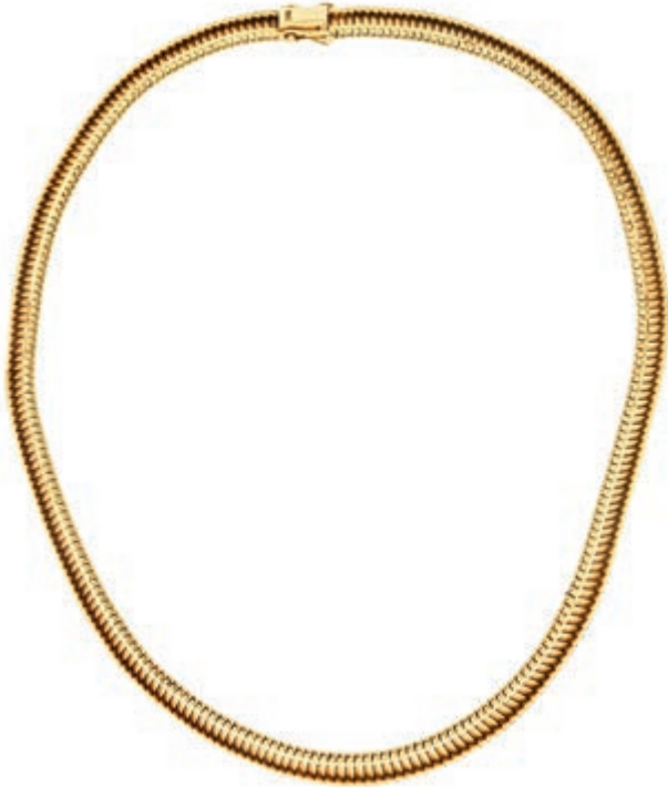
1267 Zeitloses Collier mit geometrischem Dekor. 2. Hälfte 20. Jh. 585er GG, gestempelt. L. ca. 41,0 cm. Ca. 56,35 gr. Das passende Armband wird ebenfalls in der Auktion angeboten. (Abbildung auf 61% verkleinert) 1600,—