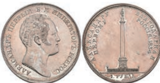
503 Rubel, 1834, Alexander I., St. Petersburg, auf die Enthüllung der Alexandersäule, Bitkin 894, Dav. 285, kl. Kratzer, schöne Patina, vz. 1000,—