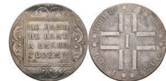
496 Rubel, 1801, Paul I., St. Petersburg, Bitkin 46, ss. 150,—