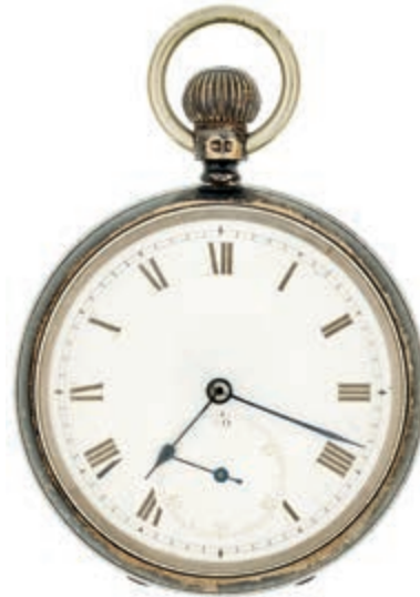
1309 Schwere Taschenuhr, ca. 1914. 925er Silber, punziert, schweizer Uhrwerk, kleine Sekunde, Handaufzug. emailliertes Ziffernblatt, römische Ziffern, blaue Zeiger. Innendeckel aus Silber, punziert, funktionstüchtig. 118,54g, ca. 50,8mm. 100,—