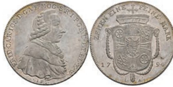
5372 Taler, 1794, Friedrich Karl Joseph von Erthal, Dav. 2429, Slg. Walther 646, leicht justiert, vz-st. 350,—