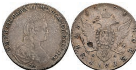
492 Rubel, 1778, Katharina II., St. Peterburg, Bitkin 226, Schrötlingsfehler, ss. 150,—