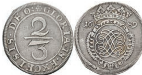
5287 2/3 Taler, 1689, geprägt unter französischer Belagerung, Dav. 660, Slg. Walther 737, ss. 800,—