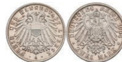
191 2 Mark, 1904, Stadtwappen, min. Rf., wz. Kratzer, f. st. J. 81 100,—