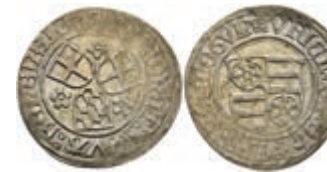
5212 Albus, 1512, Uriel von Gemmingen, Slg. P. A. 231, Slg. Walther 178 var., ss. 100,—