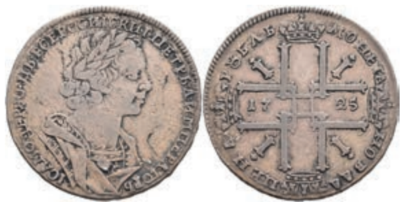
480 Rubel, 1725, Peter I., Moskau, Bitkin 975 Var., Dav. 1662, Schröttingsfehler, ss. 300,—