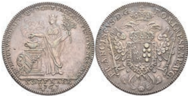
101 Taler, 1763, auf den Frieden von Hubertusburg, Dav. 2488, Kellner 340, Stempelfehler, f. vz. 150,—