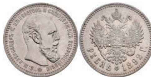
515 Rubel, 1892, Alexander III., St. Petersburg, Bitkin 76, kl. Kratzer, vz. 400,—