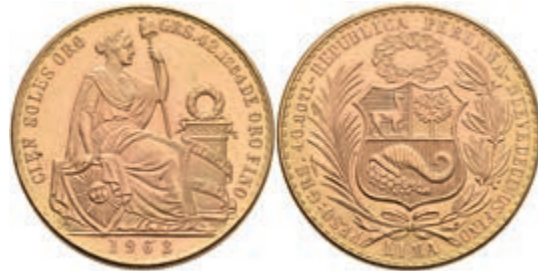
469 100 Soles, Gold, 1963, Fb. 78, vz+. 1800,—