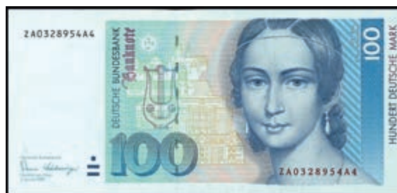
946 100 Deutsche Mark, 2.1.1989, Austauschnote Serie ZA/A4, Ro. 294b. Erh. I (Abbildung auf 50% verkleinert) 280,—