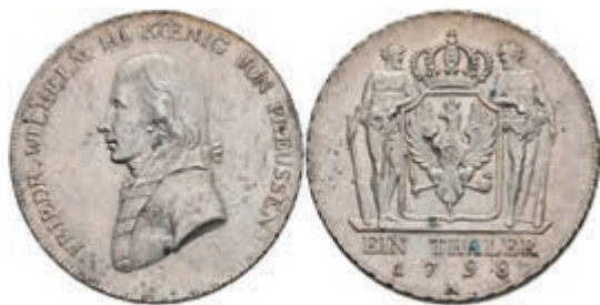
72 Taler, 1798, A, Friedrich Wilhelm III., J. 29, Dav. 2603, vz. 300,—