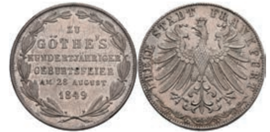
157 Doppelgulden, 1849, Goethe, AKS 41, J. 48, kleine Kratzer und Randfehler, vz. 100,—