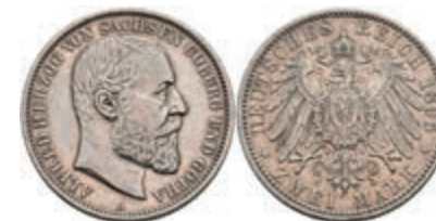
205 2 Mark, 1895, Alfred, ss. J. 145 500,—