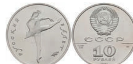
539 10 Rubel, Palladium, 1991, Russisches Ballett, Parchimowicz 243, st. 900,—