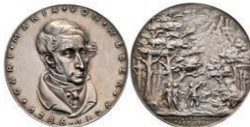
723 Silbermedaille (Dm. ca. 36mm, ca. 19,36g), 1926, von K. Goetz, auf die fünften Wartburger Maientage. Av: Büste Webers halbrechts, darum Umschrift. Rev: Menschengruppe im Wald, im Hintergrund auf dem Hügel die Wartburg. Kienast 396, Rand punziert, vz. 100,—