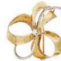
1279 Schleifenbrosche mit Zirkonia, 585 Gelb- und Weißgold, 3,55g, gemarkt "EH11", Größe ca 2,7x 2,8cm. 180,—

Goldmünzen ab 1800 sowie Goldbarren sind als Anlagegold ggf. umsatzsteuerfrei (auch für das Aufgeld), soweit der Zuschlagpreis inkl. Aufgeld und Losgebühr nicht höher als der Goldwert + 80% ist.