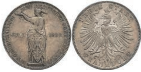
160 Taler, 1862, Schützenfest, AKS 44, J. 51, vz. 80,—