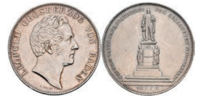
138 Doppeltaler, 1844, Carl Leopold Friedrich, Carl-Friedrich-Denkmal, AKS 110, J. 59, kl. Rf., ss. 150,—