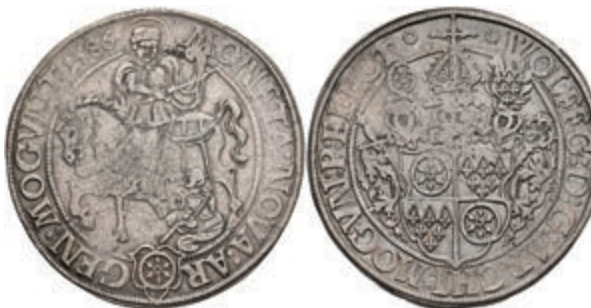
5220 Taler, 1586, Wolfgang von Dalberg, Dav. 9464, ss. Selten! 1300,—