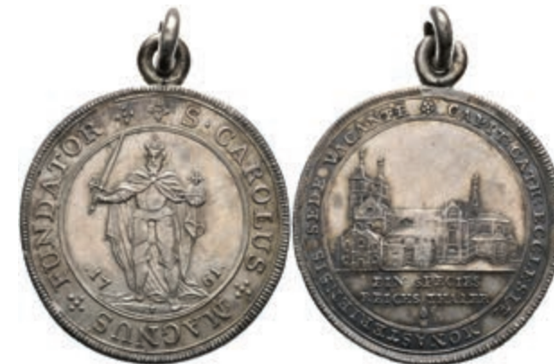
96 Taler, 1761, Sedisvakanz, Schulze 251, Dav. 2470, gehenkelt, ss-vz. 450,—