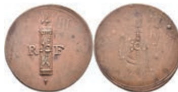
5499 Kupfermarke, o.J. Av: Fascis zwischen "R - F". Rev: Rad, darüber "B: Z.". Überprägungsspuren. Slg. Walther -, ss. 30,—