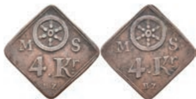
5495 Brückenzollmarke zu 4 Kreuzer, Kupfer, o.J. Av: Rad zwischen "M. - S.", darunter "4. Kr. / B. Z.". Rev: Gleich Avers. Slg. Walther -, ss. 50,—