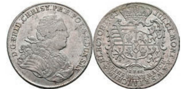
118 Taler, 1763, Friedrich Christian, Leipzig, Dav. 2677, Kahnt 1005, Schnee 1052, kl. Kr., ss-vz. 250,—