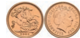
420 1/2 Sovereign, 2003, Elisabeth II., Fb. 455, st. 150,—