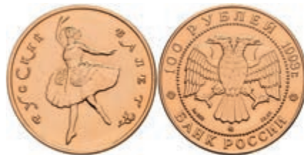
544 100 Rubel, Gold, 1993, Russisches Ballett, Parchimowicz 1803a, etw. angelaufen, st. 600,—