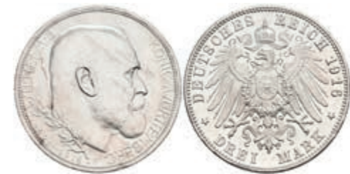
218 3 Mark, 1916, Wilhelm II., zum 25jährigen Regierungsjubiläum, Randfehler, Avers st matt, Revers PP. J. 178 6000,—