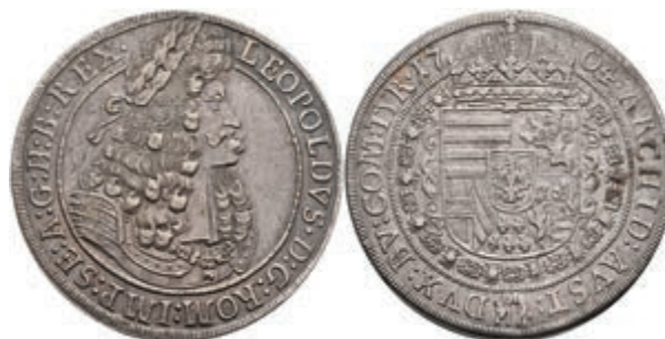
54 Taler, 1704, Leopold I., Hall, Voglhuber 221/7, Herinek 652, Rand bearbeitet, wz. Schröttingsfehler, ss. 120,—