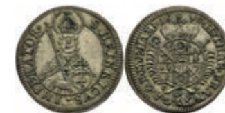
5313 Batzen (4 Kreuzer), 1698, Lothar Franz von Schönborn, Slg. P. A.-, Slg. Walther -, ss. 30,—