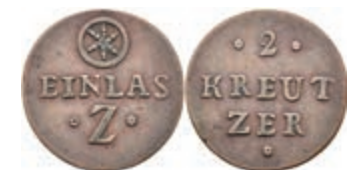
5477 Einlassmarke zu 2 Kreuzer, Kupfer, o.J. Av: 2 zwischen zwei Rosetten, darunter "KREUT / ZER", darunter Rosette. Rev: Rad, darunter "EINLAS" und "Z" zwischen zwei Rosetten. Slg. Walther 772, ss. 30,—