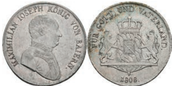
140 Taler, 1813, Maximilian I. Joseph, AKS 48, J. 13, ss-vz. 100,—