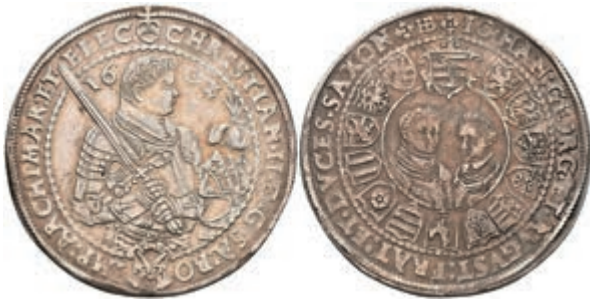
110 Taler, 1602, Christian II., HB, Keilitz/Kahnt 222, Schnee 758, ss. 150,—