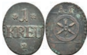
5487 Tormarke zu 1 Kreuzer, Kupfer, o.J. Av: 1 zwischen zwei Rosetten, darunter "KREU" und Rosette. Rev: Rad darüber "A. T.". Slg. Walther 779, ss. 30,—