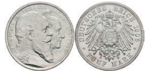
180 2 Mark, 1906, Friedrich I., zur goldenen Hochzeit, st. J. 35 130,—