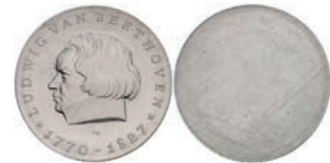
349 5 Mark, 1970, Ludwig van Beethoven, einseitiger Aluminiumabschlag der Vorderseite, st. Auflage nur 300 Stück. J. 1528A. 50,—