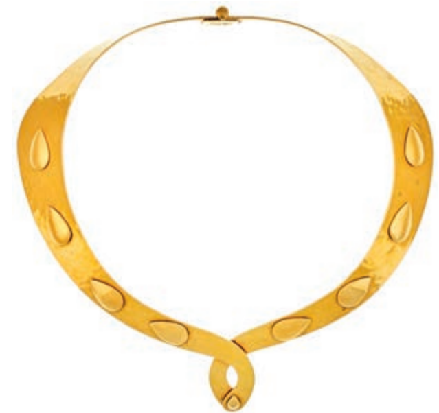
1262 Extravagantes und unikates Collier, das nach Kundenwunsch von der Firma Hans Münstermann, Königsallee 92, Düsseldorf in Handarbeit gefertigt wurde. Um 2000. 750er GG, gestempelt. Hans Münstermann, gestempelt. Bez. "HANDARBEIT". Dm. ca. 12,2/15,8 cm. Ca. 118,05 gr. (Abbildung auf 57% verkleinert) 4400,—