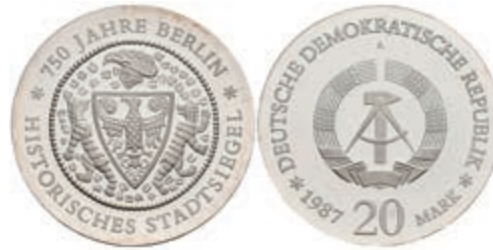
367 2x 20 Mark, 1987, Stadtsiegelpärchen, 2 Varianten, in Originaltui mit Zertifikat, in Kapsel, leicht angelaufen, PP. J. 1617. 500,—