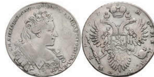
484 Rubel, 1732, Anna, Kadashevsky Münzhof, Bitkin 48, ss. 200,—