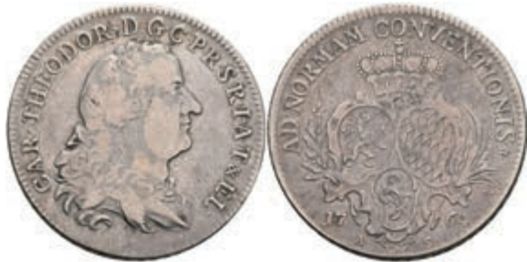
102 Pfalz-Sulzbach, Taler, 1764, Karl Theodor, Mannheim, Dav. 2539A, ss. 100,—