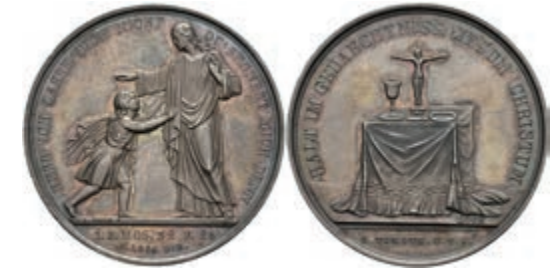
647 Silbermedaille (Dm. ca. 36,50mm, ca. 13,87g), o.J., von Heldt und Loos, Av: Christus segnet Kind, darum Umschrift. Rev: Altar, darum Umschrift. Schöne Patina, vz. 50,—