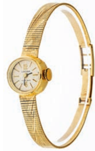
1312 Savonette mit separater Sekunde. Um 1900. Es handelt sich um eine Uhr, die versucht vorzugeben sie sei eine Breguet. Vorder- und Rückdeckel mit Eichhörchenpunze. Rückdeckel bez. "K14". Vorderdeckel bez. "K". Säuretest 585er RG, positiv. Dm. ca. 39 mm. Ca. 320,—