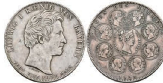
143 Geschichtstaler, 1828, Ludwig I., Segen des Himmels, AKS 121, J. 37, kl. Rf., ss. 100,—