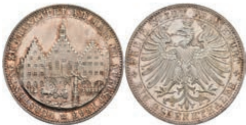
163 Taler, 1863, Fürstentag, AKS 45, vz-st. 150,—