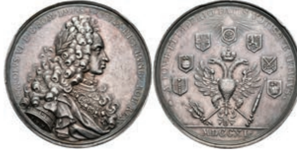
5424 RDR, Silbermedaille (Dm. ca. 44,59mm, ca. 48,70g), 1711, von P. H. Müller, auf die Krönung Karls VI. zum römischen Kaiser. Av: Brustbild des Kaisers nach rechts, Umschrift. Rev: Gekrönter Doppeladler mit Zepter und Blitz, darum 7 Wappen und Umschrift. Förschner 132, Forster 772, Slg. Mont. 1359, Randfehler, schöne Patina, ss. (Abbildung auf 82% verkleinert) 200,—