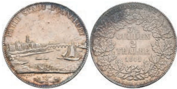
150 Doppeltaler, 1841, AKS 2, J. 23, kl. Kr., Hsp., ss. 100,—