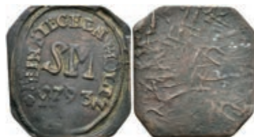
5502 Einseitige Holzmarke, Kupfer, 1793. Av: "SM / 1793", darum Umschrift. Slg. Walther -, wohl unediert, ss. 100,—