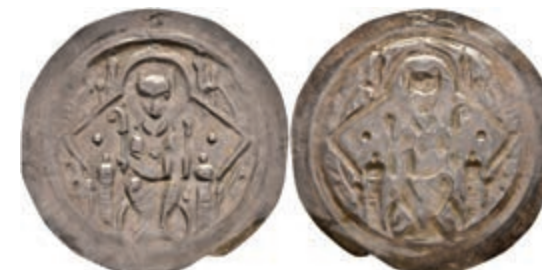
5183 Brakteat (0,59g), Lupold von Schönfeld, 1203-1208. In einem zu den Seiten eckigen und oben Runden Dreipass thronender Erzbischof mit Krummstab und Kreuzstab von vorn. Slg. Löbbecke 614, zaponiert, ss. 250,—