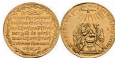
623 Nürnberg, Goldmedaille (Dm. ca. 28,10mm, ca. 6,95g), o.J. (18. Jh.), un-sign. Av: Taufszene. Rev: 6 Zeilen Schrift im Lorbeerkranz. Slg. Erlanger 2446, Slg. Goppel 4383, kl. Rf., ss-vz. 500,—