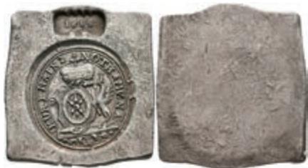
5280 Klippe (24,12g), 1688, Bäckersche Fälschung, Hill 352, Brause/Mansfeld Tf. 17, Nr. 3, ss. 100,—