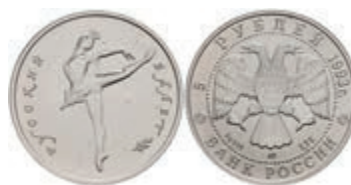
546 5 Rubel, Palladium, 1993, Russisches Ballett, Parchimowicz 1301a, wz. Flecken, st. 450,—