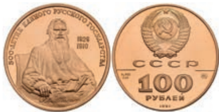
540 100 Rubel, Gold, 1991, Graf Leo Tolstoj, Parchimowicz 273, Fb. 209, in Originalausgabeschatulle, Fingerabdrücke, PP. 600,—