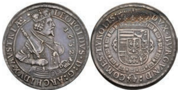
48 Taler, 1632, Leopold V., Hall, Dav. 3338, Voglhuber 183/IV, ss. 120,—