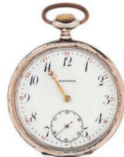
1313 Herrentaschenuhr mit separater Sekunde der Firma Saxonia. 1. Hälfte 20. Jh. Gehäuse 800er Silber, gestempelt. Feingehaltsstempel Schweiz und Reichsstempel Deutschland. Staubdeckel aus Metall. Modellnr. 3418831. Rückdeckel wohl per Hand bez. "FB", Rückdeckel innen bez. "Fr. Bruns" u.a. Dm. ca. 4,1/4,9 cm. Gebrauchs- und Altersspuren. Ca. 73,69 gr. Uhrwerk nicht geprüft. 60,—