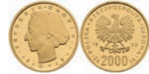
474 2000 Zloty, Gold, 1977, Frederic Chopin, Fb. 119, kl. rote Flecken, PP. 250,—