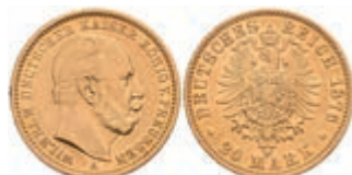
246 20 Mark, 1876, A, Wilhelm I., ss. J. 246. 340,—