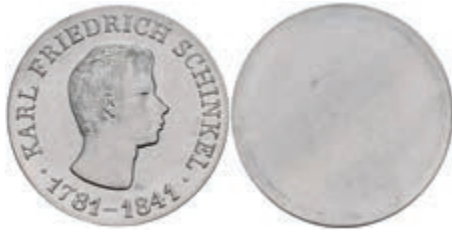
339 10 Mark, 1966, Karl Friedrich Schinkel, einseitiger Aluminiumabschlag der Vorderseite, st. Auflage nur 300 Stück. J. 1517A. 50,—