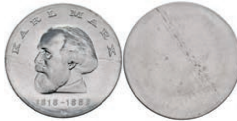
343 20 Mark, 1968, Karl Marx, einseitiger Aluminiumabschlag der Vorderseite, vz-st. Auflage nur 300 Stück. J. 1521A. 50,—