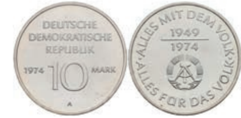
373 10 Mark, 1974, 25 Jahre DDR, Legierungsprobe Ag 500/Cu 500, st. J. 1551P. 200,—