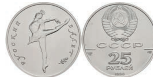
537 25 Rubel, Palladium, 1990, Russisches Ballett, Parchimowicz 248, wz. Flecken, st. 1800,—