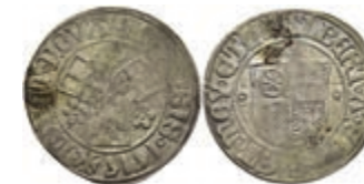
5213 Groschen, 1515, Albrecht II. von Brandenburg, Slg. Walther 184, Knickspur, s-ss. 50,—