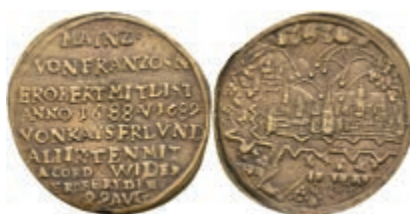
5412 Æ-Jeton (Dm. ca. 29,70mm, ca. 4,25g), 1689, unsign., auf die Wiedereinnahme der Stadt. Av: Ansicht der unter Beschuss stehenden Stadt. Rev: 9 Zeilen Schrift. Slg. P. A. 855, Slg. Walther -, ss. 70,—