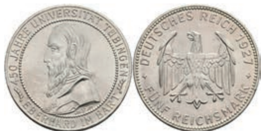
275 5 Reichsmark, 1927, Tübingen, wz. Kr., vz-st. J. 329 250,—