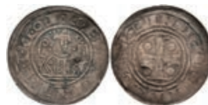
5179 Pfennig (0,66g), Christian von Buch, 1165-1183. Brustbild des Erzbischofs mit Krummstab und Buch von vorn. Rev: Kreuz, in den Winkeln jeweils eine Kugel. Slg. Walther -, Cappe -, kl. Schrötlingsriss, f. ss. Wohl unediert. Mit Unterlegzettel der Westfälischen Auktionsgesellschaft, Arnsberg. 1000,—