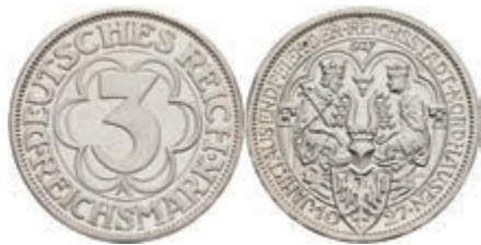
273 3 Reichsmark, 1927, Nordhausen, kl. Kratzer, PP. J. 327 130,—