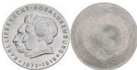
353 20 Mark, 1971, Liebknecht und Luxemburg, einseitiger Aluminiumabschlag der Vorderseite, st. Auflage nur 410 Stück. J. 1533A. 50,—