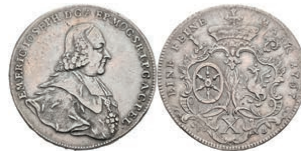
5353 Taler, 1767, Emmerich Joseph von Breitbach-Bürresheim, Dav. 2426, Slg. Walther 606, ss. 200,—