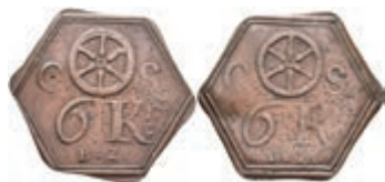
5467 Brückenmarke, Kupfer, o.J. Av: Rad zwischen "C - S". darunter "6 Kr. / B.Z.". Rev: Gleich Avers. Slg. Walther 787, ss. 80,—