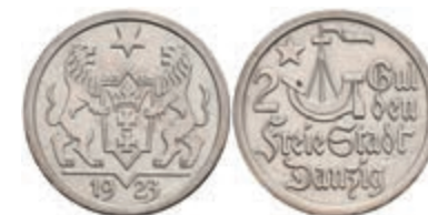
317 Danzig, 2 Gulden, 1923, Kogge, kleine Kratzer, vz. J. D8 100,—

Alle Einzellose und Zertifikate/Gutachten sind unter www.rhenumis.de farbig abgebildet!