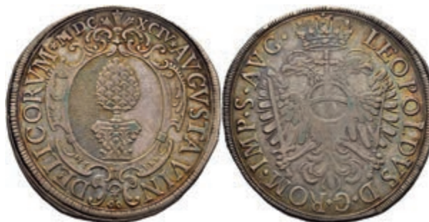
62 Taler, 1694, mit Titel Leopold I., Dav. 5049, Forster 403, Rand bearbeitet, ss. 150,—