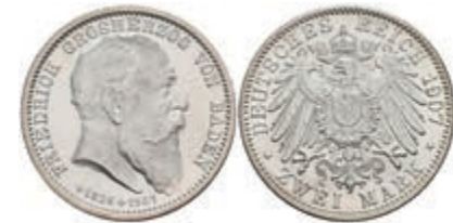
181 2 Mark, 1907, Friedrich I., auf seinen Tod, wz. Kratzer, st. J. 36 50,—