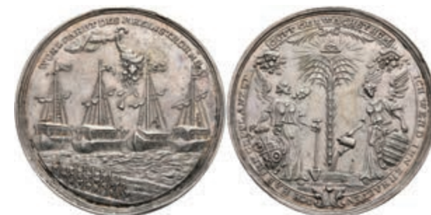
5435 Johann Friedrich Karl von Ostein, Silbermedaille (Dm. ca. 46,40mm, ca. 30,85g), o.J. (1744), unsign., auf die Förderung der freien Rheinschiffahrt. Av: Palmbaum, zu den Seiten zwei Genien, darüber das strahlende Auge Gottes, darum Umschrift. Rev: Vier bemannte Rheinschiffe (Mainz, Trier, Cöln und Pfalz), darüber Hand aus Wolke mit Füllhorn und "WOHLFAHRT DES RHEINSTROHMS". Slg. P. A. -, Slg. Walther 514, kl. Rf., vz. Sehr selten! (Abbildung auf 90% verkleinert) 2500,—