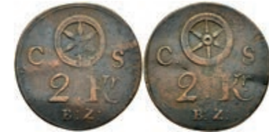
5474 Brückenzollmarke zu 2 Kreuzer, Kupfer, o.J. (18./19. Jh.). Av: Rad zwischen "C - S", darunter 2. Kr. / B:Z:". Rev: Gleich Avers. Slg. Walther 786, Knickspur, ss. 30,—