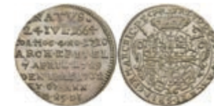
5329 Groschen, 1732, Franz Ludwig von Pfalz-Neuburg, auf seinen Tod, Slg. Walther 497, vz. Sehr selten! 200,—