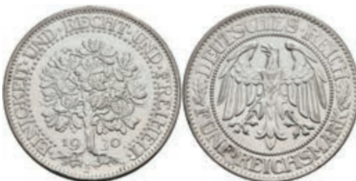
279 5 Reichsmark, 1930, F, Eichbaum, kl. Rf., ss-vz. J. 331 350,—