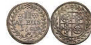
5279 2 Albus, 1681, Anselm Franz von Ingelheim, Slg. Walther 405, f. vz. 40,—