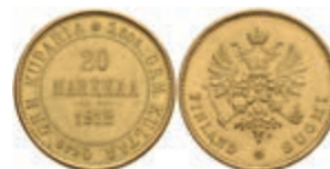
403 20 Markkaa, Gold, 1912, Nikolaus II., Fb. 3, vz. 350,—