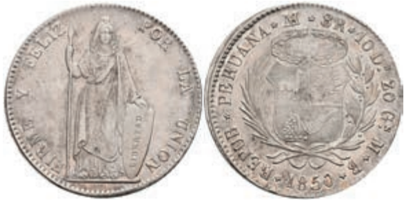
464 8 Reales, 1850, Lima, MB, Roped edge, KM 142.10, kl. Rf., vz. 400,—