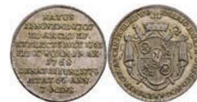
5364 1/6 Taler, 1774, Emerich Joseph von Breitbach-Bürresheim, auf seinen Tod. Slg. Walther 627, ss-vz. 100,—