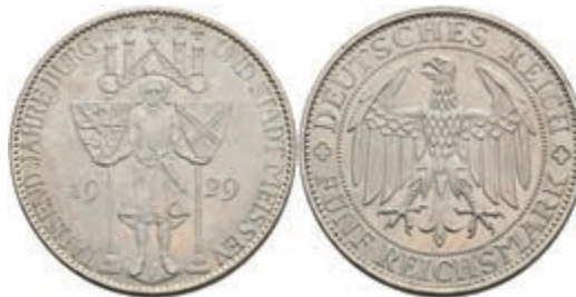
292 5 Reichsmark, 1929, Meißen, wz. Rf., vz. J. 339 230,—