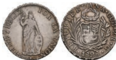
458 2 Reales, 1828, Cuzco, G, KM 141.2, ss. 50,—