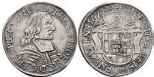
5509 Gulden (60 Kreuzer), 1672, Lothar von Metternich-Burscheid, Dav. 992, Rand bearbeitet, ss. 200,—