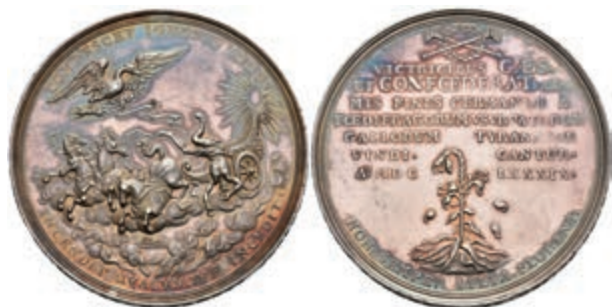
5410 Silbermedaille (Dm. ca. 49,50mm, ca. 44,79g), 1689, von P. H. Müller, auf die Wiedereinnahme der Stadt. Av: Sturz des Phaetons aus der Sonnenquadriga, darüber ein Adler mit Blitzen. Rev: 7 Zeilen Schrift, darüber zwei gekreuzte Posaunen, darunter geknickte Lilie. Slg. P. A. 853 (Zinn), Slg. Walther 746, schöne Patina, Kratzer, vz. (Abbildung auf 84% verkleinert) 1000,—