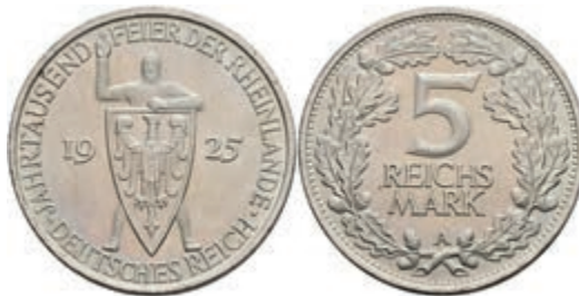
265 5 Reichsmark, 1925, A, Rheinlande, wz. Rf., vz-st. J. 322 70,—