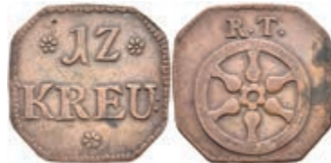
5483 Tormarke zu 12 Kreuzer, Kupfer, o.J. Av: 12 zwischen zwei Rosetten, darunter "KREU", darunter Rosette. Rev: Rad, darüber "R. T.". Slg. P. A. -, Slg. Walther -, ss. 80,—