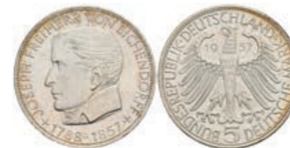
328 5 Mark, 1957, Eichendorff, f. st. J. 391 80,—