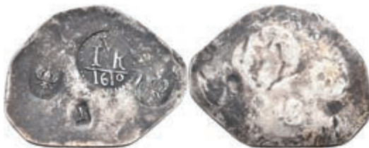
91 Notklinge zu 1 Taler (4,24g), 1610. Vier Stempel auf Silberplatte. Brause/Mansfeld -, ss. Vermutlich spätere Anfertigung! 100,—