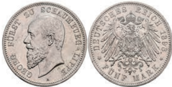
209 5 Mark, 1898, Georg, kl. Rf., vz. J. 165 1200,—