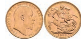
418 Sovereign, Gold, 1903, Edward VII, KM 805, Rf., ss-vz. 340,—