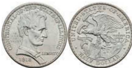
596 1/2 Dollar, 1918, Illinois-Lincoln, KM 143, leichter Grünspan, vz. 50,—