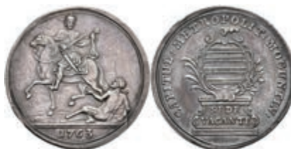
5339 1/4 Schautaler, 1763, Sedisvakanz, Slg. P. A. 708, Slg. Walther 591, kl. Rf., Stempelfehler, ss. 200,—