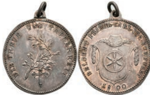
5459 Friedrich Karl Joseph von Erthal, gehenkelte Tapferkeitsmedaille (Dm. 35,70mm, ca. 15,18g), Silber, 1800, unsign., für den Kurmainzer Landsturm in den Gefechten bei Aschaffenburg. Av: Schwert und Lorbeerzweig, darum Umschrift. Rev: Wappen, darum Umschrift. Slg. P. A. 797, Slg. Walther 673, kl. Kratzer, vz-st. Sehr selten! 800,—