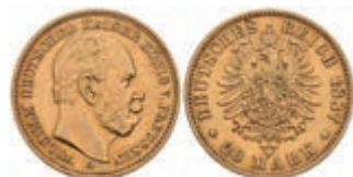
247 20 Mark, 1887, Wilhelm I., kl. Kr., ss. J. 246 300,—