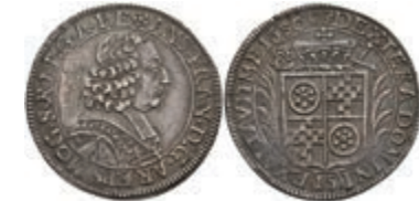
5276 1/4 Taler, 1680, Anselm Franz von Ingelheim, Slg. Walther 402, Schröttingsfehler/Druckstelle, ss. Selten! 200,—