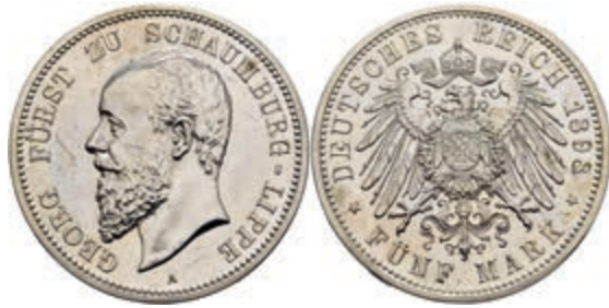
208 5 Mark, 1898, Georg, Kratzer, vz-st. J. 165 600,—