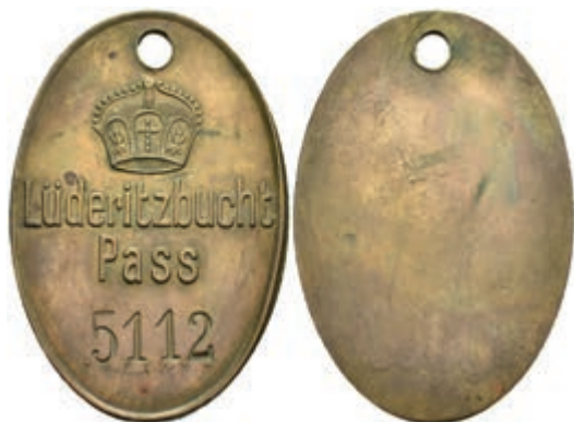
319 Deutsch-Südwestafrika, ovale Bronze-Kontrollmarke (ca. 35,4x52,3mm) Lüderitzbucht Pass mit der Nummer 5112 am Lederband. Diente als Ausweismarke für Eingeborene im Schutzgebiet der Firma Beck & Co., Leipzig. Gelocht, vz. 150,—