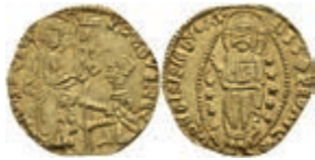
425 Imitation eines Zecchino (3,46g), vermutlich 14. Jh., ss-vz. 200,—