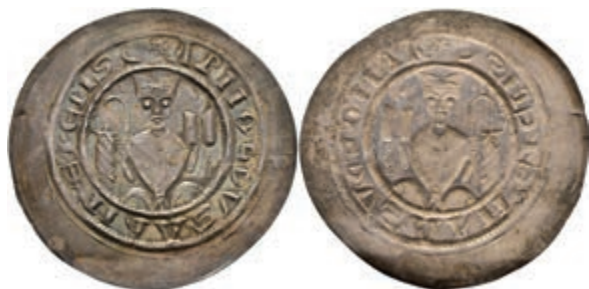
5176 Brakteat (0,93g), Arnold von Seelenofen, 1153-1160. Brustbild des Erzbischofs mit Krummstab und Buch von vorn, links Turm, darum Umschrift. Slg. Löbbecke 599, Slg. Walther 28, etwas wellig, ss-vz. Selten! 800,—