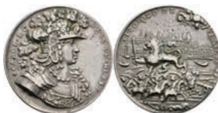
5405 Hessen-Kassel, Karl, Silbermedaille (Dm. ca. 30,20mm, ca. 10,39g), o.J. (1689), von J. Smelzing, auf die Einnahme von Mainz. Av: Brustbild nach rechts, darum Umschrift. Rev: Von der Hand Gottes geführter hessischer Löwe nach links, im Hintergrund die Stadt Mainz, im Vordergrund vier Reiter und eine Kanone, darum Umschrift. Schütz 1509, Müller 2426a, ss. 300,—