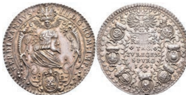
5512 Regensburg, Ferdinand III., Silbermedaille (Dm. ca. 43mm, ca. 18,81g), 1641, von H. G. Bahre, auf die Eröffnung des Reichstages. Av: Büste Ferdinand III. nach rechts, darunter Stadtwappen, darüber Krone, darum Umschrift. Rev: 5 Zeilen Schrift, darum Wappenkranz. Plato 88, Slg. Montenuovo 811, ss-vz. (Abbildung auf 97% verkleinert) 300,—