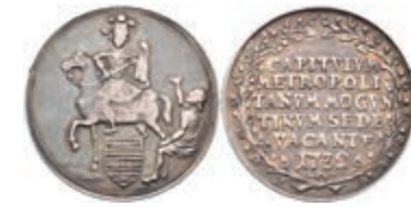
5326 1/8 Schautaler, 1732, Sedisvakanz, Slg. Walther 502, f. ss. 200,—