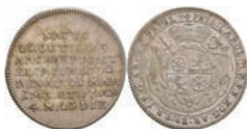
5335 Groschen, 1743, Philipp Karl von Eltz-Kempenich, auf seinen Tod, Slg. Walther 507, f. vz. 100,—