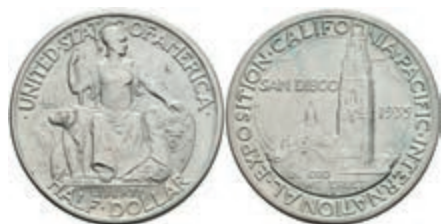
605 1/2 Dollar, 1935, S, California-Expo, KM 171, leichter Grünspan, vz. 50,—