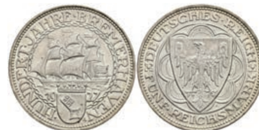
270 5 Reichsmark, 1927, Bremerhaven, wz. Rf., vz. J. 325 200,—