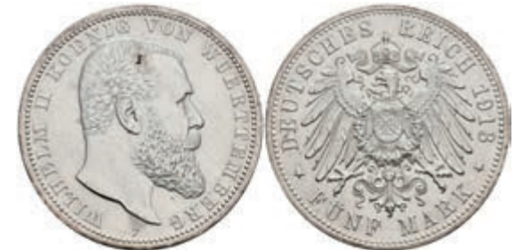
216 5 Mark, 1913, Wilhelm II., vz. J. 176 50,—