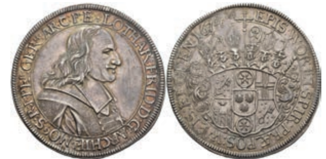
5256 Dicker Doppeltaler (57,35g), 1674, Lothar Friedrich von Metternich-Burscheid, Dav. 5559, Slg. Walther 345, schöne Patina, vz. Sehr selten! (Abbildung auf 93% verkleinert) 10000,—