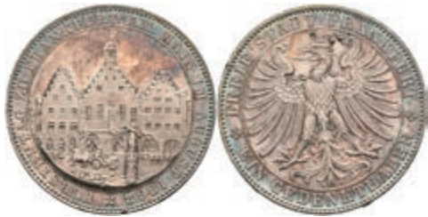
161 Taler, 1863, Fürstentag, AKS 45, kl. Rf., schöne Patina, vz. 150,—