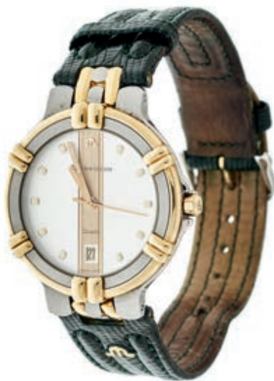
1325 Maurice Lacroix Calypso Herren Armbanduhr. Ca. 35mm, Stahl, Ref.-Nr.: 95346, Quarz. Datumsanzeige, weißes Ziffernblatt mit vergoldeten Details, Zeiger fluoreszierend. Guter Zustand, leichte Kratzer rückseitig. Originales Maurice Lacroix Armband in Eidechsenoptik mit Dornschnalle. 270,—