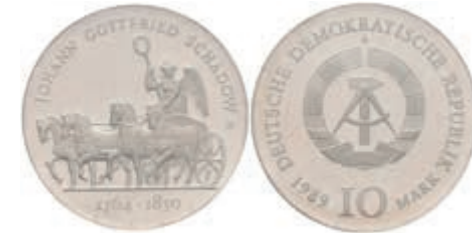
371 10 Mark, 1989, Johann Gottfried Schadow, in Kapsel eingeschweißt, PP. J. 1629. 100,—