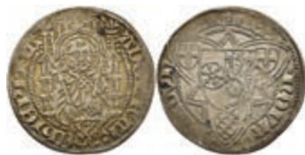
5201 Weißpfennig, o.J. (1461-1475), Adolf II. von Nassau, Slg. P. A. 186 var., ss. 80,—