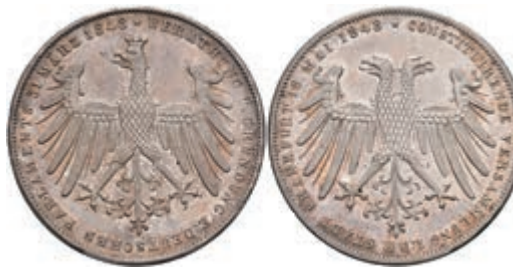
154 Doppelgulden, 1848, 18. Mai 1848, AKS 38, J. 45, minimale Randfehler, vz. 100,—