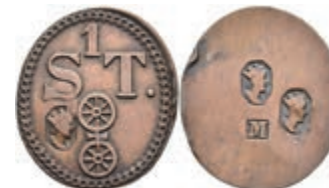
5491 Holzmarke, Kupfer, o.J. Av: "1 / ST.", darunter Doppelrad und Punze. Rev: Drei Punzen. Slg. Walther 811, Slg. P. A. 902, Randfehler, ss. 80,—