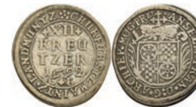
5303 12 Kreuzer, 1692, Anselm Franz von Ingelheim, Slg. Walther 428, ss. 80,—