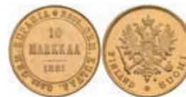
402 10 Markkaa, Gold, 1881, Alexander III., Fb. 5, kl. Kratzer, vz+. 200,—