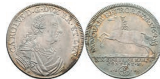
78 2/3 Taler, 1764, Karl I., Welter 2733, vz. 50,—