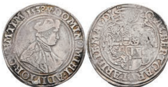
5140 Taler, 1538, Albrecht IV. von Brandenburg, Dav. 9433, kl. Schrötlingsfehler, ss. 800,—