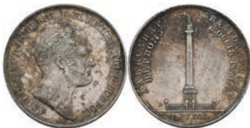
502 Rubel, 1834, Alexander I., St. Petersburg, auf die Enthüllung der Alexandersäule, Bitkin 894, Dav. 285, Kratzer, ss. 500,—