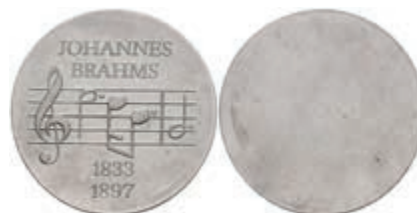
356 5 Mark, 1972, Johannes Brahms, einseitiger Aluminiumabschlag der Vorderseite, st. Auflage nur 300 Stück. J. 1540A. 50,—