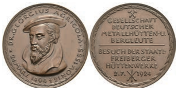
719 Sachsen, Bronzemedaille (Dm. ca. 37,30g, ca. 45mm), 1924, von Hörnlein, auf den Besuch der staatlichen Freiburger Hüttenwerke am 2. Juli. 1924. Av: Brustbild Georgius Agricola halblinks, darum Umschrift. Rev: 7 Zeilen Schrift. F. st. Selten! Auflage nur 51 Stück. (Abbildung auf 92% verkleinert) 120,—