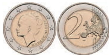
441 2 Euro, 2007, Grace Patricia Kelly zum 25. Todestag, KM 186, in Ausgabeschatulle, vz-st. 2800,—

442 2 Euro, 2015, 800 Jahre Bau der ersten Festung auf dem Felsen (1215- Fondation de la forteresse), in Kapsel, in Originalschatulle mit Zertifikat und Umverpackung, PP. 2400,—