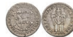
5316 Ritterstift St. Albern, Silberabschlag vom Goldgulden 1716, Slg. P. A. 824, Slg. Walther 727, Schrötlingsfehler, ss. Selten! 100,—