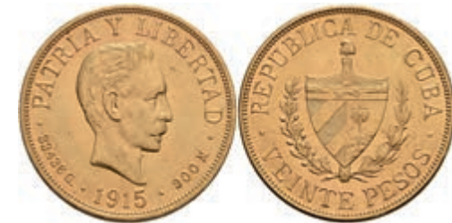
434 20 Pesos, Gold, 1915, Fb. 1, kl. Rf., kl. Kratzer, vz 1500,—