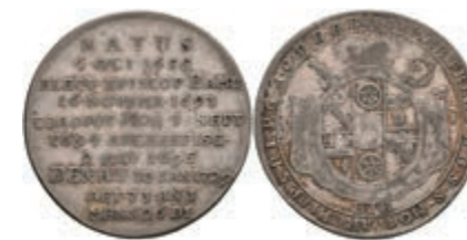
5317 1/4 Taler, 1729, Lothar Franz von Schönborn, auf seinen Tod, Slg. Walther 374, f. ss. 150,—