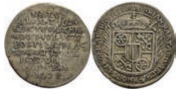
5270 1/8 Taler, 1678, Damian Hartard von der Leyen, auf seinen Tod, Slg. Walther 361, ss. Selten! 250,—