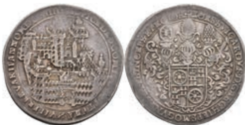
5227 1/4 Taler, 1614, Johann Schweickhardt von Kronberg, auf die Einweihung des Aschaffener Schlosses. Slg. Walther 228, schöne Patina, ss. Sehr selten! 1000,—