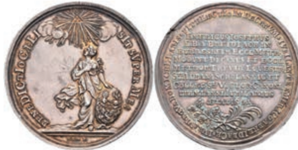
5441 Silbermedaille (Dm. ca. 45,50mm, ca. 25,68g), 1759, sign. van Loon, auf Emerich Joseph von Breitbach-Bürresheim und sein Jubiläum als Domdekan. Av: Stehende weibliche Gestalt mit Familienschild, darüber strahlender Name Jehovas. Slg. P. A. 841, Slg. Walther 719, Randfehler, Kratzer im Feld, vz. (Abbildung auf 92% verkleinert) 200,—