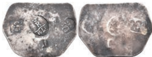
90 Notklinge zu 1 Taler (3,72g), 1610. Vier Stempel auf Silberplatte. Brause/Mansfeld -, ss. Vermutlich spätere Anfertigung! 100,—