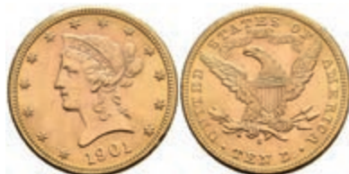
592 10 Dollars, Gold, 1901, Liberty Head, Mzz S San Francisco, Fb. 160, kl. Kr. und Rf., vz+. 600,—