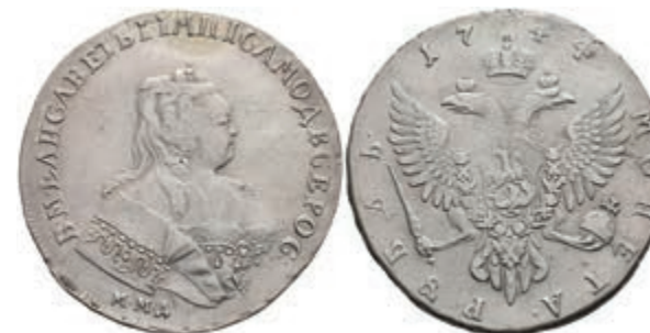
486 Rubel, 1744, Elisabeth, Moskau, Roter Münzhof, Bitkin 114(R1), Hsp., f. ss. 150,—