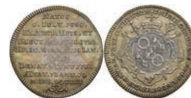
5342 1/8 Taler, 1763, Johann Friedrich Karl von Ostein, auf seinen Tod, Slg. Walther 525, vz-st. Sehr selten! 180,—