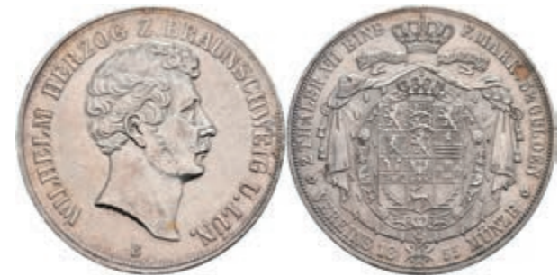
148 Doppeltaler, 1855, Wilhelm, AKS 73, kl. Rf. und Kr., ss. 100,—