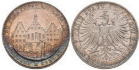
162 Taler, 1863, Fürstentag, AKS 45, J. 52, kleine Randfehler, vz. 100,—