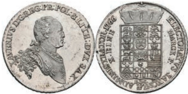
120 Taler, 1766, Xaver, Schnee 1055, Dav. 2678, kl. Schröttingsfehler am Rand, min. justiert, gereinigt, vz-st. 500,—