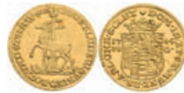
133 ½ Dukat, 1745, Christoph Ludwig II. und Friedrich Botho, Friedrich 1867, Fb. 3337, kl. Druckstellen, leicht wellig, f. vz. 800,—