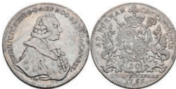
5349 Taler, 1765, Emmerich Joseph von Breitbach-Bürresheim, Dav. 2424, Slg. Walther 596, ss. 150,—