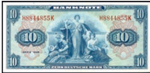
927 10 Deutsche Mark 1948, Kenn.- Bst. H/ Serie K, Ro. 238, Erh. I. (Abbildung auf 50% verkleinert) 300,—