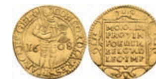
447 Gerlerland, Dukat, 1608, Fb. 237, ss. 300,—