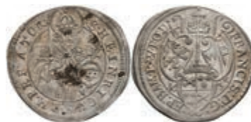
63 Batzen, 1635, Franz Graf von Hatzfeld, Krug 247, etwas Belag, ss-vz. 80,—