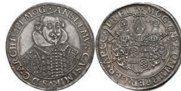
5242 Taler, 1642, Anselm Casimir von Umstadt, Dav. 5552, Slg. Walther 274, bearbeitete Stelle, vz. (Abbildung auf 95% verkleinert) 1500,—