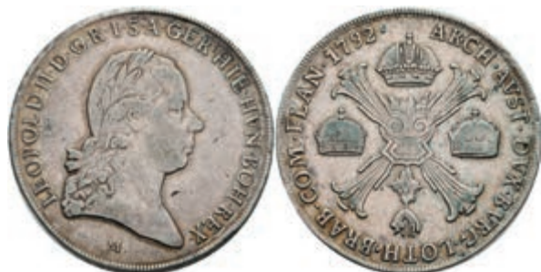
61 Taler, 1792, Leopold II., Mailand, Dav. 1389, J. 95, kl. Schrötlingsfehler, ss. 80,—