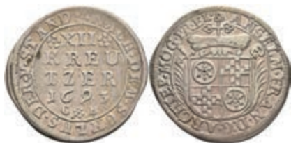
5306 12 Kreuzer, 1693, Anselm Franz von Ingelheim, Slg. Walther 430, ss. 50,—