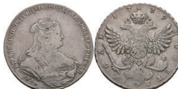
485 Rubel, 1739, Anna, St. Petersburg, Bitkin 236, ss. 200,—