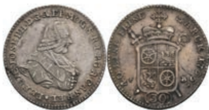
5348 30 Kreuzer, 1765, Emmerich Joseph von Breitbach-Bürresheim, Slg. Walther 598, etw. justiert, ss. 100,—