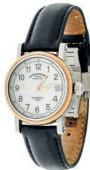
1337 Nautische Instrumente Mühle Glashütte Damen-Sport-Automatic Armanduhr. Ca. 33,8mm, Ref.-Nr.: M1-31-70 Edelstahl mit Goldlünette, Saphirglas, Mineralglasboden, Automatik. Datumsanzeige, Zeiger fluoreszierend, leichte Gebrauchsspuren auf Lünette und rückseitig. Schwarzes Lederarmband mit originaler Mühle Faltschließe. In Box mit Original Papieren. 600,—