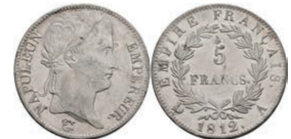
407 5 Francs, 1812, Napoleon I., Paris, Dav. 85, Gadoury 584, Kratzer, Randfehler, ss-vz. 50,—