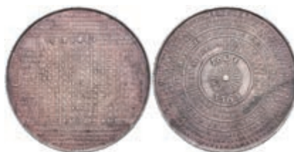
626 Preußen, Silbermedaille (Dm. ca. 44mm, ca. 18,52g), 1804, von Loos, Kalendermedaille. Av: Sonne, darum in mehreren Kreisen verschiedene Kalenderangaben. Rev: Kalenderangaben. Sommer A 111, kl. Druckstelle, kl. Rf., ss. (Abbildung auf 70 % verkleinert) 150,—

Alle Einzellose und Zertifikate/Gutachten sind unter www.rhenumis.de farbig abgebildet!