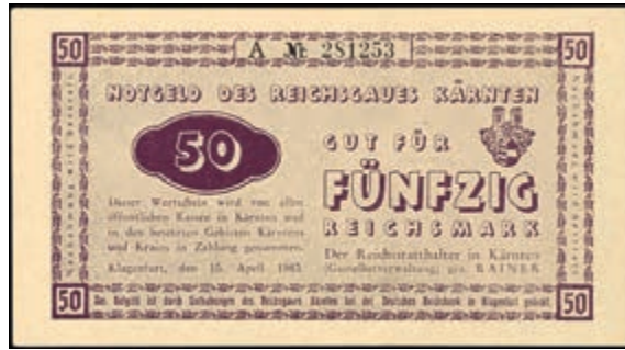
921 Kärnten, 50 Reichsmark, 1945, Ros. 187, Erhaltung II. (Abbildung auf 50% verkleinert) 350,—