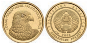
616 50 Rubel, Gold, 2006, Wanderfalk, Parchimowicz 508, PP. 300,—