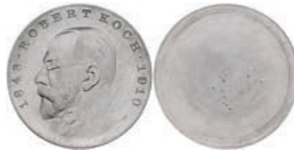
344 5 Mark, 1968, Robert Koch, einseitiger Aluminiumabschlag der Vorderseite, f. st. Auflage nur 350 Stück. J. 1522A. 50,—