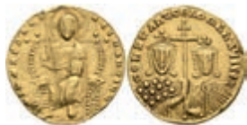
35 Constantinus VII. und Romanus I., 913-959, Solidus (4,28g), Konstantinopel. Av: Thronender Christus von vorn, darum Umschrift. Rev: Die Büsten von Constantinus VII. und Romanus II. von vorn, darum Umschrift. Sear 1750, tiefer Kratzer, ss. 350,—