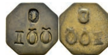
5504 Holzmarke zu 100 Wellen, o.J., Messing. Av: Eingestanzter Kopf nach rechts über "100". Slg. Walther 822, ss. 50,—