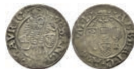
5141 Körtling, 1540, Albrecht IV. von Brandenburg, von Schrötter 186, ss. 50,—