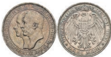
196 3 Mark, 1911, Universität Breslau, schöne Patina, kl. Rf., vz-st. J. 108 50,—