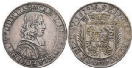
5271 1/2 Gulden (30 Kreuzer), 1679, Karl Heinrich von Metternich-Winneburg, Slg. P. A. 551, Slg. Walther 387, ss-vz. Sehr selten! 1500,—