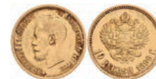
523 10 Rubel, Gold, 1899, Nikolaus II., St. Petersburg, Fb. 179, kl. Rf., ss. 350,—