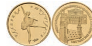
548 Goldmedaille in 50 Rubel Größe, 1993, sog. Stuttgartballerina, in Kapsel, PP. Auflage nur 500 Exemplare! 400,—