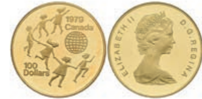
432 100 Dollars, Gold, 1979, Jahr des Kindes, mit Zertifikat in Ausgabeetui, Fb. 10, PP. 700,—