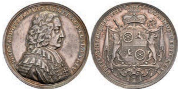
5429 Philipp Karl von Eltz-Kempenich, Silbermedaille (Dm. ca. 42,60mm, ca. 34,39g), 1740, von Becker. Av: Brustbild nach rechts, darum Umschrift. Rev: Wappen, darum Umschrift. Slg. P. A. 663, Slg. Walther -, kl. Rf. und Kr., ss-vz. 1000,—