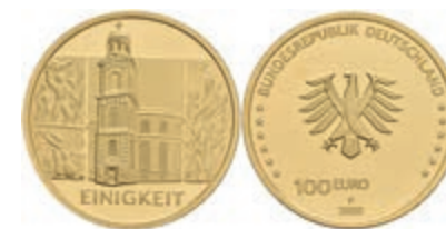
337 100 Euro, 2020, Einigkeit, mit Zertifikat in Ausgabeschatulle, st. 750,—