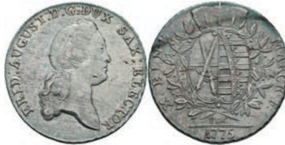
122 Taler, 1775, Friedrich August III., EDC, Dav. 2690, Kahnt 1074, Schnee 1073, etwas Grünspan, ss-vz. 80,—