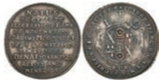
5320 Groschen, 1729, Lothar Franz von Schönborn, auf seinen Tod, Slg. Walther 476, vz. 130,—