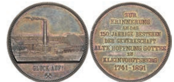
651 Sachsen, Silbermedaille (Dm. ca. 37,90mm, ca. 27,06g), 1891, un-sign., auf das 150jährige Bestehen der Gewerkschaft "Alte Hoffnung Gottes" in Kleinvoigtsberg bei Freiberg. Av: Gebäudeansicht mit rauchendem Schornstein, im Abschnitt darunter "GLÜCK AUF!". Rev: 9 Zeilen Schrift. Kratzer, kl. Rf., schöne Patina, vz-st. Selten! 450,—