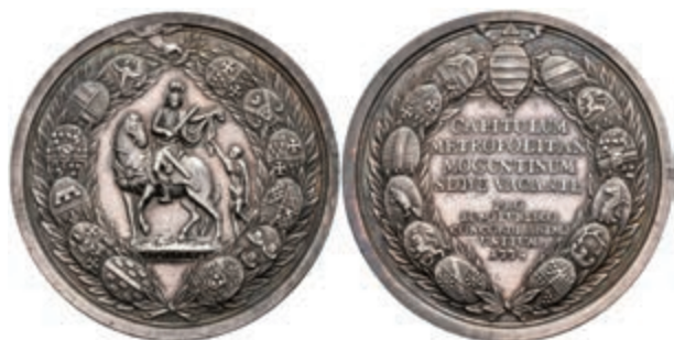
5447 Silbermedaille (Dm. ca. 52,20mm, ca. 43,62g), 1774, von A. F. Stieler, Sedisvakanz. Av: St Martin zu Pferd, den Mantel mit einem Bettler teilend, darum ein Lorbeer-Wappenkranz. Rev: 9 Zeilen Schrift, darum Lorbeer-Wappenkranz. Slg. P. A. 754, Slg. Walther 639, wz. Bohrstelle am Rand, ss-vz. (Abbildung auf 80% verkleinert) 400,—