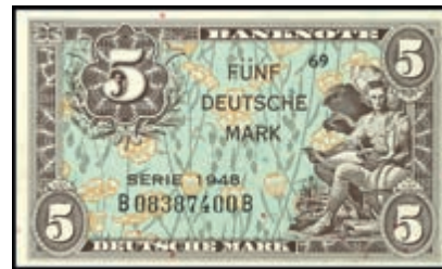
931 5 Deutsche Mark 1948, Kenn-Bst. B/ Serie B, Ro. 236a, Erh. I. (Abbildung auf 50% verkleinert) 350,—