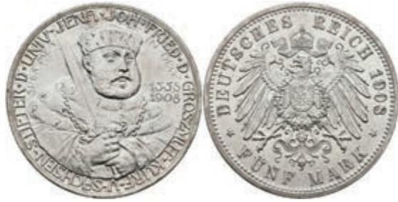
207 5 Mark, 1908, Wilhelm Ernst zur 350-Jahrfeier der Universität Jena, kl. Rf., vz-st. J. 161. 150,—