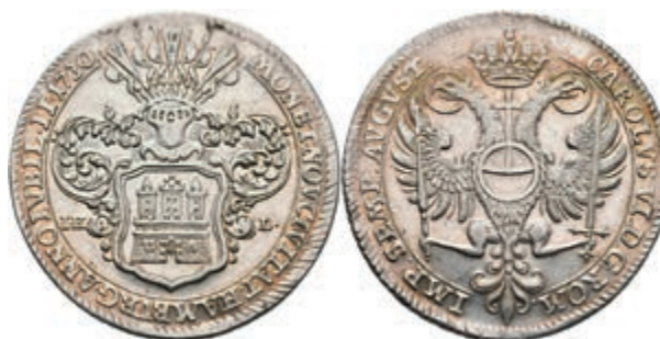
84 Taler, 1730, mit Titel Karl VI., auf die 200Jahrfeier der Augsburger Konfession, Dav. 2282, Gaedechens 524, J. 52, kl. Kr., Prägeglanz, ss-vz. (Abbildung auf 93% verkleinert) 150,—