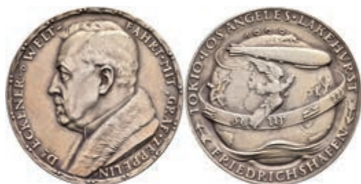
730 Silbermedaille (Dm. ca. 36,1mm, ca. 19,89g), 1929, von Karl Goetz, auf Dr. Hugo Eckener und die Weltfahrt des LZ 127 Graf Zeppelin. Av: Büste Dr. Eckeners nach links, darum Umschrift. Rev: Zeppelin und Vogel vor Weltkugel. Kienast 429. Kl. Kr., kl. Rf., vz-st. 80,—