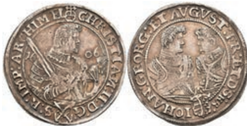
111 1/2 Taler, 1606, Christian II., HR, mit spiegelverkehrtem "N" im Namen von Christian, Keilitz/Kahnt 247 Anm., Randfehler, ss. 100,—