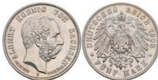
200 5 Mark, 1902, Albert, auf seinen Tod, kl. Kr., ss-vz. J. 128 80,—