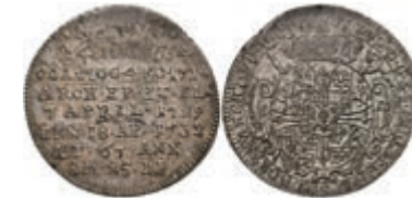
5327 1/8 Taler, 1732, Franz Ludwig von Pfalz-Neuburg, auf seinen Tod, Slg. Walther 496, Prägeschwäche, vz. 250,—