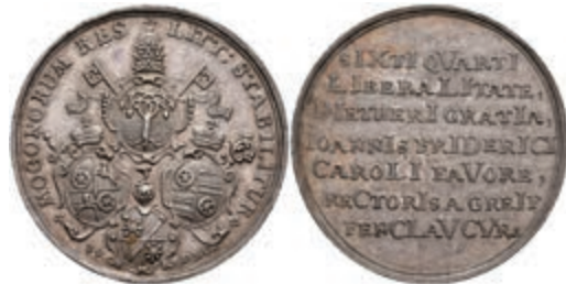
5438 Johann Friedrich Karl von Ostein, Silbermedaille (Dm. ca. 35,45mm, ca. 14,70g), 1746, auf das Stiftungsjubiläum. Av: 4 Wappen, darum Umschrift. Rev: 7 Zeilen Schrift. Slg. Walther -, Slg. P. A. 675, vz. Selten! 300,—