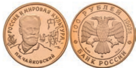
543 100 Rubel, Gold, 1993, P. Tschajkowski, Parchimowicz 1805, kl. Fleck, ohne Kapsel, PP. 600,—