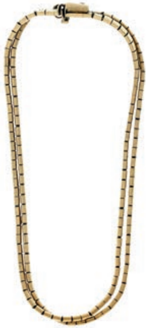
1275 Doppelreihiges Armband in 333 GG, flaches Glieder-Schlangenmuster, Kastenschloss mit Sicherheitsacht, Reparaturstelle, L= 20cm, 12,81g. 200,—