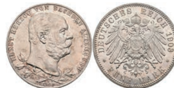
204 5 Mark, 1903, Ernst I., zum 50jährigen Regierungsjubiläum, kl. Kr., kl. Rf., vz. J. 144. 200,—