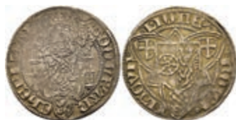
5202 Weißpfennig, o.J. (1461-1475), Adolf II. von Nassau, Slg. P. A. 189 var., ss. 80,—