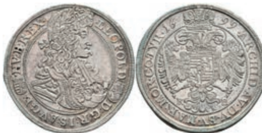
53 1/2 Taler, 1700, Leopold II., Kremnitz, Herinek 849, ss. 120,—