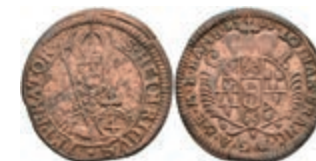
5314 Batzen (4 Kreuzer), 1700, Kupferabschlag, Lothar Franz von Schönborn, Slg. P. A.-, Slg. Walther -, ss. Sehr selten! 100,—