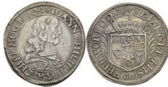
5250 Gulden (60 Kreuzer), 1672, Johann Philipp von Schönborn, Dav. 646, Slg. Walther 329, kl. Schrötlingsfehler, ss-vz. 250,—