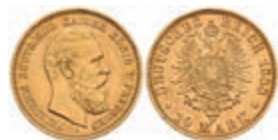
250 10 Mark, 1888, Friedrich III., f. vz. J. 247 150,—