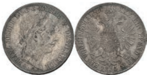
451 Taler, 1865, Franz Joseph I., Wien, Dav. 23, kl. Rf., vz. 80,—