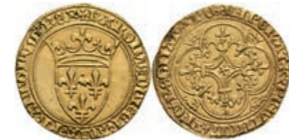
405 Ecu d'or, o.J.(1388-1422), Charles VI., Ciani 484, kl. Kratzer, f. vz. 700,—