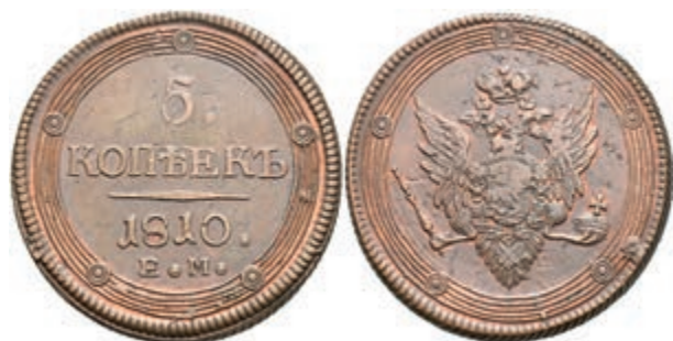
498 5 Kopeken, 1810, Alexander I., Ekaterinburg, Bitkin 300, Schrötlingsfehler, ss-vz (Abbildung auf 97% verkleinert) 80,—