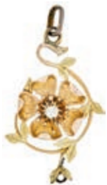
1257 Blumenanhänger mit kl. Brillant ca. 0,07ct, 585 Gelb- und Roségold gestempelt zus. E. K, 31,4x 20mm, ca. 3,1g. 120,—