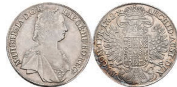
57 Taler, 1762, Maria Theresia, Hall, Dav. 1121, Eypeltauer 79, ss+. 120,—