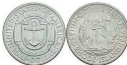
608 1/2 Dollar, 1936, Rhode Island, KM 185, minimaler Grünspan, vz. 50,—