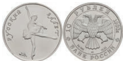
542 10 Rubel, Palladium, 1993, Russisches Ballett, Parchimowicz 1352a, st. 900,—