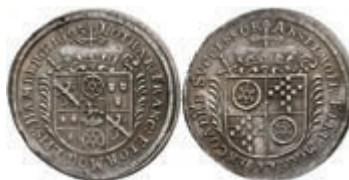
5310 1/8 Taler, 1695, Lothar Franz von Schönborn, auf seine Inthronisation, Slg. P. A. 607, Slg. Walther 458, ss-vz. Selten! 200,—