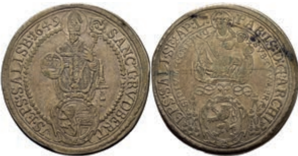
131 Taler, 1649, Paris Graf Lodron, Zöttl 1500, Probszt 1228, ss. 80,—