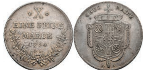
5378 Taler, 1794, Friedrich Karl Joseph von Erthal, Slg. Walther 649, wz. Schröttingsfehler, ss. 200,—