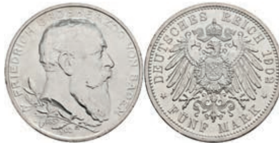
176 5 Mark, 1902, Friedrich I., zum Regierungsjubiläum, kl.Rf., vz-st. J. 31 130,—