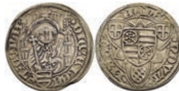
5207 Weißpfennig, o.J. (1475-1482), Dietrich II. von Isenburg, Slg. Walther -, ss. 100,—