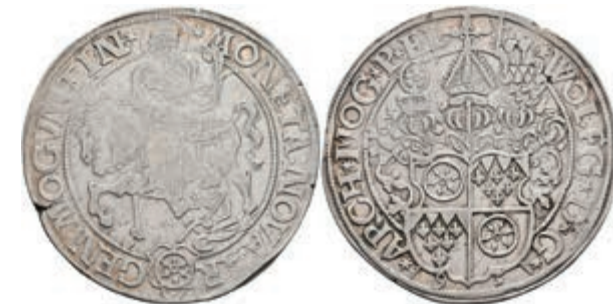
5221 Taler, 1593, Wolfgang von Dalberg, Dav. 9468, Hsp., ss. 600,—