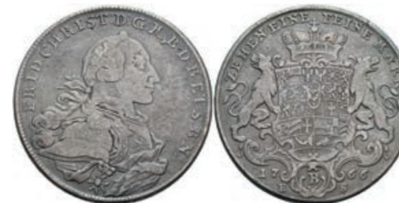
69 Taler, 1766, Friedrich Christian, Bayreuth, Dav. 2042, Slg. Wilmersdörffer 797, ss. 100,—