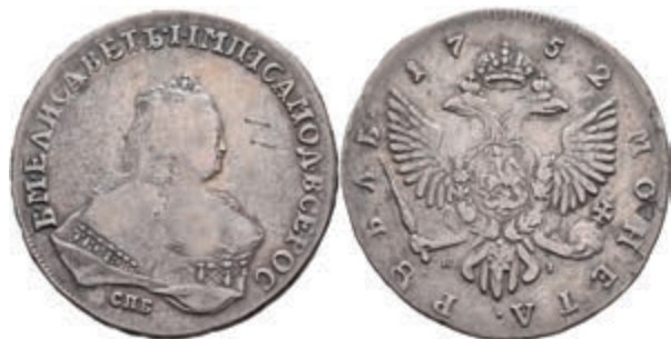
487 Rubel, 1752, Elisabeth, St. Petersburg, Bitkin 269, Kratzer, ss. 150,—