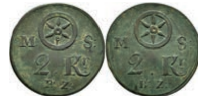
5475 Brückenzollmarke zu 2 Kreuzer, Kupfer, o.J. (18./19. Jh.). Av: Rad zwischen "M - S", darunter 2. Kr. / B:Z:". Rev: Gleich Avers. Slg. Walther 783, ss. 100,—