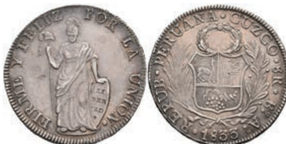
459 8 Reales, 1833, Cuzco, BoAr, KM 142.4, ss-vz. 110,—