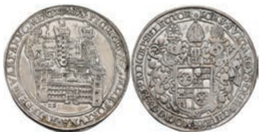
5226 1/2 Taler, 1614, Johann Schweickhardt von Kronberg, auf die Einweihung des Aschaffener Schlosses. Slg. Walther 227, ss-vz. Sehr selten! 3000,—