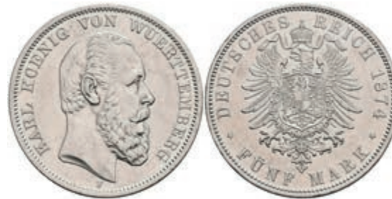
212 5 Mark, 1876, Karl, wz. Rf., vz. J. 173 500,—