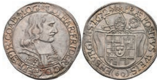
5510 Gulden (60 Kreuzer), 1672, Lothar von Metternich-Burscheid, Dav. 992, ss-vz. 300,—