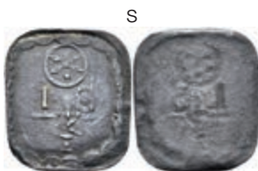
5497 Einseitige Holzmarke, Kupfer, o.J. Av: "I / 4 / S T", darunter Rad. Slg. Walther -, ss. 30,—