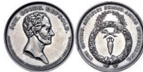
628 Hamburg, versilberte Bronzemedaille (Dm. ca. 43mm, ca. 43,44g), 1830, von Alsing, auf den Tod von Johann Georg Repsold. Av: Kopf nach rechts, darum Umschrift. Amphore im doppelten Kranz, darum Umschrift. Wz. Rf., vz-st. 300,—