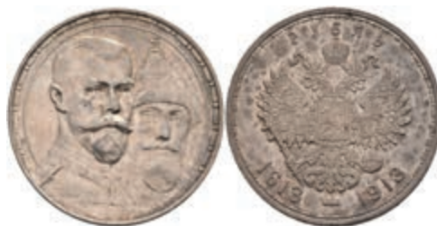
529 Rubel, 1913, Nikolaus II., St. Petersburg, 300 Jahre Romanov Dynastie, Bitkin 336, ss. 100,—