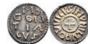
5146 Denar (1,82g), Ludwig der Fromme, 813-840, Mainz. Av: Kreuz, in den Winkeln jeweils eine Kugel, darum "HLVDOWICVSIMP". Rev: "MO / GON / TIA / GVS". Morrison/Grunthal 321, Prou 34. Exemplar der Slg. Dr. R. Walther (Nr. 4). Kl. Schrötlingsfehler, schöne Patina, ss. 1300,—

Goldmünzen ab 1800 sowie Goldbarren sind als Anlagegold ggf. umsatzsteuerfrei (auch für das Aufgeld), soweit der Zuschlagpreis inkl. Aufgeld und Losgebühr nicht höher als der Goldwert + 80% ist.