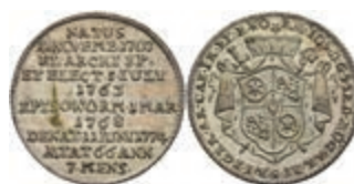
5360 1/12 Taler, 1774, Emmerich Joseph von Breitbach-Bürresheim, auf seinen Tod, Slg. Walther 628, vz. 80,—