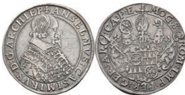
5240 Taler, o.J., Anselm Casimir von Umstadt, Dav. 5548, Grafitto, ss. (Abbildung auf 97% verkleinert) 300,—