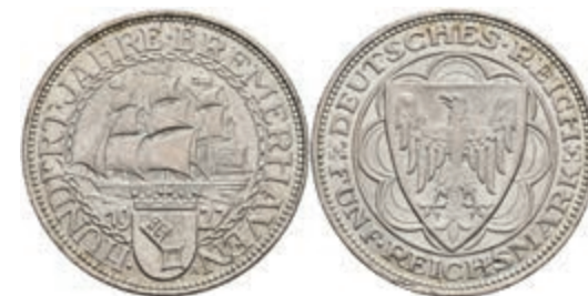
271 5 Reichsmark, 1927, Bremerhaven, kl. Rf., vz. J. 326 320,—