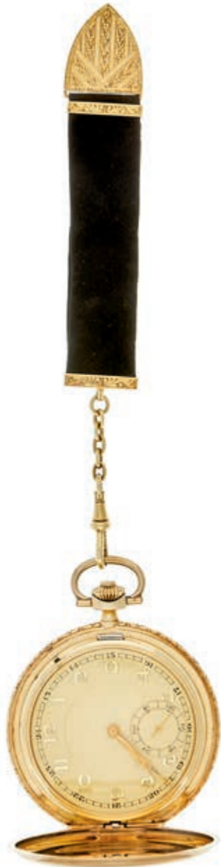
1307 Monopol Art déco Savonette Taschenuhr. Anfang 20. Jahrhundert, Gehäuse in 585 Gelbgold, 84,77 Gramm, ca. 52,7mm Durchmesser. Handaufzug, kleine Sekunde, goldenes 24h Ziffernblatt, Deckel punziert inklusive Meisterstempel, Staubdeckel aus Metall. Anhänger aus schwarzem Velours-Leder mit Gold-Applikationen. Außergewöhnlich guter Zustand, funktionstüchtig. (Abbildung auf 76% verkleinert) 1750,—