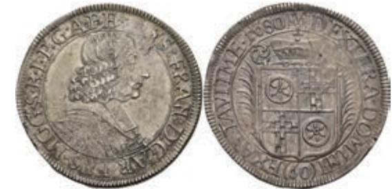
5277 Gulden (60 Kreuzer), 1680, Anselm Franz von Ingelheim, Dav. 657, Slg. Walther 400, Prägeschwäche, schöne Patina, vz. 250,—