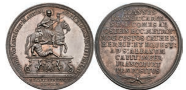
5430 Silbermedaille (Dm. ca. 40,40mm, ca. 20,61g), 1740, von Oexlein, auf Johann Friedrich Karl von Ostein und sein Jubiläum als Mainzer Domkustos. Av: St. Martin zu Pferd auf einem Postament nach rechts, den Mantel mit einem Bettler teilend, darum Umschrift. Rev: 10 Zeilen Schrift. Slg. P. A. 836, Slg. Walther 715, kl. Rf. und Kratzer, vz-st. 400,—