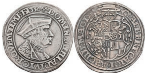
5138 Taler, 1536, Albrecht IV. von Brandenburg, Dav. 9432, ss. 1800,—