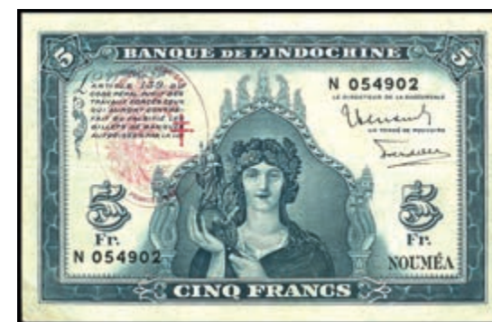
967 Neue Hebriden, Banque de L'Indo-Chine. 5 Franken, o.D (1945). Neue Hebriden-Banknote gedruckt auf der französischen Indo-China 5-Franc-Banknote P.48. Roter Ovalstempel links zur Anzeige des Länderwechsels "NOUVELLES HEBRIDES FRANCE LIBRE". P. 5, Erh. II, selten! (Abbildung auf 50% verkleinert) 150,—