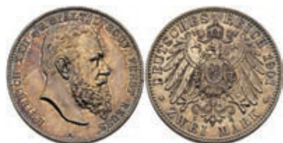
198 2 Mark, 1901, Heinrich XXII., kl. Rf., ss-vz. J. 118 150,—