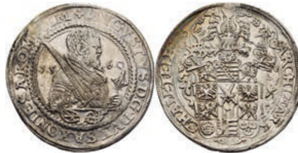
105 Taler, 1560, August, Dav. 9795, Kahnt 56.1, Schnee 713, gereinigt, Hsp., ss. 100,—