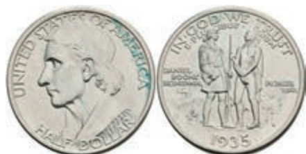
604 1/2 Dollar, 1935, S, Boone, KM 165.1, leichter Grünspan, vz. 80,—