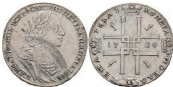
479 Rubel, 1724, Peter I., Moskau, Roter Münzhof, Bitkin 921ff., Schröttingsfehler, ss. 400,—