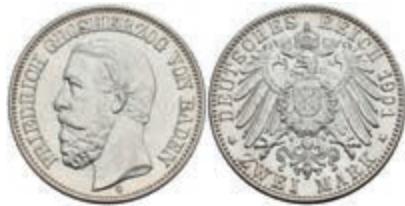
173 2 Mark, 1901, Friedrich I., vz-st. J. 28 500,—