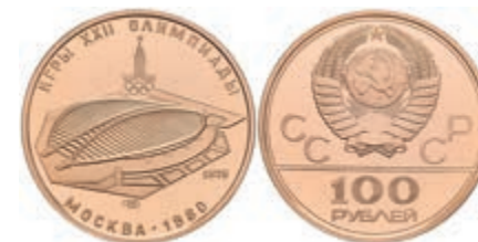
534 100 Rubel, 1/2 oz Gold, 1979, "Radrennbahn (Velotrek) im Sportkomplex von Krylatskoe", Fb. 189, in Ausgabeetui, mit Zertifikat, in Kapsel, PP. 650,—