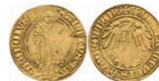
97 Goldgulden, o.J. (1469-1471), Kellner 4, Fb. 1801., Schrötlingsfehler am Rand, ss. 500,—