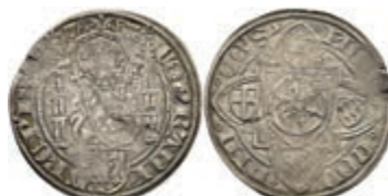
5193 Weißpfennig, o.J. (1419-1437), Konrad III. von Dhaun, Slg. Walther 116, Slg. P. A. 155, Loch, s-ss. 50,—