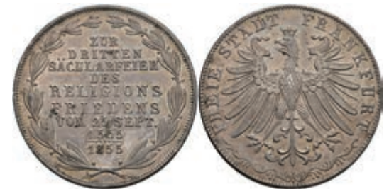
158 Doppelgulden, 1855, Säcularfeier, AKS 42, J. 49, kl. Rf., f. vz. 50,—