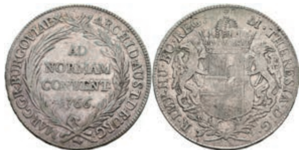
59 Taler, 1766, Maria Theresia, Günzburg, Dav. 1148, Eypeltauer 397a, ss. 50,—