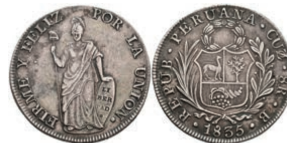
460 8 Reales, 1835, Cuzco, B, KM 142.5, ss 180,—