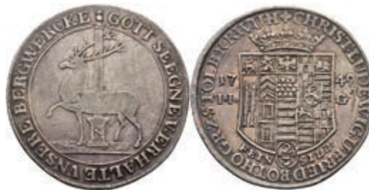
134 2/3 Taler, 1749, Christoph Ludwig und Friedrich Botho, Dav. 1006, Friedrich 1897, ss. 70,—