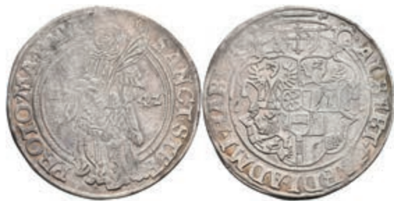
5135 Taler, 1542, Albrecht II. von Brandenburg, Dav. 9210, ss+. 400,—