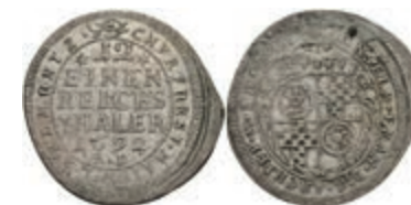
5301 1/12 Taler, 1692, Anselm Franz von Ingelheim, A D, Slg. Walther -, unediert?, Prägeschwäche, ss. 100,—