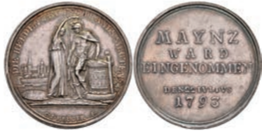
5455 Silbermedaille (Dm. ca. 36mm, ca. 14,14g), 1793, von Krüger, auf die Rückeroberung der Stadt. Av: Germania bekrönt Krieger. Rev: 5 Zeilen Schrift. Slg. P. A. 760, Slg. Walther 860, f. vz. 150,—