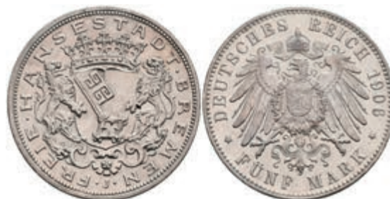
189 5 Mark, 1906, Stadtwappen, Rf., ss-vz. J. 60 150,—

Alle Einzellose und Zertifikate/Gutachten sind unter www.rhenumis.de farbig abgebildet! Dort sind auch 271 weitere Lose zu finden, die nicht im gedruckten Katalog, sondern nur im Internet zu finden sind!