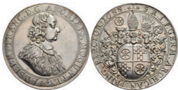
5281 Schautaler (28,62g), 1688, Anselm Franz von Ingelheim, Slg. Walther 412, vz. (Abbildung auf 92% verkleinert) 800,—