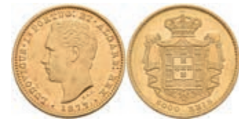
477 5000 Reis, Gold, 1869, Luis I., Fb. 153, vz 400,—