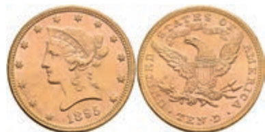
591 10 Dollars, Gold, 1895, Liberty Head, Philadelphia, Fb. 158, Kratzer, kl. Rf., vz. 650,—