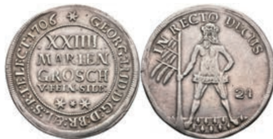
74 24 Mariengroschen, 1706, Georg Ludwig, Welter 2158, kl. Rf., ss. 50,—