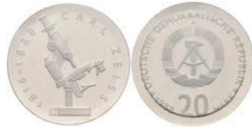
368 20 Mark, 1988, Carl Zeiss, in Kapsel eingeschweißt, PP. J. 1621. 200,—