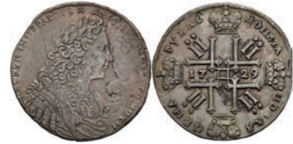
483 Rubel, 1729, Peter II., Moskau, Münzhof Kadashevsky, Bitkin 111, Dav. 1669, Zainende, Schröttingsfehler, ss. 250,—