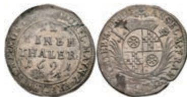
5294 1/12 Taler, 1691, Anselm Franz von Ingelheim, Slg. Walther 455, Schrötlingriss, ss-vz. 50,—