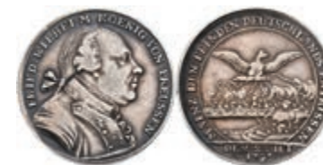
5452 Preußen, Friedrich Wilhelm II., Silbermedaille (Dm. ca. 25,40mm, ca. 6,36g), 1793, auf die Rückeroberung von Mainz. Av: Büste nach rechts, darum Umschrift. Rev: Ansicht der brennenden Stadt, darüber ein Adler mit ausgebreiteten Schwingen, darum Umschrift. Slg. Walther 762, kl. Rf., ss. 130,—