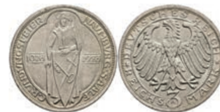
282 3 Reichsmark, 1928, Naumburg, kl. Rf., vz. J. 333 80,—