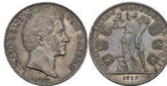
144 Geschichtsdoppeltaler, 1837, Ludwig I., Münzvereinigung süddeutscher Staaten, AKS 98, J. 66, Kratzer, kl. Rf., ss+ 220,—