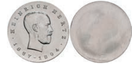
347 5 Mark, 1969, Heinrich Hertz, einseitiger Aluminiumabschlag der Vorderseite, wz. Kr., f. st. Auflage nur 350 Stück. J. 1526A. 50,—