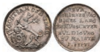
5433 Johann Friedrich Karl von Ostein, Silbermedaille (Dm. ca. 23mm, ca. 5,76g), 1744, von A. Schäfer, auf seine Huldigung. Av: Windhund mit Schwert an Wappen nach links, darum Umschrift. Rev: 11 Zeilen Schrift. Slg. Walther 513, Slg. P. A. 672, vz. 100,—