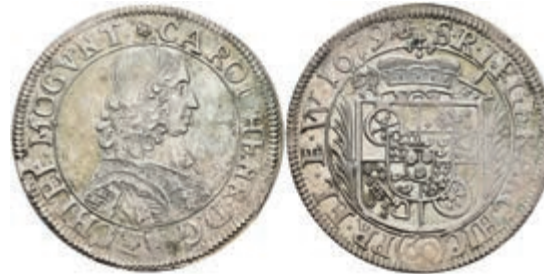
5273 Gulden (60 Kreuzer), 1679, Karl Heinrich von Metternich-Winneburg, Dav. 656, Slg. Walther 386, Prägeschwäche, vz. Sehr selten! 3500,—