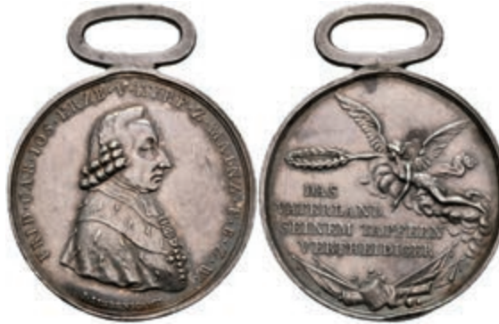
5458 Friedrich Karl Joseph von Erthal, tragbare Tapferkeitsmedaille (Dm. ca. 38,60mm, ca. 17,02g), Silber, o.J. (1795), von Lindenschmit. Av: Brustbild nach rechts, darum Umschrift. Rev: Genius auf Wolken nach links, darunter "4 Zeilen Schrift". Slg. 654, Slg. P. A. 801, Randfehler, ss-vz. Sehr selten! 800,—