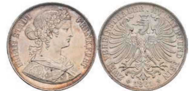
159 Doppeltaler, 1861, AKS 4, J. 43, wz. Rf., kl. Kr., vz. 120,—