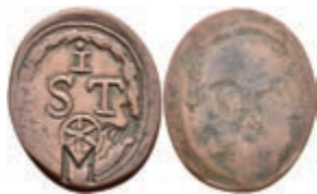
5496 Einseitige Holzmarke, Kupfer, o.J. Av: "I / S T", darunter Rad und Punze "M". Slg. Walther -, ss. 50,—