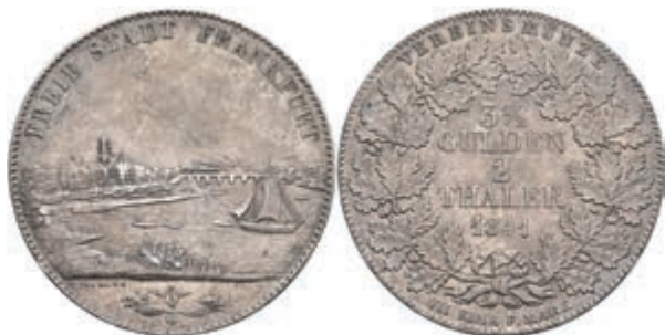
151 Doppeltaler, 1841, Stadtansicht, AKS 3, J. 15, Randfehler, ss. 150,—