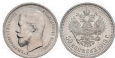
528 50 Kopeken, 1913, Nikolaus II., St. Petersburg, Bitkin 93, wz. Rf., Avers vz, Revers vz-st. 50,—