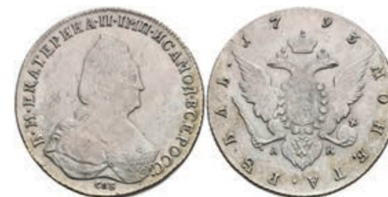
494 Rubel, 1793, Katharina II., St. Petersburg, Bitkin 262, ss. 200,—