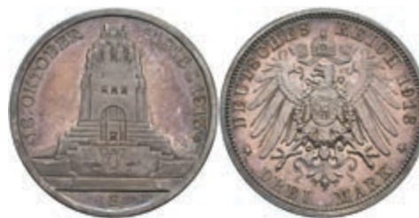
202 3 Mark, 1913, Volkshochschule, kl. Kratzer, schöne Patina, PP. J. 140 120,—