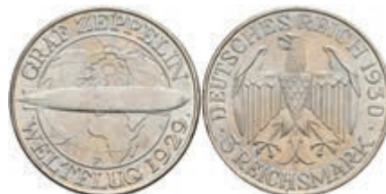
296 3 Reichsmark, 1930, F, Zeppelin, f. st. J. 342 50,—