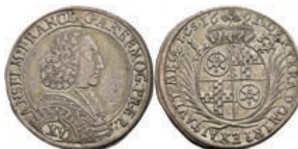
5297 15 Kreuzer, 1691, Anselm Franz von Ingelheim, Slg. Walther 454, ss. 100,—