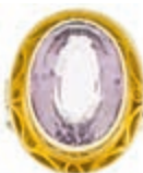
1245 Ring mit ovalfacettierten Amethyst, Mitte des 20. Jh., Gelbgold 585, 8,37 g, leichte Tragespuren, Amethyst Facettkanten berieben, Innendurchmesser 18,6 mm. Hochwertige Handarbeit. 270,—