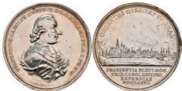
5448 Friedrich Karl Joseph von Erthal, Silbermedaille (Dm. ca. 47,15mm, ca. 36,22g), 1777, von Stockmar, auf den Besuch in Erfurt. Av: Brustbild nach rechts, darum Umschrift. Rev: Stadtansicht, im Abschnitt darunter 4 Zeilen Schrift. Slg. P. A. 760, Slg. Walther 674, kl. Kratzer, vz. (Abbildung auf 88% verkleinert) 250,—