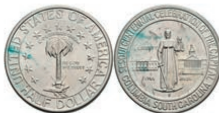
609 1/2 Dollar, 1936, S, Columbia, KM 178, etwas Grünspan, vz-st. 100,—