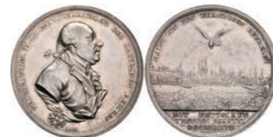
5454 Preußen, Friedrich Wilhelm II., Silbermedaille (Durchmesser ca. 37mm, 13,95g), 1793, von Loos, auf den Entsatz der Stadt. Brustbild nach rechts, darum Umschrift. Rev: Adler mit Blitzen über der Stadt, im Abschnitt darunter 3 Zeilen Schrift. Slg. Walther 761, Slg. P. A. 858, kl. Kr., vz. 80,—

Alle Einzellose und Zertifikate/Gutachten sind unter www.rhenumis.de farbig abgebildet! Dort sind auch 271 weitere Lose zu finden, die nicht im gedruckten Katalog, sondern nur im Internet zu finden sind!