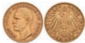
237 10 Mark, 1893, Ernst Ludwig, ss. J.222 1000,—