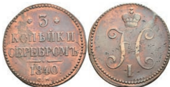
505 3 Kopeken, 1840, Nikolaus I., Suzun, Bitkin 721 (R), ss. 30,—