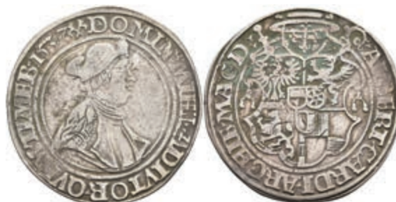
5139 Taler, 1537, Albrecht IV. von Brandenburg, Dav. 9433, ss. 450,—