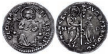
427 Venedig, Marcello (1/2 Lira), o.J. (1486-1501), Agostino Barbarigo, MD, ss. 120,—