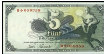
933 5 Deutsche Mark 9.12.1948, Europa auf dem Stier, Austauschnote, Serie 6 mit Kreuzstern vor der KN, Ro.252 d, Erh. I. (Abbildung auf 50% verkleinert) 700,—