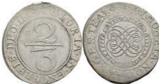
5286 2/3 Taler, 1689, geprägt unter französischer Belagerung, Dav. 659, Slg. Walther 738, Zainende, f. vz. Sehr selten! 800,—