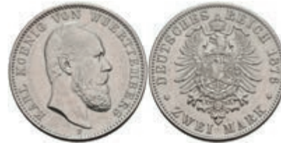
211 2 Mark, 1876, Karl, vz. J. 172 500,—