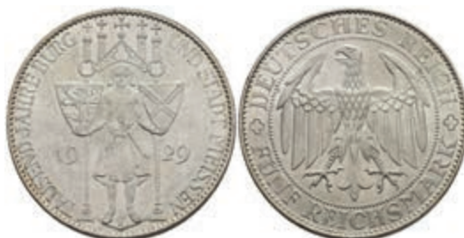
291 5 Reichsmark, 1929, Meißen, wz. Kratzer, vz. J. 339 180,—