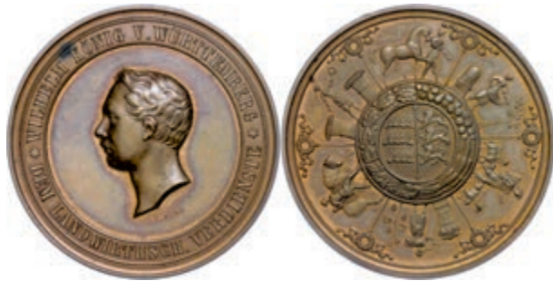
632 Württemberg, Wilhelm I., Bronzemedaille (Dm. ca. 45,20mm, ca. 52,93g), o.J. (ab 1858), signiert G.A. Dietelbach, für landwirtschaftliche Verdienste. Av: Kopf nach rechts, im Außenkranz Umschrift. Rev: Wappen im Kranz, darum landwirtschaftliche Darstellungen. Ebner 412, Tintensignatur auf dem Rand, vz-st. (Abbildung auf 93% verkleinert) 150,—