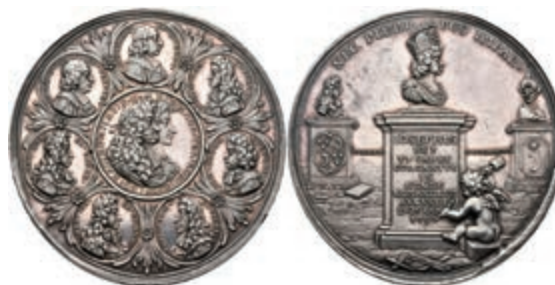
5415 Silbermedaille (Dm. ca. 47,80mm, ca. 41,81g), von P. H. Müller, auf die Krönung Josephs I. in Augsburg. Av: Büste Josephs und seines Sohnes im Medaillon nach rechts, darum 7 weitere Medaillons mit Büsten. Rev: Büste auf Postament, darunter weißelnder Genius. Slg. Mont. 1211, Forster 663, kl. Kr., vz-st. (Abbildung auf 80 % verkleinert) 700,—