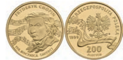
475 200 Zloty, Gold, 1999, 150. Todestag von Frederic Chopin, ohne Kapsel, kl. Flecken, PP. 600,—