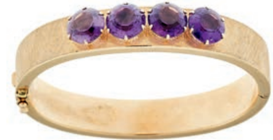
1272 Armreif im Stil des Art déco mit 4 rundfacettierte Amethyste, Österreich, 1. Hälfte 20. Jh., 585 Roségold gestempelt, zusätzlich zweifach amtliche Feingehaltspunze Österreich "Pferdekopf W" und Juwelierspunze, Dm 52,3x 66mm, 32,7g. 1000,—