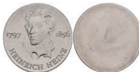
357 10 Mark, 1972, Heinrich Heine, einseitiger Aluminiumabschlag der Vorderseite, st. Auflage nur 300 Stück. J. 1542A. 50,—