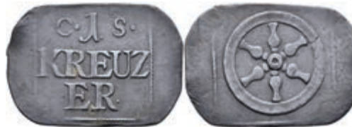
5470 Brückenzollmarke zu 1 Kreuzer, Kupfer, o.J. Av: 1 zwischen "C - S.", darunter "KREUZ / ER". Rev: Rad. Slg. Walther 783, ss. 50,—