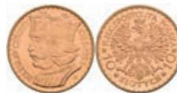
472 10 Zlotych, Gold, 1925, Boleslaw I., Fb. 116, vz-st. 500,—