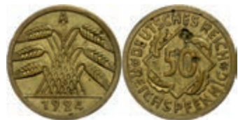
263 50 Reichspfennig, 1924, A, Schrötlingsfehler, ss. J. 318 400,—