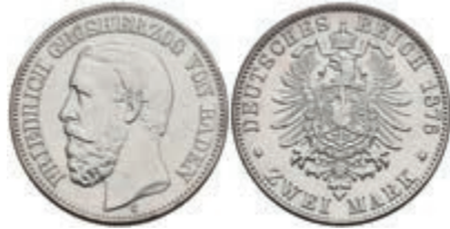
171 2 Mark, 1876, Friedrich I., f. vz. J. 26 150,—