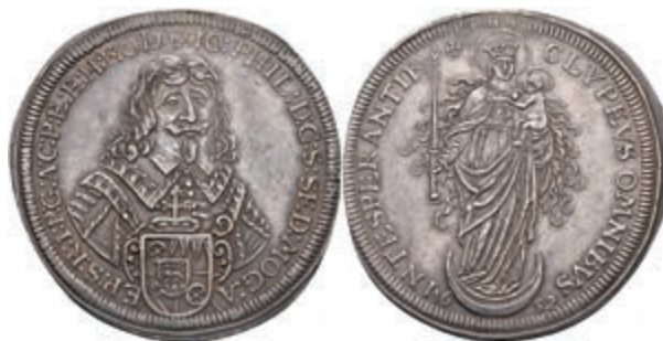
5511 Taler, 1652, Johann Philipp von Schönborn, Dav. 5980, wz. Hsp., schöne Patina, f. vz. 400,—