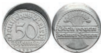
262 50 Pfennig, 1921, A, dezentriert, vz. J. 305 30,—