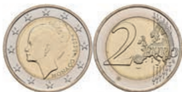
440 2 Euro, 2007, Grace Patricia Kelly zum 25. Todestag, KM 186, in Ausgabeschatulle, kl. Flecken, vz-st. 2800,—