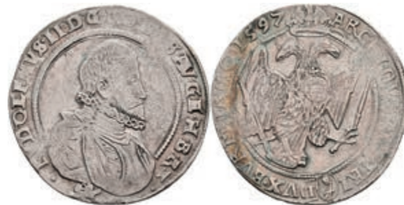
44 Taler, 1597, Rudolf II., Kuttenberg, Dav. 8079, Voglhuber 101/I, Prägeschwäche, kl. Rf., ss. 150,—