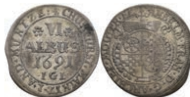
5298 6 Albus, 1691, Anselm Franz von Ingelheim, Slg. Walther 420, ss. Selten! 150,—