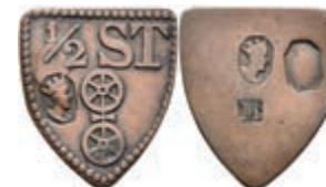
5492 Schildförmige Holzmarke, Kupfer, o.J. Av: "1/2 ST, darunter Doppelrad und Punze. Rev: Drei Punzen. Slg. Walther 814, ss. 100,—