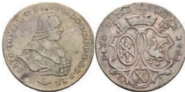
5352 Taler, 1766, Emmerich Joseph von Breitbach-Bürresheim, Dav. 2425, Slg. Walther 601, Schrötlingsfehler, ss. 150,—