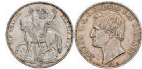
169 Taler, 1871, Johann, AKS 159, J. 132, wz. Rf., vz. 70,—