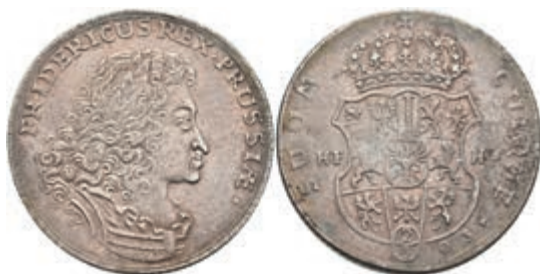
71 2/3 Taler, 1703, Friedrich III., HFH Magdeburg, Dav. 291, ss. 250,—