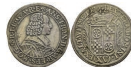
5289 15 Kreuzer, 1690, Anselm Franz von Ingelheim, Slg. Walther 450, ss. 100,—