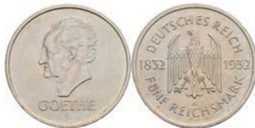
311 5 Reichsmark, 1932, A, Goethe, wz. Rf., vz. J. 351 1700,—