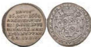
5334 1/8 Taler, 1743, Philipp Karl von Eltz-Kempenich, auf seinen Tod, Slg. Walther 506, vz. 150,—