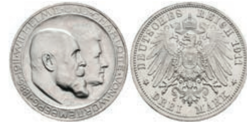
217 3 Mark, 1911, Wilhelm II., zur Silbernen Hochzeit, Variante mit hohem Querstrich im Buchstaben "H" von Charlotte, vz-st. J. 177b 400,—