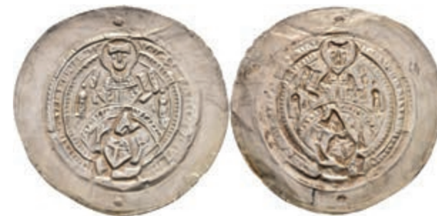
5181 Brakteat (0,88g), Konrad von Wittelsbach, 1183-1200. Brustbild des Hl. Martin mit segnender Rechten und Buch von vorn. Darunter der kniende Erzbischof mit erhobenen Händen nach links. Slg. Löbbecke 610, zaponiert, ss-vz. (Abbildung auf 91% verkleinert) 300,—