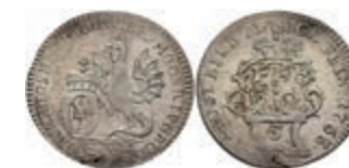
5343 5 Kreuzer, 1763, Emmerich Joseph von Breitbach-Bürresheim, Slg. Walther 593, Schrötlingsfehler am Rand, ss-vz. 150,—