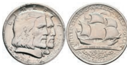
607 1/2 Dollar, 1936, Long Island, KM 182, vz-st. 30,—