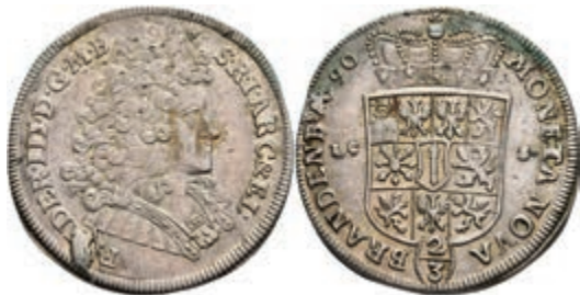
70 2/3 Taler, 1690, Friedrich III., Berlin, Dav. 270, Stempelfehler, ss-vz. 100,—