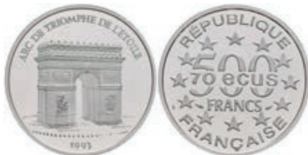
411 500 Francs, Platin, 1993, Triumphbogen, mit Zertifikat in Ausgabeschatulle, PP. 500,—