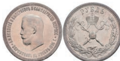
517 Rubel, 1896, Nikolaus II., St. Petersburg, Bitkin 322, wz. Rf., vz. 300,—