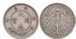
320 Kiautschou, 5 Cent, 1909, ss-vz. J. N 729 100,—