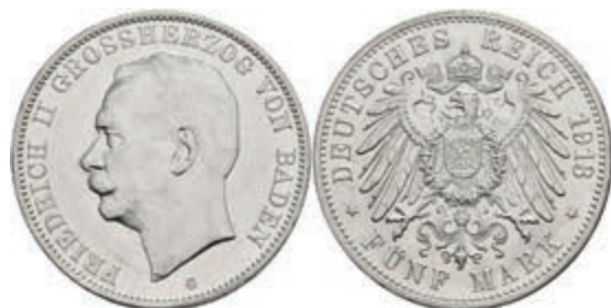
186 5 Mark, 1913, Friedrich II., kl. Rf., vz. J. 40 80,—