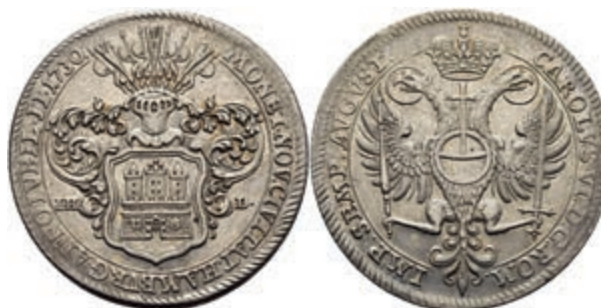
83 Taler, 1730, mit Titel Karl VI., auf die 200-Jahrfeier der Augsburger Konfession, Dav. 2282, Gaedechens 524, J. 52, leicht berieben, ss. (Abbildung auf 93% verkleinert) 200,—