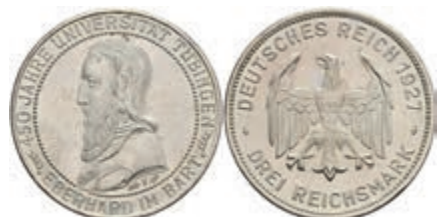
274 3 Reichsmark, 1927, Tübingen, vz-st. J. 328 230,—