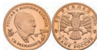
547 50 Rubel, Gold, 1993, S. Rahmaninow, Parchimowicz 1608, min. angelaufen, ohne Kapsel, PP. 300,—