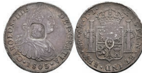
415 Dollar, o.J. (1804), mit Gegenstempel (Büste Georg III. nach rechts) auf 8 Reales 1803 Lima IJ. KM 658, Randkerbe, schöne Patina, vz. 600,—