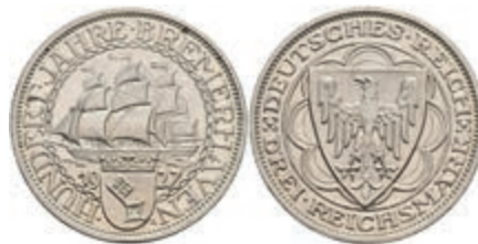
267 3 Reichsmark, 1927, Bremerhaven, kl. Flecken, leicht angelaufen, PP. J. 325 250,—