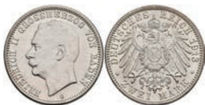
184 2 Mark, 1913, Friedrich II., vz. J. 38 250,—