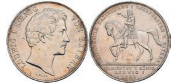
146 Geschichtsdoppeltaler, 1839, Ludwig I., Reitersäule Maximilian I., AKS 100, kl. Rf., kl. Kr., ss-vz. 180,—