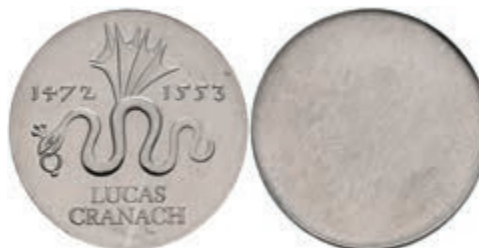
355 20 Mark, 1972, Lucas Cranach, einseitiger Aluminiumabschlag der Vorderseite, wz. Kr., f. st. Auflage nur 300 Stück. J. 1538A. 50,—