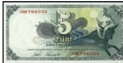
932 5 Deutsche Mark 9.12.1948 (Ausgabe 1956-1961), Europa auf dem Stier, Serie 10, Ro.252c/ Grab. BRD-1- 252e, Erh. I. (Abbildung auf 50% verkleinert) 150,—