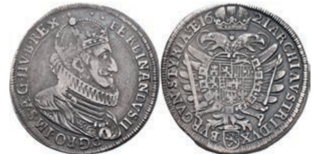
47 Taler, 1621, Ferdinand II., Graz, Dav. 3102, Herinek 413, Voglhuber 134/II Var., Avers etwas bearbeitet, ss. 150,—