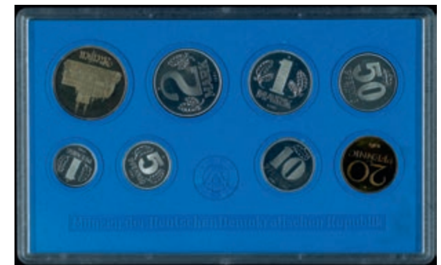
374 1 Pfennig bis 5 Mark, 1981, Meißener Dom, in Hartplastik, PP. Sehr selten, Auflage nur 40 Stück. (Abbildung auf 49% verkleinert) 5000,—