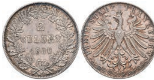
153 Doppelgulden, 1846, AKS 5, J. 28, ss-vz. 150,—