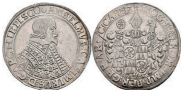
5237 Taler, 1636, Anselm Casimir von Umstadt, Dav. 5548, ss. (Abbildung auf 96% verkleinert) 500,—