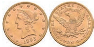
590 10 Dollars, Gold, 1893, Liberty Head, Philadelphia, Fb. 158, kl. Kr., kl. Rf., vz. 650,—