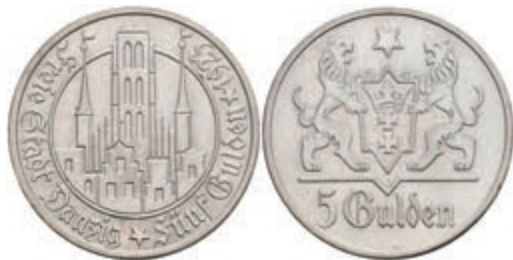
318 Danzig, 5 Gulden, 1923, Marienkirche, kl. Kr., wz. Rf., ss-vz. J. D9 180,—