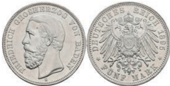
174 5 Mark, 1895, Friedrich I., kl. Kr. und Rf., vz-st. J. 29 700,—