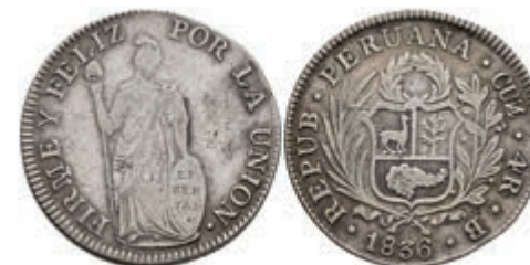
461 4 Reales, 1836, Cuzco, B, KM 151.1, kl. beriebene Stelle auf Avers, ss. 40,—