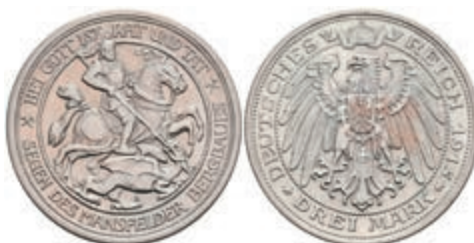
197 3 Mark, 1915, Mansfeld, ss. J. 115 250,—