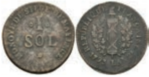
5367 1 Sol (2,87g), 1793, geprägt unter französischer Belagerung, Brause/Mansfeld Tf. 18, Nr. 15, Slg. P. A. 864, Slg. Walther 753, ss. 30,—