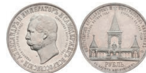
521 Rubel, 1898, Nikolaus II., St. Petersburg, Denkmal für Alexander II., Bitkin 323(R), kl. Kratzer/berieben, vz. 1800,—