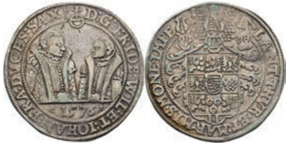
129 Taler, 1576, Friedrich Wilhelm und Johann, Dav. 9766, Kahnt 7b, Schnee 231, kleine Schrötlingsfehler, ss. 150,—