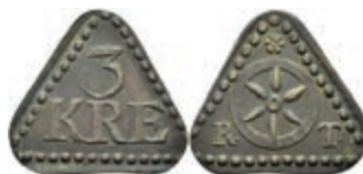
5486 Tormarke zu 3 Kreuzer, Kupfer, o.J. (18. Jh.). Av: "3 / KRE". Rev: Rad zwischen "R - T.". Vgl. Slg. Walther 774, ss. 30,—