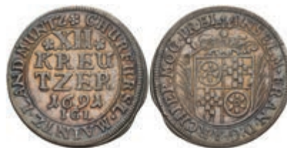
5296 12 Kreuzer, 1691, Anselm Franz von Ingelheim, Slg. Walther 419, kl. Zainende, ss+. 50,—