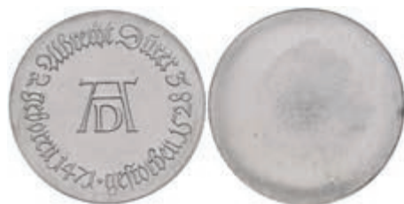
352 10 Mark, 1971, Albrecht Dürer, einseitiger Aluminiumabschlag der Vorderseite, wz. Kr., f. st. Auflage nur 300 Stück. J. 1532A. 50,—