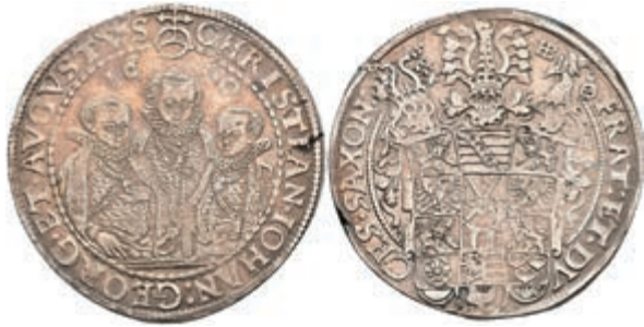
109 Taler, 1600, Christian II., Johann Georg und August, Schnee 754, Dav. 9820, Keilitz/Kahnt 186, kl. Einriss, ss. 150,—