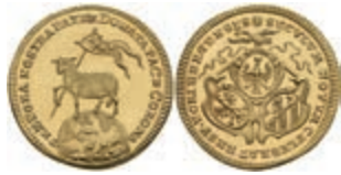
100 Dukat (Lammdukat), o.J. (1700), ohne Münzmeisterzeichen, Kellner 71, Fb. 1885, etwas wellig, vz-st. 600,—