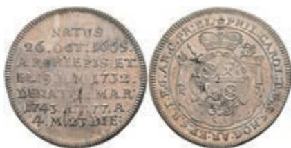
5332 1/4 Taler, 1743, Philipp Karl von Eltz-Kempenich, auf seinen Tod, Slg. Walther 505, f. st. Sehr selten! 500,—