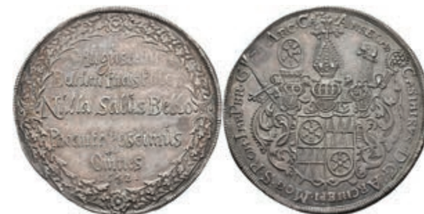
5243 Taler, 1642, Anselm Casimir von Umstadt, auf den Friedenswunsch, Slg. Walther 275, Dav. -, schöne Patina, vz. Sehr selten! (Abbildung auf 96% verkleinert) 4000,—