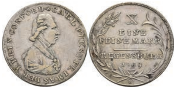
5507 Taler, 1809, Karl Theodor von Dalberg, AKS 6, J. 6, Slg. Walther 698, ss. 150,—