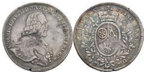
5358 Taler, 1770, Emmerich Joseph von Breitbach-Bürresheim, Dav. 2428, Slg. Walther 619, Schrötlingsfehler am Rand, schöne Patina, ss. 150,—