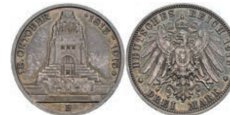
203 3 Mark, 1913, Volkshochschule, wz. Rf., schöne Patina, vz-st. J. 140. 30,—