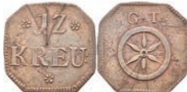
5485 Tormarke zu 12 Kreuzer, Kupfer, o.J. Av: 12 zwischen zwei Rosetten, darunter "KREU:", darunter Rosette. Rev: Rad, darüber "G. T.". Slg. Walther 775, Kratzer, ss. 80,—