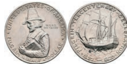
598 1/2 Dollar, 1920, Pilgrim, KM 147.1, kl. Kr., vz-st. 50,—