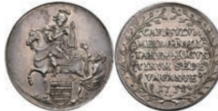
5323 1/4 Schautaler, 1732, Sedisvakanz, Slg. Walther 501, Hsp., f. vz. Exemplar der Sammlung R. Walther. Los 501 der 275. Auktion. Dr. Busso Peus, Frankfurt a. M., 1971 200,—