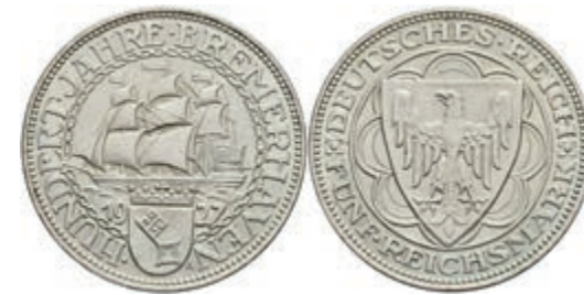
272 5 Reichsmark, 1927, Bremerhaven, kl. Rf., vz+. J. 326 280,—