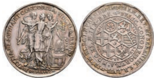
5400 Nürnberg, Silbermedaille (Dm. ca. 36mm, ca. 16,91g), 1611, von C. Maler, auf den Kurfürstentag in Nürnberg. Av: Stehende Concordia, Justitia und Prudentia im Kreis, darum Umschrift. Rev: 7 Wappen, darum Umschrift. Slg. Erlanger 1003, Slg. P. A. 332, ss. 130,—