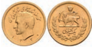
424 Pahlavi, Gold, 1951 (SH 1330), Mohammed Reza Pahlavi, Fb. 101, kl. schwarze Punkte, vz-st. 320,—