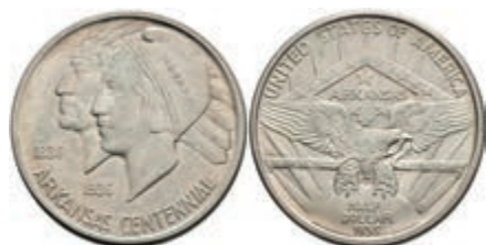
603 1/2 Dollar, 1935, D, Arkansas, KM 168, etwas Grünspan, vz. 50,—