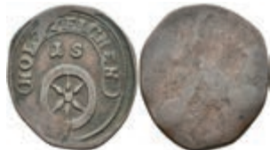
5481 Einseitige Holzmarke, Kupfer, o.J. Av: "1 S", darüber Spruchband, darunter Rad. Slg. Walther 798, ss. 50,—