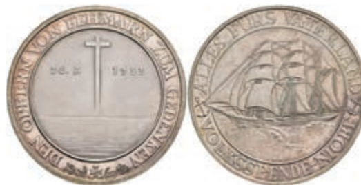
735 Silbermedaille, (Dm. ca. 36mm, ca. 21,80g), 1932, unsign., auf den Untergang des Segelschulschiffes "Niobe". Av: Schiff, darum Umschrift. Rev: Kreuz zwischen Daten, darum Umschrift. Vz-st. 70,—