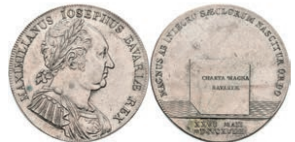
141 Taler, 1818, Maximilian I. Joseph, AKS 59, J. 15, wz. Rf., vz. 150,—