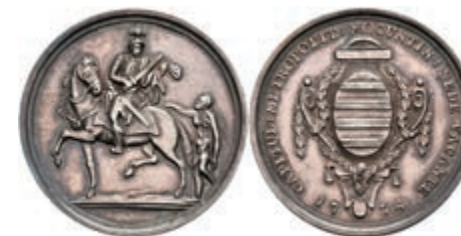
5363 1/4 Schautaler, 1774, Sedisvakanz, Slg. P. A. 757, Slg. Walther 642, vz. 300,—