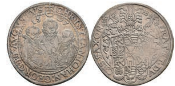
108 Taler, 1597, Christian II., Johann Georg und August, Schnee 754, Dav. 9820, ss. 100,—