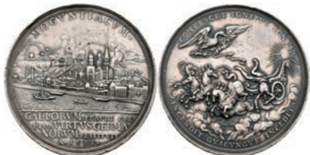
5411 Silbermedaille (Dm. ca. 49mm, ca. 44,74g), 1689, auf die Einnahme der Stadt. Av: Sturz des Phaetons aus der Sonnenquadriga, darüber Adler mit Blitzbündeln, darum Umschrift. Rev: Ansicht der unter Beschuss stehenden Stadt, im Abschnitt darunter 4 Zeilen Schrift. Slg. P. A. 850, Slg. Walther 744, Forster 652, Hsp., kl. Rf., ss. (Abbildung auf 81% verkleinert) 200,—