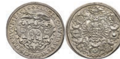
5513 Regensburg, Silberabschlag des Dukaten, 1641, auf den Friedenswunsch. Av: Friedenstaube nach links über Wappen, darum Umschrift. Rev: Doppeladler, darum Wappenkranz. Plato 168, ss. 100,—