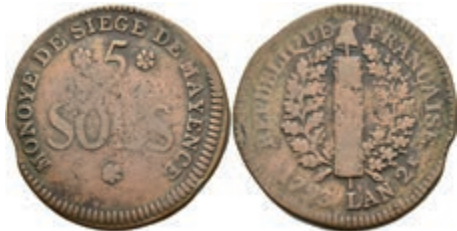
5370 5 Sols (12,88g), 1793, geprägt unter französischer Belagerung, Brause/Mansfeld Tf. 18, Nr. 10, Slg. P. A. 862, Slg. Walther 749, s-ss. 30,—