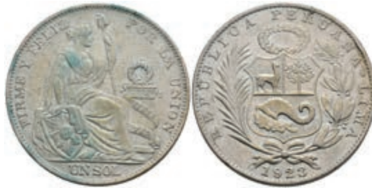
468 Sol, 1923, Lima, KM 217.1, kl. Rf., Grünspan, ss. 50,—