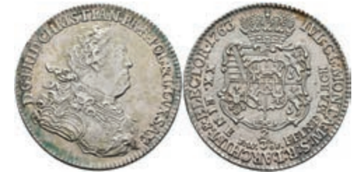
117 2/3 Taler, 1763, Friedrich Christian, Dresden, Dav. 831, Kahnt 1006, f. vz. 200,—