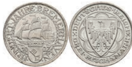
268 3 Reichsmark, 1927, Bremerhaven, kl. Rf., vz-st. J. 325 120,—