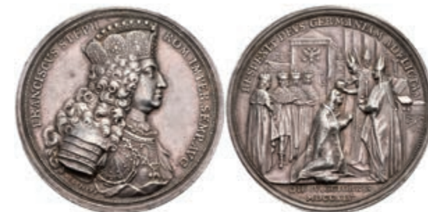
5436 RDR, Franz I. Stephan, Silbermedaille (Dm. ca. 49,10mm, ca. 43,69g), 1745, von M. Holtzhey, auf die Krönung zum römischen Kaiser. Av: Brustbild nach rechts, darum Umschrift. Rev: Krönungsszene. Slg. Mont. 1765, kl. Kratzer und Rf., ss. (Abbildung auf 85% verkleinert) 500,—