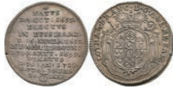
5319 3 Kreuzer, 1729, Lothar Franz von Schönborn, auf seinen Tod, Slg. Walther 490, vz. 80,—