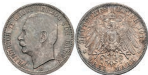
185 3 Mark, 1915, Friedrich II., kräftige Patina, vz-st. J. 39 80,—