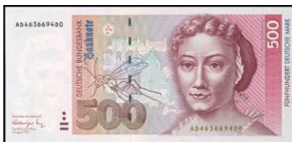
948 500 Deutsche Mark, 1.8.1991, Serie AAV, Ro. BRD-45a, Erhaltung I. (Abbildung auf 49% verkleinert) 300,—