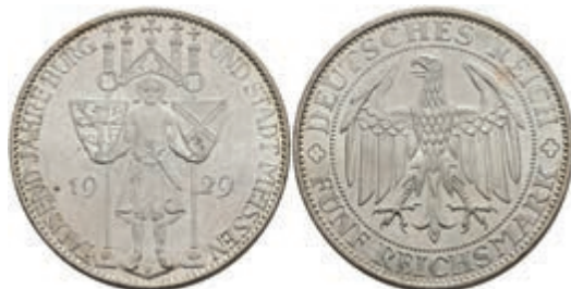
289 5 Reichsmark, 1929, Meißen, wz. Kratzer, kl. Rf., vz-st. J. 339 200,—