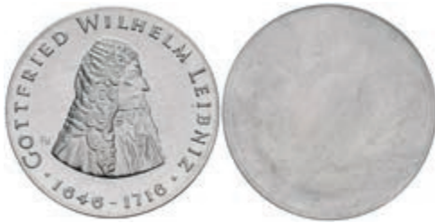
340 20 Mark, 1966, Gottfried Wilhelm Leibniz, einseitiger Aluminiumabschlag der Vorderseite, st. Auflage nur 300 Stück. J. 1518A. 50,—