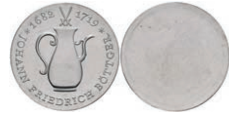
348 10 Mark, 1969, Johann Friedrich Böttger, einseitiger Aluminiumabschlag der Vorderseite, wz. Kr. f. st. Auflage nur 300 Stück. J. 1527A. 50,—