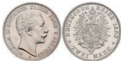
194 2 Mark, 1888, Wilhelm II., wz. Kr., vz-st. J. 100 300,—