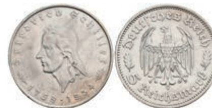
316 5 Reichsmark, 1934, Friedrich von Schiller, Kratzer, vz. J. 359 80,—