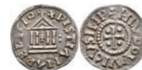
5145 Denar (1,77g), Ludwig der Fromme, 813-840. Av: Kreuz, in den Winkeln jeweils eine Kugel, darum "HLVDOWICVSIMP". Rev: Tempel, links senkrecht zwei Kugeln, darum "XPISTIANARELIGIO". Morrison/Grunthal -, Prou -, ss. 220,—