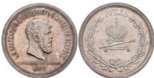
513 Rubel, 1883, Alexander III., St. Petersburg, auf seine Krönung, Bitkin 217, wz. Rf. und Kratzer, ss-vz. 250,—