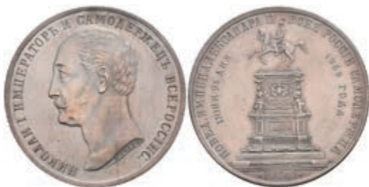
511 Rubel, 1859, Alexander II., St. Petersburg, Denkmal für Nikolaus I., Bitkin 567, Dav. 290, kl. Feilspur am Rand, berieben, f. vz. 500,—