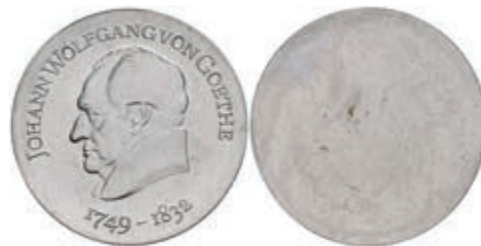
346 20 Mark, 1969, Johann Wolfgang von Goethe, einseitiger Aluminiumabschlag der Vorderseite, Kratzer auf Rückseite, st. Auflage nur 300 Stück. J. 1525A. 50,—