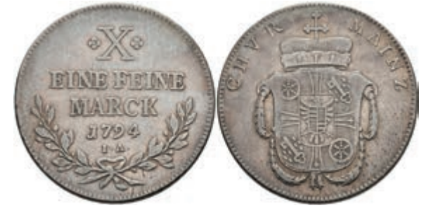
5376 Taler, 1794, Friedrich Karl Joseph von Erthal, Dav. 2432, Slg. Walther 650, ss. 120,—