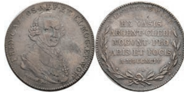
5375 Taler, 1794, Friedrich Karl Joseph von Erthal, Dav. 2431, Slg. Walther 652, ss. 250,—