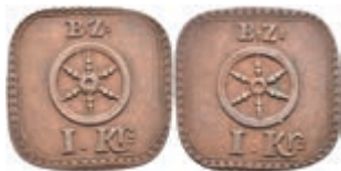
5493 Brückenzollmarke zu 1 Kreuzer, Kupfer, o.J. Av: Rad, darüber "B: Z.", darunter "1. Kr.". Rev: Gleich Avers. Slg. Walther -, ss+. 80,—