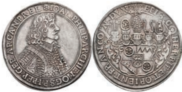
5246 Taler, 1658, Johann Philipp von Schönborn, Dav. 5568, Slg. Walther 310, Hsp., f. vz. (Abbildung auf 93% verkleinert) 800,—