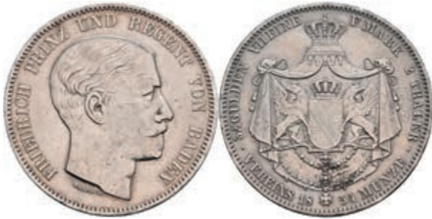
139 Doppeltaler, 1854, Friedrich I., AKS 114, kl. Rf., Kratzer, ss. 400,—