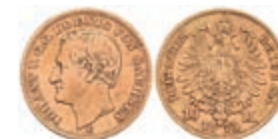
256 10 Mark, 1873, Johann, s-ss. J. 257 200,—