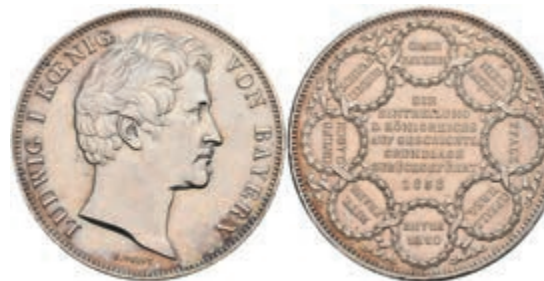
145 Geschichtsdoppeltaler, 1838, Ludwig I., Einteilung des Königreichs, AKS 99, J. 67, wz. Rf., kl. Kr., f. vz. 200,—