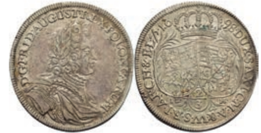
116 2/3 Taler, 1698, Friedrich August I., ILH, Dav. 819, Kahnt 118, f. vz. 200,—