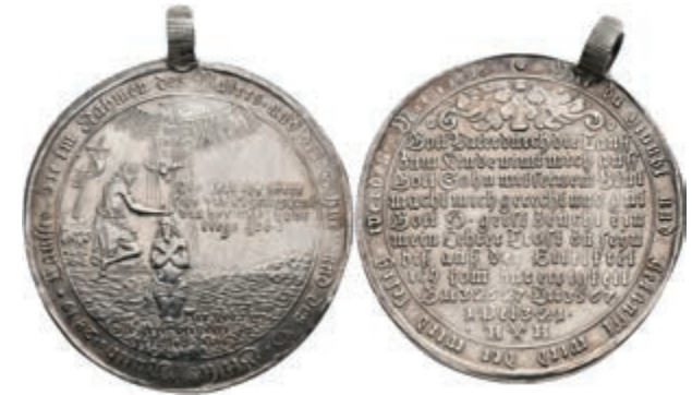
136 Taler, 1715, Münzmeister Heinrich Horst. Av: Taufszene. Rev: 11 Zeilen Schrift. Mit altem Henkel, etwas poliert, ss-vz. (Abbildung auf 76% verkleinert) 150,—