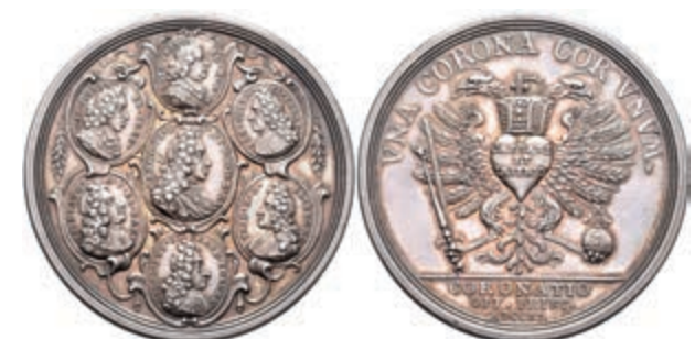
5425 RDR, Silbermedaille (Dm. ca. 48,70mm, ca. 44,97g), 1711, von P. H. Müller, auf die Krönung Karls VI. zum römischen Kaiser. Av: Brustbild des Kaisers im Medaillon nach rechts, darum 6 weitere Medaillons. Rev: Doppeladler mit Zepter, Schwert und Reichsapfel, auf der Brust ein Herz, darüber Krone. Förschner 163, Forster 774, Slg. Mont. 1369, schöne Patina, f. st. (Abbildung auf 82% verkleinert) 1000,—