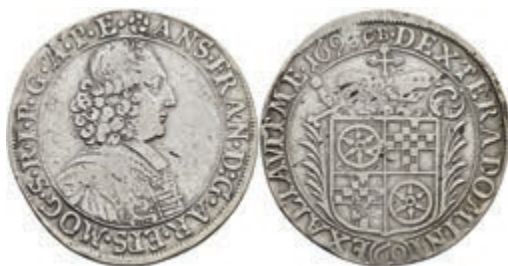
5307 Gulden (60 Kreuzer), 1693, Anselm Franz von Ingelheim, Dav. 658, Slg. Walther 429, Schrötlingsfehler, ss. Selten! 300,—