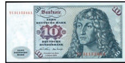
938 10 Deutsche Mark, 2.1.1970, Austauschnote, Serie YC/A, Ro.270c, Erh. I. (Abbildung auf 50% verkleinert) 100,—