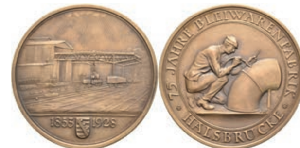
727 Sachsen, Bronzemedaille (Dm. ca. 45,20mm, ca. 34,81g), 1928, von Hörnlein, 75 Jahre Bleiwarenfabrik in Halsbrücke. Av: Kniender Arbeiter beim Schweißen, darum Umschrift. Rev: Ansicht des Fabrikgebäudes, im Abschnitt darunter Wappen zwischen Jahreszahlen. Wurzbach 222, vz-st. (Abbildung auf 92% verkleinert) 80,—