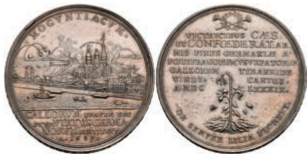
5409 Silbermedaille (Dm. ca. 49,50mm, ca. 44,79g), 1689, von P. H. Müller, auf die Wiedereinnahme der Stadt. Av: Ansicht der unter Beschuss stehenden Stadt, im Abschnitt darunter 4 Zeilen Schrift. Rev: 7 Zeilen Schrift, darüber zwei gekreuzte Posaunen, darunter geknickte Lilie. Slg. P. A. 850/853, Slg. Walther 743, Felder etwas poliert, kl. Kratzer, vz. (Abbildung auf 84% verkleinert) 1000,—