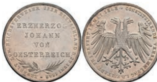
155 Doppelgulden, 1848, Erzherzog Johann von Österreich, AKS 39, J. 46, Kratzer, wz. Rf., vz-st. 70,—