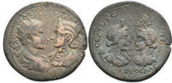
33 Kilikien, Seleuceia ad Calycadnum, Æ (23,56g), Gordianus III. und Tranquillina, 238-244. Av: Die Büsten des Gordianus und der Tranquillina einander gegenüber, darum Umschrift. Rev: Die Büsten des Apollon und der Artemis Tyche einander gegenüber, darum Umschrift. Mit Gegenstempel Howgego 670. Vgl. SNG Levante 776, Revers korrodiert, ss. 100,—