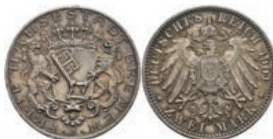
188 2 Mark, 1904, wz. Rf., vz. J. 59 80,—