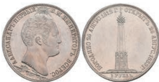
504 Rubel, 1839, Nikolaus I., St. Petersburg, Borodino Denkmal, Bitkin 895 (R), leicht berieben, vz. 800,—