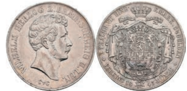
147 Doppeltaler, 1843, Wilhelm, AKS 72, kl. Rf. und Kr., ss. 150,—