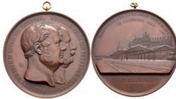
635 Köln, Friedrich Wilhelm IV., Bronzemedaille (Dm. ca. 70mm, 166,27g), 1859, von J. Wiener, auf die Eröffnung der Rheinbahn. Av: Doppelportrait nach rechts, darum Umschrift. Rev: Ansicht des Kölner Hauptbahnhofs, im Abschnitt darunter 2 Zeilen Schrift. Weiler 2473, Slg. Marienburg 5547, gehenkelt, vz. (Abbildung auf 58% verkleinert) 100,—