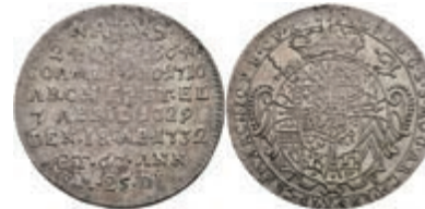
5324 1/4 Taler, 1732, Franz Ludwig von Pfalz-Neuburg, auf seinen Tod, Slg. Walther 495, ss-vz. 400,—