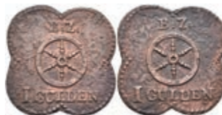
5501 Vierpassförmige Brückenzollmarke zu 1 Gulden, Kupfer, o.J. Av: Rad, darüber "B: Z.", darunter "1 GULDEN". Rev: Gleich Avers. Slg. Walther 794, korrodiert, ss. 100,—