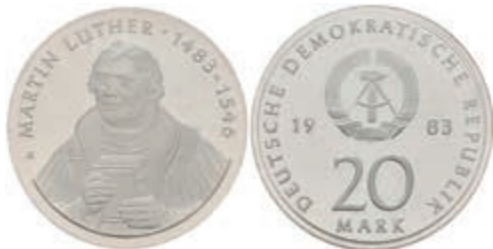
365 20 Mark, 1983, Martin Luther, in Hartplastik verplombt, PP. J. 1591. 180,—