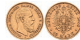
252 10 Mark, 1888, Friedrich III., kl. Kratzer, ss, J. 247. 170,—