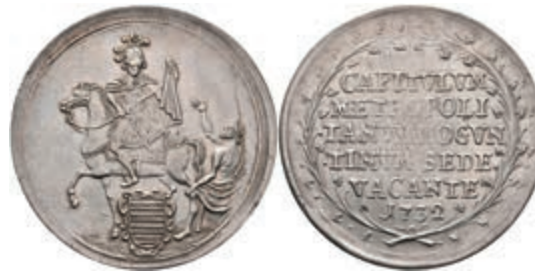
5322 1/2 Schautaler, 1732, Sedisvakanz, Slg. Walther 500, Stempelfehler, f. vz. 500,—