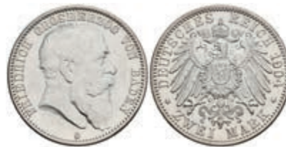
177 2 Mark, 1904, Friedrich I., Avers vz+, Revers f. st. J. 32 100,—