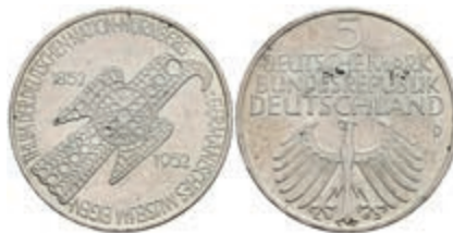
323 5 Mark, 1952, Germanisches Museum, vz. J. 388 200,—