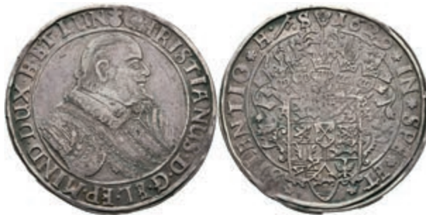
75 Taler, 1632, Christian, Bischof von Minden. Dav. 6475, Welter 924, kleine Schröttingsfehler, ss. 150,—