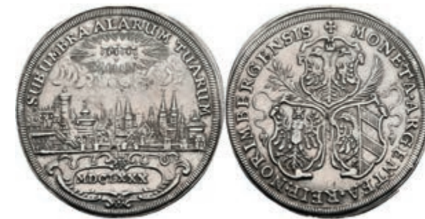
98 Taler, 1680, Stadtansicht, Kellner 259, Dav. 5661, gereinigt, ss. 200,—