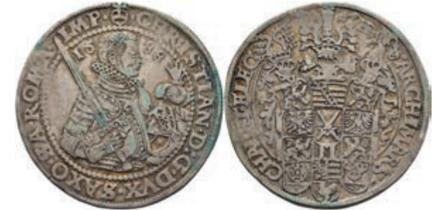
106 Taler, 1588, Christian I., Dav. 9806, Kahnt 142, Schnee 731, Hsp., ss. 150,—