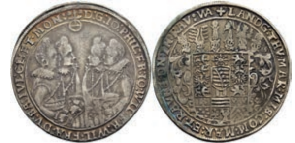
126 Taler, 1616, Johann Philipp, Friedrich, Johann Wilhelm und Friedrich Wilhelm II., Dav. 7365, Schnee 270, kl. Rf., minimal justiert, ss. 200,—