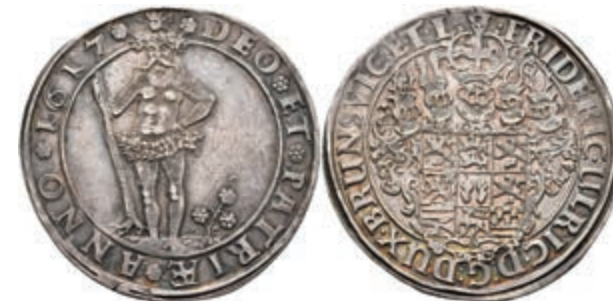
76 Taler, 1617, Friedrich Ulrich, Welter 1057A, Dav. 6303, Schröttingsfehler, ss-vz. 200,—