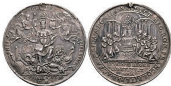
5401 RDR, Matthias, Silbermedaille (Dm. ca. 39,70mm, ca. 22,77g), 1612, von Ch. Maler, auf die Kaiserwahl. Av: Thronende weibliche Gestalt mit drei Gesichtern (Religio, Justitia und Pax) von vorn, links und rechts jeweils ein Genius. Rev: Altar, zu den Seiten die sieben knienden Fürsten, darum Umschrift. Slg. Erlanger 2590, Hsp., kl. Rf., ss. 200,—