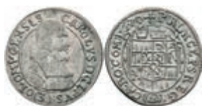
51 Olmütz, 3 Kreuzer, 1670, Karl II. von Lichtenstein, ss-vz. 20,—