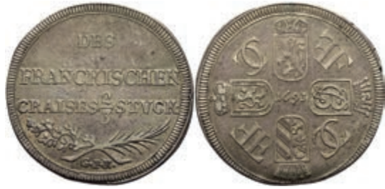
99 Fränkischer Kreis, 2/3 Taler, 1693, GFN, Nürnberg, Dav. 518, kl. Rf., ss. 100,—