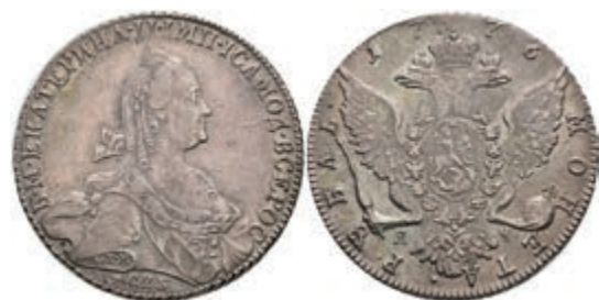
490 Rubel, 1776, Katharina II., St. Petersburg, Bitkin 211, kl. Kratzer, ss-vz. 200,—