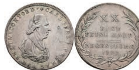
5506 1/2 Taler, 1809, Karl Theodor von Dalberg, AKS 8, J. 5, Slg. Walther 700, kl. Einriss, ss. 50,—