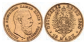
249 10 Mark, 1888, Friedrich III., Rand mit Feilspur, Kratzer im Aversfeld, ss, J. 247. 150,—