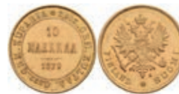
401 10 Markkaa, Gold, 1879, Alexander II., Fb. 4, vz. 220,—