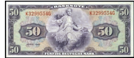
934 50 Deutsche Mark 1948, Kenn.- Bst. K/ Serie G, Ro. 242, Erh. I. (Abbildung auf 50% verkleinert) 1000,—