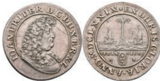
73 2/3 Taler (Palmbaumgulden), 1679, Johann Friedrich, HB, Welter 1730, Dav. 379, Kratzer, ss. 180,—