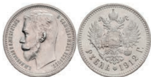
526 Rubel, 1912, Nikolaus II., St. Petersburg, Bitkin 66, wz. Rf., vz+. 100,—