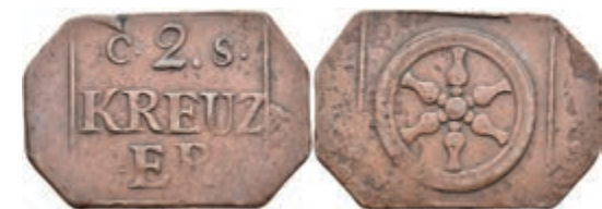
5476 Brückenzollmarke zu 2 Kreuzer, Kupfer, o.J. Av: "2." zwischen "C - S", darunter "KREUZ / ER". Rev: Rad. Slg. Walther 792, ss. 50,—