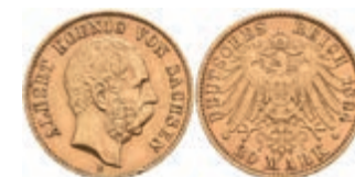
258 20 Mark, 1894, Albert, kl. Rf., ss. J. 264 350,—

Alle Einzellose und Zertifikate/Gutachten sind unter www.rhenumis.de farbig abgebildet!