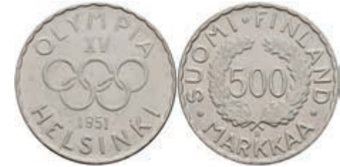
404 500 Markkaa 1951 und 1952, Silber, XV Olympiade in Helsinki 1952, KM 35, AKS 46, vz+ 250,—