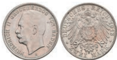
183 2 Mark, 1913, Friedrich II., minimal berieben, f. vz. J. 38 100,—