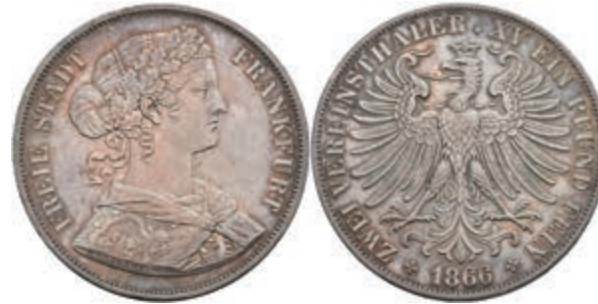
164 Doppeltaler, 1866, AKS 4, J. 43, wz. Rf., f. vz. 80,—