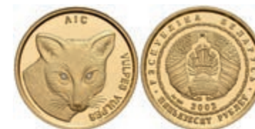
615 50 Rubel, Gold, 2002, Rotfuchs, Parchimowicz 506, PP. 300,—

Alle Einzellose und Zertifikate/Gutachten sind unter www.rhenumis.de farbig abgebildet!