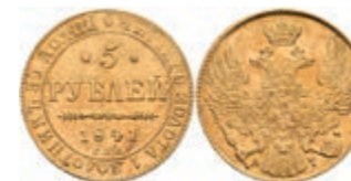
506 5 Rubel, Gold, 1841, Nikolaus I., St. Petersburg, Bitkin 18, Kratzer, ss. 400,—