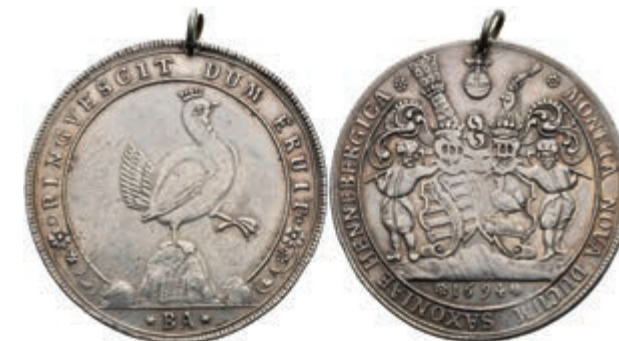
86 Taler, 1695, Ilmenau, Dav. 7484, Schnee 622, justiert, gelocht mit Henkel, gutes ss. (Abbildung auf 91% verkleinert) 300,—