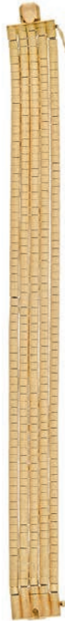
1276 Gold-Armband, Italien, 20. Jh., 4-reihig, 750 Gelbgold, punziert, L. 17cm, 25, 25g, Tragespuren. (Abbildung auf 93% verkleinert) 950,—