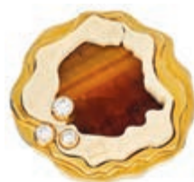
1248 Extravaganter, wohl unikater Damenfingerring mit repräsentativem mehrschichtigen Besatz aus einem Tigerauge, wohl Bein und drei Brillanten, getestet, mit jeweils einem Durchmesser von ca. 2,5 mm von zusammen ca. 0,177 ct. Ringkopf schwer einsehbar gestempelt "800", eventuell Teile Silber, vergoldet, Säuretest 750er GG, positiv. Massive Ringschiene 750er GG, gestempelt. 20. Jh. Aufgrund der fehlenden Goldschmiedepunze, Goldschmied nicht mehr eindeutig zuordenbar. Haarriss im Beinbesatz. Ringgröße: Deutschland: 51; USA/Kanada: 5.8; Großbritannien: L; Frankreich: 11. Ca. 37,96 gr. 1300,—