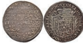
5272 1/8 Taler, 1679, Karl Heinrich von Metternich-Winneburg, auf seinen Tod, Slg. Walther 392, ss. 150,—