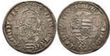
5199 Weißpfennig, o.J. (1459-1462), Dietrich II. von Isenburg, Slg. Walther 151, f. vz. 180,—