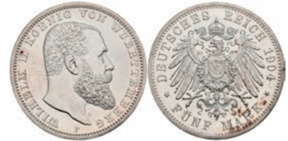
215 5 Mark, 1904, Wilhelm II., kl. Schröttingsfehler/Kratzer, Haarlinien, PP. J. 176 250,—