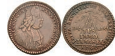
5443 Kupfermedaille (Dm. ca. 25,90mm, ca. 6,68g), 1760, unsign. Av: Brustbild Johann Friedrich Karl von Ostein nach rechts, darum Umschrift. Rev: Pyramide, darin in 5 Zeilen "V / IR / TUS / IMMO / TAMANET", darüber Wolke mit Blitzen, darum Umschrift. Slg. P. A. -, Slg. Walther -, ss. 100,—