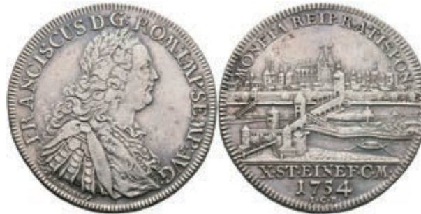
104 Taler, 1754, mit Titel Franz I., sign. Oexlein, Beckenbauer 7101, Dav. 2618B, berieben, ss. 150,—