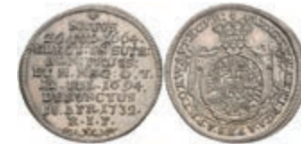
5328 Groschen, 1732, Franz Ludwig von Neuburg, auf seinen Tod, Slg. Walther 498, vz-st. Sehr selten! 200,—