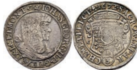
114 1/3 Taler, 1672, Johann Georg II., Kahnt 416b, Variante mit gestielter Rosette, Prägeschwäche, kl. Rf., ss. 50,—