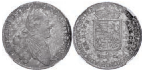
121 2/3 Taler, 1768, Xaver, EDC, hübsche Patina, im Plastiklab der NGC mit der Bewertung XF 45. 400,—