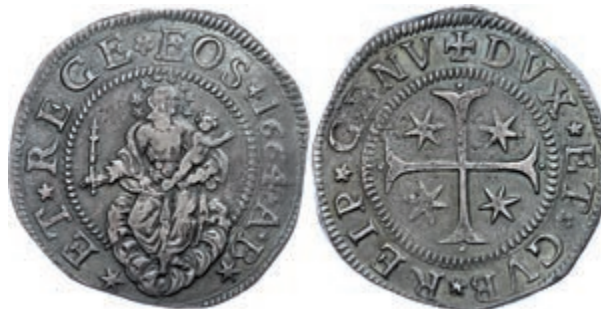
431 Genua, Scudo, 1664, Dav. 3901, ss-vz. 700,—