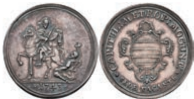
5331 1/4 Schautaler, 1743, Sedisvakanz, Slg. Walther 510, Slg. P. A. 669, schöne Patina, vz. 400,—