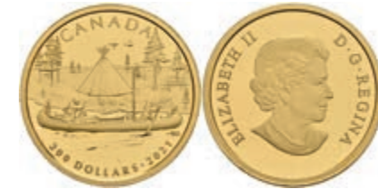
433 200 Dollars, Gold, 2021, Pelzhandel, 15,42g fein, mit Zertifikat in Schatulle, PP (Abbildungen siehe Onlinekatalog) 800,—