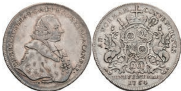
5347 Taler, 1764, Emmerich Joseph von Breitbach-Bürresheim, Dav. 2424, Slg. Walther 594, ss. 200,—