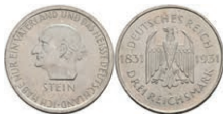
308 3 Reichsmark, 1931, Stein, vz-st. J. 348 60,—