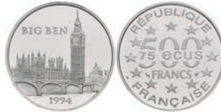
412 500 Francs, Platin, 1994, Big Ben, mit Zertifikat in Ausgabeschatulle, leicht angelaufen, PP. 500,—