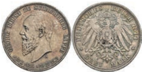
210 3 Mark, 1911, Georg, auf seinen Tod, schöne Patina, f. st. J. 166 150,—