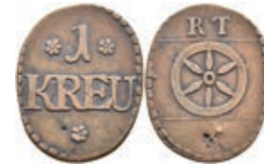
5489 Tormarke zu 1 Kreuzer, Kupfer, o.J. Av: 1 zwischen zwei Rosetten, darunter "KREU" und Rosette. Rev: Rad darüber "R. T.". Slg. Walther 780, ss. 30,—