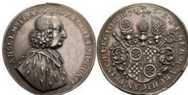
5311 Doppelter Schautaler (58,52g), 1695, Anselm Franz von Ingelheim, Slg. P. A. 603 var., Slg. Walther-, Hsp., Kratzer, ss-vz. Sehr selten! (Abbildung auf 85% verkleinert) 800,—