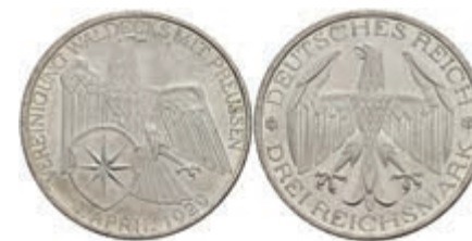
286 3 Reichsmark, 1929, Waldeck, f. st. J. 337 80,—