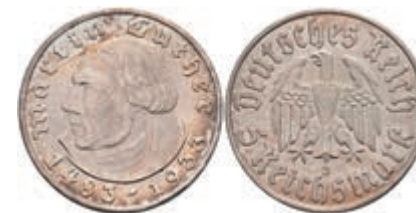
314 5 Reichsmark, 1933, J, Luther, kl. Rf., vz. J. 353 100,—