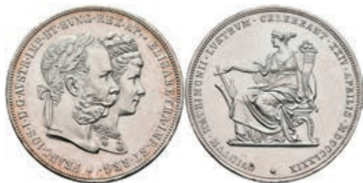
453 Doppelgulden, 1879, Franz Joseph I., zur Silberhochzeit, J. 369, kl. Rf., Kratzer, vz-st. 80,—