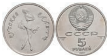
541 5 Rubel, Palladium, 1991, Russisches Ballett, Parchimowicz 227, wz. Flecken, st. 450,—