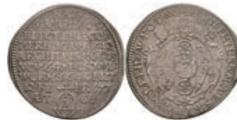
5253 3 Kreuzer, 1673, Johann Philipp von Schönborn, auf seinen Tod, Slg. Walther 338, ss. 150,—

Goldmünzen ab 1800 sowie Goldbarren sind als Anlagegold ggf. umsatzsteuerfrei (auch für das Aufgeld), soweit der Zuschlagpreis inkl. Aufgeld und Losgebühr nicht höher als der Goldwert + 80% ist.