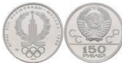
533 150 Rubel, Platin, 1977, Olympia-Emblem, Fb. 182, KM 152, in Ausgabeschatulle, PP. 500,—