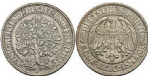
278 5 Reichsmark, 1929, D, Eichbaum, kl. Rf., ss. J. 331 120,—