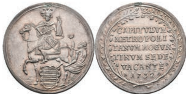
5321 1 Schautaler, 1732, Sedisvakanz, Slg. Walther 499, Hsp., ss-vz. 400,—