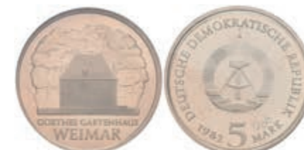
363 5 Mark, 1982, Goethes Gartenhaus, Probe, Nr. 66, in Kapsel verplombt, mit Zertifikat, PP. Sehr selten, Auflage nur 210 Stück. J. 1585P. 1500,—

Alle Einzellose und Zertifikate/Gutachten sind unter www.rhenumis.de farbig abgebildet!