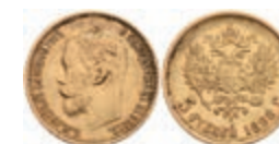
520 5 Rubel, Gold, 1898, Nikolaus II., St. Petersburg, Fb. 180, kl. Rf. und Kratzer, ss. 180,—