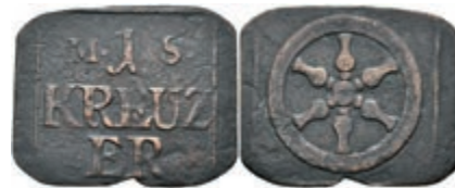
5471 Brückenzollmarke zu 1 Kreuzer, Kupfer, o.J. Av: 1 zwischen "M. - S.", darunter "KREUZ / ER". Rev: Rad. Slg. Walther 785, ss. 50,—