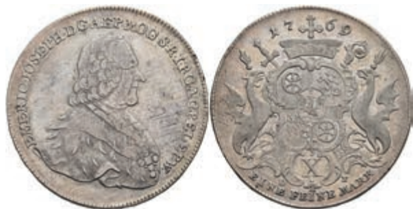
5356 Taler, 1769, Emmerich Joseph von Breitbach-Bürresheim, Dav. 2427, Slg. Walther 617, leicht justiert, ss+. 150,—