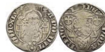
5197 Weißpfennig, 1445, Dietrich I. von Erbach, Bingen, Slg. Walther 135, Prägeschwäche, ss. 70,—