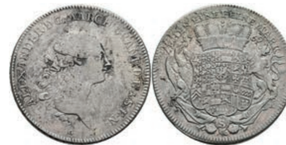
67 Taler, 1769, Christian Friedrich Karl Alexander, Dav. 2001, Slg. Wilmersdörffer 1085, ss. 100,—