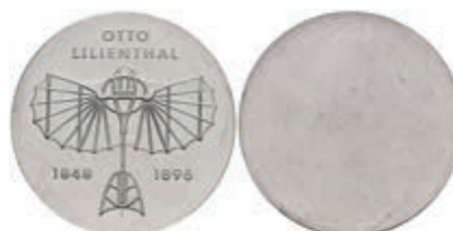
358 5 Mark, 1973, Otto Lilienthal, einseitiger Aluminiumabschlag der Vorderseite, st. Auflage nur 300 Stück. J. 1546A. 50,—