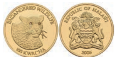
437 100 Kwacha, Gold, 2005, Leopard, PP. 350,—