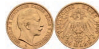
254 20 Mark, 1909, J, Wilhelm II., Rf., ss-vz. J. 252. 300,—