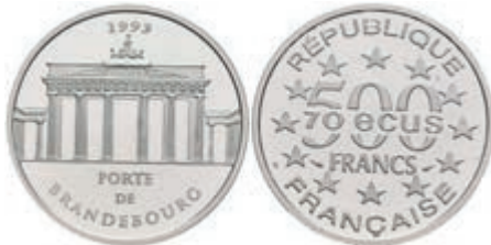
410 500 Francs, Platin, 1993, Brandenburger Tor, mit Zertifikat in Ausgabeschatulle, PP. 500,—