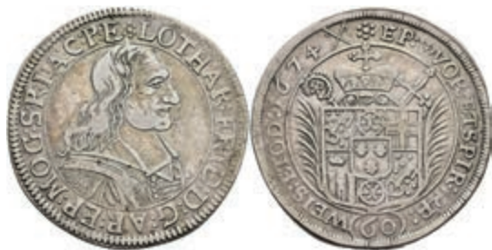
5257 Gulden (60 Kreuzer), 1674, Lothar Friedrich von Metternich-Burscheid, Dav. 648, Slg. Walther 347, ss. 200,—