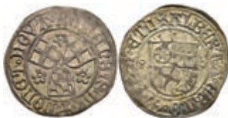
5214 Groschen, 1516, Albrecht II. von Brandenburg, Slg. Walther -, Prägeschwäche, ss. 200,—