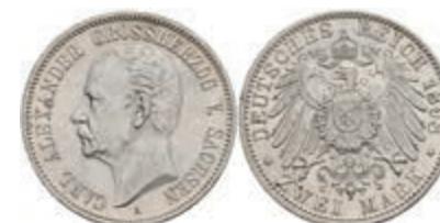
206 2 Mark, 1898, Carl Alexander, kl. Rf., vz+. J. 156 350,—