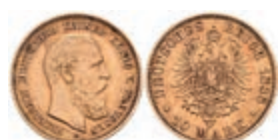
251 10 Mark, 1888, Friedrich III., kl. Kratzer, ss+, J. 247. 170,—