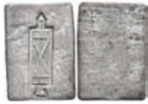
5478 Einseitig geprägte, rechteckige Eisenmarke, o.J. Av: Fascis. Slg. Walther 810, ss. 80,—