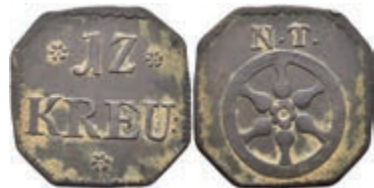
5482 Tormarke zu 12 Kreuzer, Kupfer, o.J. Av: 12 zwischen zwei Rosetten, darunter "KREU", darunter Rosette. Rev: Rad, darüber "N. T.". Slg. P. A. 896, ss. 80,—