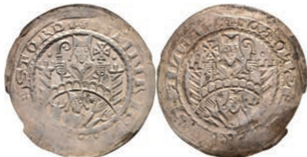
5175 Brakteat (0,92g), Heinrich von Harburg, 1142-1153, Münzstätte Erfurt. Brustbild des Hl. Martin mit Mitra, Krummstab und Kreuzstab über Mauerbogen von vorn, darunter der Erzbischof mit erhobenen Händen zwischen Turm und Stern nach rechts. Berger 2124, Slg. Löbbecke 585, Randausbruch, zaponiert, f. vz. (Abbildung auf 97% verkleinert) 200,—