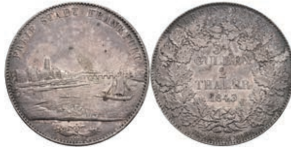
152 Doppeltaler, 1843, Stadtansicht, AKS 3, kleine Kratzer, ss-vz. 150,—