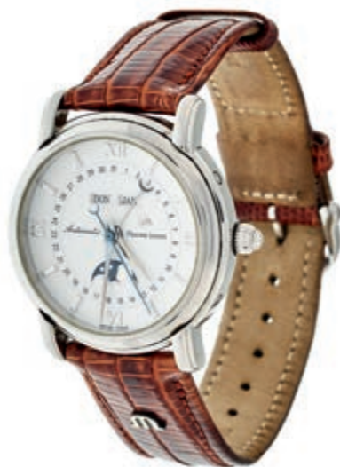
1326 Maurice Lacroix Masterpiece Phase de Lune Herren Armbanduhr. Ca. 37mm, Stahl, Saphirglas, Sichtboden, Ref.-Nr.: 37767, Automatik, weißes Ziffernblatt. Mondphase, Wochentagsanzeige, Datum, Monatsanzeige. Originales ML Lederarmband mit Dornschnalle. Nahezu neuwertiger Zustand, mit Original Box und großem ML Zertifikat. 1250,—