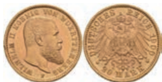
261 20 Mark, 1900, Wilhelm II., kl. Rf., f. vz. J. 296 350,—