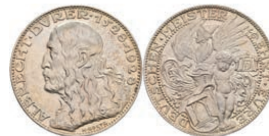
728 Silbermedaille (Dm. ca. 36,10mm, ca. 24,74g), 1928, von K. Goetz, auf den 400. Todestag Albrecht Dürers. Av: Büste Dürers nach links, darum Umschrift. Rev: Stehender nackter Knabe mit Schild und Dürermonogramm, im Außenkranz Umschrift. Kienast 388, Rand punziert, wz. Kr., kl. Rf., vz-st. 50,—