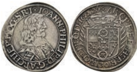
5249 1/2 Gulden (30 Kreuzer), 1672, Johann Philipp von Schönborn, Slg. Walther 330, ss. 200,—