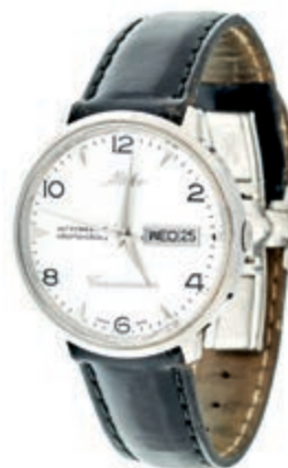
1328 Mido Commander Datoday Herren Armbanduhr. Ca. 37mm, Edelstahl, Hesalite-Glas, Automatik, Ref.-Nr.: 8419.451.8.1 Datumsanzeige, Zeiger fluoreszierend, Gebrauchsspuren auf Lünette. Schwarzes Lederarmband mit Mühle Glashütte Faltschnalle. In Original Box mit Papieren. 300,—