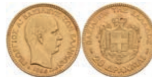
414 20 Drachmen, Gold, 1884, Georg I., Fb. 18, ss 250,—