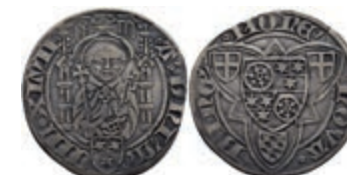
5198 Weißpfennig, 1447, Dietrich I. von Erbach, Bingen, Slg. Walther 136, ss. 100,—

Alle Einzellose und Zertifikate/Gutachten sind unter www.rhenumis.de farbig abgebildet!