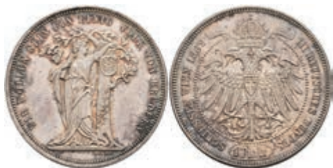
452 Taler, 1868, Franz Josef I. auf das III. Deutsche Bundesschiessen in Wien, Herinek 482, Dav. 28., kleine Randfehler, vz-st. 100,—