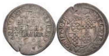
5293 1/12 Taler, 1691, Anselm Franz von Ingelheim, Slg. Walther 455, Schrötlingsfehler am Rand, ss. Selten! 50,—