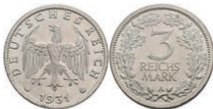
309 3 Reichsmark, 1931, A, vz-st. J. 349 220,—