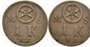
5469 Brückenzollmarke zu 1 Kreuzer, Kupfer, o.J. (18./19. Jh.). Av: Rad zwischen "M - S", darunter 1. Kr. / B:Z:". Rev: Gleich Avers. Slg. Walther 784, ss. 30,—