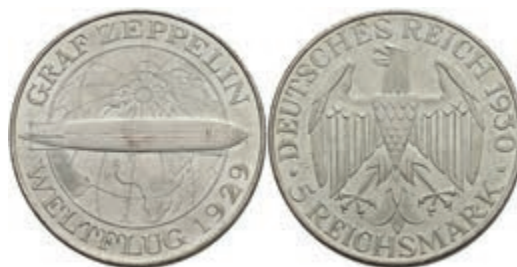
297 5 Reichsmark, 1930, A, Zeppelin, wz. Rf., vz-st. J. 343 130,—