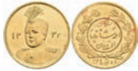
423 Toman, Gold, 1914 (AH 1332), Ahmad, Fb. 84, kl. Kr. und Rf., rote Flecken, vz. 100,—