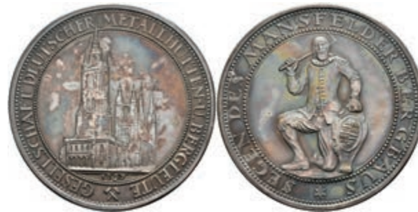
724 Mansfeld, Silbermedaille (Dm. ca. 42,6mm, ca. 29,65g), 1927, von F. Hörnlein, Gesellschaft Deutscher Metallhütten und Bergleute. Av: "Kamerad Martin" (Symbolfigur des Mansfelder Bergbaus) mit Keilhaue und Wappenschild. Rev: Außenansicht des Roten Turms und der Marktkirche in Halle. St. 150,—