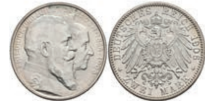
179 2 Mark, 1906, Friedrich I., zur goldenen Hochzeit, f. st. J. 34 30,—