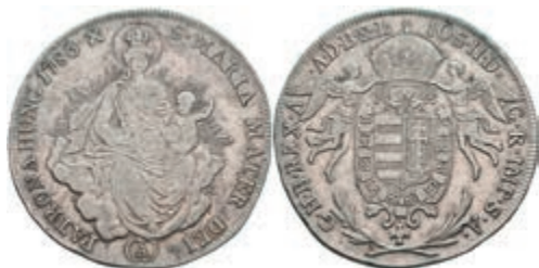
60 1/2 Taler, 1787, Josef II., Wien, für Ungarn, J. 26, s-ss. 30,—