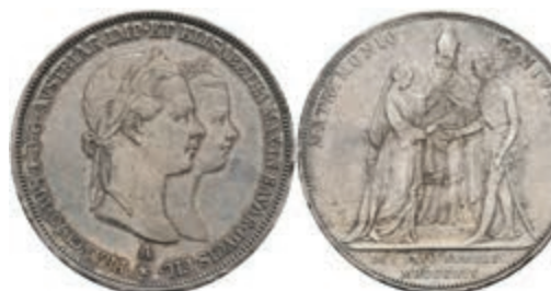
449 Doppelgulden, 1854, Franz Josef I., auf die Vermählung des Kaisers, J. 300, kl. Rf. und Kratzer, ss-vz. 120,—