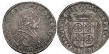
5275 1/2 Gulden (30 Kreuzer), 1680, Anselm Franz von Ingelheim, Slg. Walther 401, ss-vz. Selten! 500,—