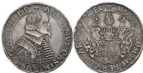
5239 Taler, 1641, Anselm Casimir von Umstadt, Dav. 5548, Slg. Walther 269, schöne Patina, ss. 600,—