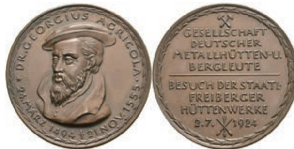
720 Sachsen, Bronzemedaille (Dm. ca. 38,74g, ca. 45mm), 1924, von Hörnlein, auf den Besuch der staatlichen Freiburger Hüttenwerke am 2. Juli. 1924. Av: Brustbild Georgius Agricola halblinks, darum Umschrift. Rev: 7 Zeilen Schrift. St. Selten! Auflage nur 51 Stück. (Abbildung auf 92% verkleinert) 120,—