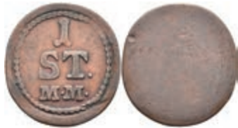
5480 Einseitige Holzmarke, Kupfer, o.J. Av: "1 / ST. / M. M.". Slg. Walther 799, ss. 50,—