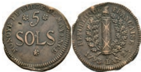
5371 5 Sols (22,79g), 1793, geprägt unter französischer Belagerung, Brause/Mansfeld Tf. 18, Nr. 10, Slg. P. A. 862, Slg. Walther 749, ss. 80,—