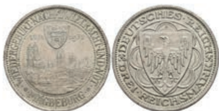
304 3 Reichsmark, 1931, Magdeburg, kl. Rf., vz. J. 347 100,—