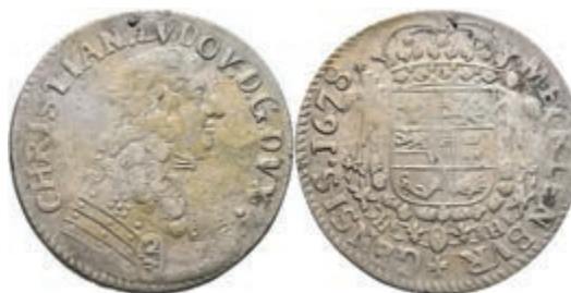
95 2/3 Taler, 1678, Christian Ludwig I., Ratzeburg, Dav. 669, Schrötlingsfehler, ss. 100,—