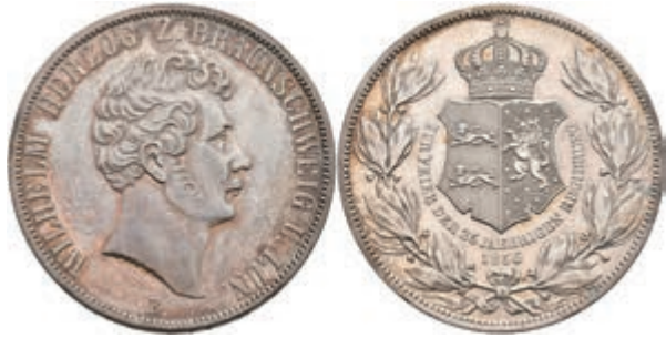
149 Doppeltaler, 1856, Wilhelm, 25jähriges Regierungsjubiläum, AKS 97, J. 252, ss-vz. 150,—