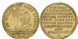
620 Goldmedaille (Dm. ca. 21,80mm, ca. 3,68g), 1717, von P.H. Müller, auf das 200jährige Reformationsjubiläum. Av: Schiff auf ruhiger See mit Kreuz als Mastbaum, darum "DA WARD ES GANZ STILLE". Rev: 9 Zeilen Schrift. Hsp., kl Druckstelle, wellig, Randfehler, ss. 300,—