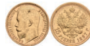
519 15 Rubel, Gold, 1897, Nikolaus II., St. Petersburg, Fb. 177, wz. Rf., ss. 600,—