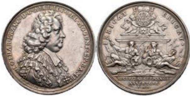
5420 Lothar Franz von Schönborn, Silbermedaille (Dm. ca. 44,70mm, ca. 32,62g), o.J. (1697), von P. H. Müller, auf den Frieden von Ryswick. Av: Brustbild nach rechts, darum Umschrift. Av: Ein von Putti gehaltener Wappenschild auf Podest, darunter die beiden Flussgötter Rhein und Main. Forster 853, Slg. P. A. -, Slg. Walther -, kl. Rf., ss. (Abbildung auf 93% verkleinert) 700,—