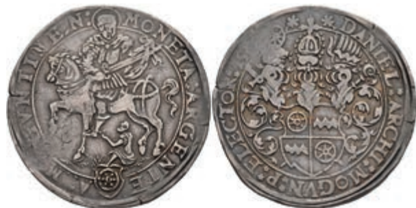
5217 Taler, 156(7)?, Daniel Brendel von Homburg, Dav. 9457, Slg. Walther 199, Prägeschwäche, ss+. 1800,—

Alle Einzellose und Zertifikate/Gutachten sind unter www.rhenumis.de farbig abgebildet! Dort sind auch 271 weitere Lose zu finden, die nicht im gedruckten Katalog, sondern nur im Internet zu finden sind!