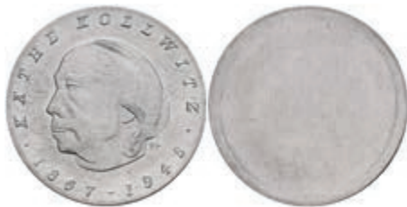
341 10 Mark, 1967, Käthe Kollwitz, einseitiger Aluminiumabschlag der Vorderseite, leicht angelaufen, st. Auflage nur 400 Stück. J. 1519A. 50,—