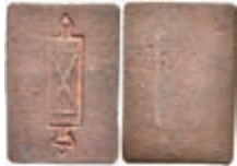
5479 Einseitig geprägte, rechteckige Kupfermarke, o.J. Av: Fascis. Slg. Walther 809, ss. 80,—