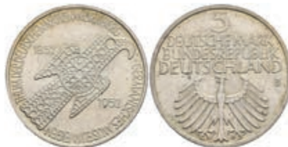
325 5 Mark, 1952, Germanisches Museum, vz. J. 388 200,—