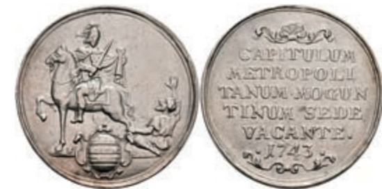
5330 1/2 Schautaler, 1743, Sedisvakanz, Slg. Walther 509, Slg. P. A. 668, Hsp., ss. 150,—