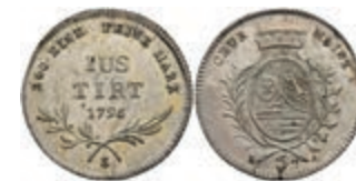
5379 5 Kreuzer, 1795, Friedrich Karl Joseph von Erthal, Slg. Walther 665, vz+. 50,—