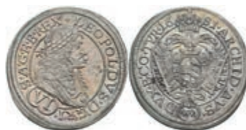
52 6 Kreuzer, 1681, Leopold I., Wien, Herinek 1141, vz. 20,—