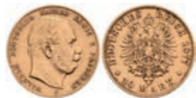
242 10 Mark, 1877, C, Wilhelm I., ss. J. 245. 150,—