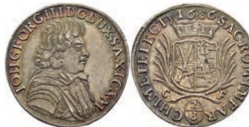
115 2/3 Taler, 1686, Johann Georg III., CF, Dav. 808, Kahnt 588, Hsp., ss-vz. 80,—