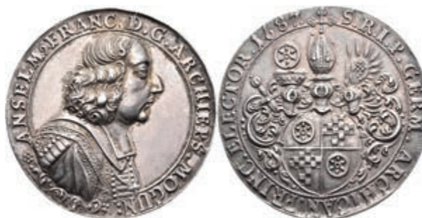
5404 Anselm Franz von Ingelheim, Silbermedaille (Dm. ca. 45,50mm, ca. 31,67g), 1687. Av: Brustbild nach rechts, darum Umschrift. Rev: Dreifach behelmtes Wappen, darum Umschrift. Slg. P. A. 570, Slg. Walther -, vz. (Abbildung auf 91% verkleinert) 1200,—