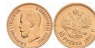
522 10 Rubel, Gold, 1899, Nikolaus II., Fb. 179, kl. Rf., ss. 450,—