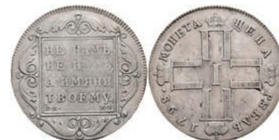
495 Rubel, 1798, Paul I., St. Petersburg, Bitkin 32, ss. 150,—