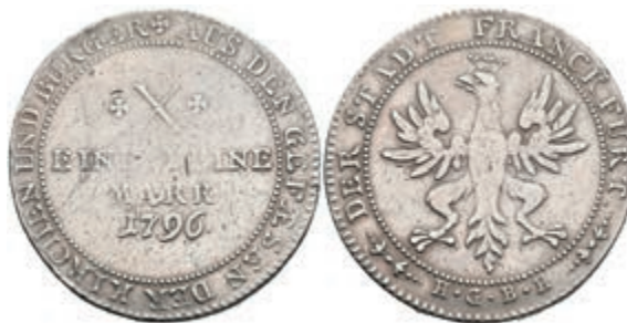
82 Taler, 1796, Dav. 2229, ss. 80,—