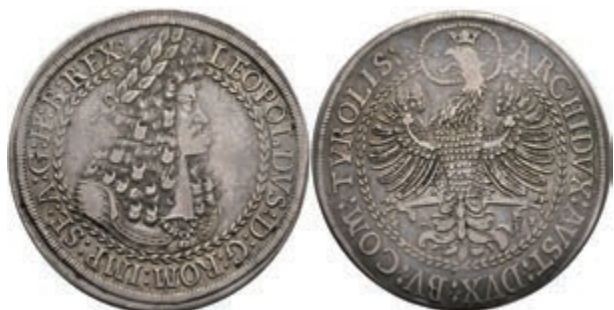
50 Doppeltaler, o.J. (1657-1705), Hall, Herinek 574, Dav. 3252, Randfehler, ss. (Abbildung auf 89% verkleinert) 500,—