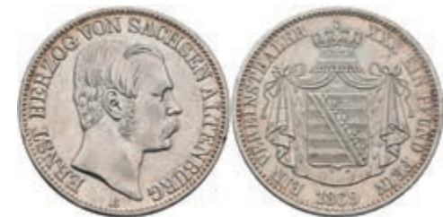
170 Taler, 1864, Ernst I., AKS 61, J. 113, kl. Rf., ss. 50,—