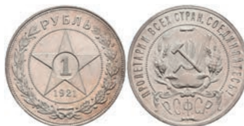
530 Rubel, 1921, St. Petersburg, leicht berieben, vz. 50,—