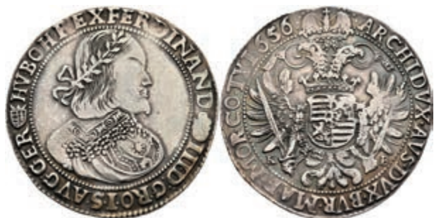
49 Taler, 1652, Ferdinand III., Kremnitz, Dav. 3198, Voglhuber 197, Herinek 484, ss. (Abbildung auf 95% verkleinert) 100,—