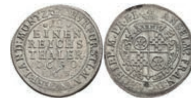
5288 12 Kreuzer, 1690, Anselm Franz von Ingelheim, Slg. Walther 448, ss. 130,—