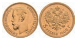
524 5 Rubel, Gold, 1902, Nikolaus II., Fb. 180, kl. Kratzer, f. st. 200,—