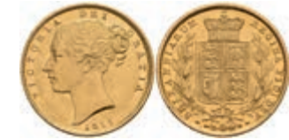
416 Sovereign, 1855, Victoria, Fb. 387e, kl. Rf., f. vz. 300,—