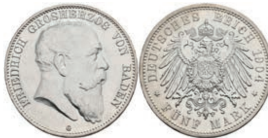
178 5 Mark, 1904, Friedrich I., wz. Rf., Kratzer, vz-st. J. 33 170,—