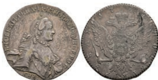
489 Rubel, 1764, Katharina II., St. Peterburg, Bitkin 186, Schrötlingsfehler, ss. 150,—