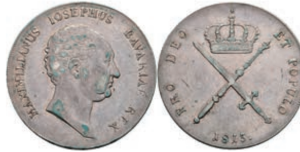
142 Taler, 1819, Maximilian I. Joseph, AKS 44, J. 14, etwas Grünspan, ss. 50,—