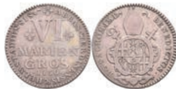
135 6 Mariengroschen, 1730, Benedikt von Geismar, Grote 58, ss. 100,—