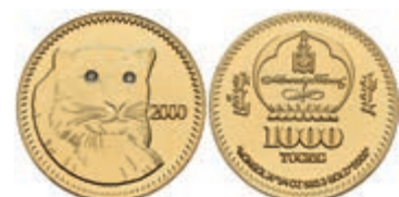
445 1000 Tugrik, Gold, 2000, Schneeleopard, mit Zertifikat, PP. Auflage nur 1000 Stück. 200,—