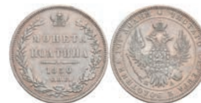
509 1/2 Rubel (Poltina), 1850, Nikolaus I., St. Petersburg, Bitkin 263, ss. 50,—