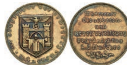
739 Silbermedaille (Dm. ca. 30mm, ca. 19,08g), o.J. (1933-1945), unsign., Verdienstmedaille der Münchner Dienstboten- und Arbeiterstiftung. Av: Wappen, darum Umschrift. Rev: 6 Zeilen Schrift. Kl. Kratzer und Rf., vz. Selten! 50,—