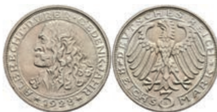
280 3 Reichsmark, 1928, Dürer, f. st. J. 332 300,—