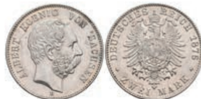
199 2 Mark, 1876, Albert, vz. J. 121 500,—