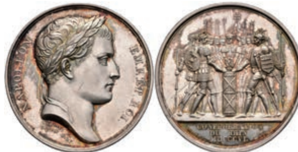
5460 Frankreich, Napoleon, Silbermedaille (Dm. ca. 40,60mm, ca. 38,77g), 1806, von Andrieu und Brenet, auf die Gründung des Rheinbundes. Av: Kopf nach rechts, darum Umschrift. Rev: Schwurszene. Bramsen 534, Slg. Julius 1587, f. st. 400,—