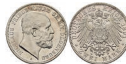
192 2 Mark, 1891, Nicolaus Friedrich Peter, winzige Randfehler, Avers vz, Revers vz-st. J. 93 300,—