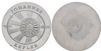
354 5 Mark, 1971, Johannes Kepler, einseitiger Aluminiumabschlag der Vorderseite, kl. Rf., f. st. Auflage nur 450 Stück. J. 1534A. 50,—