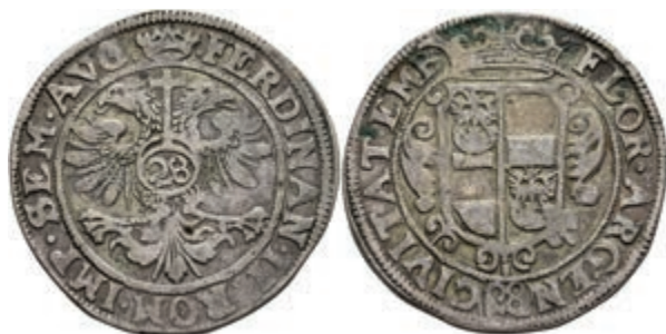
80 Gulden (28 Stüber), o.J. (1624-1637), mit Titel Ferdinand II., Dav. 508, kl. Rf., ss. 50,—