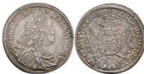
55 1/2 Taler, 1724, Karl VI., Hall, Herinek 486, M./T. 836, ss-vz. 150,—