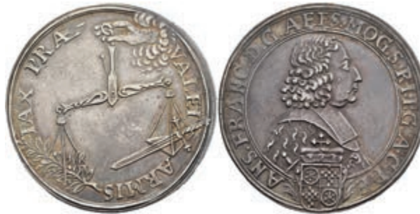
5274 Taler, o.J., Anselm Franz von Ingelheim, Dav. 5567, Slg. Walther 394, Felder teilw. leicht berieben, kräftige Patina, ss-vz. (Abbildung auf 93% verkleinert) 1500,—