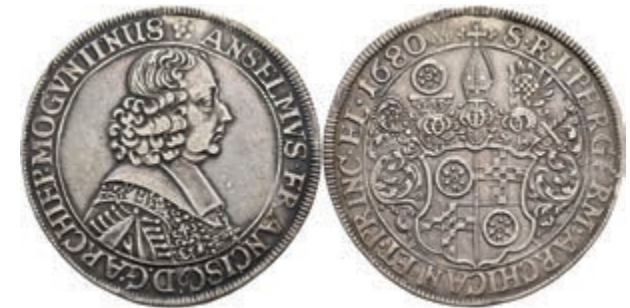
5278 Taler, 1680, Anselm Franz von Ingelheim, Dav. 5569, Slg. Walther 399, Hsp., ss. (Abbildung auf 95% verkleinert) 300,—