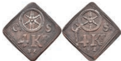
5494 Brückenzollmarke zu 4 Kreuzer, Kupfer, o.J. Av: Rad zwischen "C. - S.", darunter "4. Kr. / B. Z.". Rev: Gleich Avers. Slg. Walther 788, ss. 50,—