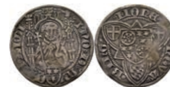
5196 Weißpfennig, 1443, Dietrich I. von Erbach, Bingen, Slg. Walther 133, ss. 100,—