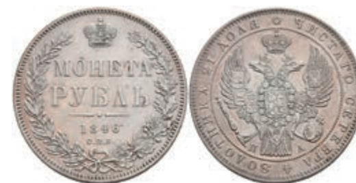
508 Rubel, 1846, Nikolaus I., St. Petersburg, Bitkin 208, wz. Rf., leicht berieben, ss-vz. 50,—