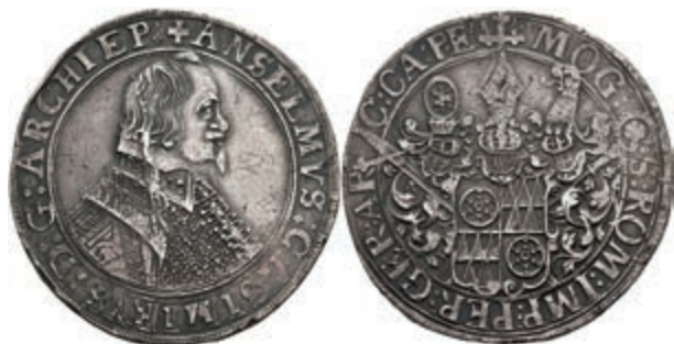
5236 Taler, 1637, Anselm Casimir von Umstadt, Dav. 5548, Slg. Walther 255, Kratzer/bearbeitet, ss. (Abbildung auf 97% verkleinert) 250,—