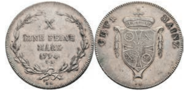
5377 Taler, 1794, Friedrich Karl Joseph von Erthal, Dav. 2433, Slg. Walther 651, ss-vz. 250,—