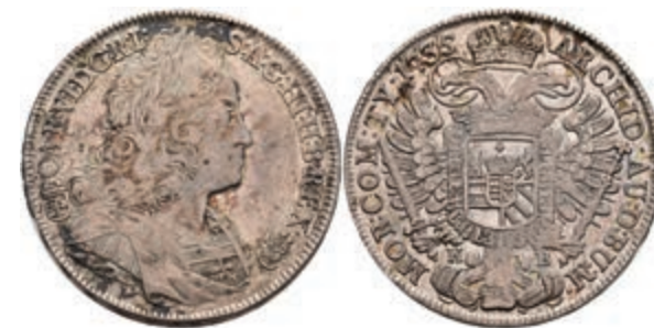
56 Taler, 1735, Karl VI., Kremnitz, Dav. 1060, Voglhuber 260/IV, Herinek 450, ss. 120,—