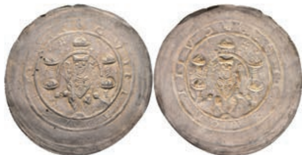
5177 Brakteat (0,82g), Konrad von Wittelsbach, 1160-1165. Thronender Erzbischof mit Lilienzepter und Krummstab von vorn, darüber Bogen mit Türmen. Slg. Löbbecke 605, Slg. Walther 30, ss-vz. (Abbildung auf 97% verkleinert) 800,—