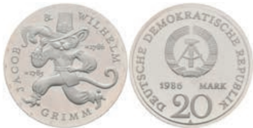
366 20 Mark, 1986, Gebrüder Grimm, in Hartplastik verplombt, PP. J. 1607. 200,—