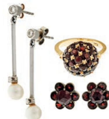
1254 Konvolut aus Ring mit Besatz 31 Granate, GG 18K (6,77g) Innen Dm 16 mm, Paar Ohrstecker blütenförmig mit 6 kleineren und 1 großen Granaten in Normgold (2,43g) und Paar Perlen-Ohrstecker mit Brillantenbesatz 585 WG (2,91g), ein Verschluss 925 Silber. (Abbildungen siehe Onlinekatalog) 450,—

Goldmünzen ab 1800 sowie Goldbarren sind als Anlagegold ggf. umsatzsteuerfrei (auch für das Aufgeld), soweit der Zuschlagpreis inkl. Aufgeld und Losgebühr nicht höher als der Goldwert + 80% ist.