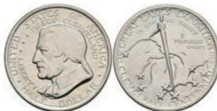
606 1/2 Dollar, 1936, Cleveland, KM 177, minimaler Grünspan, vz. 50,—