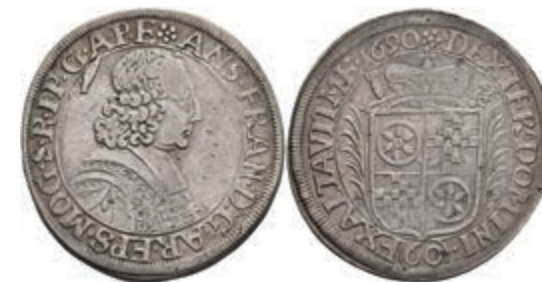
5291 Gulden (60 Kreuzer), 1690, Anselm Franz von Ingelheim, Dav. 658, Slg. Walther 417, Stempelfehler, ss. 150,—

Alle Einzellose und Zertifikate/Gutachten sind unter www.rhenumis.de farbig abgebildet!