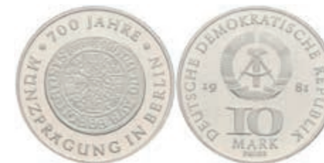
362 10 Mark, 1981, 700 Jahre Münzprägung in Berlin, Probe, in Kapsel verplombt, PP. J. 1582P1. 300,—