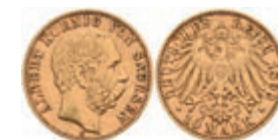
257 10 Mark, 1893, Albert, ss. J. 263 200,—