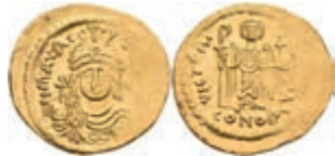
34 Mauricius Tiberius, 582-602, Solidus (4,31g), Konstantinopel. Av: Brustbild mit Schild und Kreuzglobus von vorn, darum Umschrift. Rev: Stehender Engel mit Christogramm Stab und Kreuzglobus von vorn, darum Umschrift. Sear 478, Prägeschwäche, f. vz. 250,—