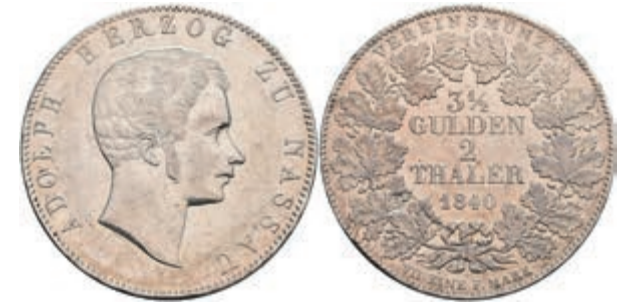
167 Doppeltaler, 1840, Adolph, AKS 58, kl. Rf. und Kr., ss. 200,—