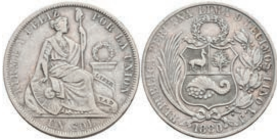
466 Sol, 1880, Lima, YJ, KM 196.5, kl. Rf., ss. 100,—