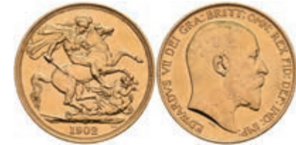
417 2 Pounds, Gold, 1902, Edward VII., London, Fb. 399, ss-vz. 600,—