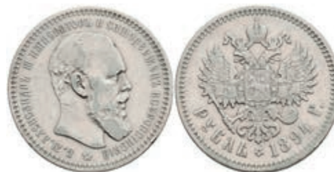
516 Rubel, 1894, Alexander III., St. Petersburg, Bitkin 78, kl. Rf., ss. 80,—