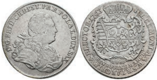
119 Taler, 1763, Friedrich Christian, Schnee 1053, ss. 150,—