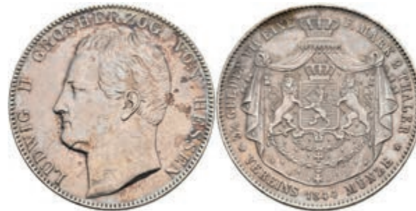
166 Doppeltaler, 1844, Ludwig II., AKS 100, J. 41, kl. Rf. und Kr., ss. 100,—