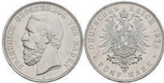
172 5 Mark, 1875, Friedrich I., kl. Rf., vz. J. 27 600,—