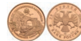
550 25 Rubel, Gold, 1994, Baikaltunnel, Parchimowicz 1419, in Kapsel, PP. 200,—