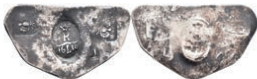
89 Notklinge zu 1 Taler (3,15g), 1610. Vier Stempel auf Silberplatte. Brause/Mansfeld -, ss. Vermutlich spätere Anfertigung! 100,—