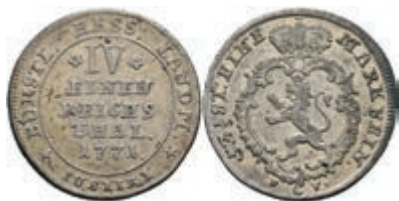
88 1/4 Taler, 1771, Friedrich II., Müller 2746, ss 30,—