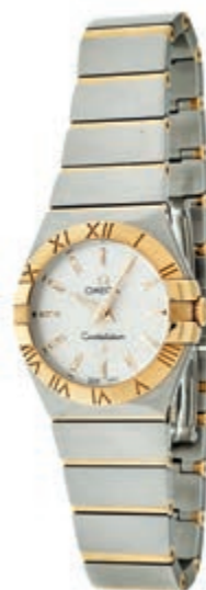
1338 Omega Constellation Damen Armanduhr. Ca. 28mm, Edelstahl, entspiegeltes Saphirglas, Quarz, Ref.-Nr.: 91304922. Silbernes Zifferblatt, Zeiger fluoreszierend. Sehr guter Zustand. Original Omega Armband, versilberter Stahl mit Omega Faltschließe. Armband erweiterbar, ein weiteres Element enthalten. 1500,—