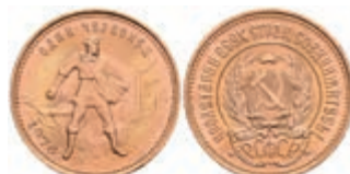
531 10 Rubel, Gold, 1976, Fb. 163, st. 340,—