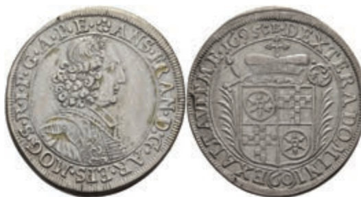
5312 Gulden (60 Kreuzer), 1695, Anselm Franz von Ingelheim, Dav. 658, Slg. Walther 439, ss. 150,—