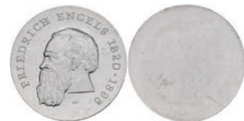
350 20 Mark, 1970, Friedrich Engels, einseitiger Aluminiumabschlag der Vorderseite, st. Auflage nur 330 Stück. J. 1529A. 50,—