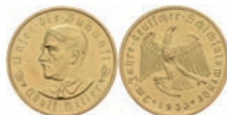
736 Adolf Hitler, Goldmedaille (Dm. 23 mm, 6,48g), 1933, unsigniert, auf die Ereignisse des Jahres. Av: Brustbild Hitlers nach links, darum Umschrift. Rev: Adler mit zerrissenen Fesseln, darum "Im Jahre deutscher Schicksals-wende 1933". Mit Randschrift "Preuss. Staatsmuenze Gold 18 Kar.", f. st. 1000,—