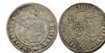
5195 Weißpfennig, o.J. (1434-1454), Dietrich I. von Erbach, Bingen, Slg. Walther 132 var., s-ss. 70,—