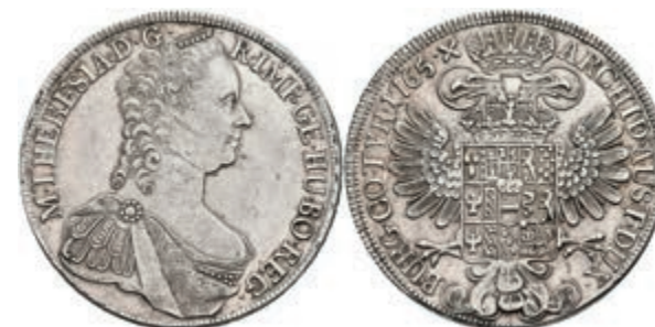
58 Taler, 1765, Maria Theresia, Wien, Dav. 1112, Eypeltauer 74, min. justiert, ss-vz. 100,—