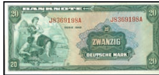
930 20 Deutsche Mark 1948, Kenn.- Bst. J/ Serie A, Ro. 240, Erh. I. (Abbildung auf 50% verkleinert) 350,—