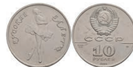
536 10 Rubel, Palladium, 1990, Russisches Ballett, Parchimowicz 242, kl. Flecken, vz-st. 900,—