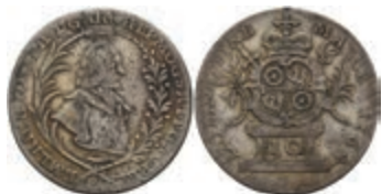
5346 10 Kreuzer, 1764, Emmerich Joseph von Breitbach-Bürresheim, Slg. Walther 595, justiert, f. ss. 30,—