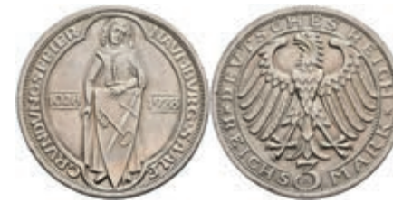
281 3 Reichsmark, 1928, Naumburg, kl. Rf., vz-st. J. 333 120,—