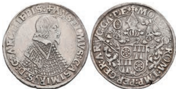
5238 Taler, 1639, Anselm Casimir von Umstadt, Dav. 5549, berieben, kl. Schrötlingsfehler, ss. (Abbildung auf 96% verkleinert) 200,—