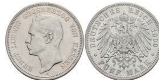
190 5 Mark, 1900, Ernst Ludwig, kl. Kr., ss. J. 73 120,—