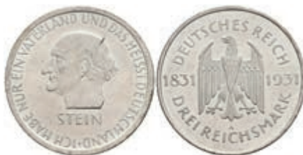
307 3 Reichsmark, 1931, Stein, f. st. J. 348 70,—