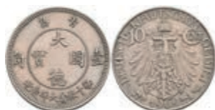
321 Kiautschou, 10 Cent, 1909, kl. Rf., ss-vz. J. N 730 150,—