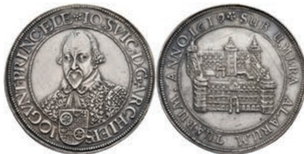
5229 Taler, 1619, Johann Schweickhardt von Kronberg, Dav. 5539, Slg. Walther 229, Hsp., Felder stellenweise bearbeitet, ss-vz. Sehr selten! Mit Unterlegzettel der Münzhandlung R. Kaiser, Frankfurt. (Abbildung auf 95% verkleinert) 2500,—