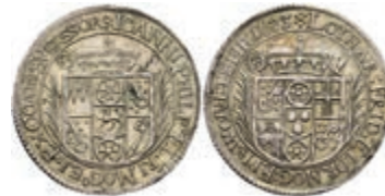
5251 1/10 Taler, 1673, Lothar Friedrich von Metternich-Burscheid, auf seine Inthronisation, Slg. Walther 339, ss-vz. Sehr selten! 500,—