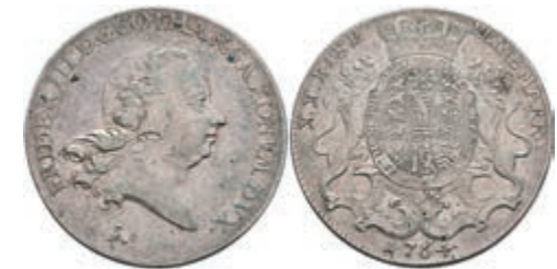
127 1/2 Taler, 1764, Friedrich III., Slg. Mersb. 3245, ss. 80,—