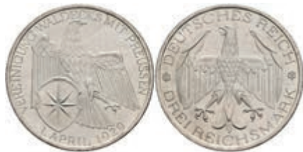
287 3 Reichsmark, 1929, Waldeck, vz. J. 337 80,—