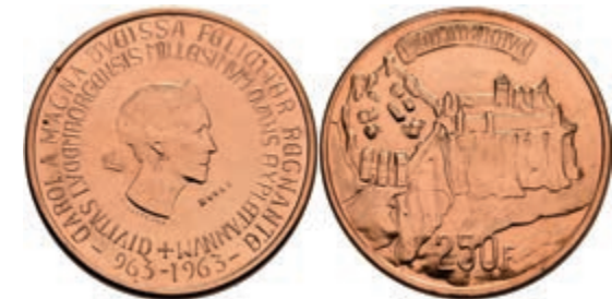
435 250 Francs, Kupfer, 1963, Charlotte, Essai, Haarlinien, st. 100,—