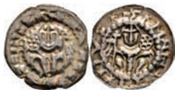
5187 Brakteat (0,34g), 1289-1305. Sitzender Geistlicher mit Kreuzfahne und Rad von vorn. Slg. Walther 60, Berger 2146, ss. 50,—