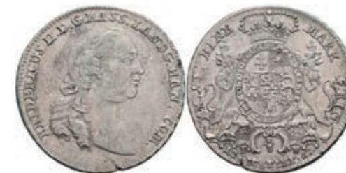
87 2/3 Taler, 1767, Friedrich II., Kassel, Müller 2733, Schröttingsfehler am Rand, ss. 80,—