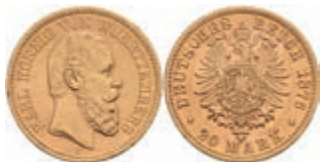
260 20 Mark, 1876, Karl, kl. Rf., vz. J. 293 350,—