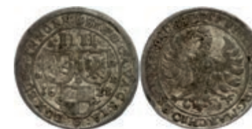
68 Batzen zu 4 Kreuzer (2,64g), 1624, Christian, Slg. Wilm. 626, ss. 80,—