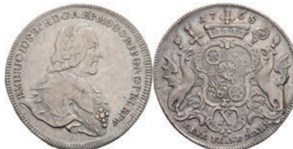
5355 Taler, 1768, Emmerich Joseph von Breitbach-Bürresheim, Dav. 2427, Slg. Walther 612, Stempelbruch, ss. 200,—

Alle Einzellose und Zertifikate/Gutachten sind unter www.rhenumis.de farbig abgebildet!