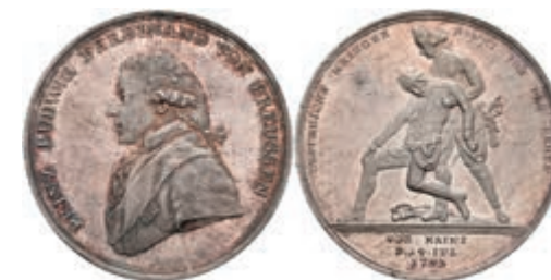
5453 Preußen, Friedrich Wilhelm II., Silbermedaille (Dm. ca., 34,80mm, ca. 14,56g), 1793, von A. Abramson, auf die Tapferkeit des Prinzen Friedrich Ludwig Christian. Av: Brustbild nach links, darum Umschrift. Rev: Der Prinz stützt einen österreichischen Soldaten, darum Umschrift. Slg. Walther -, Slg. Henckel 1995, kl. Kratzer, schöne Patina, vz-st. 400,—