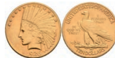
601 10 Dollars, Gold, 1926, Philadelphia, Indian Head, Fb. 165, ss-vz. 700,—