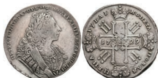
482 Rubel, 1729, Peter II., Kadashevsky Münzhof, Bitkin 121, Revers leicht berieben, kl. Schröttingsfehler und Zainende, ss. 200,—