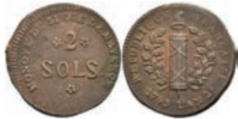
5369 2 Sols (7,94g), 1793, geprägt unter französischer Belagerung, Brause/Mansfeld Tf. 18, Nr. 11, Slg. P. A. 863, Slg. Walther 752, ss. 30,—