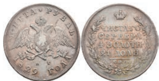
500 Rubel, 1829, Nikolaus I., St. Petersburg, Bitkin 107, kl. Rf., ss. 80,—