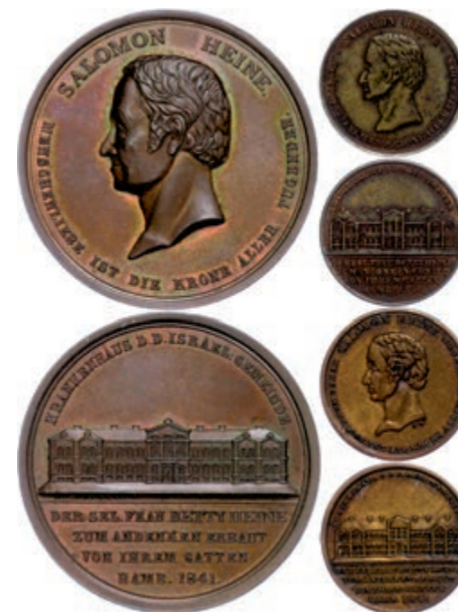
629 Hamburg, Bronzemedaille (Dm. ca. 45mm), 1841, von H.F. Alsing, auf die Erbauung des Krankenhauses der israelitischen Gemeinde durch Salomon Heide. Dazu dieselbe (2x) Revers mit leichter Abweichung (Dm. ca. 23mm). Gaedeckens 2070, ss-vz. 400,—