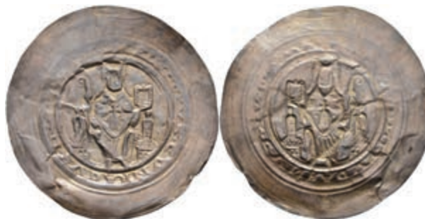
5180 Brakteat (0,71g), Konrad von Wittelsbach, 1183-1200. Thronender Erzbischof mit Kreuzstab und Buch von vorn. Fd von Seega 197, Fd von Erfurt 8, winzige Löcher, ss. (Abbildung auf 95% verkleinert) 400,—