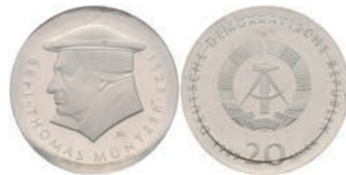
370 20 Mark, 1989, Thomas Müntzer, in Kapsel eingeschweißt, PP. J. 1624. 100,—