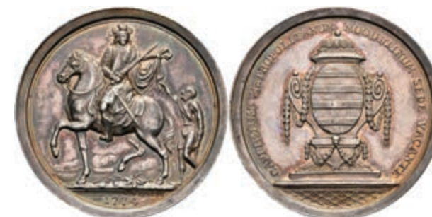
5365 Schautaler, 1774, Sedisvakanz, Slg. P. A. 755, Slg. Walther 640, vz. (Abbildung auf 95% verkleinert) 1800,—

Goldmünzen ab 1800 sowie Goldbarren sind als Anlagegold ggf. umsatzsteuerfrei (auch für das Aufgeld), soweit der Zuschlagpreis inkl. Aufgeld und Losgebühr nicht höher als der Goldwert + 80% ist.