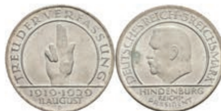
294 3 Reichsmark, 1929, Schwurhand, D, vz-st. J. 340 30,—