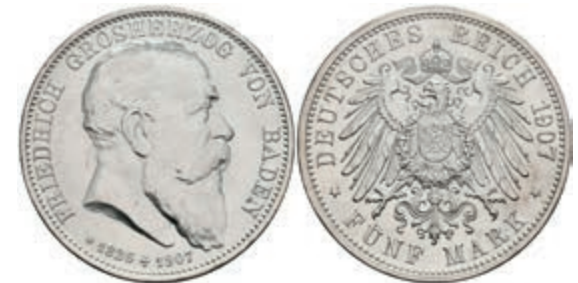
182 5 Mark, 1907, Friedrich I., auf seinen Tod, wz. Rf., vz-st. J. 37 150,—