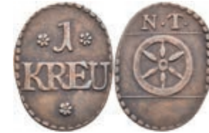
5488 Tormarke zu 1 Kreuzer, Kupfer, o.J. Av: 1 zwischen zwei Rosetten, darunter "KREU" und Rosette. Rev: Rad darüber "N. T.". Slg. Walther 778, ss. 30,—