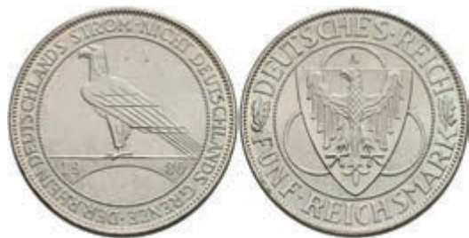
303 5 Reichsmark, 1930, A, Rheinlanddräumung, kl. Rf., vz-st. J. 346 100,—