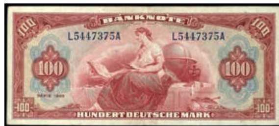
928 100 Deutsche Mark 1948, Kennbst. L/ Serie A, KN 7-stellig schwarzblau, Ro. 244 /P8a, Erh. III. (Abbildung auf 50% verkleinert) 400,—