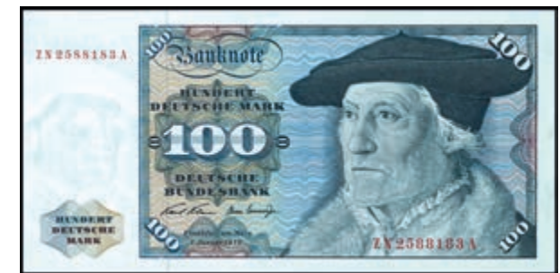
939 100 Deutsche Mark, 2.1.1970, Austauschnote zu Serie ZN/A, Ro. 273c, Erh. I (Abbildung auf 50% verkleinert) 300,—