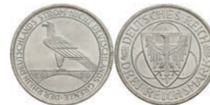
301 3 Reichsmark, 1930, A, Rheinlandräumung, wz. Rf. und Kr., f. st. J. 345 30,—