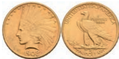
594 10 Dollars, Gold, 1908, Denver, Indian Head, Fb. 165, kl. Rf., ss. 700,—