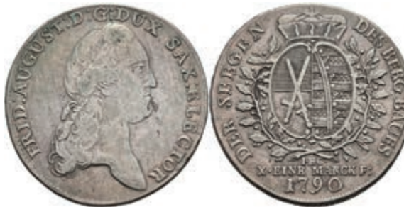
124 Taler, 1790, Friedrich August III., IEC, Dav. 2696, Kahnt 1082, Schnee 1087, kl. Schröttingsfehler, ss. 100,—