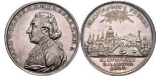
5462 Frankfurt, Carl Theodor von Dalberg, Silbermedaille (Dm. ca. 41,35mm, ca. 26,95g), 1807, unsign., auf die Huldigung der Stadt Frankfurt. Av: Brustbild nach links, darum Umschrift. Rev: Stadtansicht. Slg. P. A. 802, Slg. Walther 689, Joseph/Fellner 987, kl. Kratzer, vz-st. 400,—