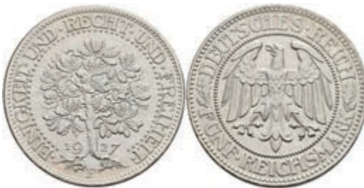
277 5 Reichsmark, 1927, F, Eichbaum, vz+. J. 331 160,—