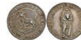
5366 Ritterstift St. Albern, Silberabschlag vom Goldgulden 1779, Slg. P. A. -, Slg. Walther 733, ss. Seltene! 400,—