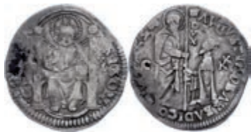
426 Venedig, Marcello (1/2 Lira), o.J. (1486-1501), Agostino Barbarigo, CK, Doppelschlag, s-ss. 100,—