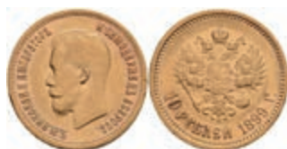
514 10 Rubel, Gold, 1899, Nikolaus II., Fb. 179, kl. Rf., ss. (Abbildungen siehe Onlinekatalog) 450,—