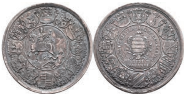
5345 Schautaler, 1763, Sedisvakanz, Slg. P. A. 706, Slg. Walther 589, schöne Patina, ss+. (Abbildung auf 89% verkleinert) 500,—