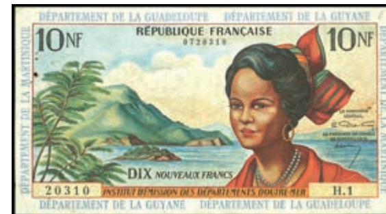
957 Französische Antillen, 10 Nouveaux Francs o. D. (1964). kl. RostlöcherP.5a. Erh. III. (Abbildung auf 50% verkleinert) 150,—