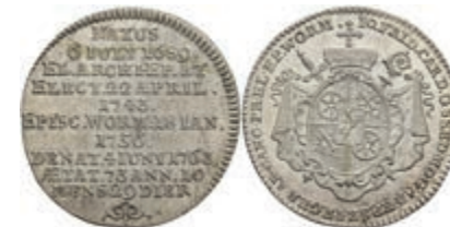
5340 1/4 Taler, 1763, Johann Friedrich Karl von Ostein, auf seinen Tod, Slg. Walther 524, vz-st. Sehr selten! 500,—