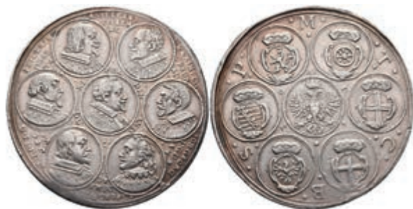
5402 RDR, Silbermedaille (Dm. ca. 40,80mm, ca. 25,84g), 1630, auf den Reichstag zu Regensburg. Av: Büste des Kaisers im Medaillon nach rechts, darum sechs weitere Medaillons. Rev: Gekrönter Doppeladler im Medaillon, darum sechs weitere Medaillons. Slg. P. A. 356, Slg. Mont. 766, Slg. Horsky 1605, kl. Rf., ss. 250,—