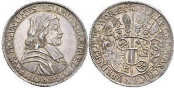
5268 Taler, 1676, Damian Hartard von der Leyen, Dav. 5562, Slg. Walther 357, schöne Patina, ss-vz. Sehr selten! (Abbildung auf 95% verkleinert) 4000,—