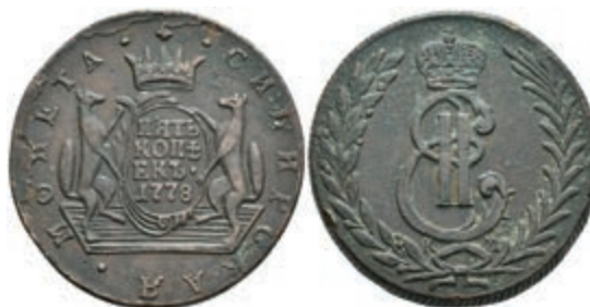
491 5 Kopeken, 1778, Katharina II., Suzun, Bitkin 1082, Randfehler, ss. 50,—