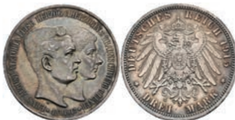
187 3 Mark, 1915, Ernst August, mit Lüneburg, kl. Rf., schöne Patina, vz. J. 57 100,—