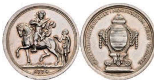
5361 1/2 Schautaler, 1774, Sedisvakanz, Slg. P. A. 756, Slg. Walther 641, Randfehler, ss-vz. 200,—