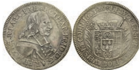
5252 1/2 Gulden (30 Kreuzer), 1673, Lothar Friedrich von Metternich-Burscheid, Slg. Walther 343, ss. 200,—