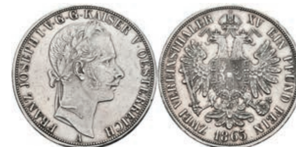
450 Doppeltaler, 1865, Franz Joseph I., Wien, Dav. 23, J. 313, kl. Rf., gereinigt, f. vz. 1300,—

Alle Einzellose und Zertifikate/Gutachten sind unter www.rhenumis.de farbig abgebildet!