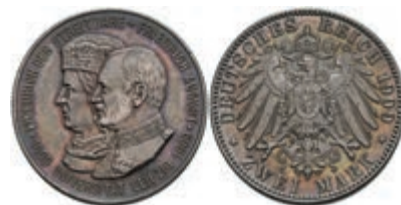
201 2 Mark, 1909, Friedrich August III., Universität Leipzig, kräftige Patina, vz-st. J. 138 60,—