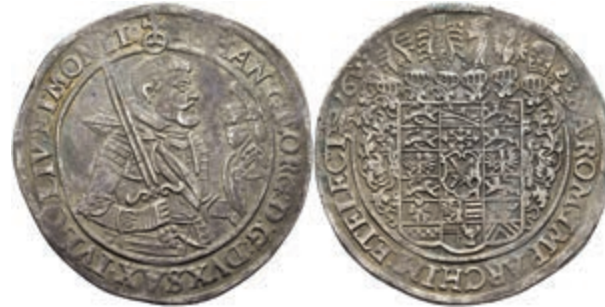
113 Taler, 1623, Johann Georg I., Dav. 7601, Kahnt 156, Schnee 818, kl. Rf., ss. (Abbildung auf 96% verkleinert) 150,—