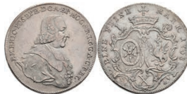
5354 Taler, 1768, Emmerich Joseph von Breitbach-Bürresheim, Dav. 2426, ss+. 180,—