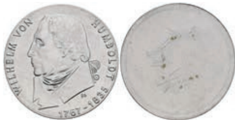
342 20 Mark, 1967, Wilhelm von Humboldt, einseitiger Aluminiumabschlag der Vorderseite, kl. Kr., Kr. auf Rückseite, vz-st. Auflage nur 400 Stück. J. 1520A. 50,—