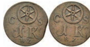
5468 Brückenzollmarke zu 1 Kreuzer, Kupfer, o.J. (18./19. Jh.). Av: Rad zwischen "C - S", darunter 1. Kr. / B:Z:". Rev: Gleich Avers. Slg. Walther 790, ss. 30,—