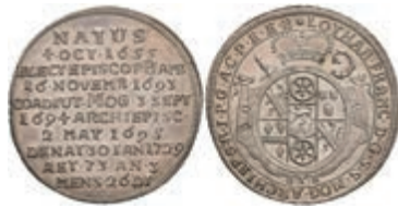
5318 1/8 Taler, 1729, Lothar Franz von Schönborn, auf seinen Tod, Slg. Walther 475, vz-st. 300,—