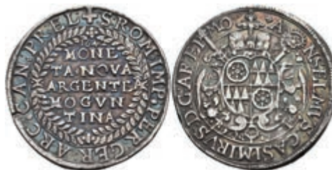
5241 1/2 Taler, 1642, Anselm Casimir von Umstadt, Slg. Walther 277, schöne Patina, ss-vz. Sehr selten! 1500,—