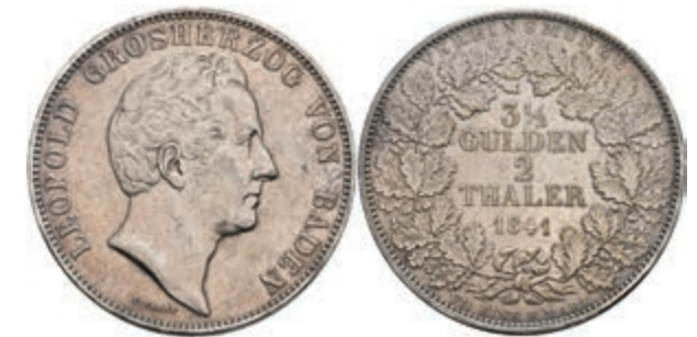
137 Doppeltaler, 1841, Carl Leopold Friedrich, AKS 88, J. 57, ss. 150,—