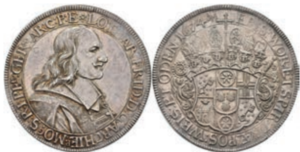
5259 Taler, 1674, Lothar Friedrich von Metternich-Burscheid, Dav. 5560, schöne Patina, vz. Sehr selten! Exemplar der Sammlung R. Walther. Los 346 der 275. Auktion. Dr. Busso Peus, Frankfurt a.M., 1971. (Abbildung auf 96% verkleinert) 5000,—