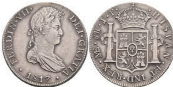
457 8 Reales, 1817, Ferdinand VII., Lima, JP, KM 117.1, ss+. 130,—