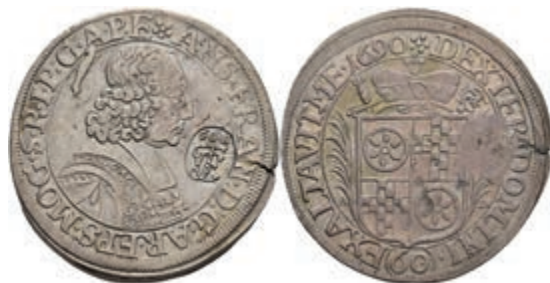
5292 Gulden (60 Kreuzer), 1690, Anselm Franz von Ingelheim, mit Gegenstempel, vgl. Dav. 658, vgl. Slg. Walther 417, Stempelfehler, ss. Sehr selten! 500,—