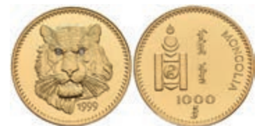
444 1000 Tugrik, Gold, 1999, Tiger, Fb. 43, mit Zertifikat, PP. Auflage nur 1000 Stück. 200,—

443 2500 Tugrik 1995, Transsibirische Eisenbahn, 5 Unzen Silber, KM 102, in Kapsel (Randausbruch), leichte Patina, PP. 130,—