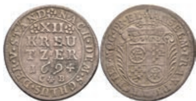
5308 12 Kreuzer, 1694, Anselm Franz von Ingelheim, Slg. Walther 436, kl. Schrötlingsfehler, ss. 50,—