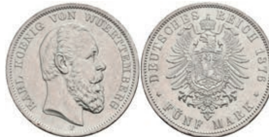
213 5 Mark, 1876, Karl, wz. Rf., vz. J. 173 250,—