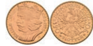
473 20 Zloty, Gold, 1925, Boleslaw I., Fb. 115, roter Fleck, vz. 500,—