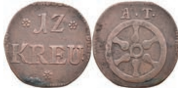
5484 Tormarke zu 12 Kreuzer, Kupfer, o.J. Av: 12 zwischen zwei Rosetten, darunter "KREU:", darunter Rosette. Rev: Rad, darüber "A. T.". Slg. P. A. -, Slg. Walther -, ss. 30,—