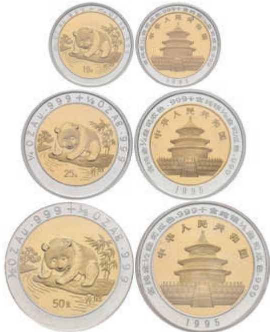
398 Bimetall Set zu 10, 25 und 50 Yuan, Gold/Silber, 1995, Panda. Jeweils in Kapsel verschleißt. Mit Zertifikat in Ausgabeschatulle. Auflage nur 2000 Sätze. 1500,—