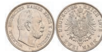
193 2 Mark, 1876, A, Wilhelm I., vz. J. 96 120,—