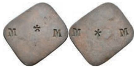
5465 Kupfermarke, o.J. Av: Oben links und unten rechts jeweils ein gepunztes "M", im Zentrum ein Stern. Rev: Gleich Avers. Slg. Walther -, ss. 50,—