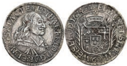
5258 Gulden (60 Kreuzer), 1674, Lothar Friedrich von Metternich-Burscheid, Dav. 648, Slg. Walther 348, kl. Schrötlingsfehler, ss. 150,—