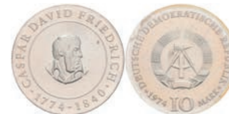
359 10 Mark, 1974, Caspar David Friedrich, in Kapsel, zweifach verplombt, PP. Auflage nur 100 Stück. J. 1553. 1500,—