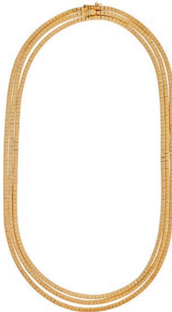
1264 Gold-Collier, Italien, Mitte der 70er Jahre, drei Reihen in verschiedener Länge, 14K GG, ca. 41,5g, dreifach punziert, L. ca. 42-44cm, in gutem Erhaltungszustand. (Abbildung auf 80% verkleinert) 1550,—