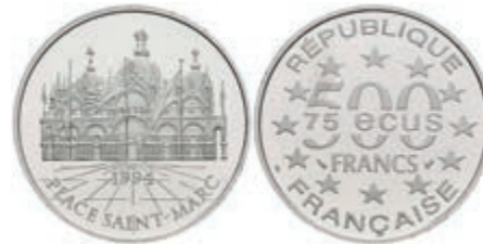
413 500 Francs, Platin, 1994, Markusdom in Venedig, mit Zertifikat in Ausgabeschatulle, leicht angelaufen, PP. 500,—