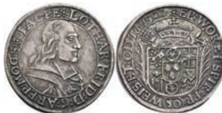
5261 1/2 Gulden (30 Kreuzer), 1675, Lothar Friedrich von Metternich-Burscheid, Slg. Walther 350, ss 200,—