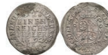
5302 1/12 Taler, 1692, Anselm Franz von Ingelheim, Slg. Walther 457, etwas Belag, ss+. 100,—