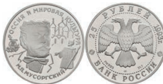
545 25 Rubel, Palladium, 1993, M. Mussorgski, Parchimowicz 1409, kl. Fleck, ohne Kapsel, PP. 1800,—