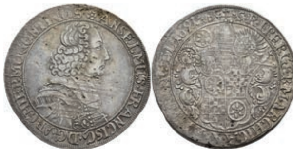
5299 Taler, 1691, Anselm Franz von Ingelheim, Dav. 5570, Slg. Walther -, Schrötlingsfehler, ss. (Abbildung auf 96% verkleinert) 1500,—