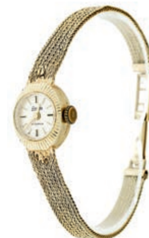
1334 Art Deco zierliche Damenarmbanduhr "ISOMA", 17 Jewels. Anfang des 20. Jh. 585er Gelbgold/14K, gestempelt. Länge mit Faltschnalle ca. 17,0 cm. Durchmesser der Uhr ca. 13,9x 15,7mm, ca. 12,15 g, Armband mit Beschädigung, nicht gangfähig. 180,—