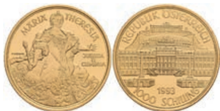
455 1000 Schilling, Gold, 1993, Schloss Schönbrunn - Maria Theresia, Fb. 918, in Originalschatulle mit Zertifikat, in Kapsel, PP. 600,—