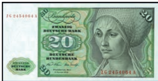
940 20 Deutsche Mark, 2.1.1970, Austauschnote zu Serie ZG/A, Ro. 271c.. Erh. I. (Abbildung auf 50% verkleinert) 300,—