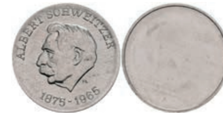
360 10 Mark, 1975, Albert Schweitzer, einseitiger Aluminiumabschlag der Vorderseite, st. Auflage nur 306 Stück. J. 1554A. 50,—