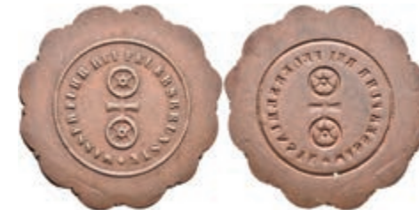
5503 Einseitige Kupfermarke, o.J. Av: Doppelrad, darum Umschrift. Slg. Walther -, ss. 50,—