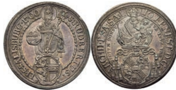
132 Taler, 1700, Johann Ernst Graf von Thurn und Hohenstein, Zöttl 2173, Probszt 1806, Dav. 3510, ss-vz. 150,—