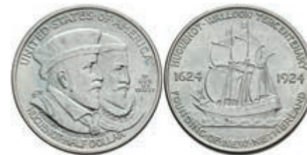
600 1/2 Dollar, 1924, Hugueno-Walloon, KM 154, leichter Grünspan, vz. 50,—