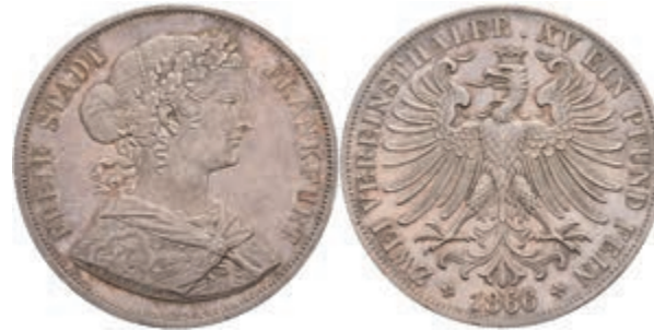
165 Doppeltaler, 1866, AKS 4, vz-st. 100,—