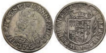
5247 1/2 Gulden (30 Kreuzer), 1671, Johann Philipp von Schönborn, Slg. Walther 327, ss. 200,—