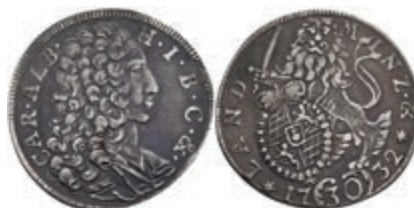
64 30 Kreuzer (1/2 Gulden), 1732, Karl Albert, Hahn 246a, Patina, ss. 30,—