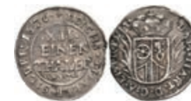
5264 1/12 Taler, 1676, Damian Hartard von der Leyen, Slg. P. A. -, Slg. Walther -, unediert?, Randfehler, ss. 100,—