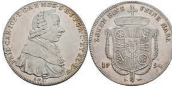
5373 Taler, 1794, Friedrich Karl Joseph von Erthal, Dav. 2429, Slg. Walther 647, vz+. 350,—