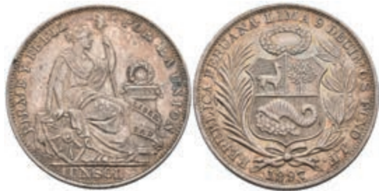
467 Sol, 1897, Lima, JF, KM 196.26, Randfehler, vz. 80,—