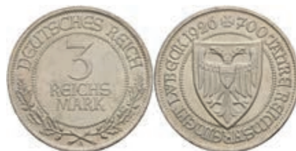
266 3 Reichsmark, 1926, Lübeck, wz. Rf., vz. J. 323 70,—