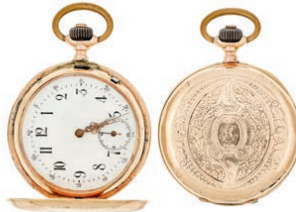
1310 Taschenuhr "Labor" um 1910 (Dm 50mm, 12mm), Schweiz. 585er Gold mehrfach punziert, Kronenaufzug, Seriennummer: 11584, Breguetspirale Zifferblatt: Email, arabische Ziffern, kleine Sekunde. kl. Dellen und Bearbeitungsspur am Gehäuse seitlich des Deckels, innen leicht berieben. (Abbildung auf 78% verkleinert) 800,—