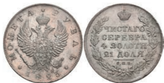
499 Rubel, 1823, Alexander I., St. Petersburg, Bitkin 137, vz. 200,—