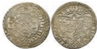
5200 Weißpfennig, o.J. (1461-1475), Adolf II. von Nassau, Slg. P. A. 184 var., ss. 50,—