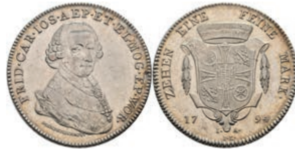
5374 Taler, 1794, Friedrich Karl Joseph von Erthal, Dav. 2430, Slg. Walther 648, ss-vz. 350,—