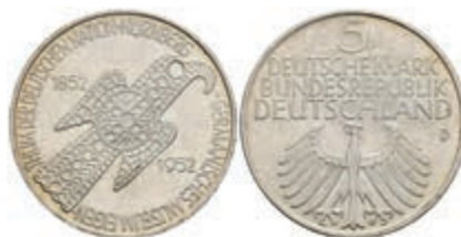
324 5 Mark, 1952, Germanisches Museum, vz. J. 388 200,—