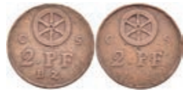
5466 Brückenmarke zu 2 Kreuzer, Kupfer, o.J. Av: Rad zwischen "C - S", darunter "2 Kr. / B.Z.". Rev: Gleich Avers. Slg. Walther 791, ss. 50,—