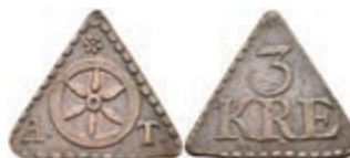
5500 Tormarke, Kupfer, o.J. Av: Rad zwischen "A. - T-", darüber Rosette. Rev: "3 / KRE". Slg. Walther -, ss. 80,—