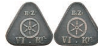
5490 Brückenzollmarke zu 6 Kreuzer, Kupfer, o.J. Av: Rad darüber "B: Z:", darunter "VI. Kr.". Rev: Gleich Avers. Slg. Walther -, ss. 50,—