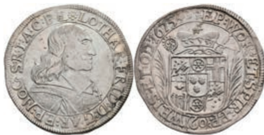
5263 Gulden (60 Kreuzer), 1675, Lothar Friedrich von Metternich-Burscheid, Dav. 648, Slg. Walther 349, ss. 150,—