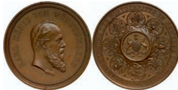
639 Württemberg, Karl, Bronzemedaille (Dm. ca. 60,10mm, ca. 94,22g), o.J., von K. Schwenzer und G. Schiller, Prämienmedaille zur Anerkennung des Fortschritts in Gewerbe und Handel. Av: Kopf nach rechts, darum Umschrift. Rev: Wappen, darum Ranken mit Gewerbesymbolen, in den Winkeln jeweils eine Biene, im Außenkranz Umschrift. Ebner 85, wz. Kr., kl. Rf., vz. (Abbildung auf 69% verkleinert) 160,—