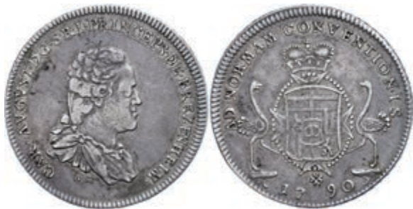
79 Taler, 1790, Karl August, Mannheim, Dav. 2055, ss. Selten! 1000,—