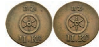
5473 Brückenzollmarke zu 2 Kreuzer, Kupfer, o.J. (18./19. Jh.). Av: Rad darüber "B:Z.", darunter 2. Kr. Rev: Gleich Avers. Slg. Walther 805, ss. 30,—