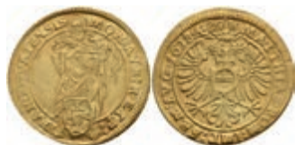
81 Goldgulden (3,15g), 1618, mit Titel Matthias, Joseph/Fellner 333, Fb. 960, etwas rauer Schrötling, ss+. 700,—