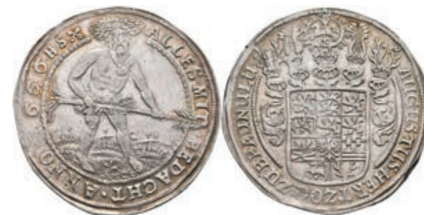
77 Taler, 1663, August der jüngere, Hausknechtstaler, Welter 822, Dav. 6341, kl. Rf., ss+. (Abbildung auf 93% verkleinert) 200,—