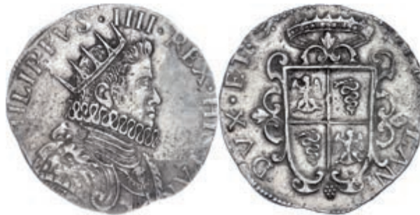
430 Mailand, Ducaton, 1630, Filippo IV., Dav. 4001, vz. 750,—