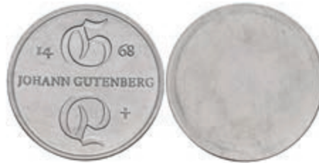
345 10 Mark, 1968, Johannes Gutenberg, einseitiger Aluminiumabschlag der Vorderseite, Kr. auf Rückseite, st. Auflage nur 300 Stück. J. 1523A. 50,—