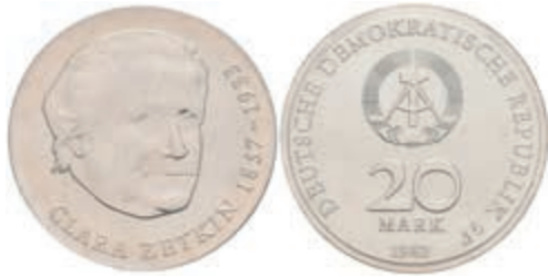
364 20 Mark, 1982, Clara Zetkin, Motivprobe, Nr. 35, in Kapsel verplombt, mit Zertifikat, st. Sehr selten, Auflage nur 90 Stück. J. 1587P. 4500,—