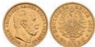
245 20 Mark, 1876, A, Wilhelm I., kl. Rf., ss-vz. J. 246 300,—