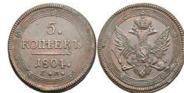
497 5 Kopeken, 1804, Alexander I., Ekaterinburg, Bitkin 290, ss-vz. (Abbildung auf 95% verkleinert) 50,—

Alle Einzellose und Zertifikate/Gutachten sind unter www.rhenumis.de farbig abgebildet! Dort sind auch 271 weitere Lose zu finden, die nicht im gedruckten Katalog, sondern nur im Internet zu finden sind!