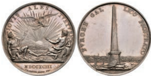
5457 Silbermedaille (Dm. ca. 56mm, ca. 56,31g), 1793, von F. H. Krüger, auf die Rückeroberung der Stadt. Av: Obelisk, im Hintergrund Stadtansicht. Rev: Doppeladler über aufgehender Sonne, zu den Seiten die beiden Flussgötter Moenus und Rhenus. Slg. P. A. 857, Slg. Walther 759, Kratzer, vz-st. (Abbildung auf 74% verkleinert) 300,—