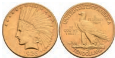
602 10 Dollars, Gold, 1926, Philadelphia, Indian Head, Fb. 165, ss-vz. 700,—