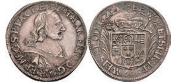
5255 Gulden (60 Kreuzer), 1673, Lothar Friedrich von Metternich-Burscheid, Dav. 649, Slg. Walther 342, ss-vz. 200,—