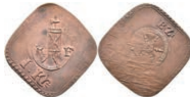
5498 Kupfermarke, o.J. Av: Fascis zwischen "R - F" auf Rad, darunter "1. Kr.". Rev: Rad, darüber "B: Z.". Überprägungsspuren. Slg. Walther -, ss. 50,—