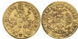
43 Dukat (3,59g), 1593, Rudolph II., Prag, Fb. 85, etwas wellig, Randfehler/Abschliff, ss. 2200,—