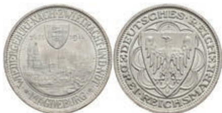
305 3 Reichsmark, 1931, Magdeburg, vz-st. J. 347 120,—