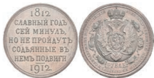
527 Rubel, 1912, Nikolaus II., St. Petersburg, auf den Sieg über Napoleon, Bitkin 334, kl. Rf., Kratzer und wz. Druckstelle, vz. 1000,—