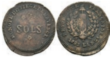
5368 2 Sols (6,12g), 1793, geprägt unter französischer Belagerung, Brause/Mansfeld Tf. 18, Nr. 12, Slg. P. A. 863, Slg. Walther 751, ss. 30,—