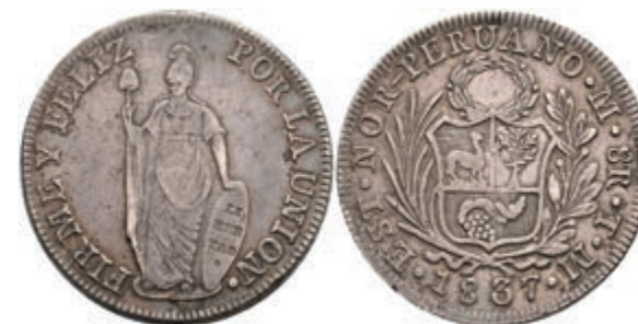
462 Nord Peru, 8 Reales, 1837, Lima, TM, KM 155, Hsp., ss. 60,—