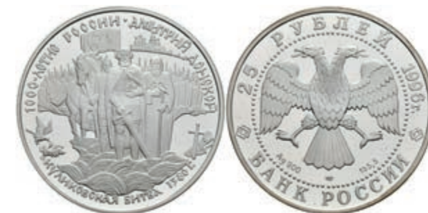
555 25 Rubel, 1996, Schlacht auf dem Schnepfenfeld, 5 Unzen Silber, Parchimowicz 1426, in Kapsel, PP. (Abbildung auf 68% verkleinert) 150,—