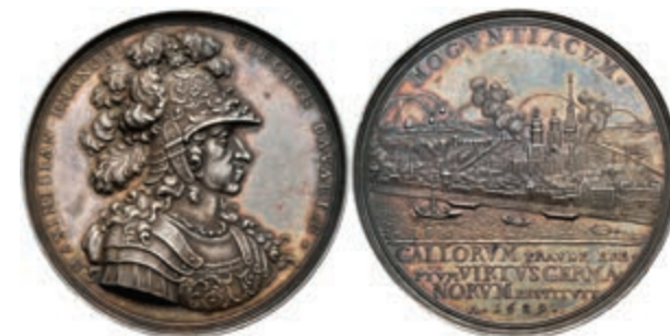
5408 Silbermedaille (Dm. ca. 49,50mm, ca. 44,61g), 1689, von P. H. Müller, auf die Einnahme der Stadt. Av: Brustbild Maximilian II. Emanuel nach rechts, darum Umschrift. Rev: Ansicht der unter Beschuss stehenden Stadt, im Abschnitt darunter 4 Zeilen Schrift. Randschrift. Slg. P. A. 851, Slg. Walther -, wz. Rf., schöne Patina, vz. (Abbildung auf 85% verkleinert) 1500,—