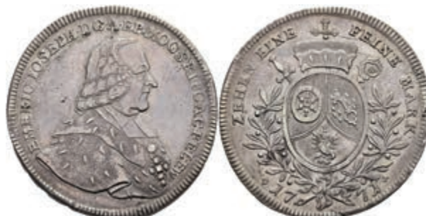
5359 Taler, 1771, Emmerich Joseph von Breitbach-Bürresheim, Dav. 2428, Slg. Walther 621, kl. Schrötlingsfehler am Rand, schöne Patina, ss-vz. 300,—