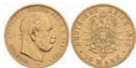
244 10 Mark, 1880, A, Wilhelm I., kl. Rf., ss. J. 245. 150,—