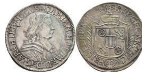
5266 Gulden (60 Kreuzer), 1676, Damian Hartard von der Leyen, Dav. 655, Slg. Walther 358, ss-vz. 200,—