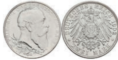
175 2 Mark, 1902, Friedrich I., zum Regierungsjubiläum, f. st. J. 30 40,—