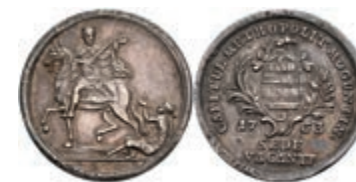
5341 1/8 Schautaler, 1763, Sedisvakanz, Slg. P. A. 709, Slg. Walther 592, kl. Rf., f. vz. 350,—