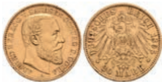
259 20 Mark, 1895, Alfred, kl. Rf., ss-vz. J. 272 2500,—