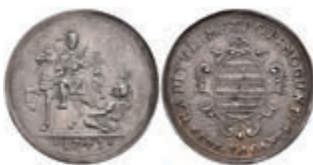
5333 1/8 Schautaler, 1743, Sedisvakanz, Slg. Walther 511, Slg. P. A. 670, schöne Patina, vz. Sehr selten! 500,—