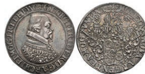
5232 Taler, 1629, Johann Schweickhardt von Kronberg, Dav. 5543, Slg. Walther 241, schöne Patina, ss-vz. Sehr selten! 2000,—