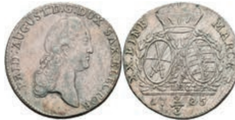
123 2/3 Taler, 1785, Friedrich August III., IEC, Kahnt 1105, Justierspuren, ss-vz. 70,—