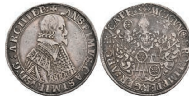
5233 Taler, 1636, Anselm Casimir von Umstadt, Dav. 5548, ss. (Abbildung auf 97% verkleinert) 350,—