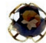
1252 Repräsentativer Damenfingerring mit einem Besatz aus einem facettierten wohl Rauchquarz, nicht getestet, mit einem Durchmesser von ca. 1,6 cm, in dekorativ ausgeführter, geschwungener Vier-Krappenfassung. 2. Hälfte 20. Jh. 585er GG, gestempelt. Ringgröße: Deutschland: 51; USA/Kanada: 5.6; Großbritannien: L; Frankreich: 12. Ca. 6,20 gr. 130,—