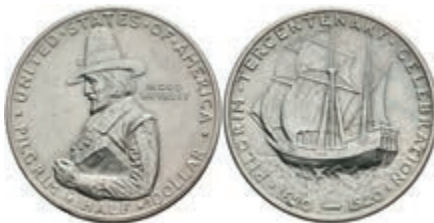
597 1/2 Dollar, 1920, Pilgrim Tercentenary, KM 147.1, vz. 50,—