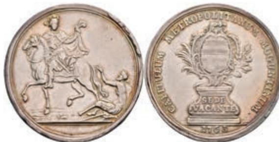
5338 1/2 Schautaler, 1763, Sedisvakanz, Slg. P. A. 707, Slg. Walther 590, ss. 200,—