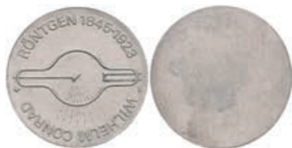
351 5 Mark, 1970, Wilhelm Conrad Röntgen, einseitiger Aluminiumabschlag der Vorderseite, st. Auflage nur 350 Stück. J. 1530A. 50,—