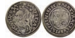
5209 Schilling, 1495, Berthold von Henneberg, Slg. P. A. -, Slg. Walther 167, s-ss. Sehr selten! 350,—