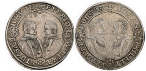
125 Taler, 160(?)?, Johann Philipp und seine drei Brüder, Dav. 7361, Schnee 266, ss. 150,—