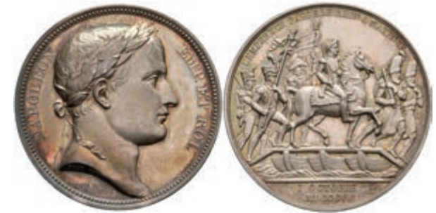
5461 Frankreich, Napoleon, Silbermedaille (Dm. ca. 40,60mm, ca. 38,77g), 1806, von J. P. Droz, auf die Rheinüberquerung Napoleons bei Mainz. Av: Kopf nach rechts, darum Umschrift. Rev: Darstellung der Rheinüberquerung. Bramsen 536, vgl. Slg. Julius 1591, kl. Punze, leicht berieben, vz-st. 250,—