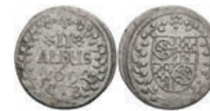
5304 2 Albus, 1692, Anselm Franz von Ingelheim, Slg. Walther 423, ss. 50,—