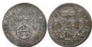
5283 1/12 Taler, 1689, Anselm Franz von Ingelheim, Slg. Walther 447, ss 120,—