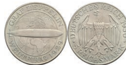
299 5 Reichsmark, 1930, F, Zeppelin, f. st. J. 343 160,—