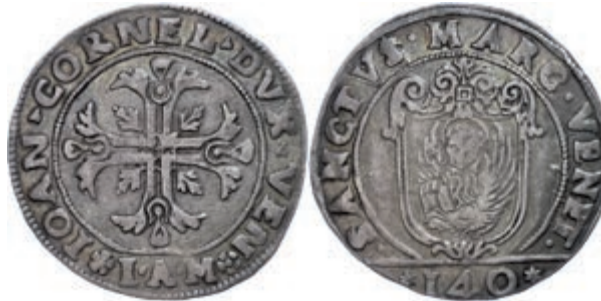
429 Venedig, Scudo, o.J. (1624-1629), Giovanni I. Corner, IAM, Dav. 4244, schöne Patina, ss. 250,—