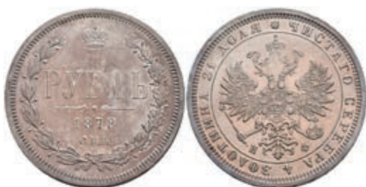
512 Rubel, 1878, Alexander II., St. Petersburg, Bitkin 92, kl. Rf., kl. Schrötlingfehler, vz. 100,—