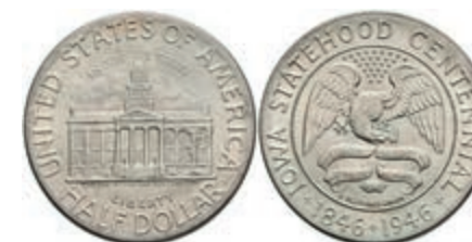
611 1/2 Dollar, 1946, Iowa, KM 197, minimaler Grünspan, vz. Kr., vz-st. 50,—