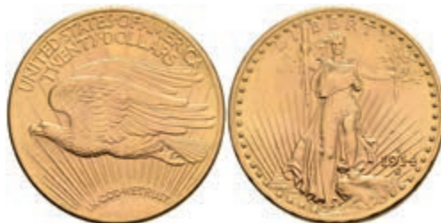
595 20 Dollars Gold, 1914, Double Eagle, Liberty Standing, Mzz D Denver, Fb. 187, kl. Kr., vz. 1200,—