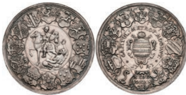
5431 Silbermedaille (Dm. ca. 47mm, ca. 34,24g), 1743, von W. Schäfer, Sedisvakanz. Av: St. Martin zu Pferd teilt den Mantel mit einem Bettler, im Außenkranz 12 Wappen. Rev: Wappen in Kartusche, darum Umschrift, im Außenkranz 11 Wappen. Slg. Walther 508, Slg. P. A. 667, kl. Rf., f. vz. (Abbildung auf 89% verkleinert) 700,—