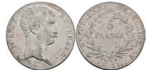
406 5 Francs, AN 13 (1804/1805), Napoleon I., Paris, Dav. 83, Gadoury 580, ss+. 150,—