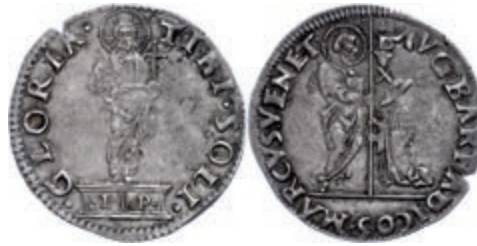
428 Venedig, Mocenigo (Lira), o.J. (1486-1501), Agostino Barbarigo, IP, Randfehler, ss-vz. 200,—