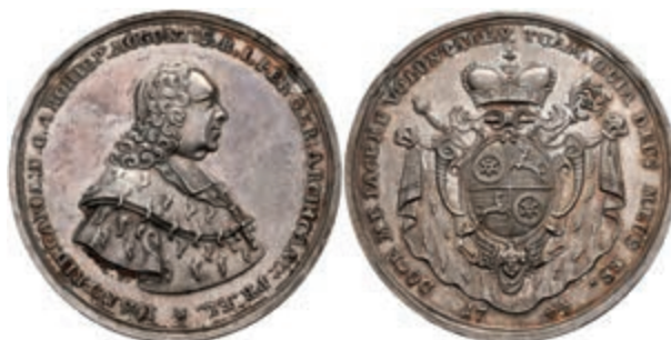
5432 Johann Friedrich Karl Graf von Ostein, Silbermedaille (Dm. ca. 51,60mm, ca. 43,93g), 1744, von C. Schild, auf seinen Regierungsantritt. Av: Brustbild nach rechts, darum Umschrift. Rev: Wappen mit Kurhut, Schwertern und Hermelinmantel, darum Umschrift. Slg. P. A. 673, Slg. Walther 515, Schröttingsfehler am Rand, vz-st. (Abbildung auf 80% verkleinert) 2000,—