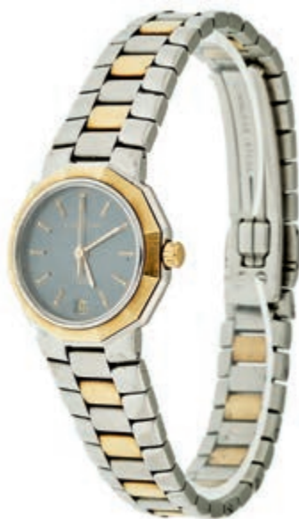
1336 Damen Armanduhr "Baume & Mercier" Modell Riviera 1989, Ser. Nr. 1468783, Stahl/Gold flaches Gehäuse, schwarzes Zifferblatt, Sekundenanzeiger und Datum analog Quarzwerk, verdeckter Schließe. Mit internationale Garantiekarte, orig. Gebrauchsanweisung und Kaufbeleg von 31.06.1989. Leichte Gebrauchsspuren, Deckel etw. zerkratzt, revisionsbedürftig. 1000,—