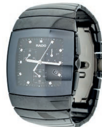
1329 Rado Diastar Sintra Chronograph Herren Armbanduhr. Ca. 35mm, Keramik, Rado Quarz, Ref.-Nr.: 538.0477.3. Schwarzes Ziffernblatt, Zeiger und Stunden mit Leuchtmasse, Datumsanzeige, 3 Totalisatoren für Sekunde, 1/10 Sekunde, Minute. Guter Zustand. Schwarzes Rado Keramik Armband mit Original Rado Titan Faltschnalle. 700,—