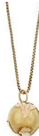
1265 Goldkette mit Anhänger Weltkugel, 585 Gelbgold, Kette mit Meisterpunze „Friedrich Binder Mönshheim“ (8,26g), Anhänger Dm 19,6mm mit Meisterpunze „MEP“ (6,58g). 420,—