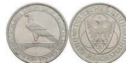
302 3 Reichsmark, 1930, A, Rheinlandräumung, wz. Rf., vz-st. J. 345 30,—