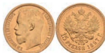
518 15 Rubel, Gold, 1897, Nikolaus II., Fb. 177, kl. Kratzer, kl. Rf., ss-vz. 700,—