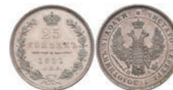
510 25 Kopeken, 1851, Nikolaus I., St. Petersburg, Bitkin 302, vz. 70,—

Alle Einzellose und Zertifikate/Gutachten sind unter www.rhenumis.de farbig abgebildet!