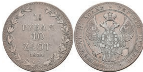
470 1 1/2 Rubel (10 Zloty), 1836, Nikolaus I., Warschau, Bitkin 1132, kl. Rf., s-ss. 150,—