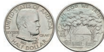
599 1/2 Dollar, 1922, Grant Memorial, KM 151.1, etwas Grünspan, vz. 50,—