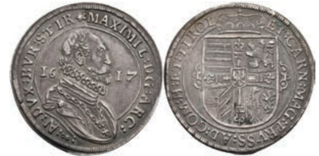
45 Taler, 1617, Maximilian III., Hall, Voglhuber 122/XII Var., kl. Zainende, ss. 200,—