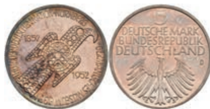
322 5 Mark, 1952, Germanisches Museum, Patina, wz. Kr., PP. J. 388. 1000,—