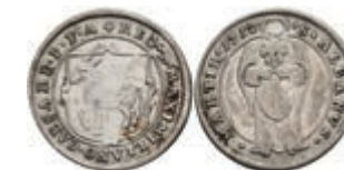
5315 Ritterstift St. Albern, Silberabschlag vom Goldgulden 1712, Slg. P. A.-, Slg. Walther -, ss. Selten! 300,—