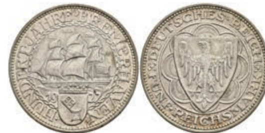
269 5 Reichsmark, 1927, Bremerhaven, kl. Rf., ss-vz. J. 325 180,—