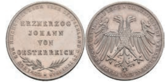
156 Doppelgulden, 1848, Erzherzog Johann von Österreich, AKS 39, J. 46, kleine Kratzer, vz. 100,—