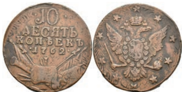
488 10 Kopeken, 1762, Peter III., Bitkin 17, Randfehler, s-ss. (Abbildung auf 96% verkleinert) 200,—