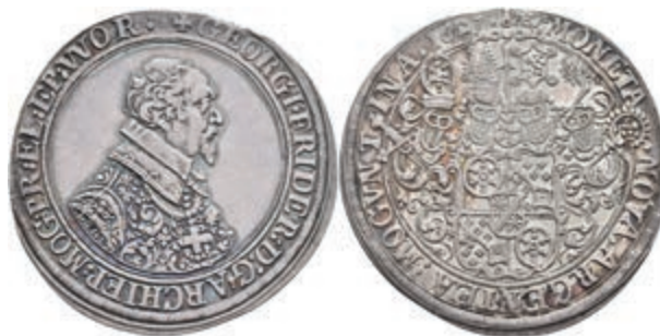
5230 Taler, 1627, Georg Friedrich von Greiffenklau, Dav. 5540, Slg. Walther 236, schöne Patina, ss-vz. Prachtexemplar! 2000,—