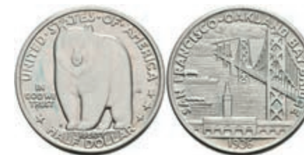
610 1/2 Dollar, 1936, San Francisco, KM 174, leichter Grünspan, vz-st. 70,—