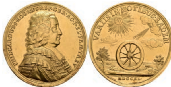
622 Mainz, Philipp Karl von Eitz-Kempenich, Goldmedaille (Dm. ca. 42mm, ca. 34,76g), 1740, von Becker. Av: Brustbild nach rechts, darum Umschrift. Rev: Das Mainzer Rad in einer Landschaft, darüber strahlende Sonne und Wolke, darum "VARIIS . IN . MATIBUS . EADEM". Slg. P. A. 662, Slg. Belli 1134, kl. Kratzer sowie Randfehler und Feilspuren, ss-vz. Sehr selten! (Abbildung auf 97% verkleinert) 5000,—

617 Lot von unterschiedlichen Ronden (1 Pfg bis 10 Mark BRD), vier ausgestanzte Zinkplatten und unterschiedliche Vorprägungen (Kaiserreich, BRD und DDR). Erhaltung unterschiedlich, meist zaponiert. (Abbildungen siehe Onlinekatalog) 300,—