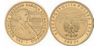
476 200 Zloty, Gold, 2007, 125. Geburtstag von Karol Szymanowski, ohne Kapsel, PP. 600,—