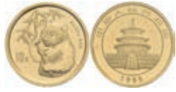
397 10 Yuan, 1995, Panda, large date, KM 716, verschleißt, fleckig, st. 200,—