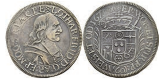
5254 Gulden (60 Kreuzer), 1673, Lothar Friedrich von Metternich-Burscheid, Dav. 648, Slg. Walther 341, ss. 200,—