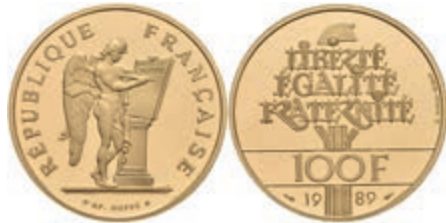
409 100 Francs, Gold, 1989, mit Zertifikat und Original-Etui, Auflage 20.000 Ex., PP. 750,—