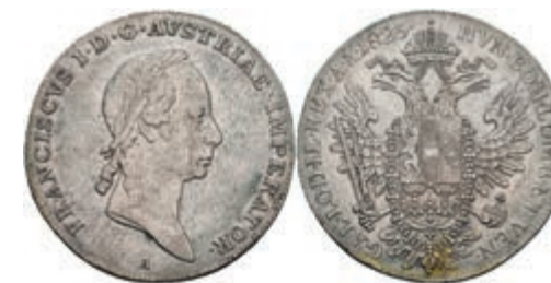
448 1/2 Taler, 1825, Franz I., Wien, J. 197, Reste von Zaponlack, ss-vz. 80,—