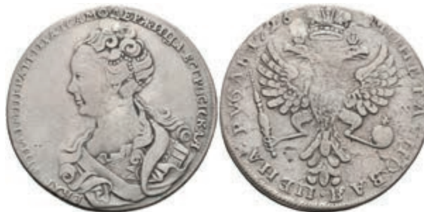
481 Rubel, 1726, Katharina I., Moskau, roter Münzhof, Bitkin 24, Dav. 1664, gestopftes Loch, kl. Schröttingsfehler, ss. (Abbildung auf 96% verkleinert) 150,—