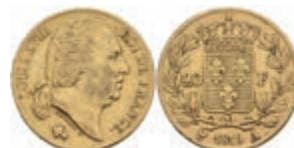
945 20 Francs, Gold, 1819, Louis XVIII., A (Paris), Fb. 538, ss. 280,—