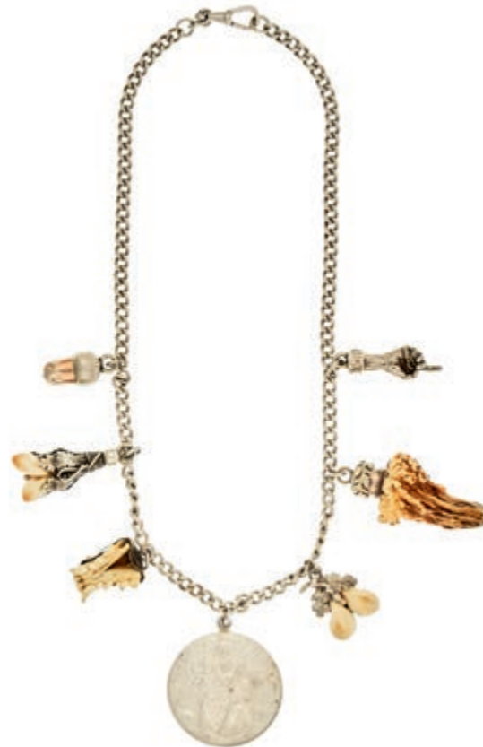
757 Trachten Set, Collier und Brosche Charivari, Silber, Collier mit 6 Anhänger und Nachprägung der Silbermünze Bayern "Patrona Bavariae", teilweise mit Jagdtrophäe, Länge 39 cm, 69,6g. Brosche aus 800er Silber, ältere Arbeit,