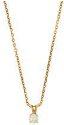
559 Diamant Anhänger an feine Panzerkette, Gold 14 K, Diamant in runder Brillant-Schliff 0,35 ct, CW/VS/SI, Gesamtgewicht 3,5 g, mit Juwelier Zertifikat. (Abbildungen siehe Onlinekatalog) 900,—