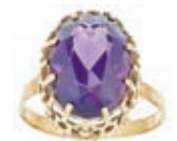
584 Opulenter Amethyst Ring, Deutschland um 1950, 333 Gelbgold gestempelt, weiterhin mit Meisterpunze "Fisch" und die Zahl 6, 5,20g, Steingröße ca. 16x11,8 mm, Innendurchmesser 20,9mm, leichte Gebrauchspuren. 150,—