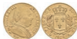
943 20 Francs, Gold, 1814, Louis XVIII., A (Paris), Fb. 525, Gadoury 1026, kl. Rf., ss. 280,—