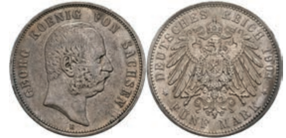
873 5 Mark, 1904, Georg, kl. Rf., ss-vz, J. 130. 50,—