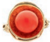
581 Korallen Ring, 585 Gelbgold, 4,7g, RW 57. (Abbildungen siehe Onlinekatalog) 180,—