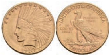
1050 10 Dollars, Gold, 1910, Denver, Indian Head, Fb. 168, ss. 650,—