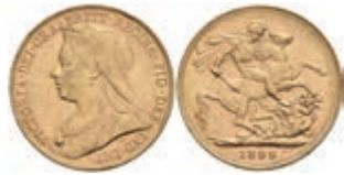
955 Sovereign, 1899, Victoria, Fb. 396, kl. Rf. und Kratzer, vz. 300,—