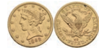
1044 5 Dollars, Gold, 1892, Carson City, Fb. 146, kl. Rf., ss. 400,—