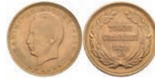
1035 100 Kurush, Gold, 1946 (1923/23), İsmet İnönü, Fb. 215, vz-st. 300,—