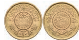
1026 Pound, 1950, AH 1370, Fb. 1, f. st. 300,—