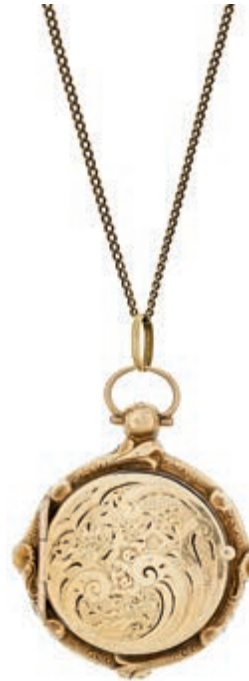
701 Fotomedailion mit Kette, Mitte des 19. Jh., 8 K Gelbgold (nicht gest.), Gewicht des Medaillons 11,9g, moderne Panzer-Kette 2,8g, Durchmesser mit Krone 33,1x 41,2mm, sehr gute Erhaltung. 270,—