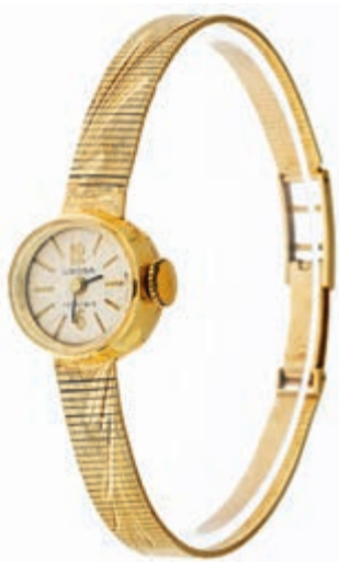
784 Savonette mit separater Sekunde. Um 1900. Es handelt sich um eine Uhr, die versucht vorzugeben sie sei eine Breguet. Vorder- und Rückdeckel mit Eichhörnchenpunze. Rückdeckel bez. "K14". Vorderdeckel bez. "K". Säuretest 585er RG, positiv. Dm. ca. 39 mm. Ca. 320,—