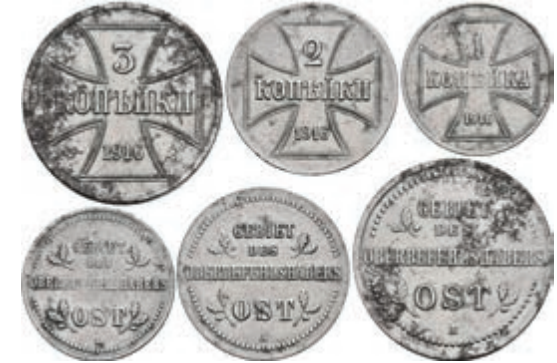
913 Besetzte Gebiete (1. Weltkrieg), Gebiet des Oberbefehlshaber Ost, 1, 2, 3 Kopeken 1916 Mzz A N 601-603, leicht korrodiert, vz-st. 35,—