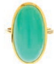
587 Ring Chrysopras, 750 Gelbgold, ovaler Chrysopras möglich ca. 19 ct, 11,3g, RW EU 57, gemarkt. (Abbildungen siehe Onlinekatalog) 250,—