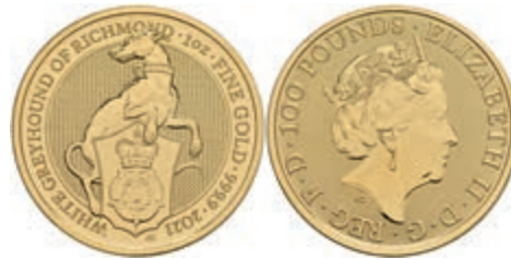
959 100 Pounds, Gold, 2021, The Greyhound of Richmond, Serie "The Queens Beasts", ohne Kapsel, st. 1400,—