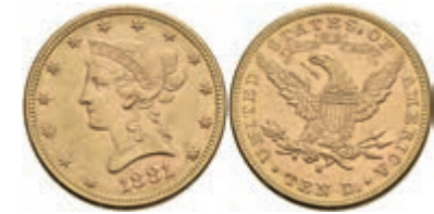
1042 10 Dollars, Gold, 1881, Liberty Head, San Francisco, Fb. 160, kl. Kr., f. vz. 700,—