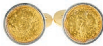
754 Paar Manschettenknöpfe, Umarbeitung der Goldmedaille Apollo 11 - Moon 1969 GG, Fassung in WG 750, punziert Handarbeit "Schöne", ca 23,8x 19,2mm, ca. 16,9g. (Abbildungen siehe Onlinekatalog) 800,—