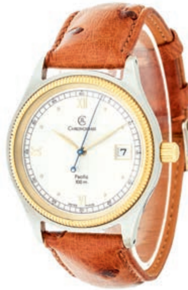
793 Chronoswiss Pacific Herren Armbanduhr. Ca. 38mm, Edelstahl, Mineralglas, Automatik, Ref.-Nr. CH 2814. Datumsanzeige, goldene Indizes, verbläuteter Sekundenanzeiger, weißes Ziffernblatt. Braunes Chronoswiss Lederarmband mit Dornschnelle. Sehr guter Zustand, voll funktionsfähig. 500,—