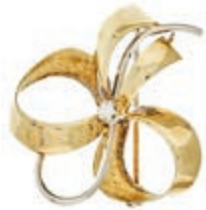
648 Schleifenbrosche mit Zirkonia, 585 Gelb- und Weißgold, 3,55g, gemarkt "EH11", Größe ca 2,7x 2,8cm. 180,—