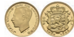
965 20 Francs, Gold, 1989, Jean, 150 Jahre Unabhängigkeit, 1/5 Oz, Fb. 12, in Kapsel, PP. 250,—