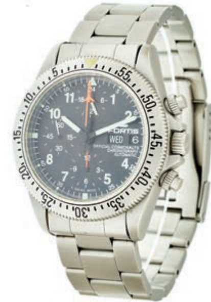
795 Fortis Cosmonauts Chronograph Herren Armbanduhr. Ca. 38mm, Edelstahl, Automatik, Re.-Nr.: 606.22.142. Saphirglas, Totalisatoren, Datumsanzeige, kleine Sekunde, Zeiger und Indizes fluoreszierend. Original Fortis Edelstahl Armband mit Faltschnelle und zusätzlichen Elementen, sowie Original Fortis Lederarmband in schwarz mit Dornschnelle. In Original-Verpackung, inklusive Bedienungsanleitung und Garantieschein. Sehr guter Zustand, voll funktionsfähig. 1200,—

ger und Indizes fluoreszierend. Sehr guter Zustand mit leichten Gebrauchsspuren. Original Ebel Kalbslederarmband in schwarz mit Dornschnelle. Funktionsfähig, mit Original Box, Zertifikaten, Bedienungsanleitung und Kaufbeleg. 1600,—