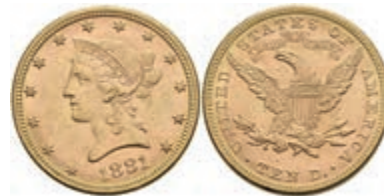
1040 10 Dollars, Gold, 1881, Liberty Head, Philadelphia, Fb. 158, kl. Kr., vz. 700,—