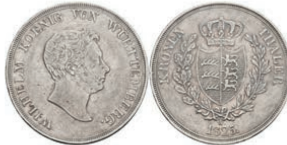
870 Taler, 1825, Wilhelm I., AKS 65, J. 55, ss. 80,—