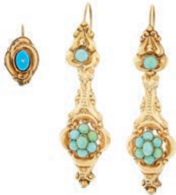
539 Paar äußerst dekorativer Biedermeierschaumgoldohrgehänge mit Besatz aus Türkisen. Um 1820. Unleserlich punziert. L. ca. 5,5 cm. Ca. 4,7 gr. Dazu ein einzelner Biedermeierohrerring mit blauem Besatz. L. ca. 1,6 cm. 140,—