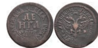
997 Denga 1702, Moskau, Peter I. 1682-1725. Bitkin1447, s-ss. 35,—