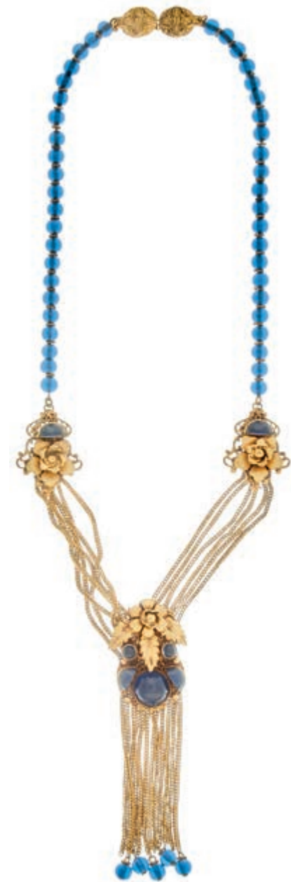
758 Trachtencollier mit blauen Glassteinen in Biedermeierstil, um 1950, vergoldet, 41,10g, Mantelverschluss, Halslänge ca. 28 cm, Goldschmiedearbeit, sehr gute Erhaltung. (Abbildung auf 63% verkleinert) 150,—