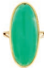
586 Ring Chrysopras, 750 Gelbgold, 11,1g, RW EU 59. (Abbildungen siehe Onlinekatalog) 250,—

Edelstein-Prüflabor Stuttgart "Edwin Hühne" von. 23.11.2018. (Abbildungen siehe Onlinekatalog) 3750,—