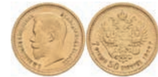
1008 7 1/2 Rubel, Gold, 1897, Nikolaus II., Fb. 178, kl. Rf., ss. 450,—