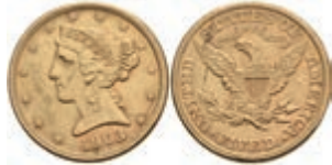
1048 5 Dollars, Gold, 1903, Liberty Head, Philadelphia, Fb. 143, kl. Rf., ss. 300,—