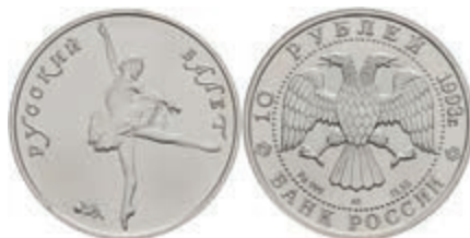
1024 10 Rubel, Palladium, 1993, Russisches Ballett, Parchimowicz 1352a, st. 800,—