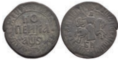
998 1 Kopeka 1706 (Kyrillisch), Moskau, Peter I 1682-1725, mit zwei Sterne, Bitkin 1807ff., s-ss. 50,—