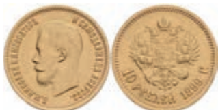
1015 10 Rubel, Gold, 1899, Nikolaus II., St. Petersburg, Fb. 179, kl. Rf., ss. 450,—