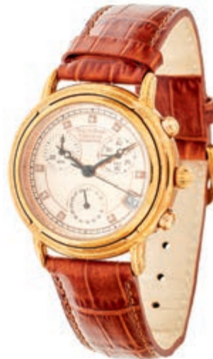
814 Universal Armbanduhr von "Krug-Baumen" Modell Principle mit 8 Diamanten, Gewölbtes Mineralglas, Breguetzeiger, Genähte braune Lederarmband mit Dornschnelle, Gehäusedicke 10 mm. Armband Länge 23cm, Wasserbeständig-

Goldmünzen ab 1800 sowie Goldbarren sind als Anlagegold ggf. umsatzsteuerfrei (auch für das Aufgeld), soweit der Zuschlagpreis inkl. Aufgeld und Losgebühr nicht höher als der Goldwert + 80% ist.