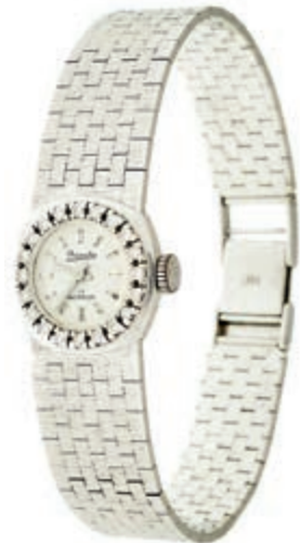
828 Diamantdamenuhr "Primato" 17 Incabloc, Lünette verziert mit 20 Brillanten, nach 1970, Armband und Gehäuse 14K/ 585 Weißgold, Milanese Armband, Länge: ca. 17,5 cm, ca. 38,1g, gehfähig. 1000,—