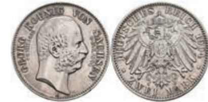
874 2 Mark, 1904, Georg, Auf seinen Tod, vz-st. J. 132 70,—