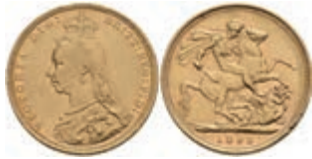
952 Sovereign, 1892, Victoria, Fb. 392, Rf., ss. 330,—