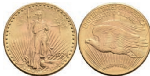
1055 20 Dollars, Gold, 1924, Philadelphia, Fb. 185, kl. Rf., vz+. 1400,—