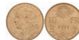
1027 10 Franken, Gold, 1912, Fb. 503, vz. 120,—