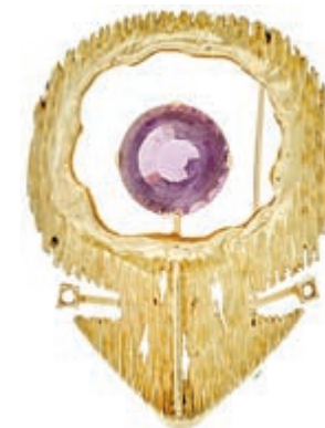
646 Brosche mit Amethyst, 585 Gelbgold, Stein rund facettiert 18,7 mm, Handarbeit, 5,67x 4,34cm, 22,36g. 600,—

Alle Einzellose und Zertifikate/Gutachten sind unter www.rhenumis.de farbig abgebildet!