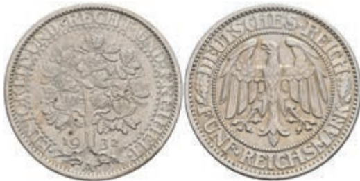
905 5 Reichsmark, 1932, A, Eichbaum, ss. J. 331. 70,—