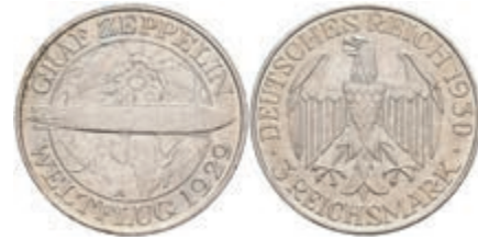
909 3 Reichsmark, 1930, A, Zeppelin, kl. Kr., kl. Rf., vz. J. 342. 50,—