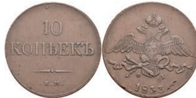
1003 10 Kopeken 1833, Ekaterinburg, Nikolaus I. 1825-1855, Bitkin 463, Schröttingsfehler, Rf, ss+. 75,—