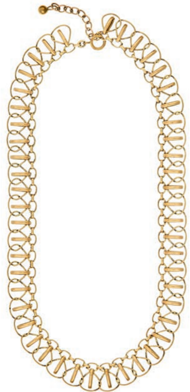
624 Draht Collier, 333 Gelbgold, 21,7g, Länge 40 cm, aus massiven Golddrähten gebogen und gewebt, feine Handarbeit. (Abbildungen siehe Onlinekatalog) (Abbildung auf 92% verkleinert) 390,—