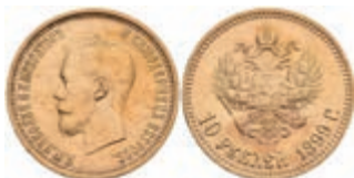
1014 10 Rubel, Gold, 1899, Nikolaus II., Fb. 179, kl. Rf., wz. Kr., vz. 450,—