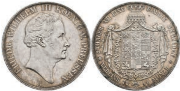
866 Doppeltaler, 1840, Friedrich Wilhelm III., AKS 9, J. 64, Randfehler, kl. Kr., ss-vz. 150,—