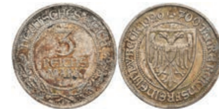
902 3 Reichsmark, 1926, Lübeck 700 Jahre Reichsfreiheit, ss-vz, Patina. J. 323 50,—