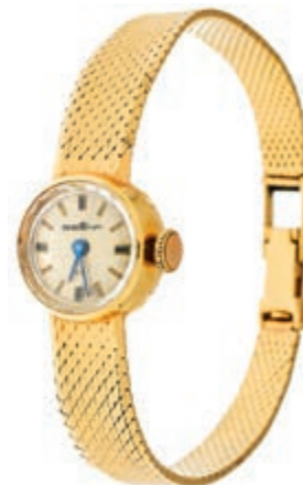
830 Zierliche Damenarmbanduhr der Firma Sigena. 1960er Jahre. Uhrengehäuse 750er GG, gestempelt. Uhrenband in abweichender Form gestempelt 750er GG, Säuretest positiv. Dm. ca. 13 mm. L. ca. 17,5 cm. Ca. 25,9 gr. Zifferblatt mit Altersspuren. 700,—