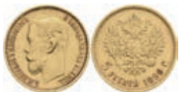
1017 5 Rubel, Gold, 1899, Nikolaus II., Fb. 180, kl. Rf., ss. 200,—