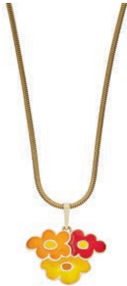
622 Anhänger mit Email Blumenmuster, 333 GG, Italien, Ende des 20. Jh., 22,5x 15,5mm, 2,84g mit Schlangen-Halskette 333 GG, punziert, L=42cm, 6,11g. 140,—

Goldmünzen ab 1800 sowie Goldbarren sind als Anlagegold ggf. umsatzsteuerfrei (auch für das Aufgeld), soweit der Zuschlagpreis inkl. Aufgeld und Losgebühr nicht höher als der Goldwert + 80% ist.