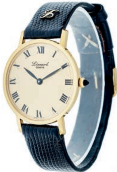
798 Herrenarmbanduhr "Leonard Geneve", Schweiz, Gehäuse Gold Double mit Edelstahldeckel, Gehäusenr. 10P-149 B, Durchmesser ca. 35 mm, Länge ca.

Goldmünzen ab 1800 sowie Goldbarren sind als Anlagegold ggf. umsatzsteuerfrei (auch für das Aufgeld), soweit der Zuschlagpreis inkl. Aufgeld und Losgebühr nicht höher als der Goldwert + 80% ist.