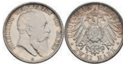
871 2 Mark, 1904, Friedrich I., wz. Kr., f. st. J. 32. 50,—