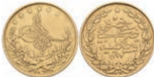
1033 100 Kurush, Gold, AH 1277/7, Abdülaziz, Fb. 127, kl. Rf., kl. Kr., ss. 280,—