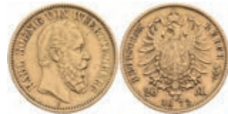
897 20 Mark, 1872, Karl, kl. Rf., ss. J. 290 300,—