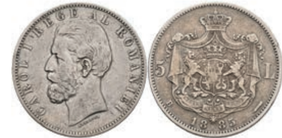
996 5 Lei, 1885, Karl I., Bukarest, Dav. 274, KM 17.1, Rf., ss. 100,—