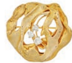
567 Designer Brillanten Brosche, 585 Gelbgold, 2,6x 2,9cm, 11,2g, 3 Brillanten von zus. 0,30ct. (Abbildungen siehe Onlinekatalog) 500,—