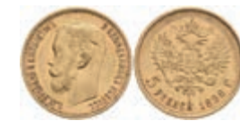
1012 5 Rubel, Gold, 1898, Nikolaus II., Fb. 180, kl. Rf., ss. 200,—