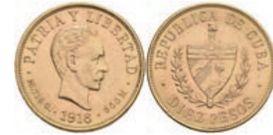
963 10 Pesos, Gold, 1916, Fb. 3, ss. 650,—