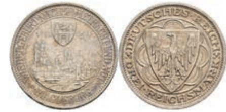
912 3 Reichsmark, 1931, Magdeburg, kl. Rf., vz. J. 347. 120,—