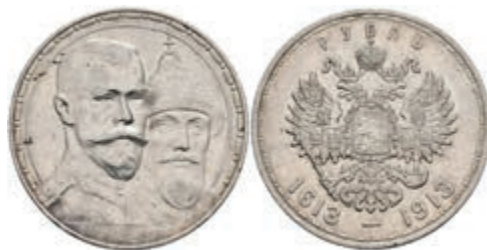
1020 Rubel, 1913, Nikolaus II., St. Petersburg, 300 Jahre Romanov Dynastie, Bitkin 336, kl. Rf., ss. 80,—