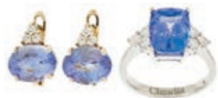
585 Prachtvoller Tanzanite Set aus Ring und Ohrringe: Damenring, 750 WG besetzt mit natürlichem Tanzanite in Cushion-Schliff von. Ca. 5 ct und sechs Brillanten von zus. ca. 0,5ct, Innengravur "Claudia", Ringweite 57, 6g und ein Paar Ohrringe, 585 GG, besetzt mit je drei Brillanten ca. 0,15 ct und einem natürlichen Tanzanite in Oval- Schliff zus. ca. 3,5ct, 3,49g. mit Original-Expertise von

Edelstein-Prüflabor Stuttgart "Edwin Hühne" von. 23.11.2018. (Abbildungen siehe Onlinekatalog) 3750,—