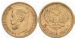
1013 5 Rubel, Gold, 1898, Nikolaus II., St. Petersburg, Fb. 180, kl. Rf., ss. 200,—