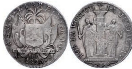
990 8 Reales, 1823, Lima, JP, KM 136, kl. Rf., Schrötlingsfehler, ss. 250,—