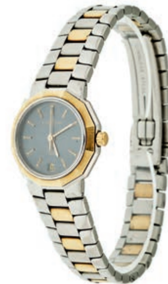
832 Damen Armbanduhr "Baume & Mercier" Modell Riviera 1989, Ser. Nr. 1468783, Stahl/Gold flaches Gehäuse, schwarzes Zifferblatt, Sekundenanzei-