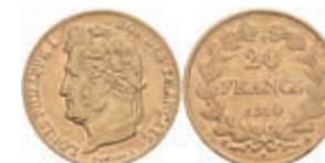
948 20 Francs, Gold, 1840, Louis Philippe I., A (Paris), Fb. 560, ss. 280,—