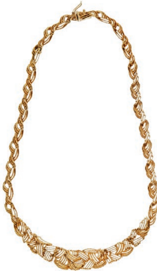
626 Gold-Collier, 585 GG, zweifache Punze, gegliederter Zopfmuster im Verlauf, Kastenschloss, 41,89g. (Abbildung auf 79% verkleinert) 1250,—