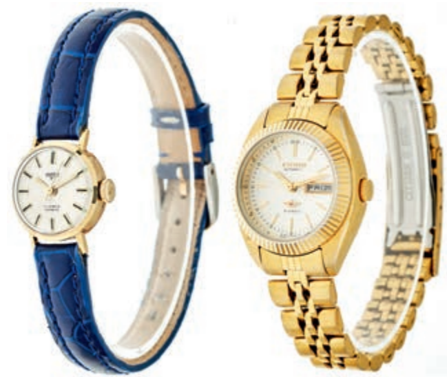
838 Zwei zierliche Damenarmbanduhren. Citizen Edelstahl, ca. 26mm, Automatik. Goldenes Gehäuse, weißes Ziffernblatt, goldene Indizes. Datumsanzeige, original Citizen Armband mit Faltschließe. Ankra, 14K, ca. 19mm, Automatik. Silbernes Ziffernblatt, Indizes fluoreszierend, 13,3g. Blaues Lederarmband mit Dornschnalle, voll funktionsfähig. (Abbildung auf 89% verkleinert) 200,—