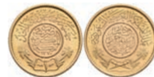
1025 Pound, 1950, AH 1370, Fb. 1, f. st. 300,—