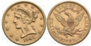
1047 5 Dollars, Gold, 1901, Liberty Head, San Francisco, Fb. 145, kl. Kr., kl. Rf., vz. 350,—