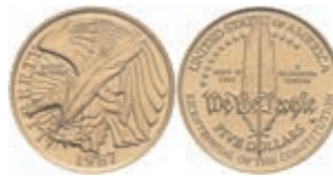
1056 5 Dollars, Gold, 1987, Verfassung, Fb. 198, in Kapsel, st. 300,—