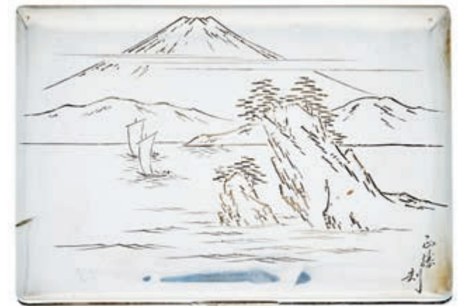
859 Zigaretenschachtel mit Holz, Japan ab 1950, 950 Sterling Silber punziert, mit Signatur, Landschaftsmotiv gehämmert, 12x 8x 3,5cm, ca. 180g, kl. Dellen.,