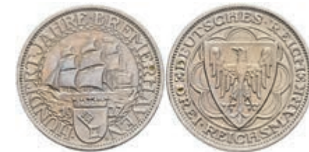
903 3 Reichsmark, 1927, Bremerhaven, kl. Rf., vz. J. 325. 100,—