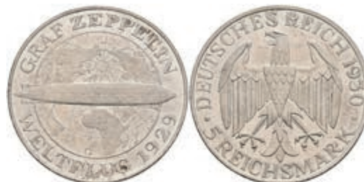
910 5 Reichsmark, 1930, G, Zeppelin, Kratzer, wz. Rf., vz. J. 343. 150,—