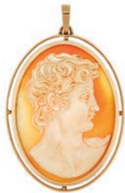
753 Ovale handgravierte Muschelkamee, klass. Herrenbildniss, 585 Rosegold, ca. 5,3x 3,4 cm, 13,35g. (Abbildungen siehe Onlinekatalog) 250,—