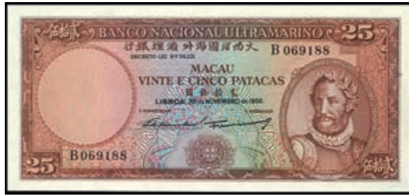
1255 Macau, portugiesisch, Banco Nacional Ultramarino, 25 Patacas, 20.11.1958. P-46a, mittlere Faltnlinie, Erh. II. (Abbildung auf 50% verkleinert) 100,—