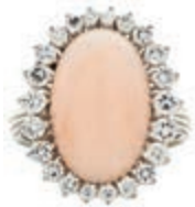
582 Korallen-Brillanten Ring, 585 Weißgold, ca. 9g. Engelhautskorallen Cabochon ca. 23ct umgeben von 22 Brillanten von zus. ca. 1ct/ W-VSI, RW EU 57, gemarkte hochwertige Handarbeit. 2600,—