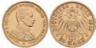
891 20 Mark, 1913, Wilhelm II. in Gardeuniform, kl. Rf., kl. Kr., ss-vz. J. 253. 300,—