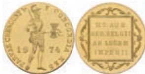
989 Dukat, 1974, Juliana, Fb. 353, kl. Kr., berührt, PP. 150,—

Alle Einzellose und Zertifikate/Gutachten sind unter www.rhenumis.de farbig abgebildet!