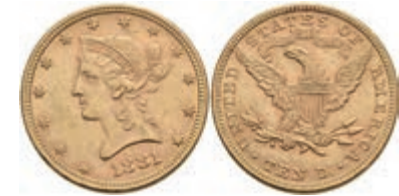
1041 10 Dollars, Gold, 1881, Liberty Head, Philadelphia, Fb. 158, kl. Rf., ss+. 700,—