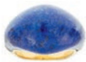
583 Lapislazuli Ring, 750 Gelbgold, 10,95g, RW EU 50. (Abbildungen siehe Onlinekatalog) 180,—