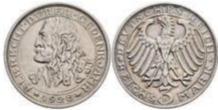
906 3 Reichsmark, 1928, Dürer, Avers leicht berieben, kl. Rf. f. vz. J. 332. 200,—