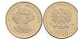
995 2000 Zloty, Gold, 1979, Nikolaus Kopernikus, Fb. 122, verschweißt, PP. Auflage nur 5000 Stück! 360,—