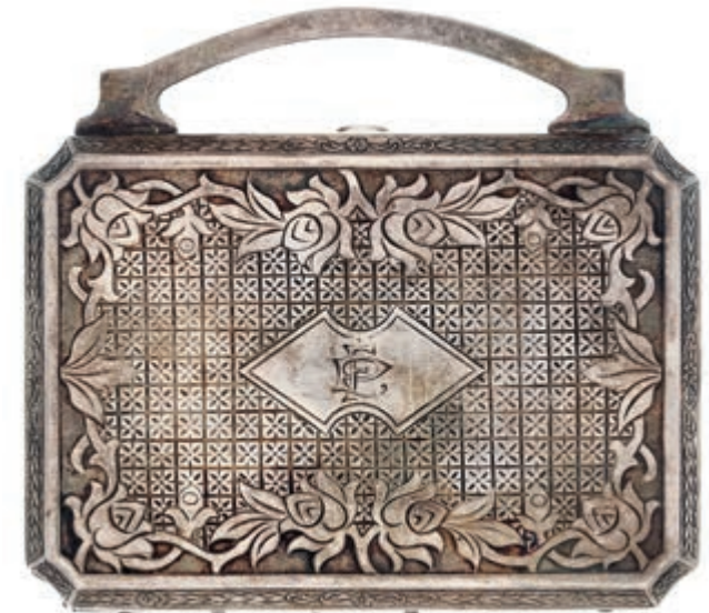
858 Dekoratives Schminketui in Form einer Tasche mit floralem Dekor und den Initialen "FP" und "MH". Wohl versilbert, ungestempelt, Silbertest positiv. Innen Aufkleber "1 Schminkkästchen in altem Silber mit den Initialen Francis Pohl Maus Hamer F. 30.000,-", nicht entfernt. Innen bez. "ELGIN CLOCK E.A.M." Spiegel zersprungen. Innenbereich teils verbogen. Starke Gebrauchs- und Altersspuren. Ca. 6,2/7,3 x 8,7 cm. Ca. 142,13 gr. (Abbildung auf 89% verkleinert) 40,—