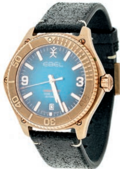
794 Ebel Discovery Gent Bronze Herren Armbanduhr. Auf 250 Stück limitiertes Sondermodell, Ref.-Nr.: 24174485. 41mm, Bronze, Saphirglas, Sichtboden, Eta Automatik Uhrwerk. Drehbare Lünette, Datumsanzeige, blaues Ziffernblatt, Zei-

ger und Indizes fluoreszierend. Sehr guter Zustand mit leichten Gebrauchsspuren. Original Ebel Kalbslederarmband in schwarz mit Dornschnelle. Funktionsfähig, mit Original Box, Zertifikaten, Bedienungsanleitung und Kaufbeleg. 1600,—