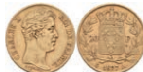
946 20 Francs, Gold, 1827, Charles X., A (Paris), Fb. 549, kl. Kratzer, ss. 300,—