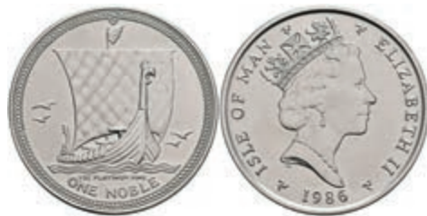
956 Isle of Man, 1 Noble, Platin, 1986, Wikingerschiff, Fb. B3, vz-st. 800,—