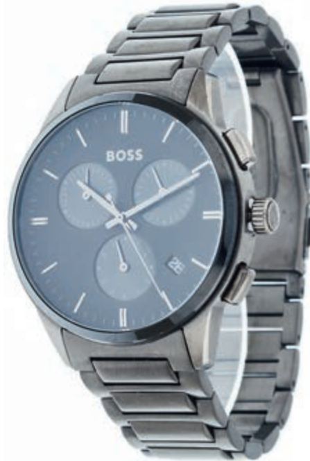
799 Herrenarmbanduhr Hugo Boss Chronograph 1513929, grau, Gehäusedurchmesser 43 mm, Mineralglas, analoges Zifferblatt schwarz, Datum und Stoppfunktion, 5 bar Wasserdichtigkeit, Gliederarmband Edelstahl grau mit Fallschließe. Neuwertig, leichte Tragespur, in OVP. (Abbildungen siehe Onlinekatalog) 200,—