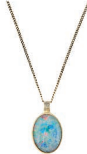
663 Anhänger mit Opal-Cabochon und Kette, 925 Silber, Maße des Opals 18,2x 13,2mm, 5,9g, mit Meisterpunze. 40,—