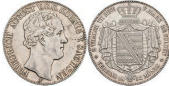
869 Doppeltaler, 1854, Friedrich August II., AKS 94, J. 78, wz. Rf., ss-vz. 300,—