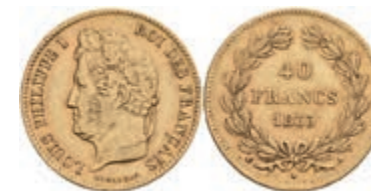
947 40 Francs, Gold, 1833, Louis Philippe I., A (Paris), Fb. 557, ss. 500,—