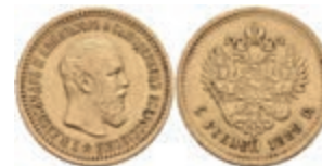
1006 5 Rubel, Gold, 1889, Alexander III., Fb. 169, wz. Rf., ss-vz. 400,—