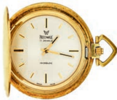
782 Taschenuhr "Precimax" mit Sprungdeckel um 1975, Gold-Double, Kronenaufzug, Maße: Durchmesser: 42,5mm Dicke 8,1mm. 17 Steine, sehr gute Erhaltung. (Abbildungen siehe Onlinekatalog) 80,—