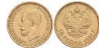
1009 10 Rubel, Gold, 1898, Nikolaus II., St. Petersburg, Fb. 179, kl. Rf., ss. 400,—