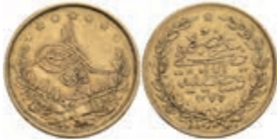
1032 100 Kurush, Gold, AH 1277/14, Abdülaziz, Fb. 127, kl. Rf., ss. 300,—