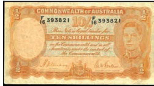
1262 Australien, Commonwealth of Australia, 10 Schillings= 1/2 Pound o. D. (1939), P- 25a, Erh. III. (Abbildung auf 50% verkleinert) 30,—