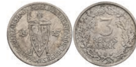
901 3 Reichsmark, 1925, E, Rheinlande, Randfehler, ss-vz. J. 321. 20,—