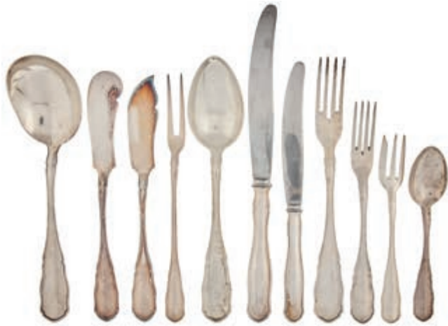
854 Zeitloses Silberbesteck für zwölf Personen der Firma Bruckmann & Söhne, Heilbronn, bestehend aus: zwölf Menügabeln, zwölf Menüöffeln, zwölf Menümesser, Klinge bez. "NICHT ROSTEND", zwölf Vorspeisegabeln, zwölf Vorspeisemesser, Klinge bez. "NICHT ROSTEND", zwölf Kuchengabeln, elf Kaffeelöffeln, einem Vorlegelöffel, einer Tranchiergabel, einem Buttermesser und einem Käsemesser. Modell: Sächsisches Hofmuster. Modellnr. 5701. 1. Hälfte 20. Jh. 800er Silber, gestempelt. Deutschland, gestempelt. Bruckmann, gestempelt. Gebrauchs- und Altersspuren. Vorspeise- und Menümesser ca. 1640,0 gr. Zusammen ca. 4580,0 gr. (Abbildung auf 48% verkleinert) 1600,—