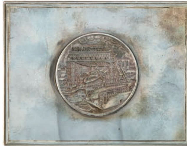
857 Dose, 925 Silber, 13x 10x 2,9 cm, 380g, gepunzt H. J. Wilm Hamburg, Deckel mit Relief "Stülkenwerft", stark angelaufen. (Abbildungen siehe Onlinekatalog) (Abbildung auf 67% verkleinert) 200,—

Goldmünzen ab 1800 sowie Goldbarren sind als Anlagegold ggf. umsatzsteuerfrei (auch für das Aufgeld), soweit der Zuschlagpreis inkl. Aufgeld und Losgebühr nicht höher als der Goldwert + 80% ist.