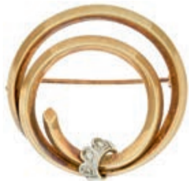
649 Spiral Brosche mit Brillantendiadem, 585 GG, Brillanten zus. ca.0,06ct, Durchmesser der Brosche ca. 3,6cm, 7,2g, hervorragende Erhaltung. (Abbildungen siehe Onlinekatalog) 450,—

Goldmünzen ab 1800 sowie Goldbarren sind als Anlagegold ggf. umsatzsteuerfrei (auch für das Aufgeld), soweit der Zuschlagpreis inkl. Aufgeld und Losgebühr nicht höher als der Goldwert + 80% ist.