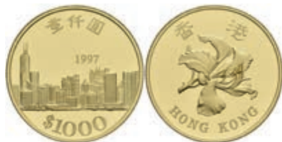
938 Hong Kong, 1000 Dollars, Gold, 1997, Stadtansicht, in Kapsel, PP. 600,—