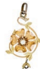
611 Blumenanhänger mit kl. Brillant ca. 0,07ct, 585 Gelb- und Roségold gestempelt zus. E. K, 31,4x 20mm, ca. 3,1g. 120,—