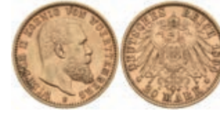
900 20 Mark, 1894, Wilhelm II., kl. Rf., ss-vz. J. 296. 350,—