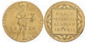
987 Dukat, 1928, Wilhelmina, Utrecht, Fb. 352, Randfehler, vz. 150,—