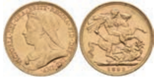
953 Sovereign, 1893, Victoria, Fb. 396, kl. Rf. und Kratzer, vz. 300,—