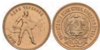
1021 10 Rubel, Gold, 1978, Fb. 163, st. 340,—