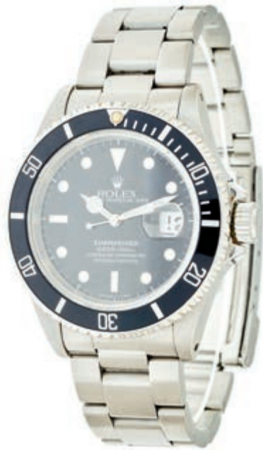
812 Rolex Oyster Perpetual Date Submariner Herren Chronometer. Ca. 40mm, Edelstahl Oystersteel, schwarze, drehbare Lünette aus Keramik, Automatik, Ankerwerk, Kaliber-No.: 3135, 31 Steine. Zentralsekunde, Datumsanzeige, Ref.-Nr.: 16610X, um 1991. Original Rolex Armband mit Faltschließe, Karton, Box, Garantie und Bedienungsanleitung. Sehr guter Zustand, nur selten getragen. Voll funktionsfähig. 7000,—