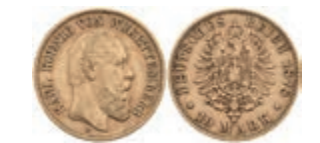
899 10 Mark, 1878, Karl, ss. J. 292. 200,—