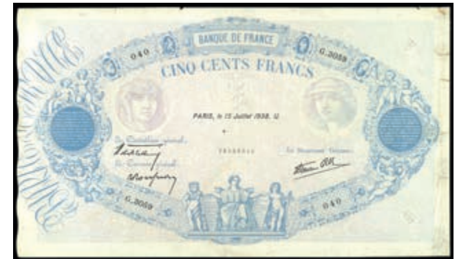
1271 Europa, Frankreich, 13 St.: I. WK, 2x 50 Centimes (1917) P. M1: 10 Francs (1947) P. M7; 10 Francs 17.8.1939 (P. 84); 500 Francs 15. 7. 1938 (P. 88c, Einrisse Erh. IV); 2x 500 Francs 6.2.1941 (P.95b); 3x 20 Francs 1943-45 (P. 100a, b); 20 Francs 1997 (P. 151i); Alliierte Militär Behörde, 2 und 5 Francs 1944 (P. 114, 115). Erh. I-IV. (Abbildung auf 35% verkleinert) 100,—