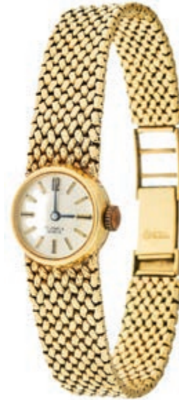
829 Damenarmbanduhr mit Milanaiskettenband. 1960er Jahre. Uhrengehäuse und Uhrenband 585er GG gestempelt. Dm. ca. 14 mm. L. ca. 18,0 cm. Ca. 41,9 gr. 950,—