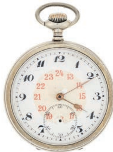
786 Zwei-Deckel-Herrentaschenuhr mit separater Sekunde. Ca. 1917. Staubdeckel bez. "Alb. Fecht 1917". Modellnr. 1771643. Dm. ca. 4,2/4,9 cm. Uhrglas leicht besch. Ziffernblatt besch. Sekundenzeiger fehlend. Gebrauchs- und Altersspuren. Ca. 92,19 gr. Uhrwerk nicht geprüft. 50,—