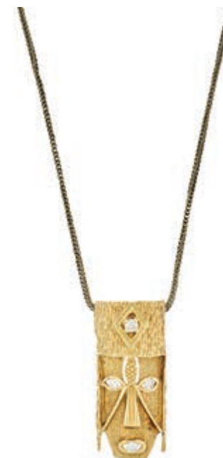
612 Brillant Anhänger "Afrika" mit Kette, Anhänger 18K Gelbgold, 30x13,2mm mit vier Brillanten zus. 0,13ct, Kette 585 Gelbgold, Gesamtgewicht 7,7g. (Abbildungen siehe Onlinekatalog) 550,—