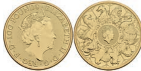
958 100 Pounds, Gold, 2021, Serie "The Queens Beasts", ohne Kapsel, st. 1400,—