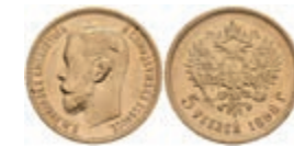
1010 5 Rubel, Gold, 1898, Nikolaus II., Fb. 180, kl. Rf., kl. Kr., vz. 200,—