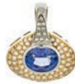
561 Tansanit Brillanten Anhänger, 750 Gelb - und Weißgold, Tansanit in oval-Schliff ca. 3,5ct, Brillanten zus. ca. 0,49ct, 23,5x 20mm, 8,05g. (Abbildungen siehe Onlinekatalog) 650,—