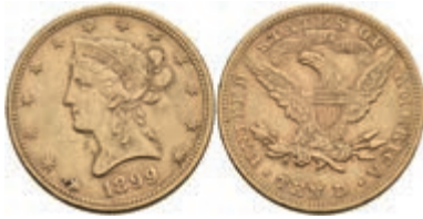
1046 10 Dollars, Gold, 1899, Liberty Head, Philadelphia, Fb. 158, ss. 650,—