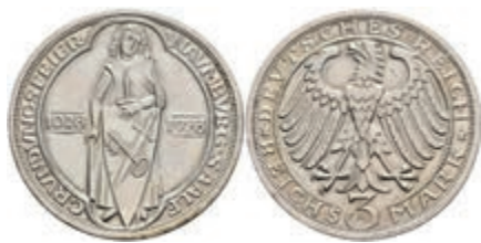
907 3 Reichsmark, 1928, Naumburg, kl. Rf., vz. J. 333. 80,—