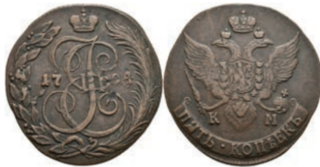
1001 5 Kopeken, 1794, Katharina II., Suzun, Bitkin 811, ss. 30,—