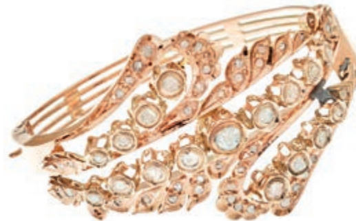
542 Diamanten Armreif Belle Époque, um 9K RG, Innendurchmesser 5,9x 4,9, 25,6g. Diamanten in Rosenschliff von zus. ca. 4,8 ct, kl. Reparaturstelle, 1 Stein fehlt, sonst sehr gute Erhaltung! (Abbildungen siehe Onlinekatalog) 1200,—