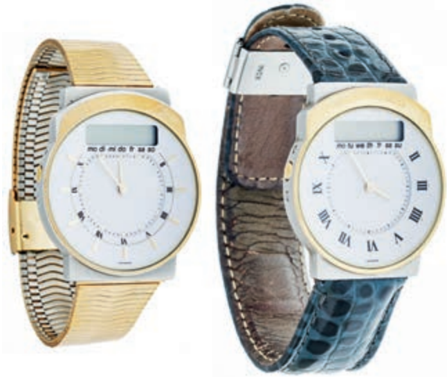
804 Maurice Lacroix Calypso Herren Armbanduhr. Ca. 34mm, Stahl mit vergoldeten Details, Quarz, Ref.-Nr.: 95885. Datumsanzeige, Zeiger fluoreszierend, weißes Ziffernblatt im feinen Wabendesign. Guter Zustand mit leichten Gebrauchsspuren. Original Maurice Lacroix Armband mit Druckverschluss. 225,—