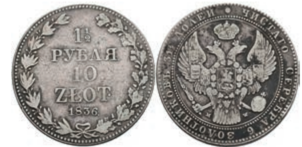
994 1 1/2 Rubel (10 Zloty), 1836, Nikolaus I., Warschau, Bitkin 1132, kl. Rf., Hsp., s-ss. 100,—