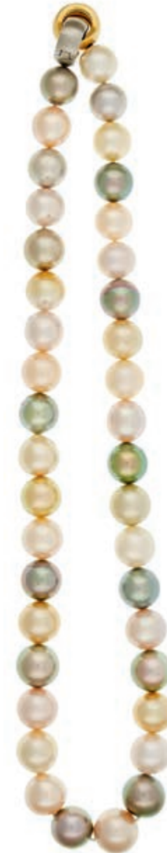
705 Hochwertige Tahiti-Zuchtperlen Collier, multi colour, mit 39 Südsee und Tahiti Zuchtperlen, naturfarbig, Dm Perlen ca. 12,8-11,1 mm, Schließe 0,925 Silber rhodiniert und vergoldet, 94,25g. Mit Original-Zertifikat von Juwelier "Uttermann" Aachen und zus. Kopie des Kaufbeleges von 18.12. 2009. Sehr gute Erhaltung. (Abbildungen siehe Onlinekatalog) (Abbildung auf 68% verkleinert) 4500,—

Bitte geben Sie realistische Gebote ab! Gebote deutlich unter Metallwert sind praktisch chancenlos und für alle Seiten Zeitverschwendung!