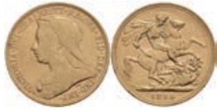
954 Sovereign, 1896, Victoria, Fb. 396, kl. Rf., ss. 330,—