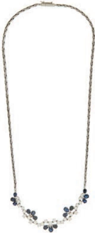
560 Farbstein-Brillanten Collier, 750 Weißgold, 15 Saphire in Tropfen- Schliff zus. ca. 4,35ct, 25 Brillanten zus. ca. 1,25ct TW-VS, Länge 44,5cm, 21,7g. (Abbildungen siehe Onlinekatalog) (Abbildung auf ca 60% verkleinert) 1200,—