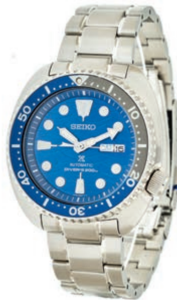
813 Seiko Prospex "Save The Ocean" Herren Armbanduhren. Special Edition, Ca. 45mm, Edelstahl, Saphirglas, Automatik. Daydate Anzeige, blaues Zifferblatt in Wellenoptik, Zeiger und Indizes fluoreszierend, Lünette in grau/blau. Kalibernummer 4R36, Referenz-Nummer: 948451. Original Seiko Edelstahl-Armband mit Faltschließe. Sehr guter Zustand in Original Box, mit Garantie und Anleitungs-Booklet. 270,—