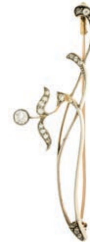
545 Jugendstil Brillanten Brosche, 585 Gelbgold (keine Stempelung), 5,85g, 19 altschliff Brillanten geschätzt ca. 0,6ct, Reparaturstelle. 500,—