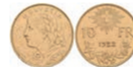
1029 10 Franken, Gold, 1922, Fb. 503, ss-vz. 150,—

Alle Einzellose und Zertifikate/Gutachten sind unter www.rhenumis.de farbig abgebildet! Dort sind auch 695 weitere Lose zu finden, die nicht im gedruckten Katalog, sondern nur im Internet zu finden sind!