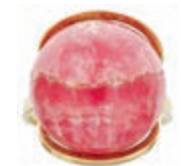
588 Ring Rhodochrosit, 585 Gelbgold, 9,9g, RW EU 56. 200,—