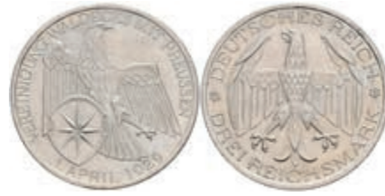
908 3 Reichsmark, 1929, Waldeck, kl. Kr., kl. Rf., vz. J. 337 80,—