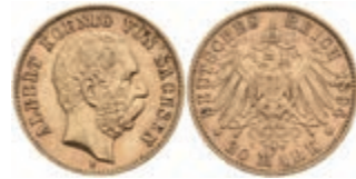
896 20 Mark, 1894, Albert, kl. Rf., ss. J. 264. 380,—