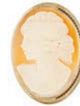
544 Brosche/Anhänger mit ovaler, handgeschnitzten Muschelgemme mit Da- menbüste n. I, nach 1950, 333 Goldfassung, 4,88g, 27,5x 19,8mm, sehr guter Erhaltungszustand. 120,—