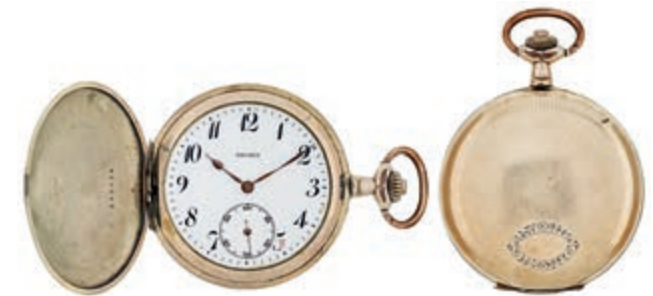
789 Taschenuhr "Drusus" Savonette 1915-1930, Bildmarke: Stier (G. Rau Pforzheim), Deutschland, Garantie 20 Jahre - vergoldet, Glas fehlt, Scharnier-Staubdeckel, Kronenaufzug mit Drucker, flaches Emailzifferblatt mit vertiefter Blattmitte, kleine Sekunde und arab. Zahlen leicht beschädigt, Dm 51,6 mm, 85,4g. Model Nr. 232224, funktionstüchtig. (Abbildungen siehe Onlinekatalog) (Abbildung auf 57% verkleinert) 50,—