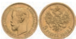
1018 5 Rubel, Gold, 1902, Nikolaus II., Fb. 180, kl. Rf., vz. 200,—