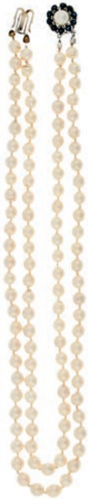
698 Doppelreihige Perlenkette mit Saphirschließe, Akoya Zuchtperlen einzeln geknotet, ca. 7,4mm, L= 24cm, ovale Schließe aus WG 14K mit Zuchtperle und 10 kl. Saphiren, 2. Hälfte des 20. Jh., leichte Tragespuren. 350,—