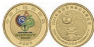
939 100 Yuan, Gold, 2005, FIFA World Cup, 1/4 Oz, Fb. 265, PP. 350,—