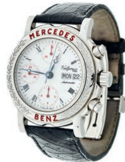
807 Mercedes-Benz Collection Classic Valjoux 7750 Chronograph Herren Armbanduhr. Ca. 39mm, Edelstahl, Boden aus Saphirglas, gewölbtes Saphirglas auf Oberseite mit feiner Metallisation - durch Anhauchen wird der Mercedes-Stern

Bitte geben Sie realistische Gebote ab! Gebote deutlich unter Metallwert sind praktisch chancenlos und für alle Seiten Zeitverschwendung!