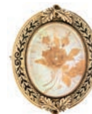
546 Medaillon Brosche, Mitte des 19 Jh., 8K Gelbgold, 5,9g, 3,1x 2,5cm, Her- barium auf Perlmutterlage, Medaillonrand mit schwarzes Emaildekoration, spätere Broschierung. (Abbildungen siehe Onlinekatalog) 130,—