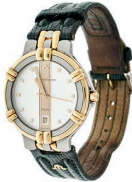
805 Maurice Lacroix Calypso Herren Armbanduhr. Ca. 35mm, Stahl, Ref.-Nr.: 95346, Quarz. Datumsanzeige, weißes Ziffernblatt mit vergoldeten Details, Zeiger fluoreszierend. Guter Zustand, leichte Kratzer rückseitig. Originales Maurice Lacroix Armband in Eidechsenoptik mit Dornschnelle. 270,—