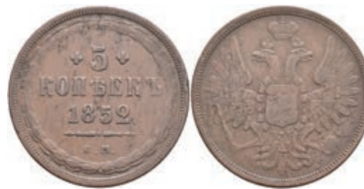
1004 5 Kopeken 1852, Ekaterinburg. Nikolaus I. 1826-1855. Bitkin 581, ss. 20,—