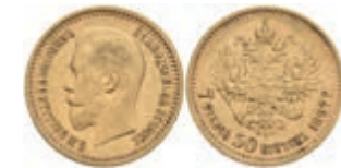
1007 7 1/2 Rubel, Gold, 1897, Nikolaus II., Fb. 178, kl. Rf., ss. 500,—