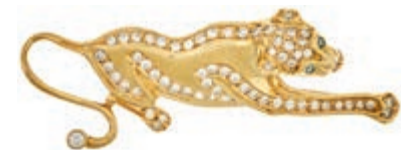
568 Diamant Smaragd Brosche "Puma" im Stil von Cartier, 750 Gelbgold, 5,5x 2cm, 14,9g, Brillanten zus. ca. 1,13 ct., zwei Smaragden zus. ca. 0,04Kt., hochwertige Goldschmiedearbeit. 1600,—