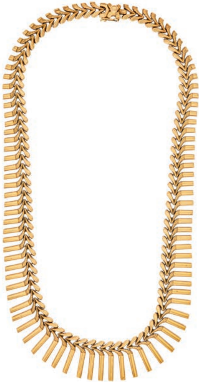
625 Extravagantes Collier im Verlauf, 750 Gelbgold, 42g, Steckschließe mit Sicherheitsachter, Länge 44,5cm, Handarbeit. (Abbildungen siehe Onlinekatalog) (Abbildung auf 85% verkleinert) 2000,—