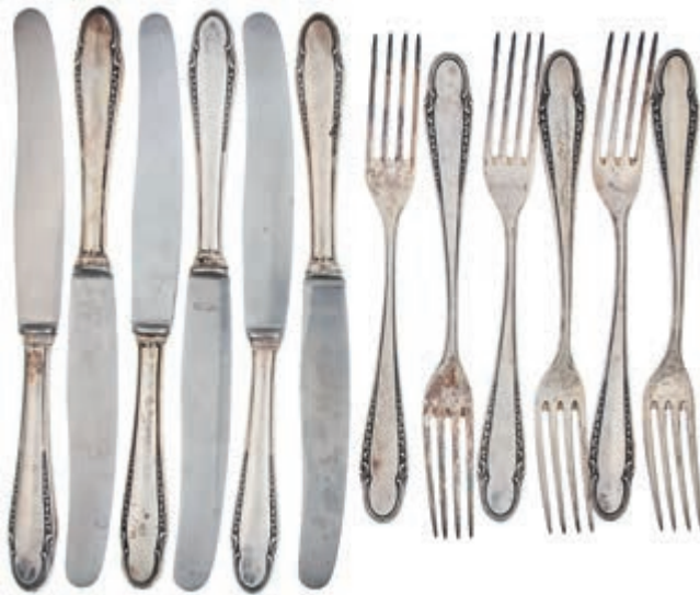
855 Set bestehend aus sechs Speisegabeln und sechs Speisemessern mit dezentem floralen Dekor am Stiel bzw. am Griff. Deutschland, gestempelt. 800er Silber, gestempelt. Nach 1888, wohl 1. Hälfte 20. Jh. Hohmann & Katz AG, Pforzheim, gestempelt. Messerklingen aus rostfreiem Edelstahl. Gebrauchs- und Al-

tersspuren. L. der Gabeln ca. 21,5 cm. Ca. 370,0 gr. L. der Messer ca. 26,0 cm. Ca. 532,0 gr. Zusammen ca. 902,0 gr. (Abbildung auf 68% verkleinert) 250,—