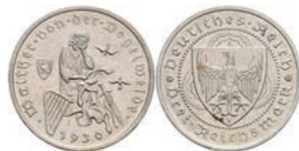
911 3 Reichsmark, 1930, A, Vogelweide, kl. Kr., kl. Rf., vz. J. 344. 30,—