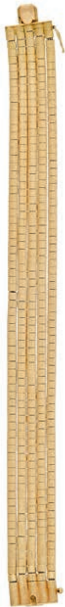
642 Gold-Armband, Italien, 20. Jh., 4- reihig, 750 Gelbgold, punziert, L. 17cm, 25, 25g, Tragespuren. (Abbildung auf 93% verkleinert) 950,—