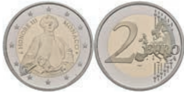
984 2 Euro, 2020, 300. Geburtstag von Fürst Honoré III., mit Zertifikat in Ausgabeschatulle, PP. 350,—