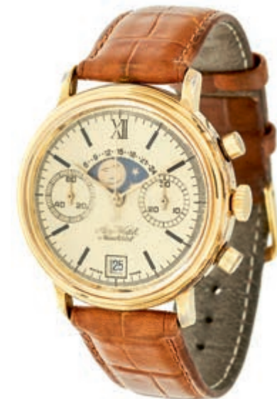
790 Aero Neuchatel Doublé Herren Chronograph. Ca 37mm, Edelstahl, Automatik, Mondphase, kleine Sekunde, Datumsanzeige. Goldenes Ziffernblatt, goldene Zeiger, Lünette verblasst, Ref.-Nr.: 34 300. Braunes Lederarmband mit Dornschnelle. Funktionsfähig 350,—

Alle Einzellose und Zertifikate/Gutachten sind unter www.rhenumis.de farbig abgebildet! Dort sind auch 695 weitere Lose zu finden, die nicht im gedruckten Katalog, sondern nur im Internet zu finden sind!