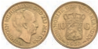
988 10 Gulden, Gold, 1932, Wilhelmina, Fb. 351, Druckstelle, vz+ 250,—