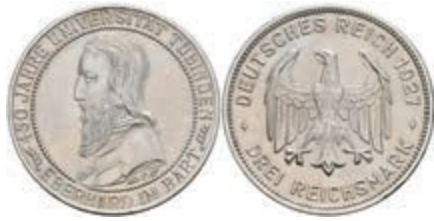
904 3 Reichsmark, 1927, Tübingen, kl. Rf., berieben, vz. J. 328. 180,—