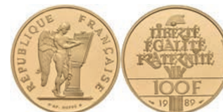
949 100 Francs, Gold, 1889, mit Zertifikat und Original-Etui, Auflage 20.000 Ex., PP. 750,—