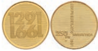
1030 250 Franken, Gold, 1991, 700 Jahre Schweizerische Eidgenossenschaft, 900er Gold, 7,2g fein, Fb. 515, vz-st. 300,—