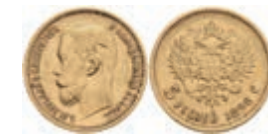
1011 5 Rubel, Gold, 1898, Nikolaus II., Fb. 180, kl. Rf., ss-vz. 200,—