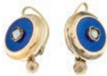
538 Feine Gold-Email Ohringe mit kl. grauen Natur-Perlen in Vierpassfassung, wohl Deutschland vor 1900, 333 GG signiert, zus. ca. 3g, Länge der Ohringe (inkl. Brisur) 2cm, ein Ohring mit Reparaturstelle, sonst sehr guter Zustand. (Abbildungen siehe Onlinekatalog) 400,—