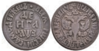
999 Denga 1707 (Kyrillisch), Naberezhny/Moskau, Peter I. 1682-1725. Bitkin 2714, ss. 80,—