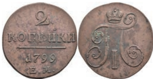
1002 2 Kopeken 1799, Ekaterinburg, Paul I. (1796-1801). Bitkin 115, ss. 30,—