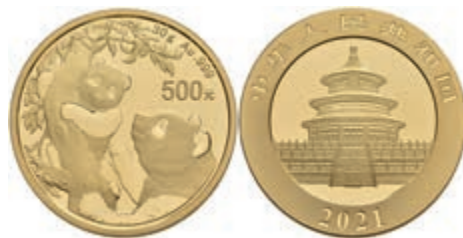
942 500 Yuan, Gold, Panda, leicht berührt, ohne Kapsel, st. 1400,—