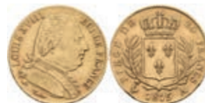
944 20 Francs, Gold, 1815, Louis XVIII., A (Paris), Fb. 525, Gad. 238, kl. Rf., ss. 250,—