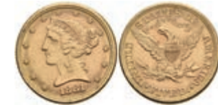
1043 5 Dollars, Gold, 1881, Philadelphia, Fb. 143, vz. 350,—