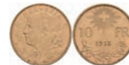
1028 10 Franken, Gold, 1913, Fb. 503, ss-vz. 120,—