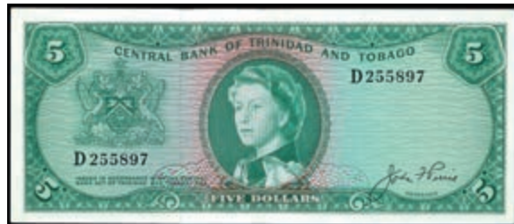
1258 Trinidad & Tobago, Central Bank of Trinidad & Tobago, 5 Dollars 1964, P-27a, Erh. II. (Abbildung auf 50% verkleinert) 65,—