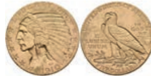
1051 5 Dollars, Gold, 1910, Philadelphia, Indian Head, Fb. 148, ss-vz. 350,—