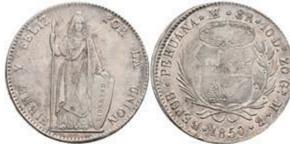
991 8 Reales, 1850, Lima, MB, Roped edge, KM 142.10, kl. Rf., vz. 360,—