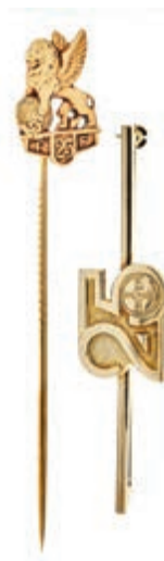
652 Bayer AG, zwei Ehrennadel "25", 585 Gelbgold, 4,35g und 5,47g, je ca. 20x13mm, eins wohl um 1961 im Originalletui. 300,—