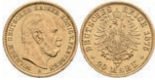
889 20 Mark, 1875, A, Wilhelm I., kl. Rf., ss. J. 246. 300,—