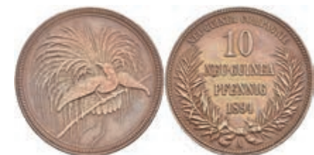
915 Deutsch-Neuguinea, 10 Pfennig 1894 A., N 703, vz. 140,—