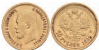
1016 10 Rubel, Gold, 1899, Nikolaus II., St. Petersburg, Fb. 179, kl. Rf., ss. 450,—