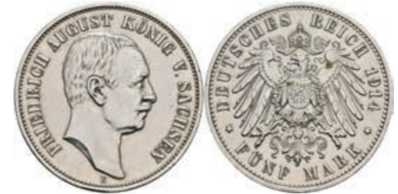
875 5 Mark, 1914, Friedrich August III., leicht berieben, kl. Rf., vz-st. J. 136 50,—