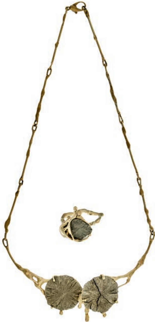
614 Extravaganter Set aus Collier und Ring mit Pyritsonne, 585 Gold, gestempelt; Maße des Colliers (17,5x 12,5cm, 31,95g), Ring (Innen Dm= 19,4x20,5, 11,63g) Handarbeit, unbekannt. (Abbildung auf 95% verkleinert) 1100,—