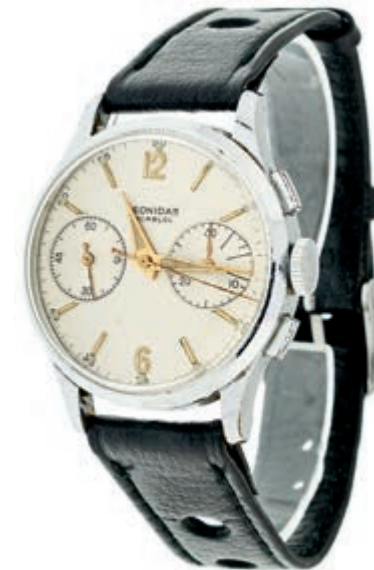
801 Leonidas Chronograph incabloc, Mitte des 20. Jh., Schweiz. Handaufzug, arab. Ziffernblatt mit Stahlgehäuse, Stoppfunktion über Wippe, schwarzes Lederarmband, Dm 35x37,5mm, gelegentlich getragen, funktionsfähig. 450,—

Bitte geben Sie realistische Gebote ab! Gebote deutlich unter Metallwert sind praktisch chancenlos und für alle Seiten Zeitverschwendung!