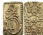
961 2 Bu (Ni Bu), o.J. (19. Jh.), Gold, ss. 80,—