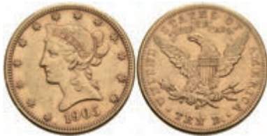
1049 10 Dollars, Gold, 1905, Liberty Head, San Francisco, Fb. 160, ss. 650,—