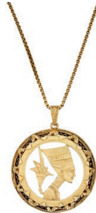
630 Medaillon mit Kette, wohl Ägypten, 750 Gelbgold, Dm 38,3mm, Gesamtgewicht 22,85g, Pharaos-Büste n. r. mit Lotusblume in rundem durchbrochen gearbeiteten Medaillon, Goldschmiede-Handarbeit. (Abbildungen siehe Onlinekatalog) 1000,—

Alle Einzellose und Zertifikate/Gutachten sind unter www.rhenumis.de farbig abgebildet!