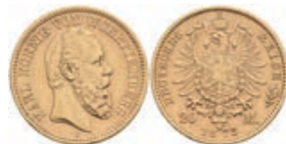
898 20 Mark, 1873, Karl, wz. Kr., ss. J. 290. 350,—