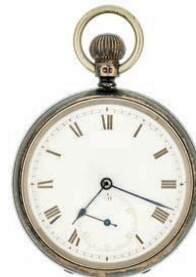
780 Schwere Taschenuhr, ca. 1914. 925er Silber, punziert, schweizer Uhrwerk, kleine Sekunde, Handaufzug. emailiertes Ziffernblatt, römische Ziffern, blaue Zeiger. Innendeckel aus Silber, punziert, funktionstüchtig. 118,54g, ca. 50,8mm. 100,—