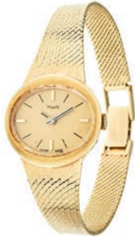
827 Damenuhrarmband "Orafa" Schweiz, um 1970, 14K/585 Gelbgold, Goldfärbiges Zifferblatt, Stundenbalken, Rückdeckel gestempelt Gew. 33,45 g, Service wird empfohlen. (Abbildungen siehe Onlinekatalog) 600,—