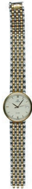
840 Unisex bicolored Armbanduhr Omega de Ville mit Datumsanzeige und Gliederarmband, Nr. 54959814. Durchmesser ca. 3,3 cm. Länge ca. 19,5 cm. Schließe defekt. Uhrwerk nicht geprüft. (alter Ausruf 750) 600,—

Goldmünzen ab 1800 sowie Goldbarren sind als Anlagegold ggf. umsatzsteuerfrei (auch für das Aufgeld), soweit der Zuschlagpreis inkl. Aufgeld und Losgebühr nicht höher als der Goldwert + 80% ist.