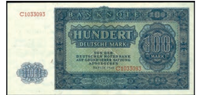
1272 Lot 15 Banknoten der Deutsche Notenbank 1948-1964 und 1964-1975, SBZ und DDR Druck ; ohne Plattennummer, 50 Pfennig, 1, 2 und 100 Deutsche Mark 1948 (Ro. 339b, 340b, 341b); mit Plattennummer 5, 10, 20, 50 Deutsche Mark 1948 (Ro 342a, 343, 344, 345); 5 und 50 Deutsche Mark 1955 (349a, 352a); 5, 10 und 100 Mark 1964 (Ro. 354a, 355b, 358); 20 Mark 1975 (R. 362); MDN 5 Mark 22.6.1968. Erh. I-III. (Abbildungen siehe Onlinekatalog) (Abbildung auf 48% verkleinert) 90,—