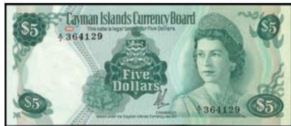
1260 Cayman-Inseln, Cayman Islands Currency Board, 1 und 5 Dollars, 1971, P- 1b und 2a, unc. Erh. I- und I. (Abbildungen siehe Onlinekatalog) (Abbildung auf 50% verkleinert) 80,—