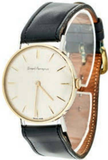
791 Armbanduhr "Girard Perregaux" Mitte des 20. Jh., Schweiz. Bicolor, Lederarmband, Handaufzug, Gehäusenummer: 75360201, Glas etw. zerkratzt, wenig getragen, funktionsfähig. 300,—