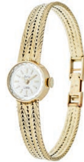
831 Damen-Armbanduhr "Arly", Schweiz, um 1950. 750er GG, Handaufzug, Zifferblatt mit Strichindex, Kal: 599, flaches Goldarmband geflochten mit Klappschließe, punziert auch Luchs1 (amtliche Punze Schweiz für ausländisches Uhrgehäuse), Dm 18,3mm, L = 17,0 cm, total 27,15 g, funktionsfähig, Service wird empfohlen. (Abbildungen siehe Onlinekatalog) 500,—