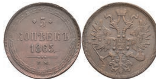
1005 5 Kopeken 1865, Ekaterinburg, Alexander II. 1855-1881, Rf., Schröttingsfehler, Bitkin 313, vz+-. 100,—