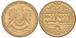
1031 1 Pound, Gold, 1950, Fb. 11, berieben, vz. 250,—