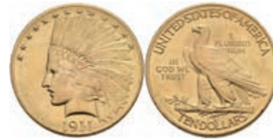
1052 10 Dollars, Gold, 1911, Indian Head, Philadelphia, Fb. 166, Kratzer/berieben, ss. 650,—