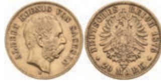
895 20 Mark, 1876, Albert, kl. Rf., ss. J. 262. 380,—