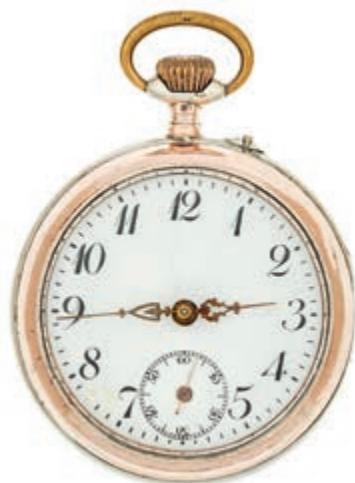
778 Konvolut Taschenuhren enthält 6 verschiedenen Modelle: mechanische "Ruhla" GDR; UDSSR "Molnia", "Achievement" - Schweiz; "Junghans" Deutschland Modell 34/ 11596- Gehäuse Nr. 0495193, "Vigilant" - Frankreich und Remontoir Cylindre 10 Rubis, 800 Silber mit Galone von Eugen Pocher-Pforzheim. (Abbildungen siehe Onlinekatalog) 100,—