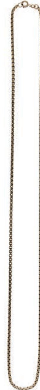
633 Große Venezianerhalskette. 20. Jh. 333er GG, gestempelt. L. ca. 78,0 cm. Ca. 39,74 gr (Abbildung auf 86% verkleinert) 600,—

Goldmünzen ab 1800 sowie Goldbarren sind als Anlagegold ggf. umsatzsteuerfrei (auch für das Aufgeld), soweit der Zuschlagpreis inkl. Aufgeld und Losgebühr nicht höher als der Goldwert + 80% ist.