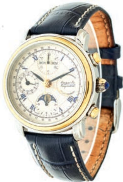
792 Auguste Reymond Herren Chronograph. Ca. 38mm, Edelstahl, Sichtboden, Automatik. Datumsanzeige inklusive Monat, kleine Sekunde, Mondphase. Weißes Ziffernblatt, goldene Indizes, römische Ziffern in dunkelblau gehalten. Dunkelblaues Hirschleder-Armband mit Dornschnelle. In Original Box mit Papieren und Kaufbeleg. Sehr guter Zustand, voll funktionsfähig. 1500,—