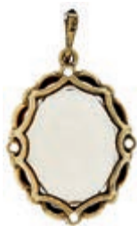
609 Anhänger mit oval fac. Rauchquarz von ca. 24x19 mm, 333 GG, L: ca. 3,3 cm, 7,65g, 1950er Jahre, leichte Tragespuren. 150,—