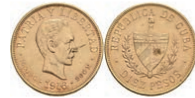
962 10 Pesos, Gold, 1916, Fb. 3, kl. Rf., ss. 650,—