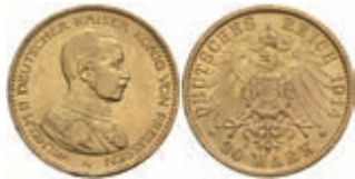
892 20 Mark, 1914, Wilhelm II. in Gardeuniform, kl. Rf., kl. Kr., vz. J. 253 300,—