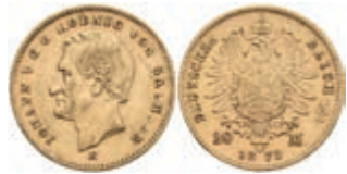
893 20 Mark, 1872, Johann, kl. Rf., ss. J. 258. 300,—