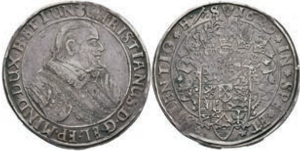
865 Taler, 1629, Christian, Bischof von Minden. Dav. 6475, Welter 924, kleine Schröttingsfehler, ss. 150,—