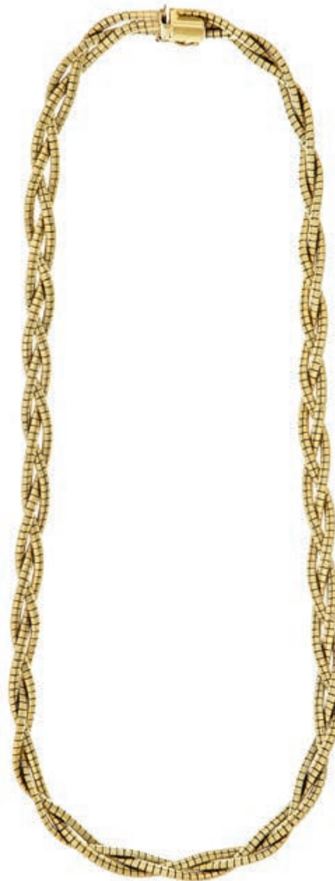
623 Collier, 585 Gelbgold, Italien, 3- Fach geflochtene Kettenstruktur, Länge 42cm, 32,85g. (Abbildungen siehe Onlinekatalog) (Abbildung auf 93% verkleinert) 1100,—

Bitte geben Sie realistische Gebote ab! Gebote deutlich unter Metallwert sind praktisch chancenlos und für alle Seiten Zeitverschwendung!