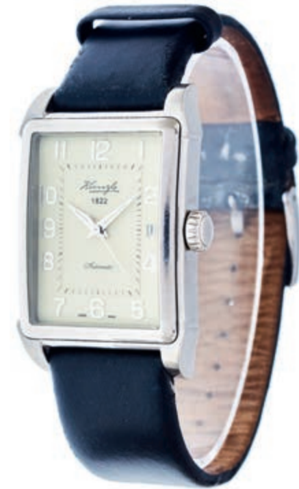
816 Herrenarmbanduhr, Kienzle 1822 Automatic. Modellnr. V83091142360. Ca. 3,8 x 3,0 cm. Ca. 71,15 gr. Uhrwerk nicht geprüft. 60,—