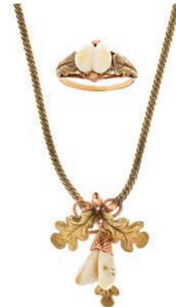
621 Trachtenschmuck Charivari Set, Collier und Ring, 585 Gold zweifarbig, Collier Länge 45cm, RW 57, Steckschließe mit Sicherheitsachter, Gesamtgewicht 19,5g, punziert. . (Abbildungen siehe Onlinekatalog) 750,—