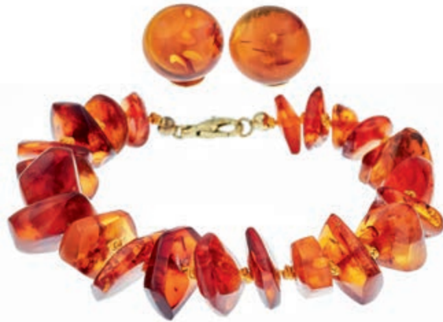
752 Miscellanea Bernstein Set aus paar Ohrclips und Armband L 20 cm, gemarkt, Größe der Steine ca. 13,6cm. Dazu noch Armband mit Zuchtperlen und Markasiten, 835 Silber, Steckschließe L=20cm, 22g. (Abbildungen siehe Onlinekatalog) (Abbildung auf 97% verkleinert) 80,—