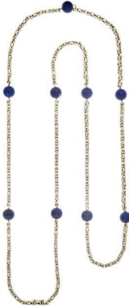
617 Königskette massiv mit neun Lapis Lazuli Kugel Dm ca. 1 cm, 750 WG/14 Karat, Länge 90cm, Gesamtgewicht 88,8g, Kastenschloss mit Sicherheitsacht,