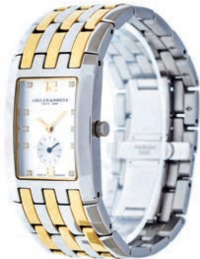
839 Bicolor Damenarmbanduhr. ABELER & SÖHNE SEIT 1898. Modell: Elegance. Referenznummer: AS3138. Modellnr.: 70144. Mit Verlängerungselement. Uhrwerk nicht geprüft. 80,—