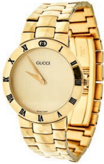
797 Gucci 3300.2 M Armbanduhr. Ca. 33mm, vergoldetes Gehäuse, Saphirglas, Quarz. Goldfarbenes Ziffernblatt, goldene Zeiger. Guter Zustand dieser 90er Jahre Vintage Uhr. Vergoldetes Original Gucci Armband, ca. 83mm Durchmesser. Mit Original Zertifikat. 350,—

21,5 cm, im Originalset, Service wird empfohlen. (Abbildungen siehe Onlinekatalog) 100,—