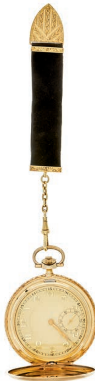
779 Monopol Art déco Savonette Taschenuhr. Anfang 20. Jahrhundert, Gehäuse in 585 Gelbgold, 84,77 Gramm, ca. 52,7mm Durchmesser. Handaufzug, kleine Sekunde, goldenes 24h Ziffernblatt, Deckel punziert inklusive Meisterstempel, Staubdeckel aus Metall. Anhänger aus schwarzem Velours-Leder mit Gold-Applikationen. Außergewöhnlich guter Zustand, funktionstüchtig. (Abbildung auf 76% verkleinert) 1750,—