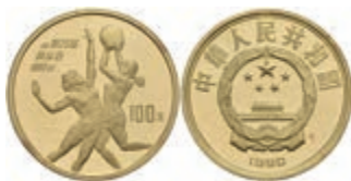
936 100 Yuan, Gold, 1990, Basketball, Fb. 33, kl. Flecken, PP. 500,—