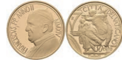
1058 50 Euro, Gold, 2014, Franziskus, 450. Todesjahr von Michelangelo, 13,75g fein, in Ausgabeetui mit Zertifikat und Umverpackung, PP. Auflage nur 2300 Exemplare. 650,—