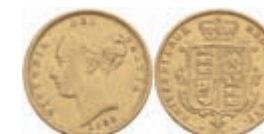
951 1/2 Sovereign, 1880, Victoria, Stempel Nr. 124, Fb. 389f, kl. Rf., ss. 150,—