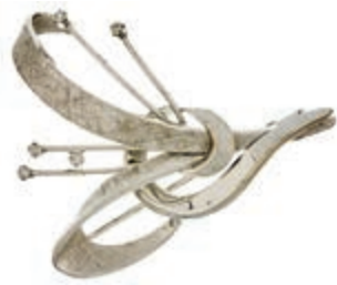
647 Schleifen Brosche mit Strasssteinen, 750 Weißgold, 5,35g, 4x 3,5cm, gestempelt. (Abbildungen siehe Onlinekatalog) 200,—