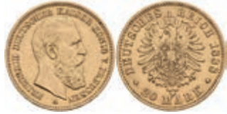
890 20 Mark, 1888, Friedrich III., kl. Randfehler, Schleifspur, ss-vz. J. 248 300,—