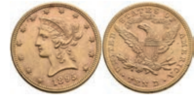
1045 10 Dollars, Gold, 1895, Liberty Head, Philadelphia, Fb. 158, kl. Kr., kl. Rf., vz. 700,—