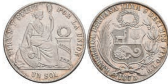
992 Sol, 1873, Lima, LD, KM 196.4, ss+. 90,—