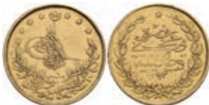
1034 100 Kurush, Gold, AH 1293/1, Murad V., Fb. 133, kl. Rf., ss. 300,—