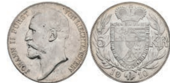
964 5 Kronen, 1904, Johann II., HMZ 2-1376, kl. Rf., kl. Kr., ss-vz. 100,—