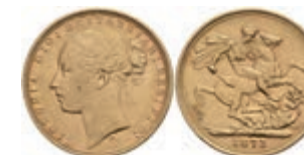
950 Sovereign, 1873, Victoria, Fb. 388, kl. Rf., Avers ss, Revers vz. 330,—