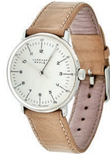
800 Junghans Max Bill Herren Armbanduhr. Ca 38mm, Stahl, Hartplexiglas mit Sprung unten rechts, leichte Kratzer, mechanisches Schweizer Handaufzugswerk. Mattsilbernes Ziffernblatt, Zeiger mit Leuchtmasse. Beiges original Kalbslederarmband, Dornschnelle. In Original-Box mit Papieren. 370,—