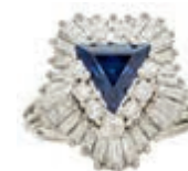
594 Saphir Brillanten Ring, 585 Weißgold, 7,75g. Saphir in Triangel-Schliff von ca. 2,5ct, Brillanten in Rund- und Trapez-Schliff von zus. 2ct /W-Si, RW EU 56. (Abbildungen siehe Onlinekatalog) 1600,—