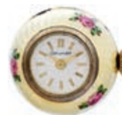
788 Zierliche kugelförmige Taschenuhr als Anhänger. Wohl Mitte 20. Jh. Uhrgehäuse mit gelbem Transluzidemal mit rosa Streurosenmotiv auf guillochierem Grund. Ziffernblatt mit römischen Ziffern. Bez. "Corundo". Durchmesser ca. 1,1/1,9 cm. Ca. 15,95 gr. Uhrwerk nicht geprüft. (alter Ausruf 130) 100,—