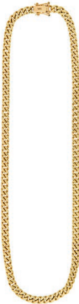
631 Panzerkette, 585 Gelbgold, Gesamtlänge, 42 cm, 41,5g, sehr gute Erhaltung. (Abbildungen siehe Onlinekatalog) (Abbildung auf 88% verkleinert) 1500,—