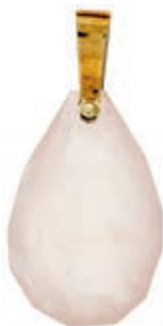
608 Anhänger mit einem tropfenförmig facettierten Rosenquarz, 3,7x2,6cm, 585 GG, 13,41g. 100,—