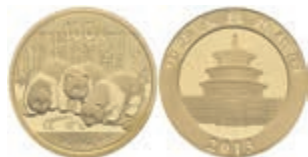
941 100 Yuan, Gold, 2013, Panda, 1/4 Oz, verschweißt, st. 350,—