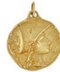
629 Medaillon im Stil von der berühmten griechischen Tetradrachme "Athena mit korinthischem Helm" von Pamphylien, Side, 750 Gelbgold, Dm 26mm, 7,25g. (Abbildungen siehe Onlinekatalog) 300,—